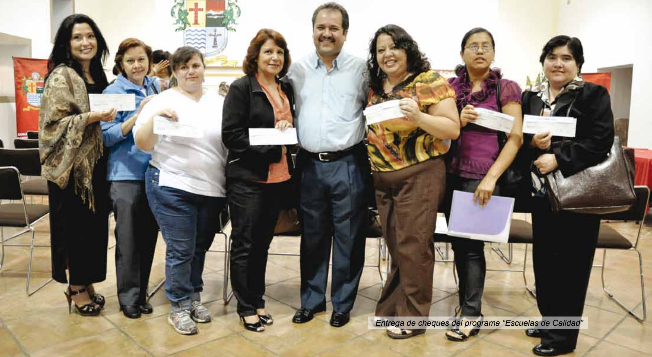
Entrega de cheques del programa "Escuelas de Calidad"