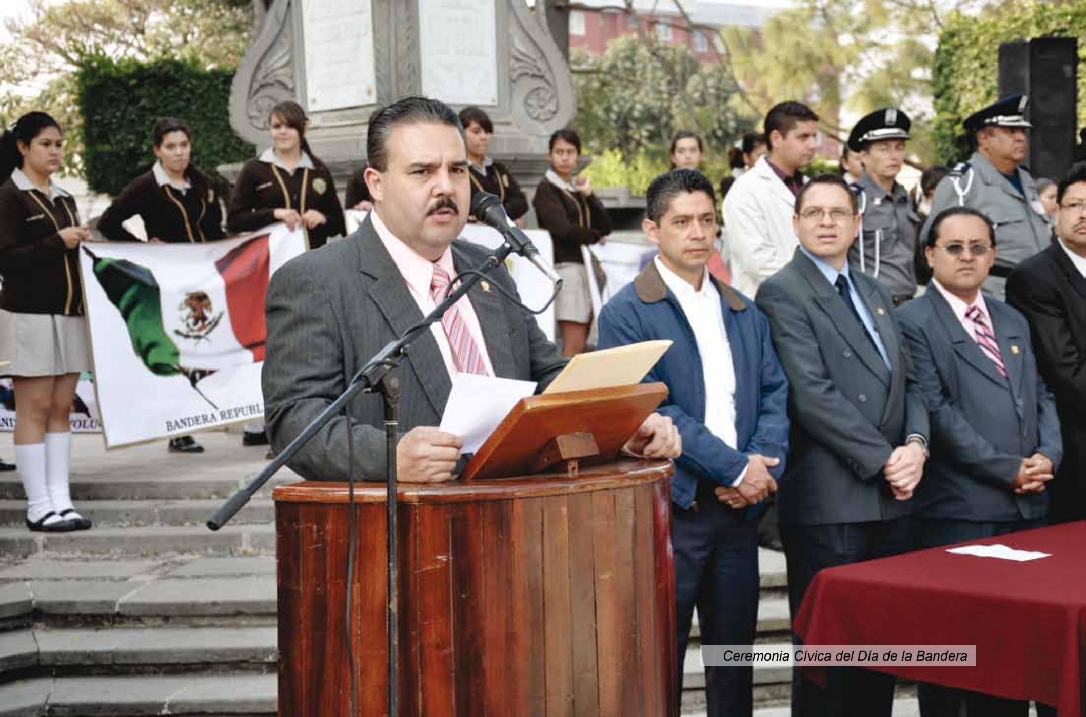
Ceremonia Cívica del Día de la Bandera