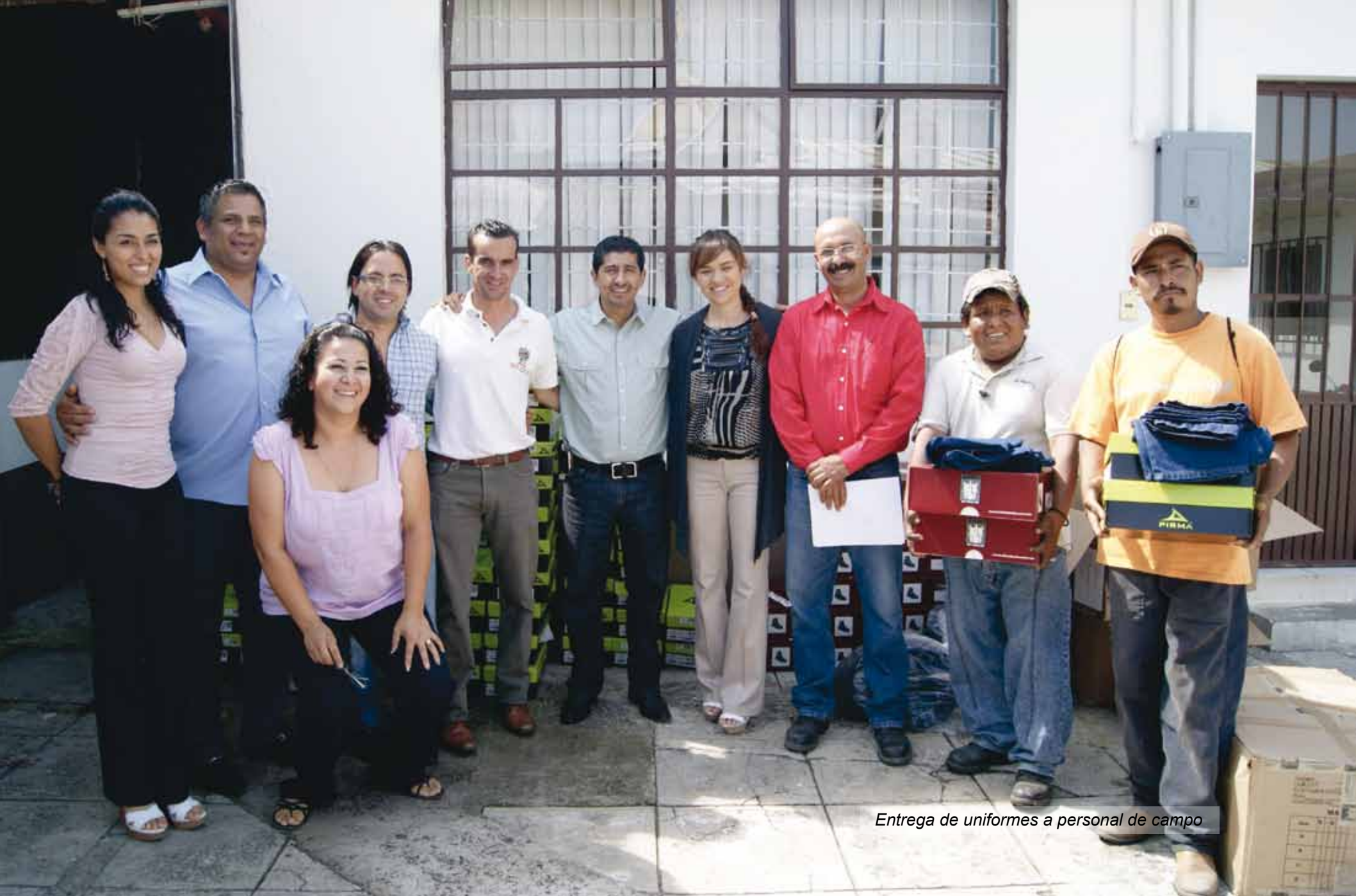
Entrega de uniformes a personal de campo