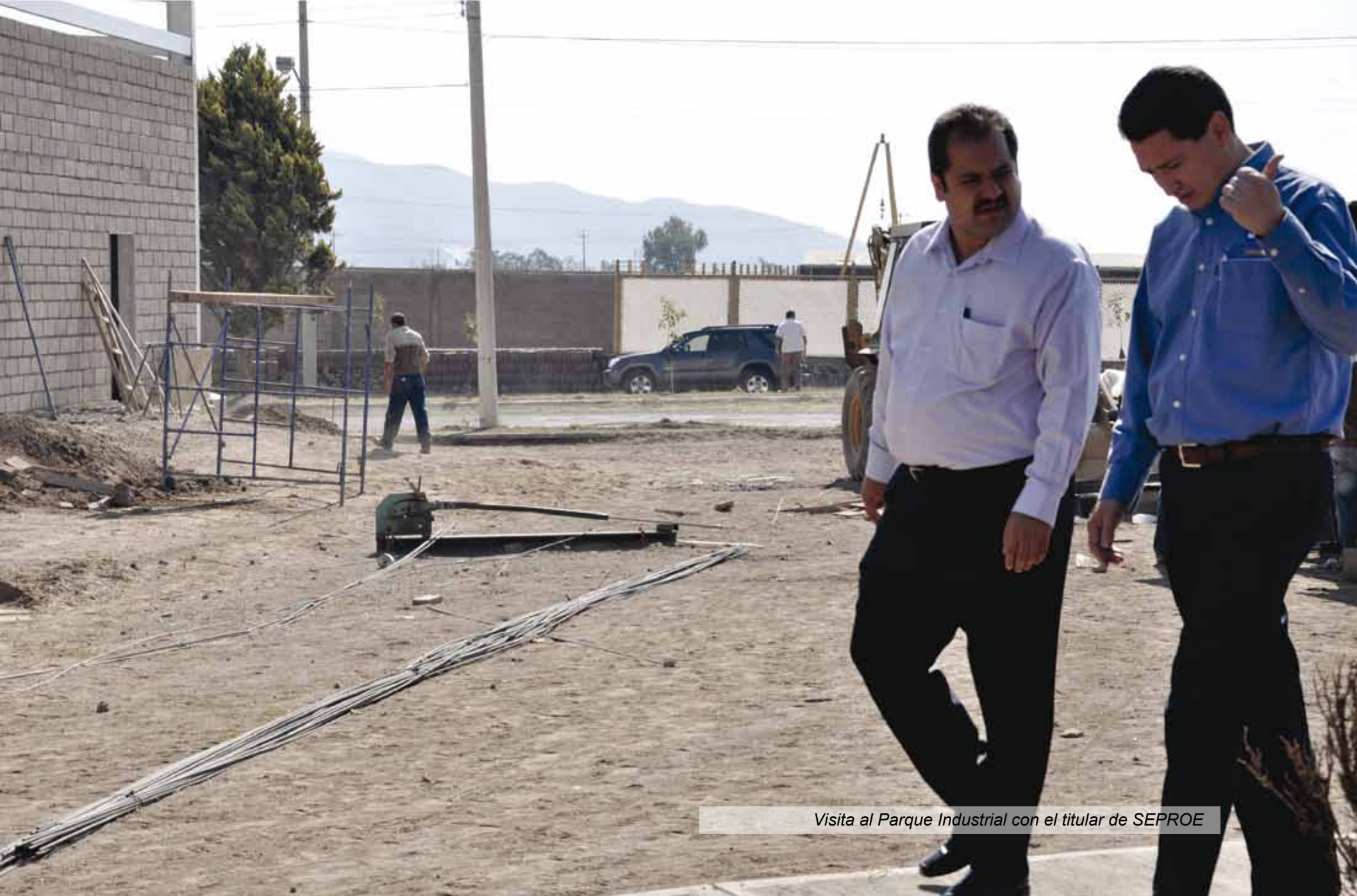
Visita al Parque Industrial con el titular de SEPROE