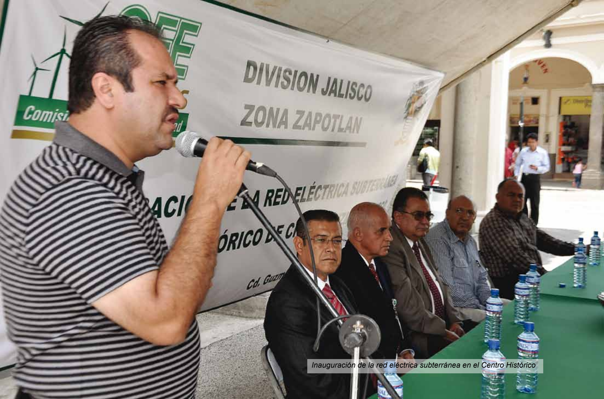
Inauguración de la red eléctrica subterránea en el Centro Histórico