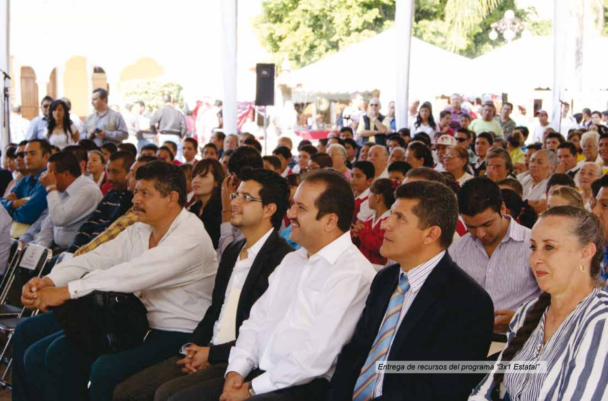
Entrega de recursos del programa "3x1 Estatal"