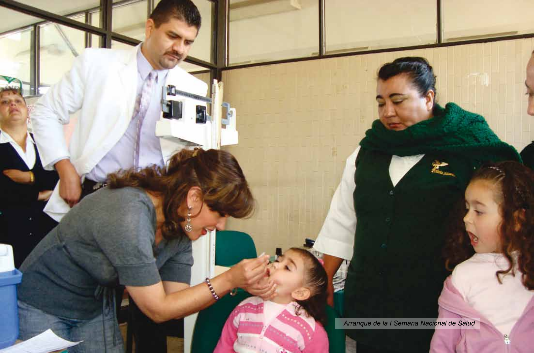
Arranque de la I Semana Nacional de Salud