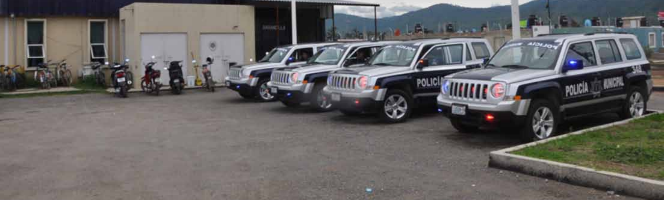
Nuevas patrullas de seguridad pública