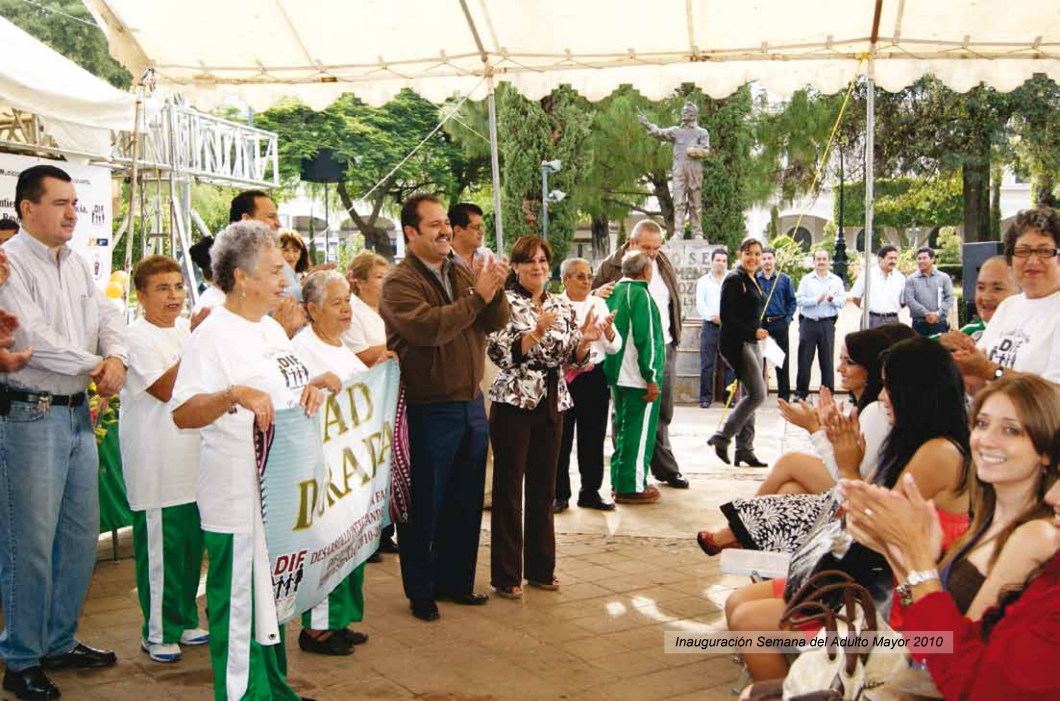
Inauguración Semana del Adulto Mayor 2010