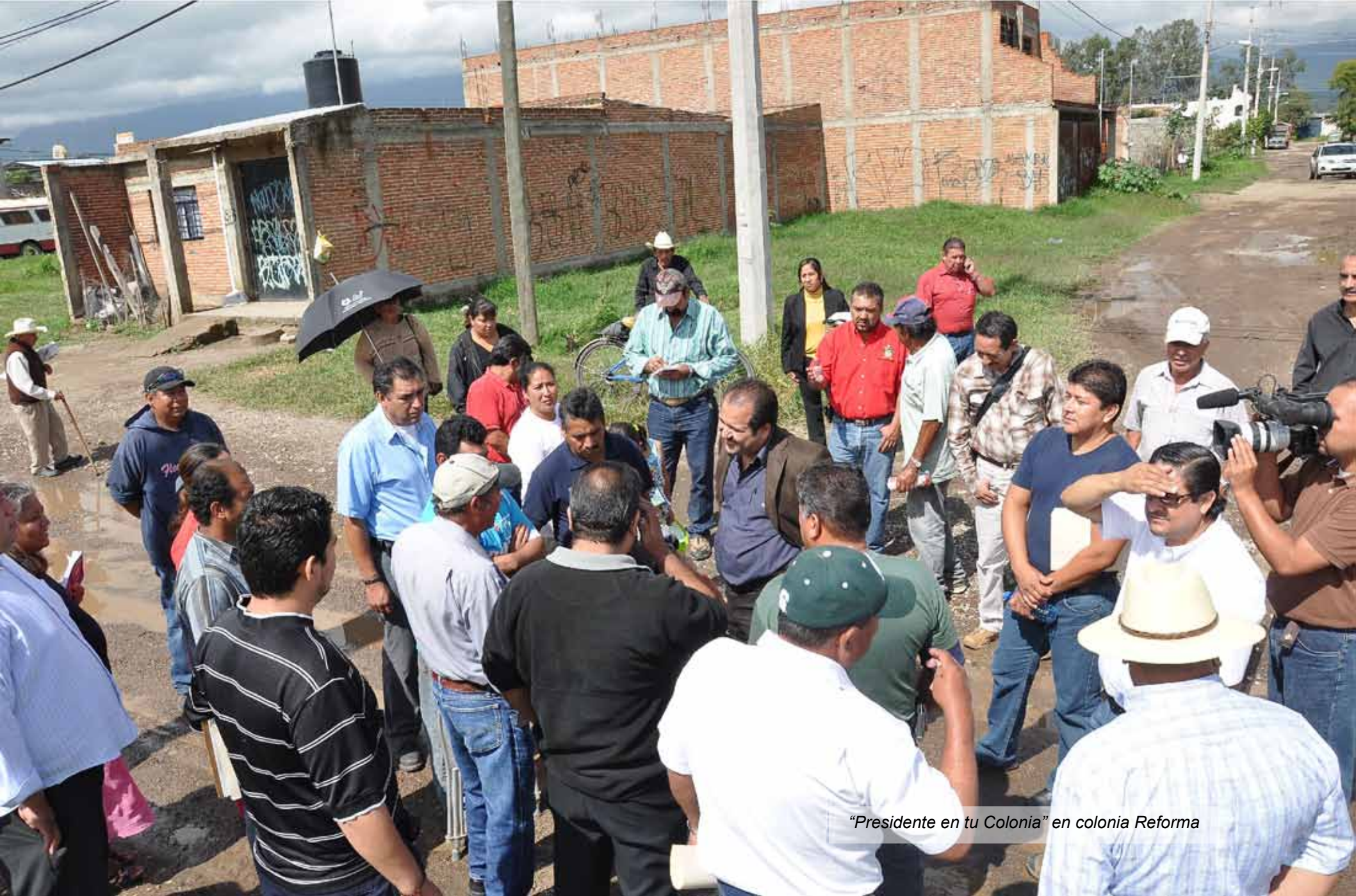
"Presidente en tu Colonia" en colonia Reforma