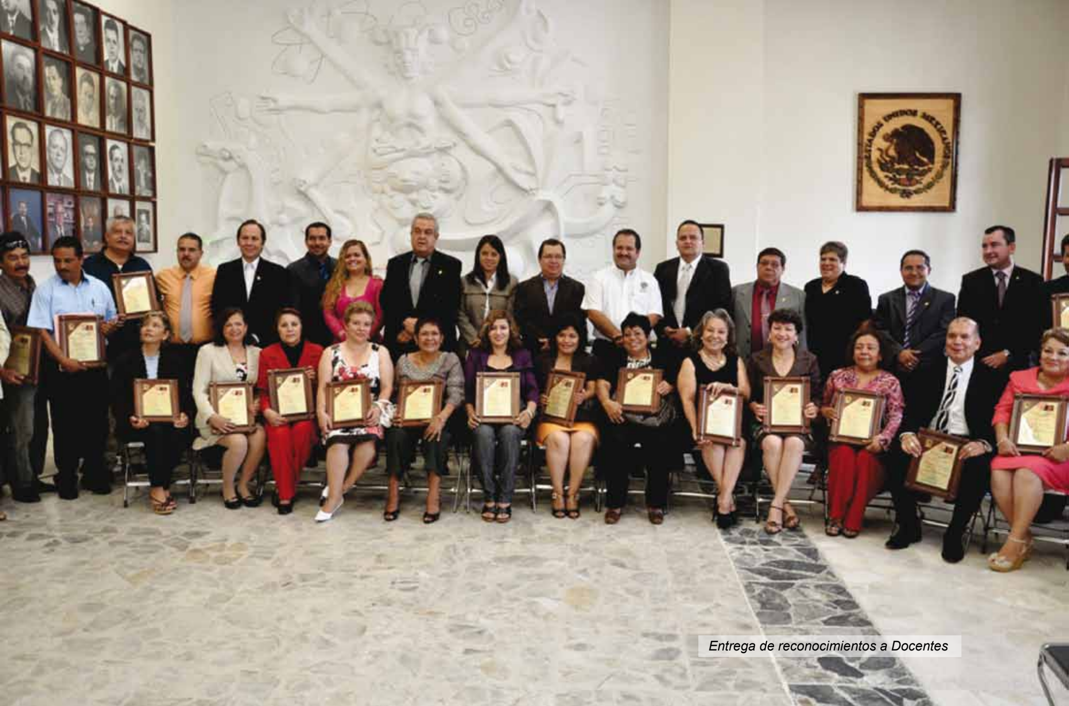
Entrega de reconocimientos a Docentes