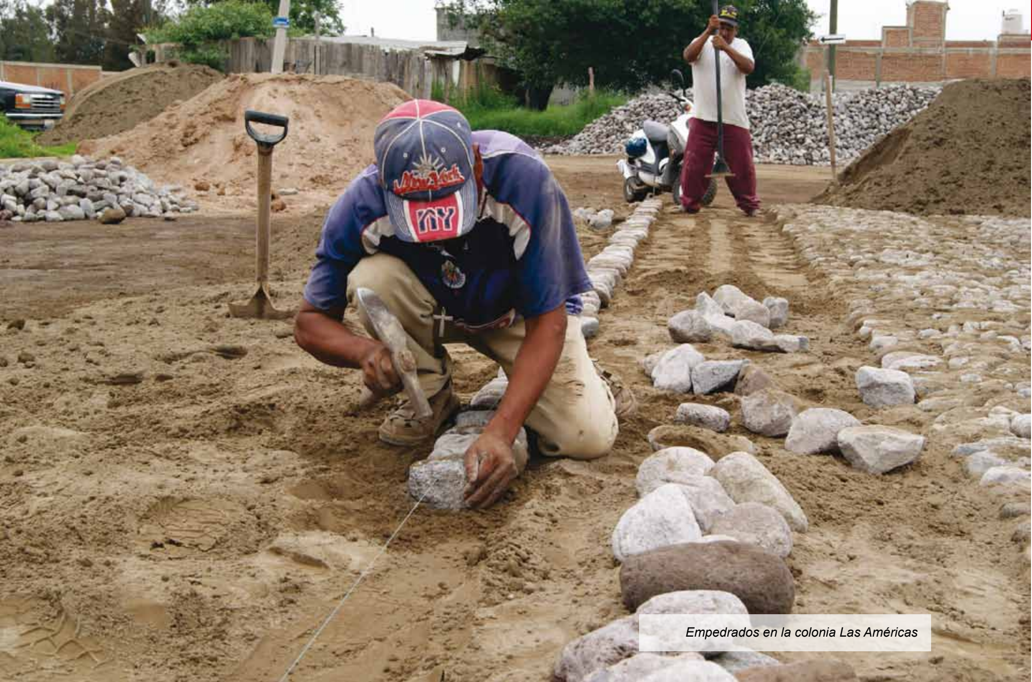
Empedrados en la colonia Las Américas