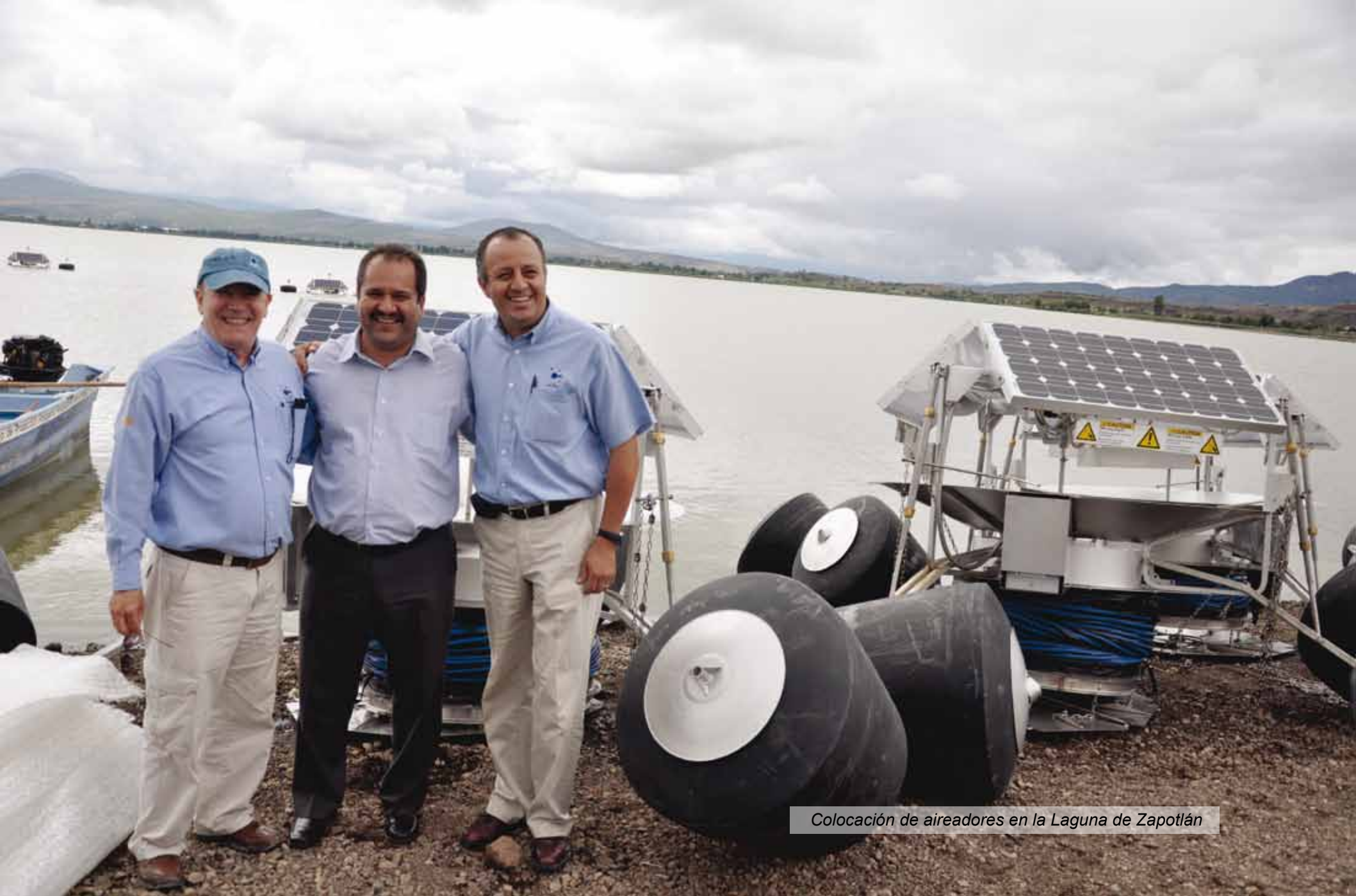
Colocación de aireadores en la Laguna de Zapotlán