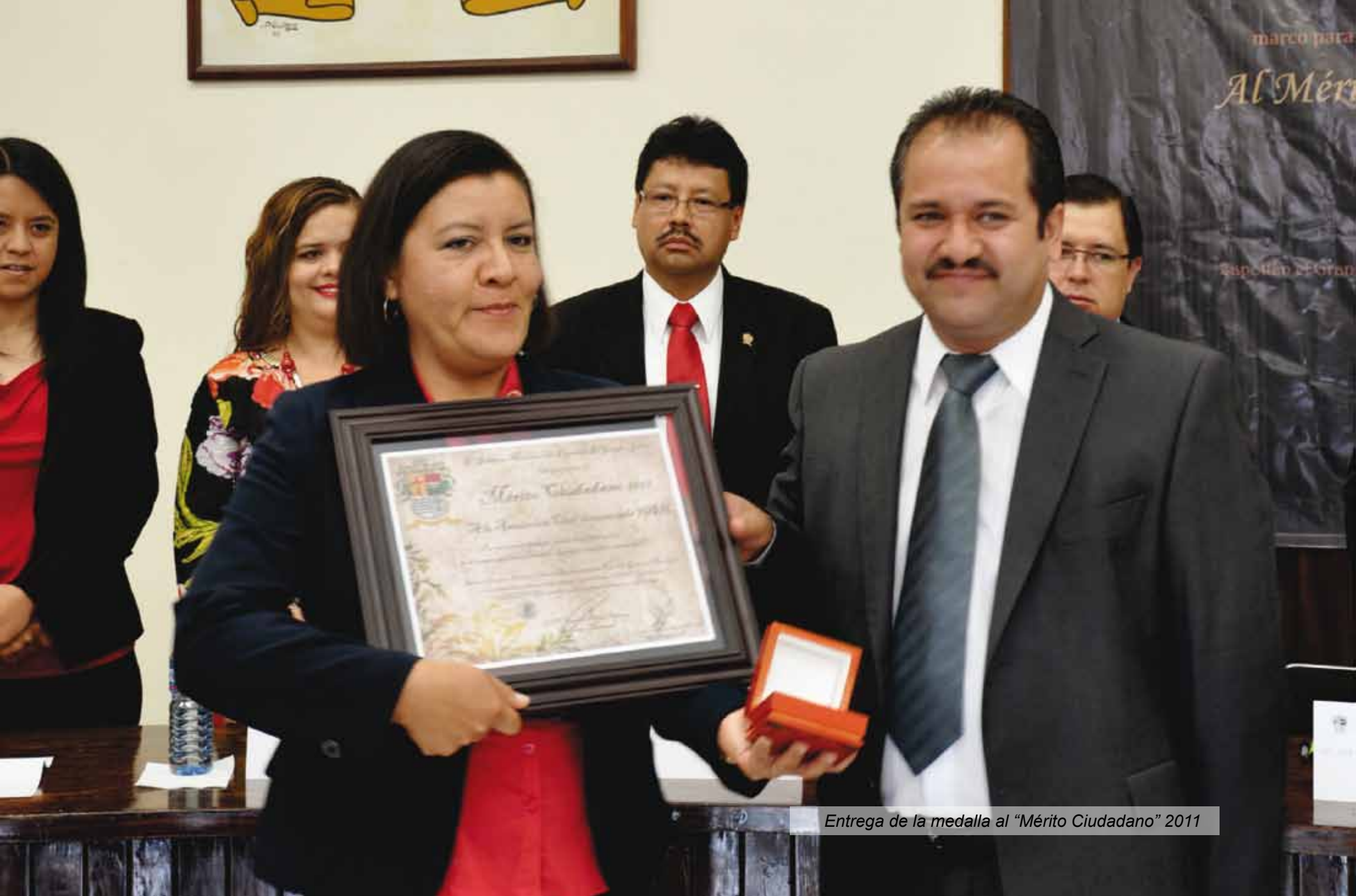
Entrega de la medalla al "Mérito Ciudadano" 2011