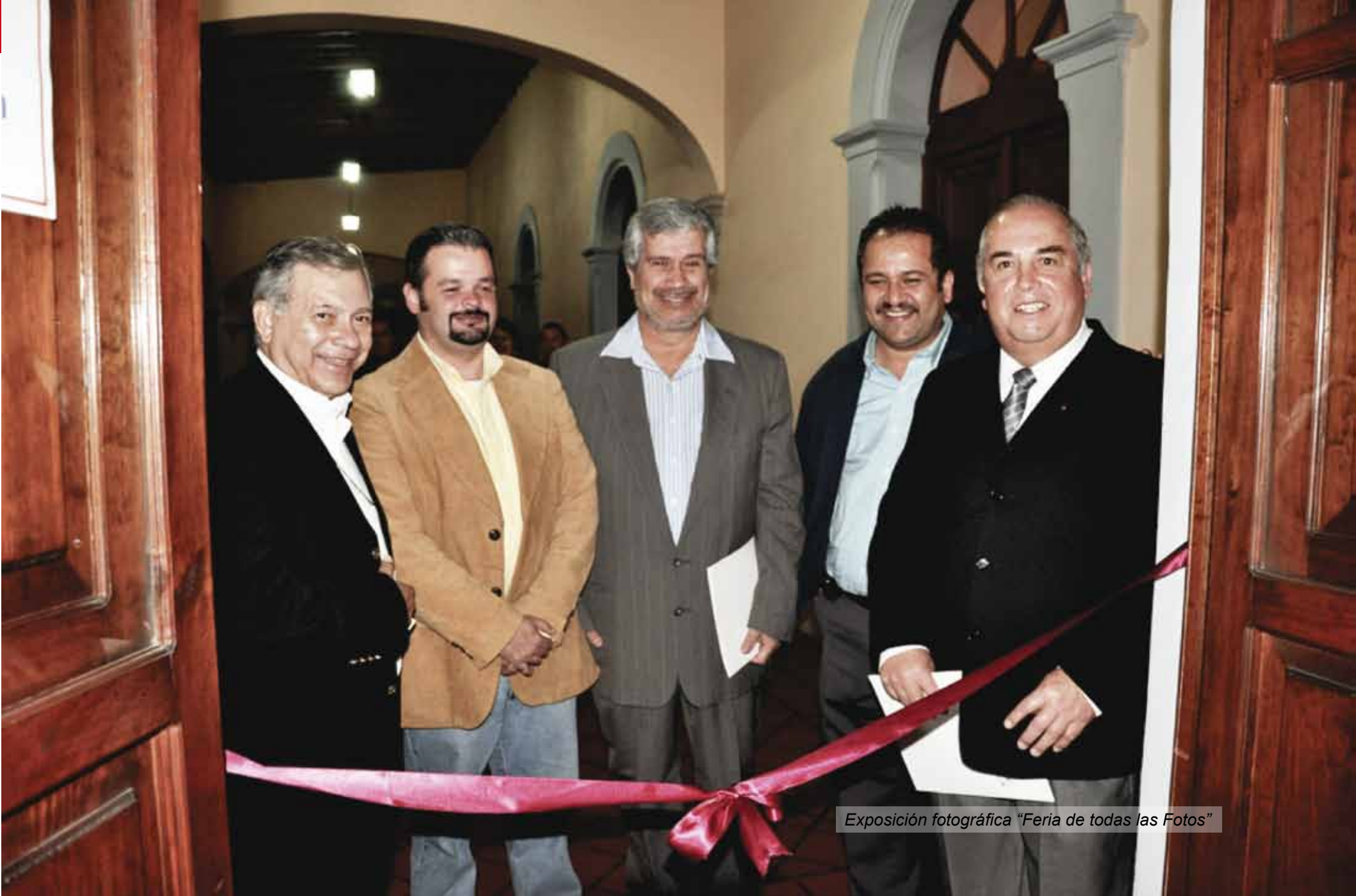
Exposición fotográfica "Feria de todas las Fotos"