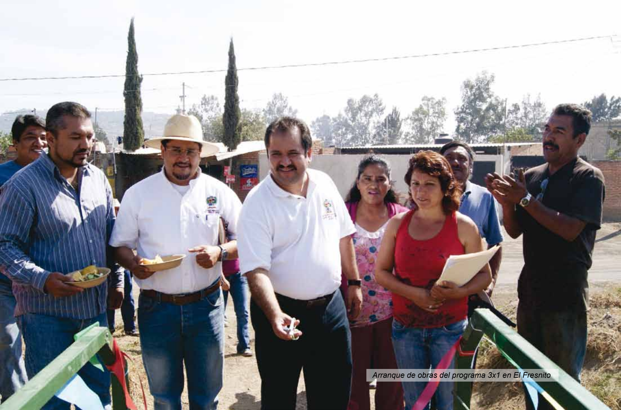
Arranque de obras del programa 3x1 en El Fresno