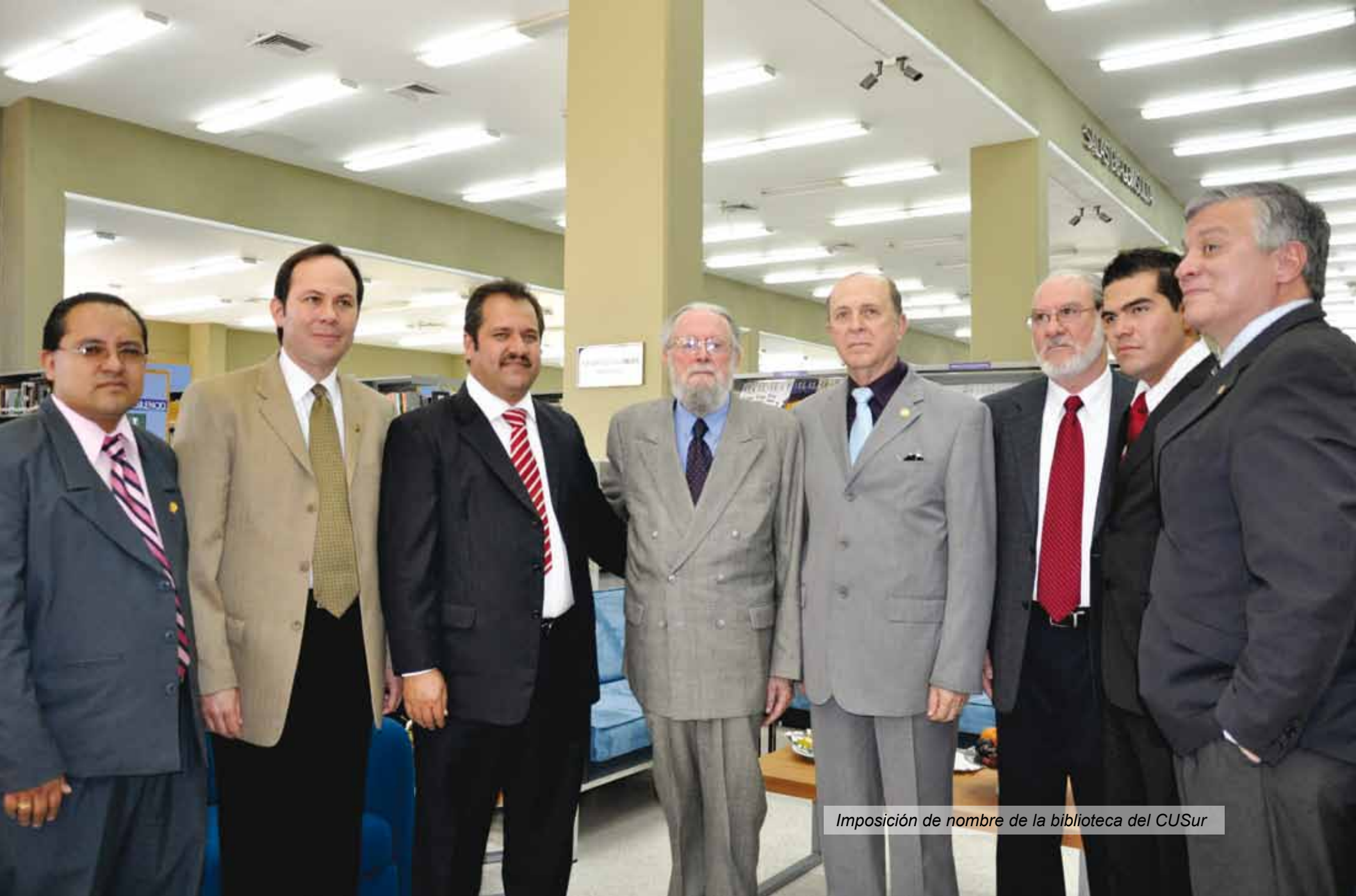
Imposición de nombre de la biblioteca del CUSur