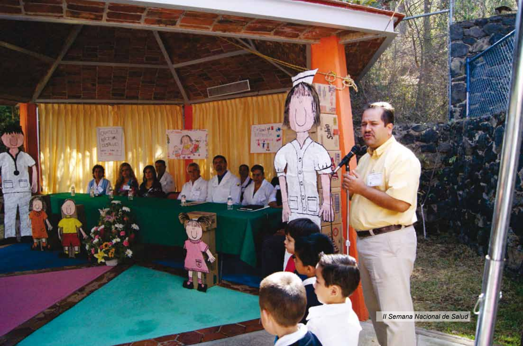
II Semana Nacional de Salud