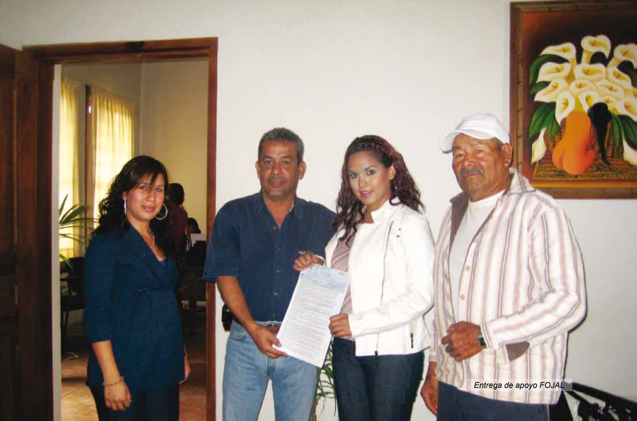
Entrega de apoyo FOJAL