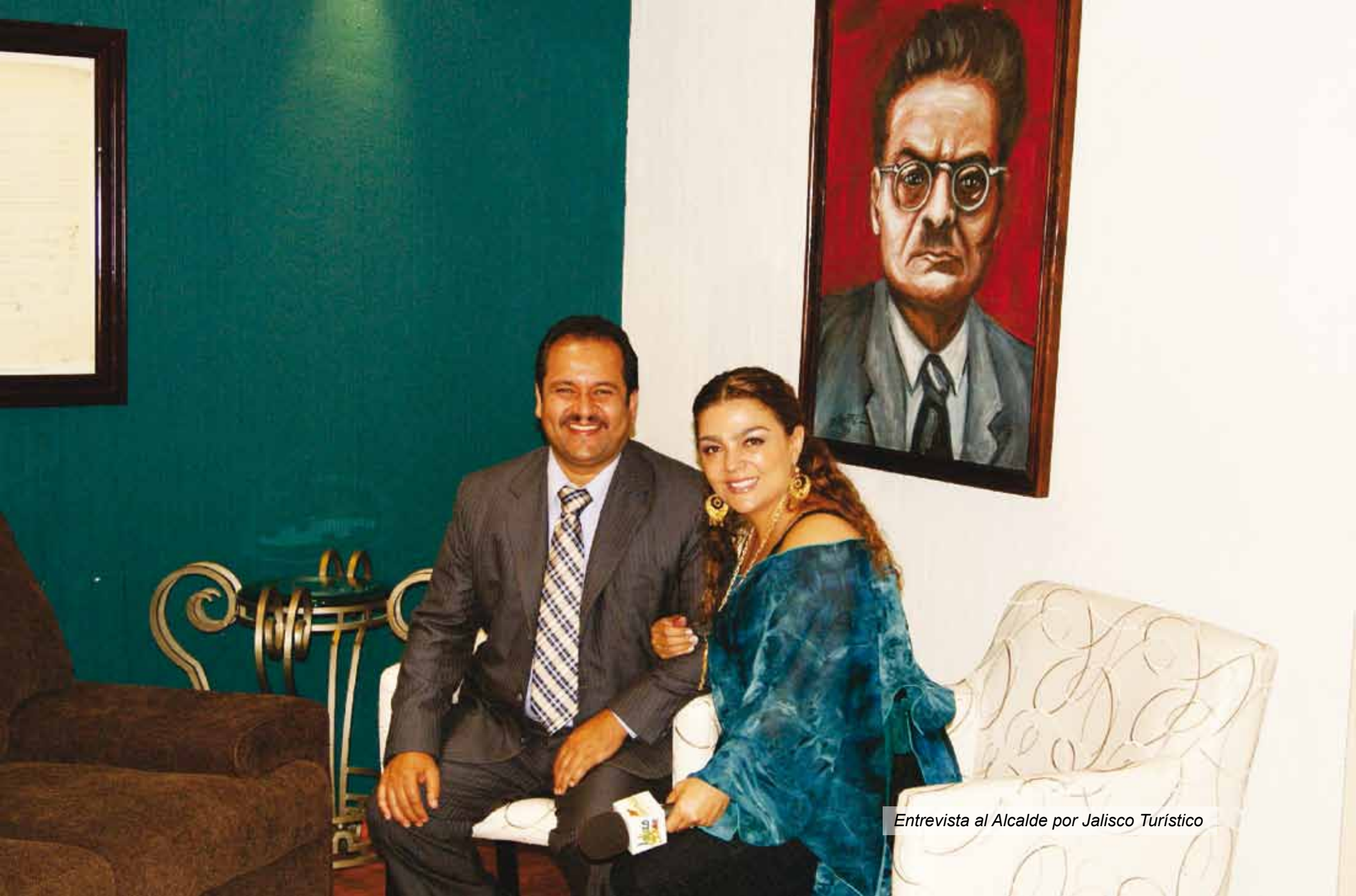
Entrevista al Alcalde por Jalisco Turístico