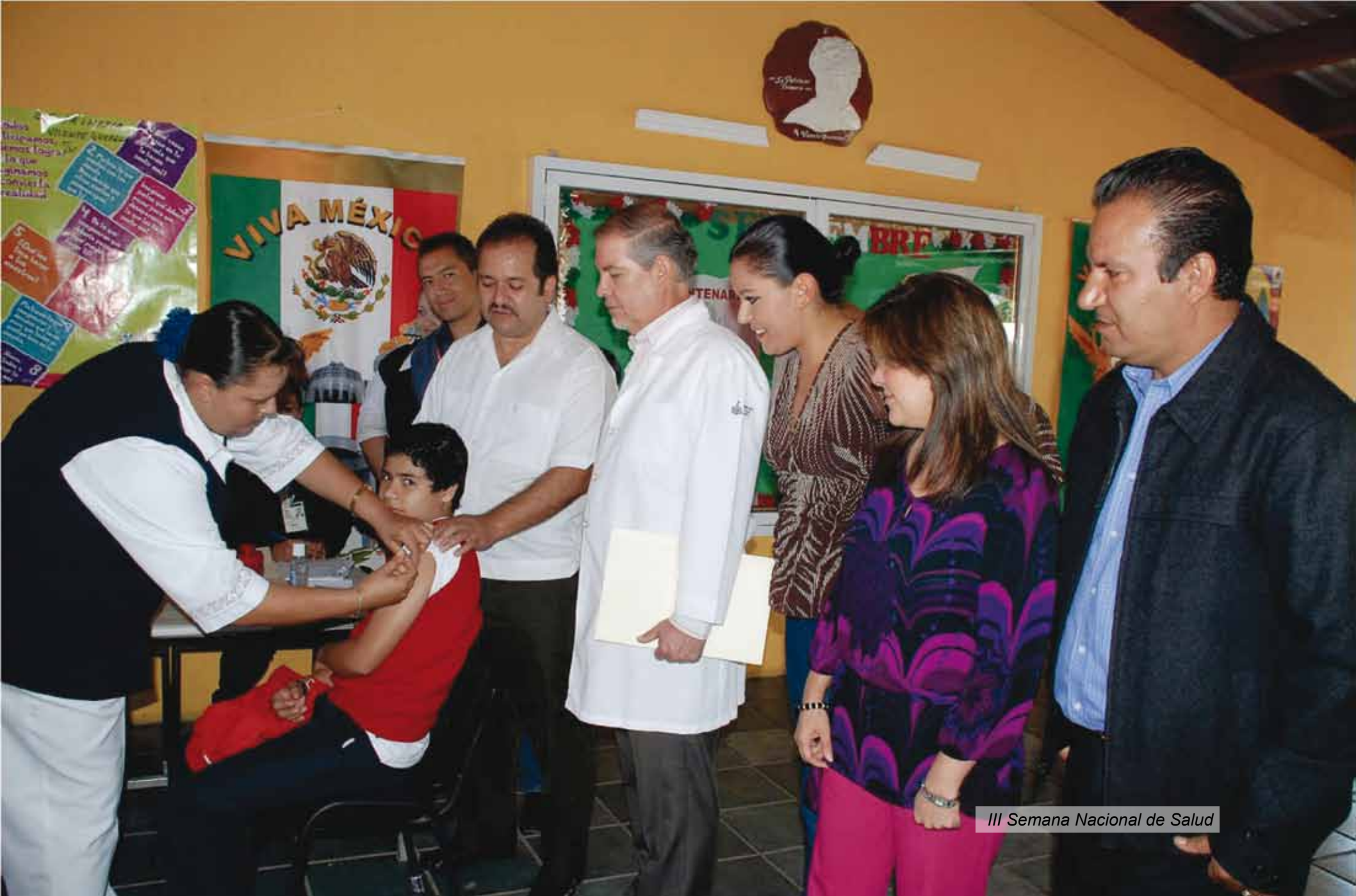
III Semana Nacional de Salud