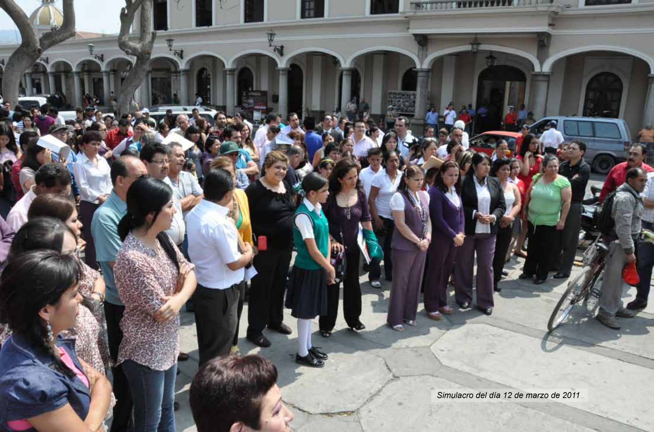
Simulacro del día 12 de marzo de 2011