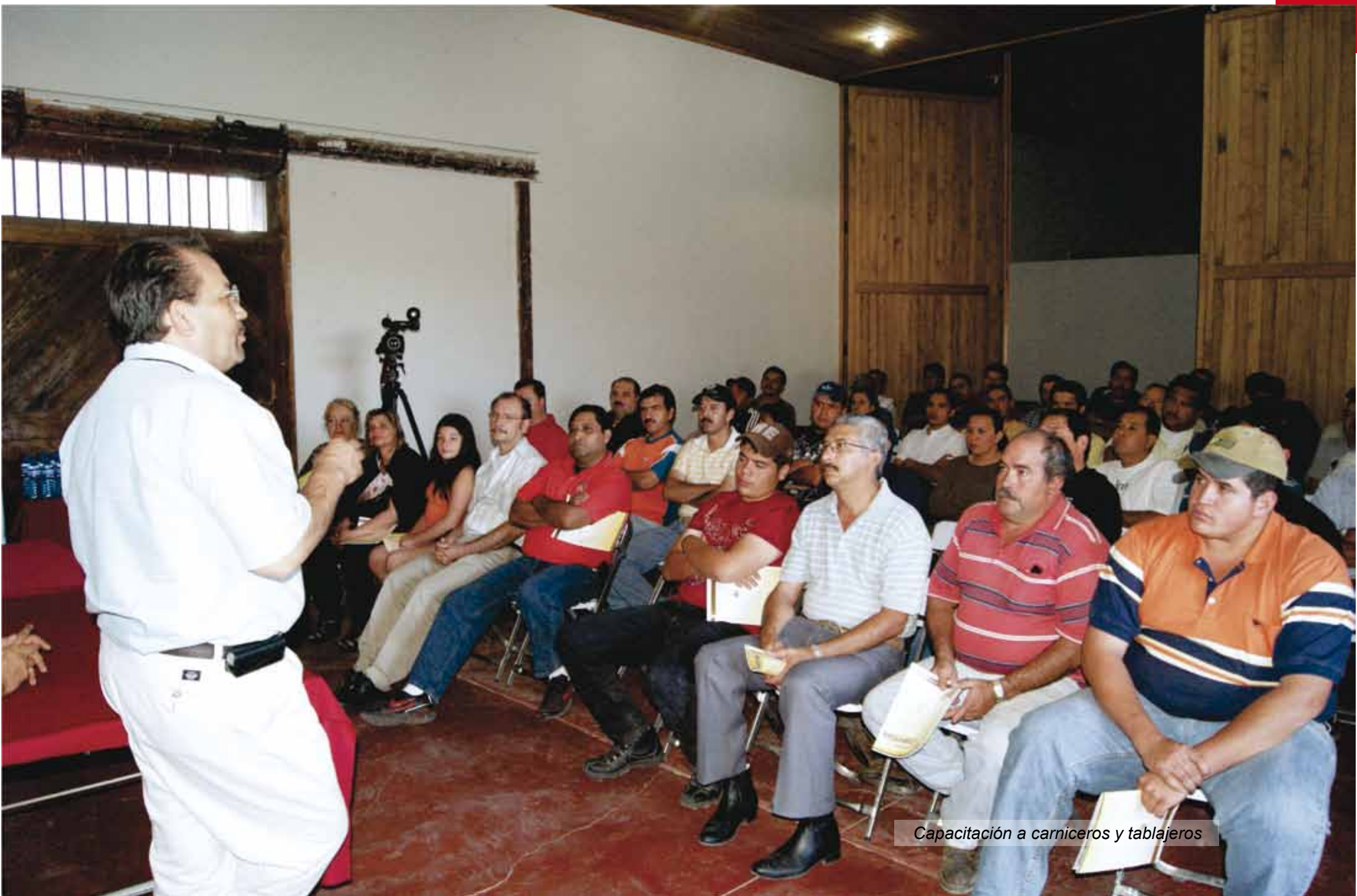
Capacitación a carniceros y tablajeros