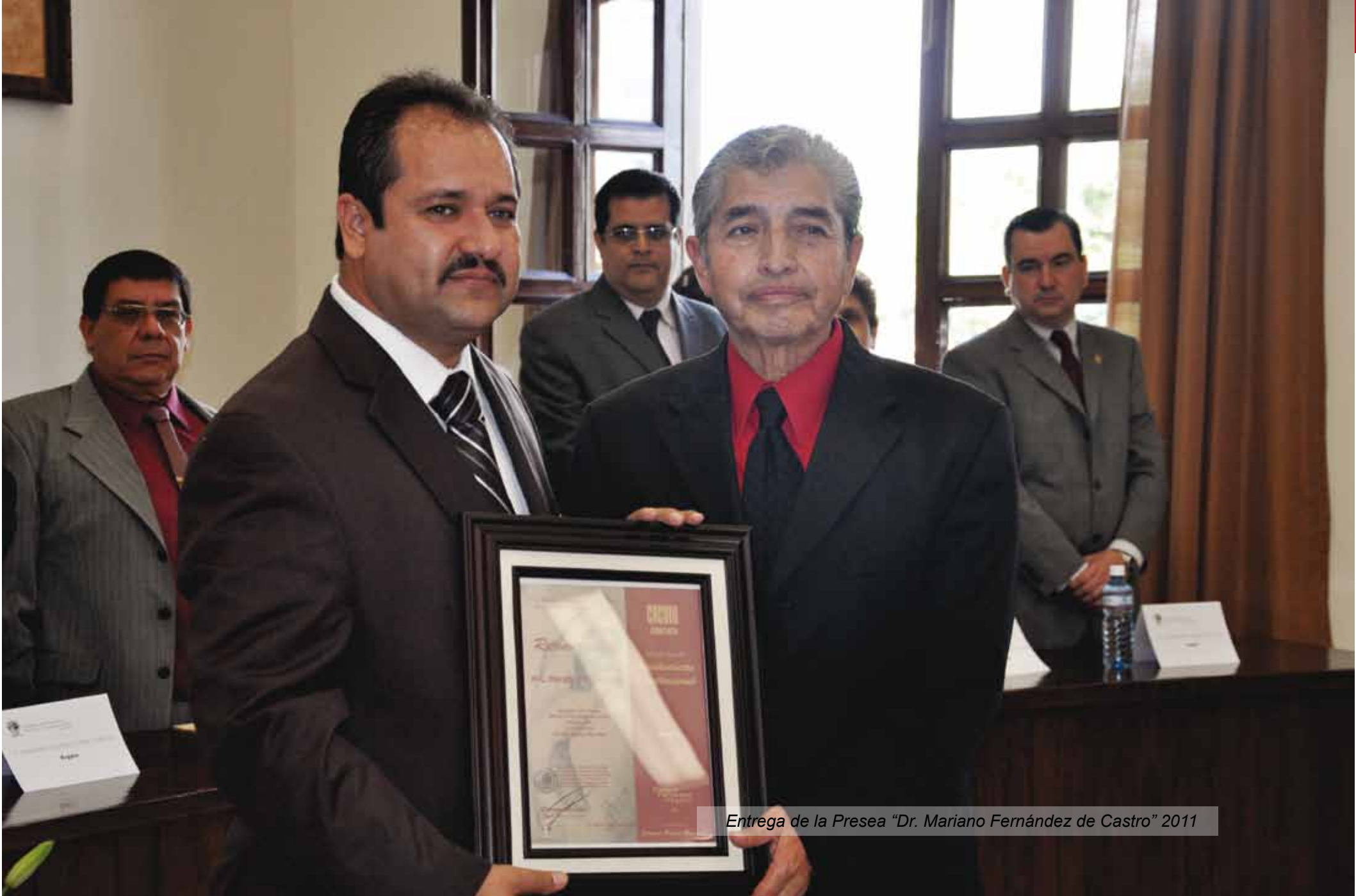
Entrega de la Presea "Dr. Mariano Fernández de Castro" 2011