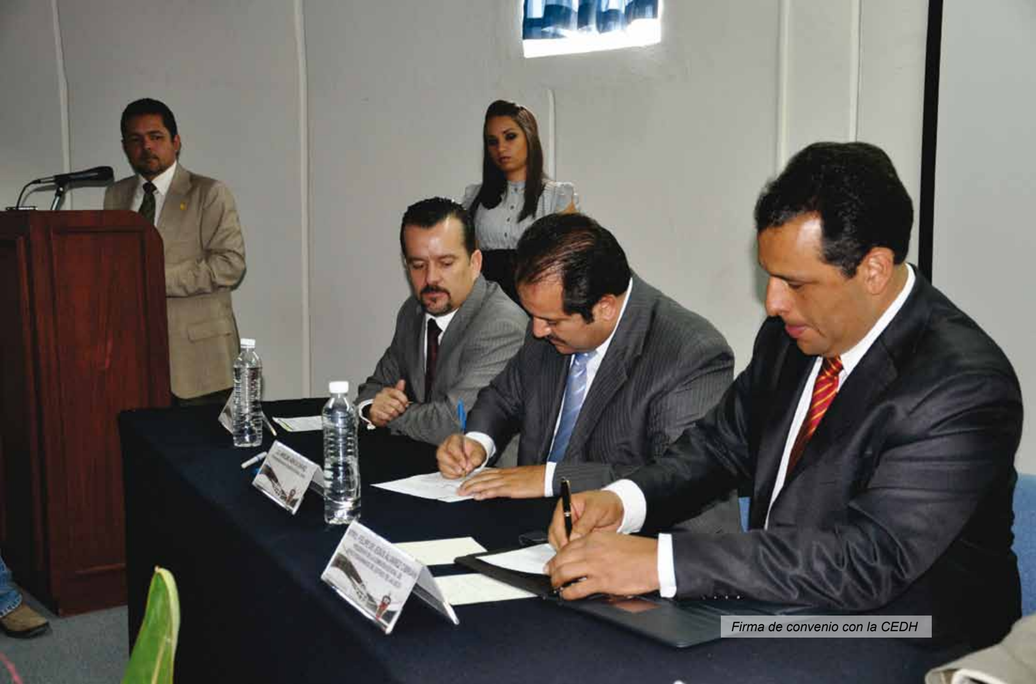
Firma de convenio con la CEDH