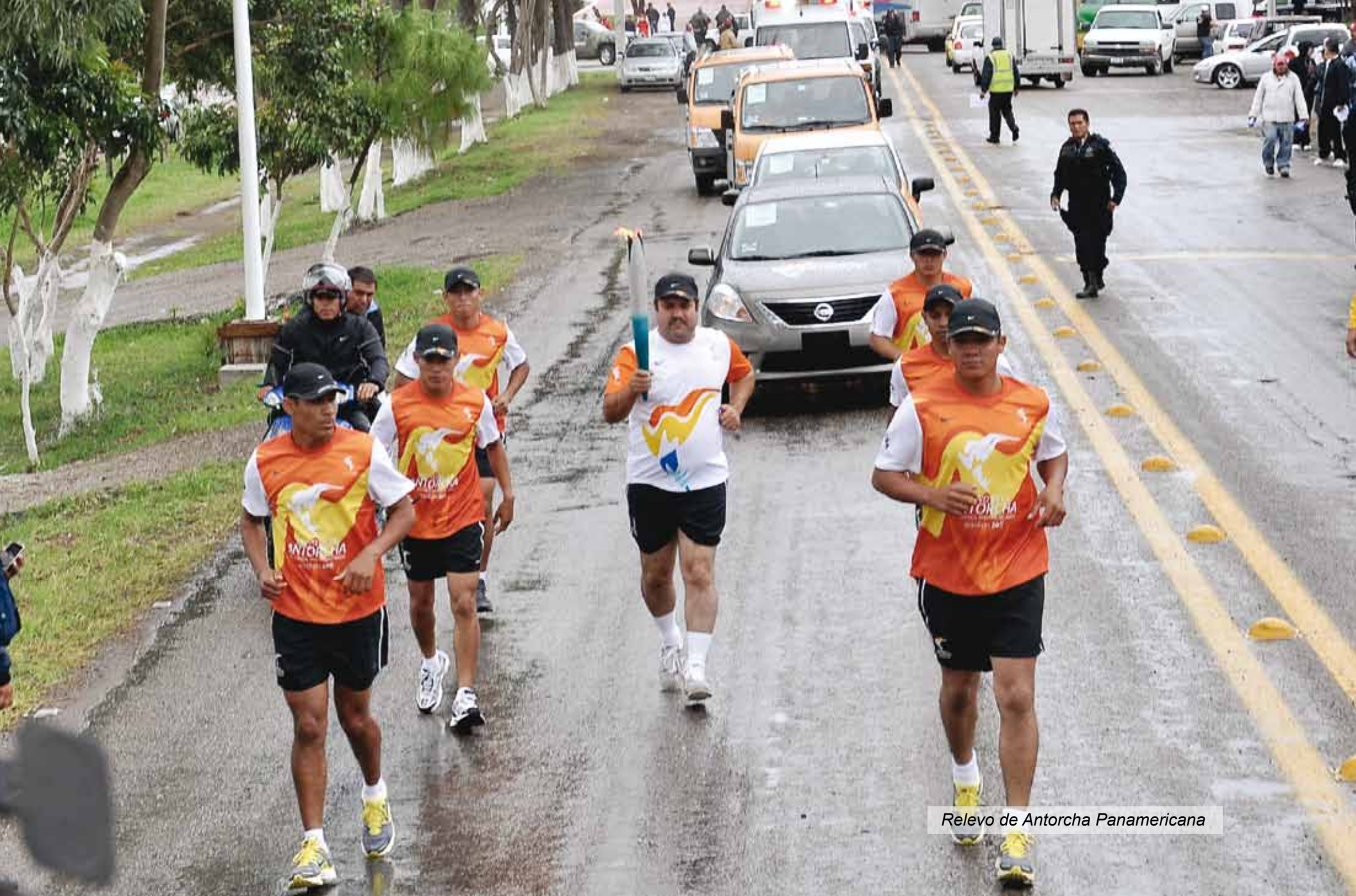
Relevo de Antorcha Panamericana