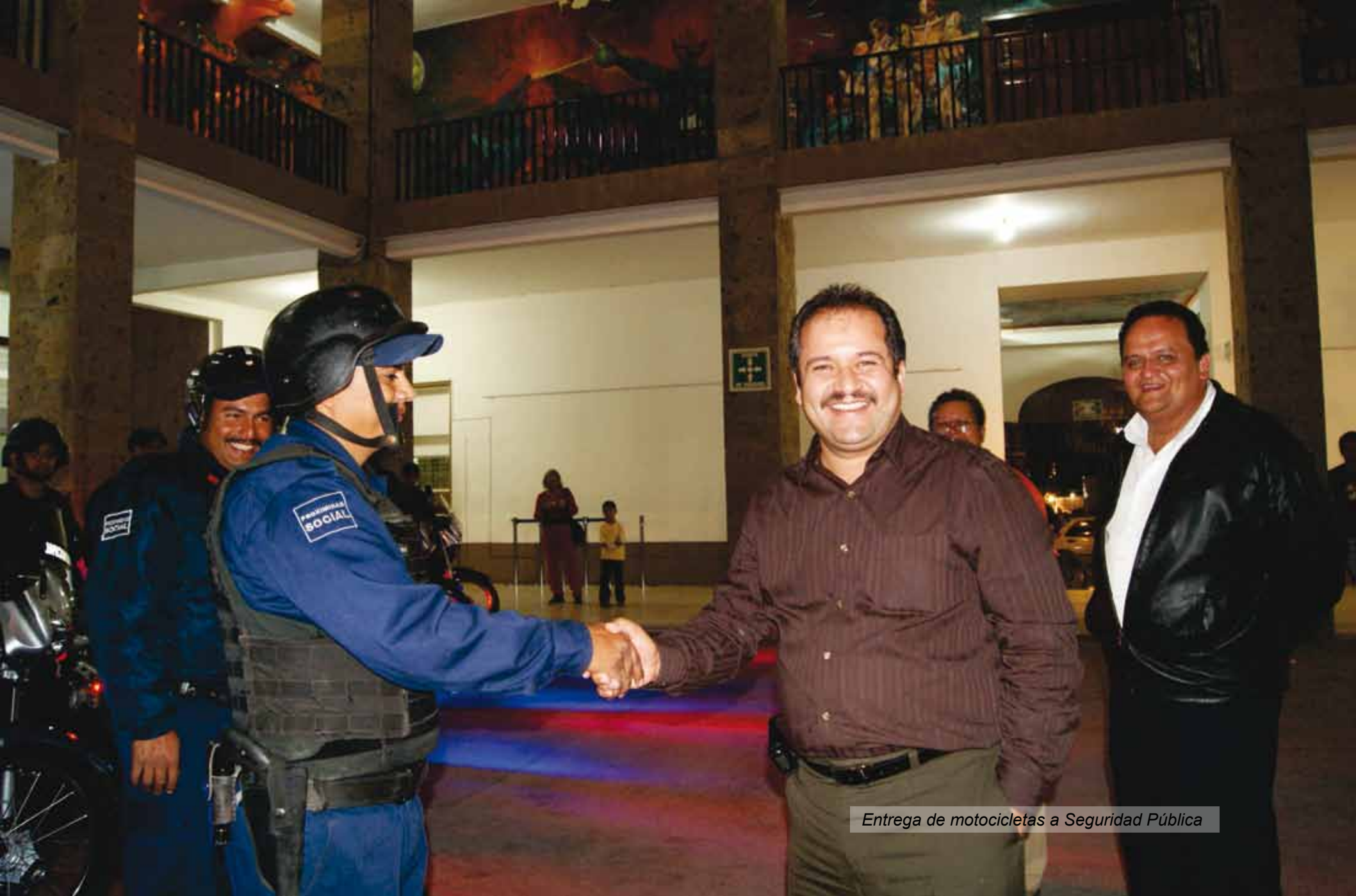
Entrega de motocicletas a Seguridad Pública