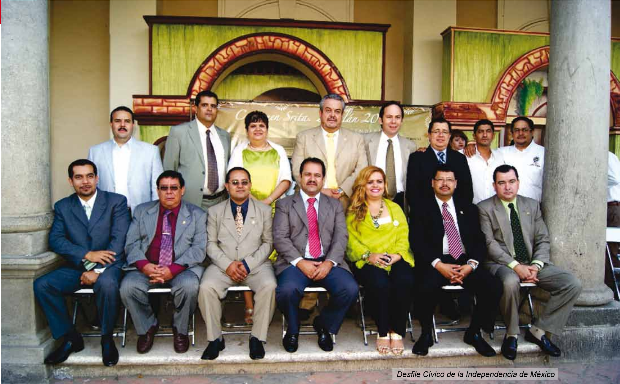
Desfile Cívico de la Independencia de México