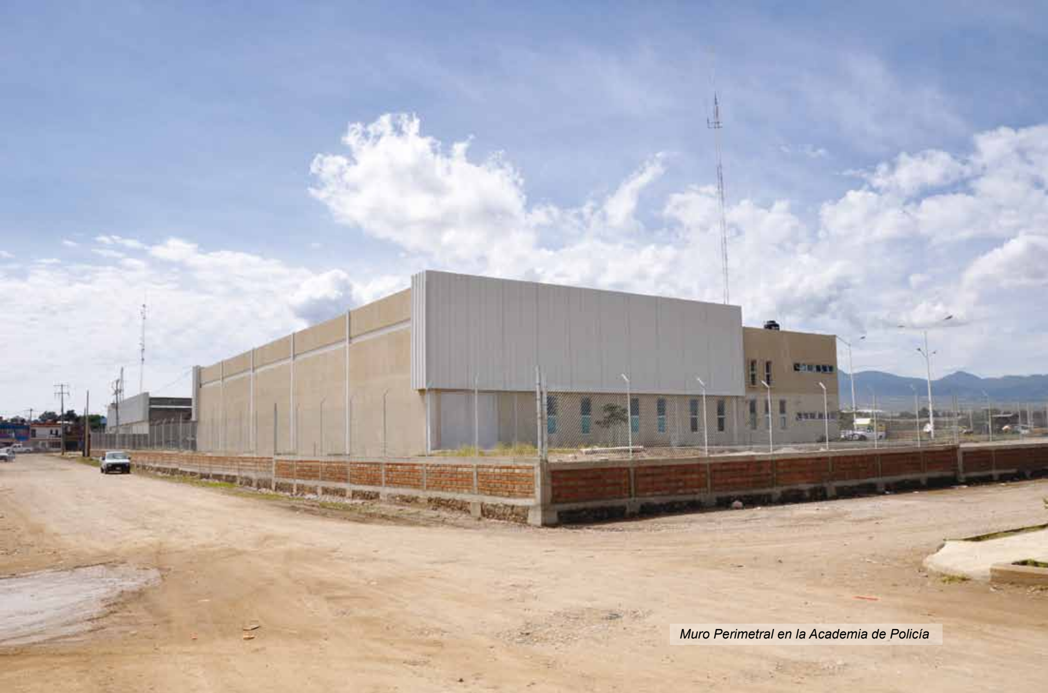
Muro Perimetral en la Academia de Policía