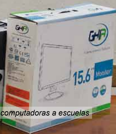
Donación de computadoras a escuelas