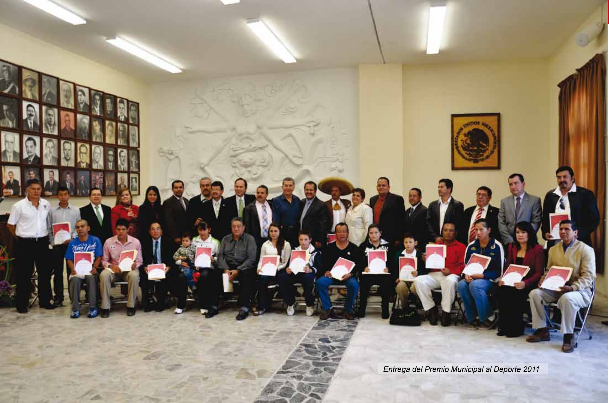
Entrega del Premio Municipal al Deporte 2011