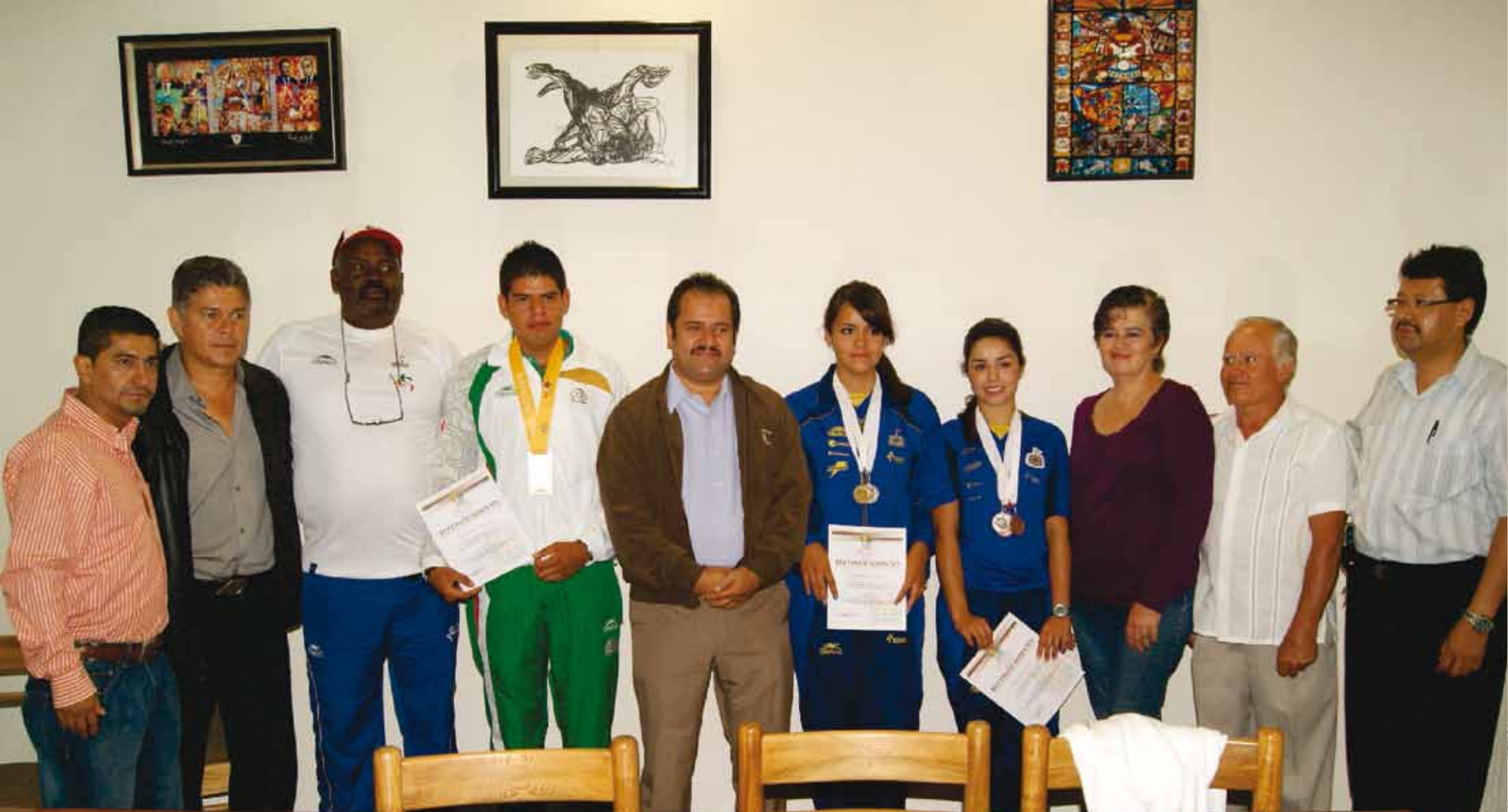
Medallistas Canammex y Juegos Centroamericanos 2010