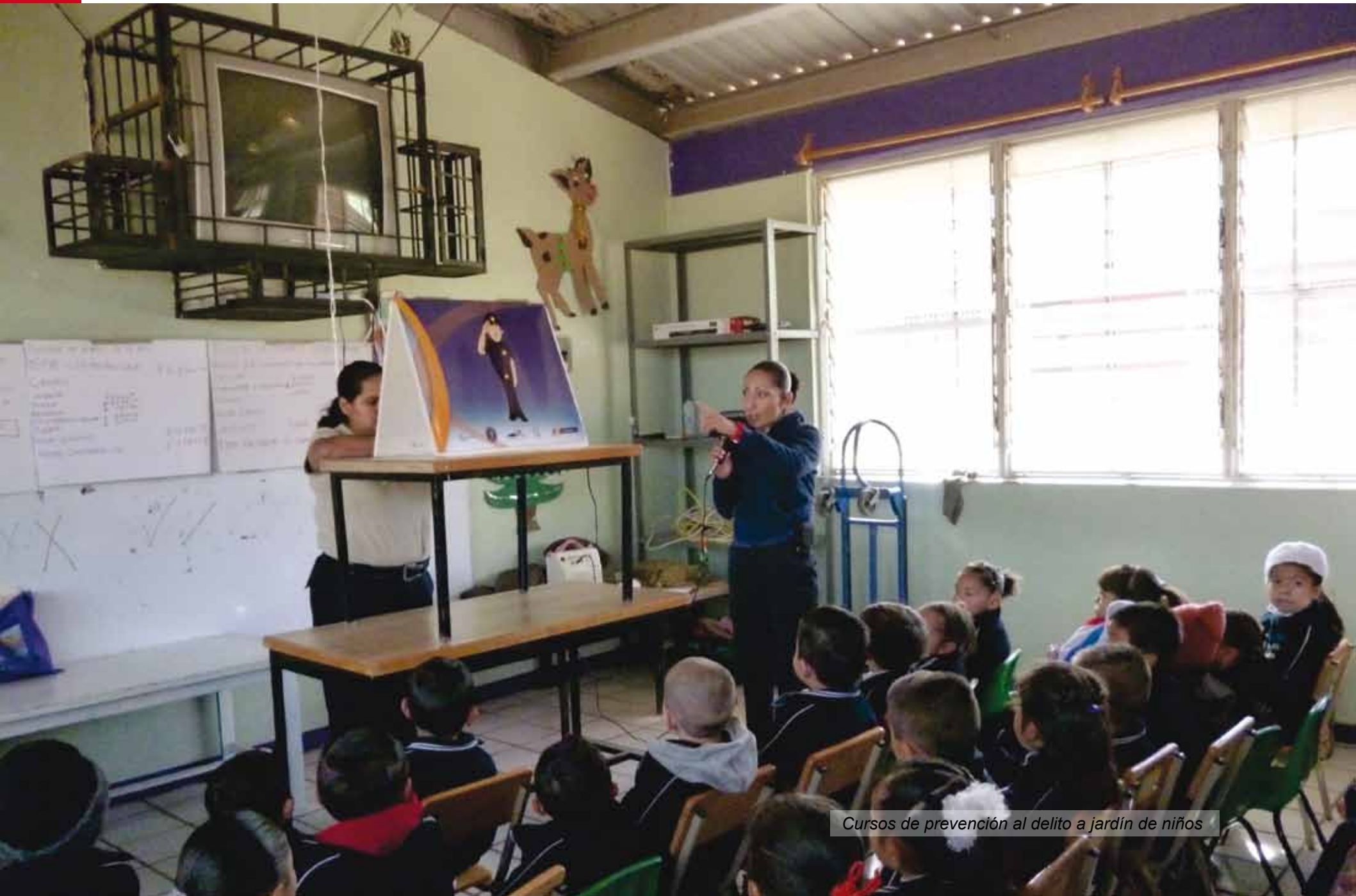
Cursos de prevención al delito a jardín de niños