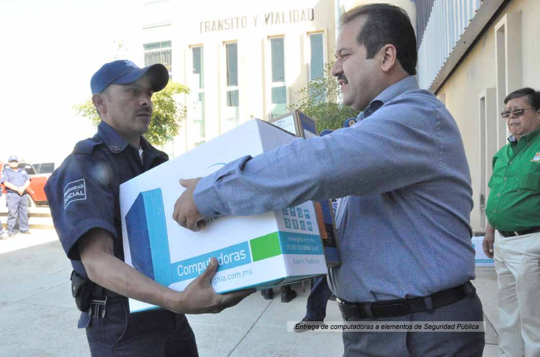
Entrega de computadoras a elementos de Seguridad Pública