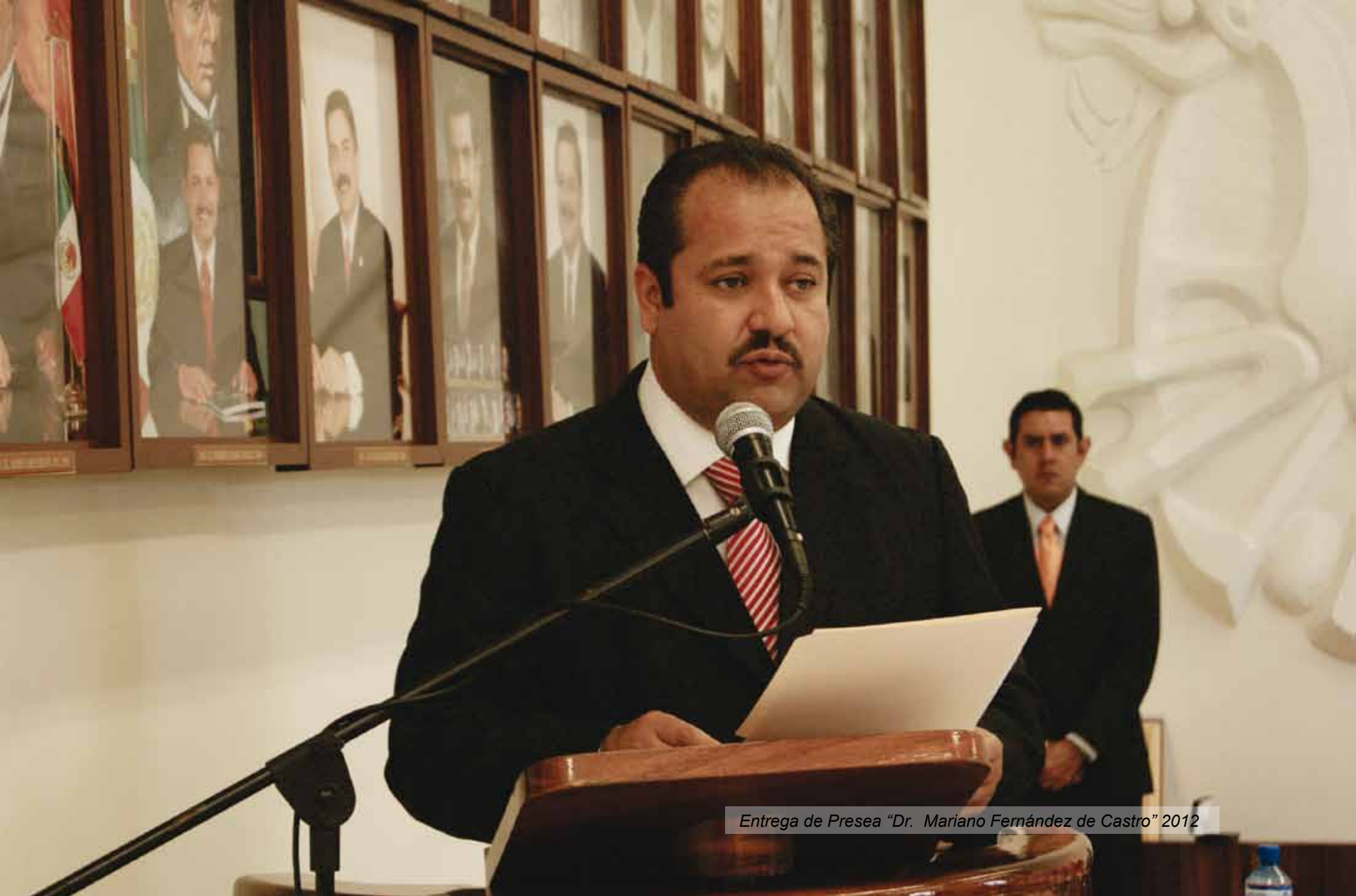
Entrega de Presea "Dr. Mariano Fernández de Castro" 2012