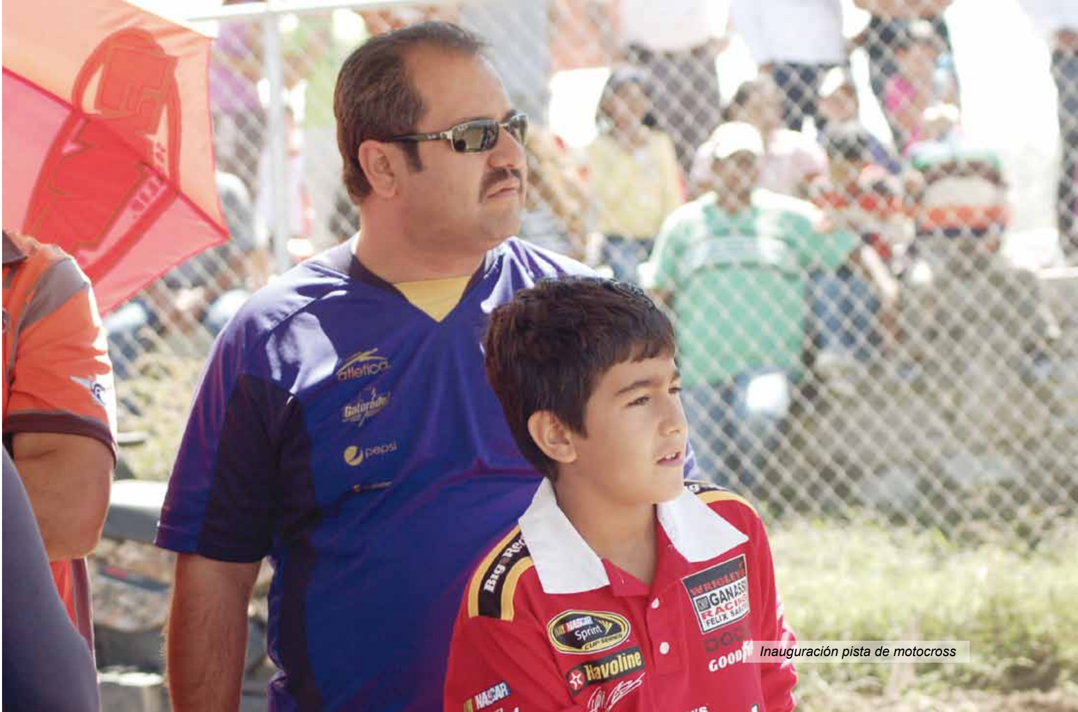
Inauguración pista de motocross