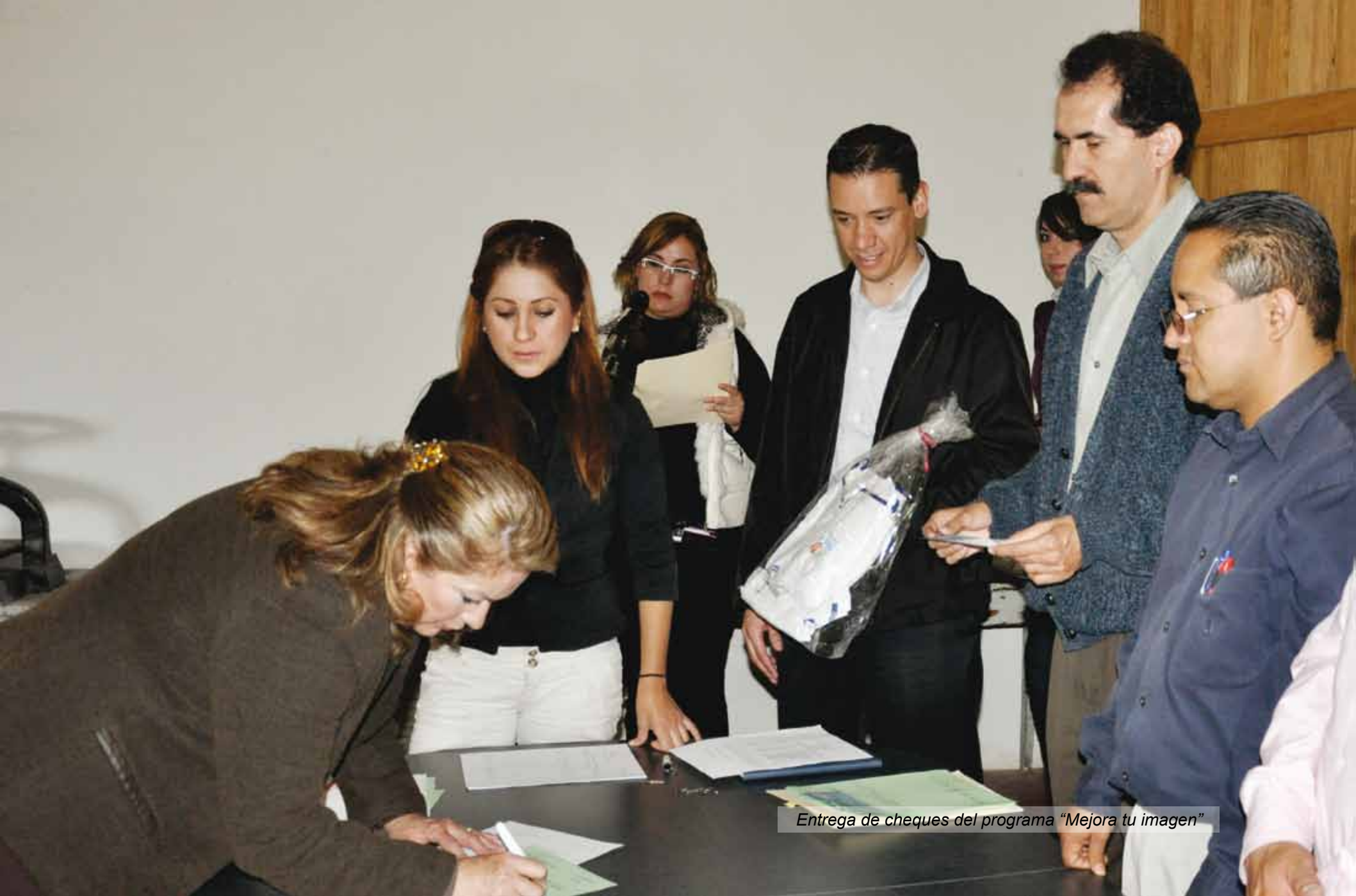
Entrega de cheques del programa "Mejora tu imagen"