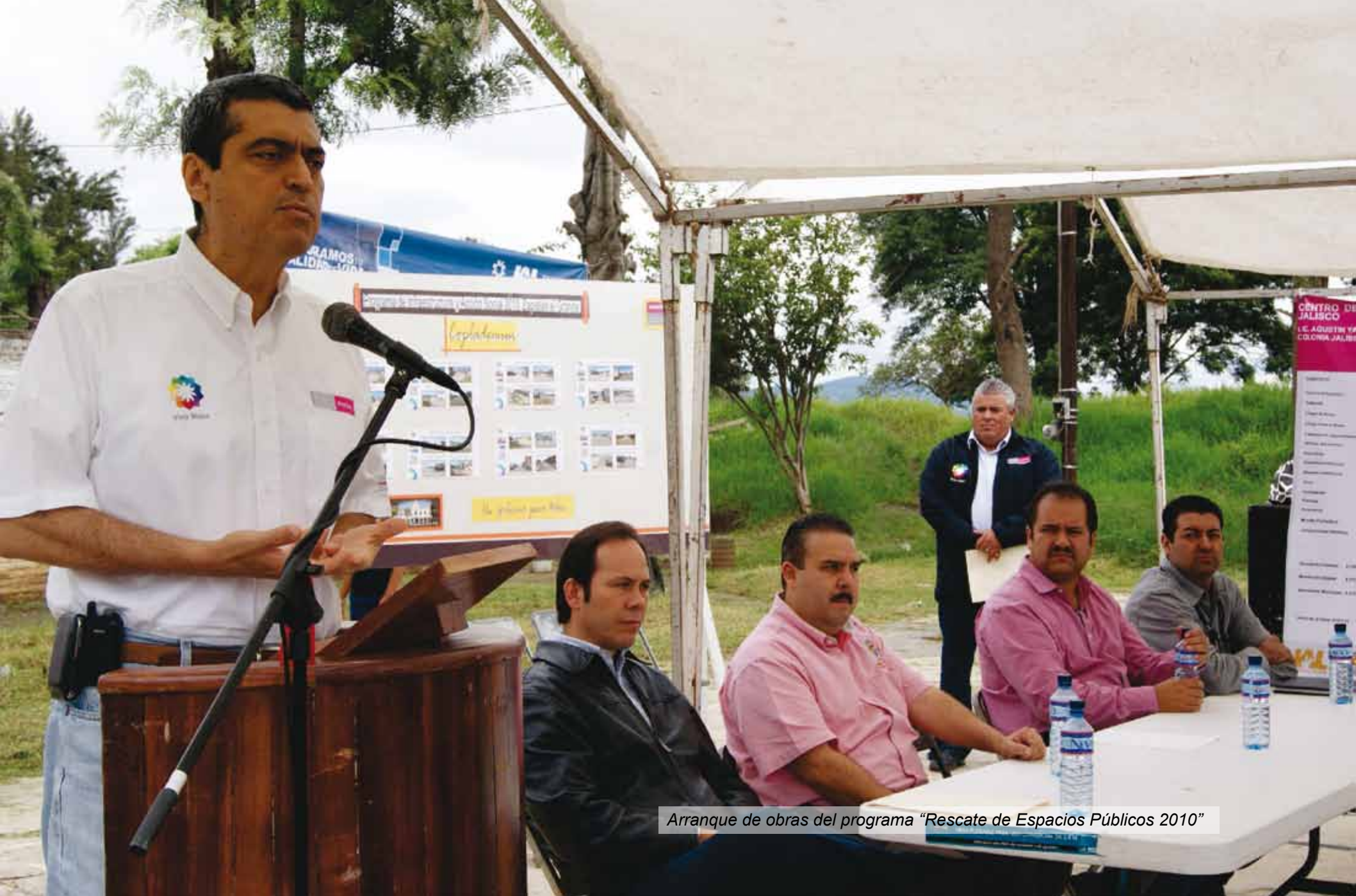
Arranque de obras del programa "Rescate de Espacios Públicos 2010"