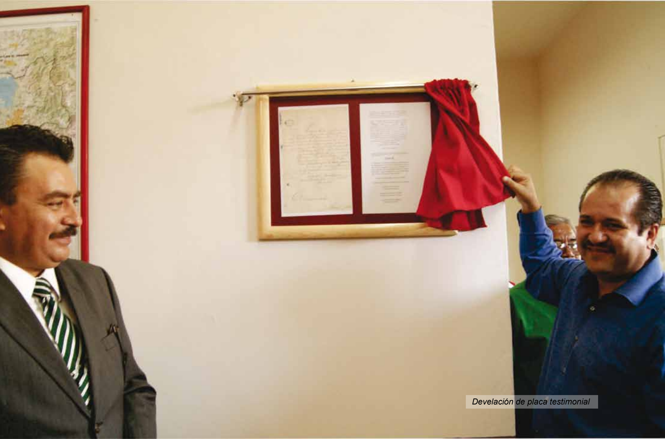
Develación de placa testimonial