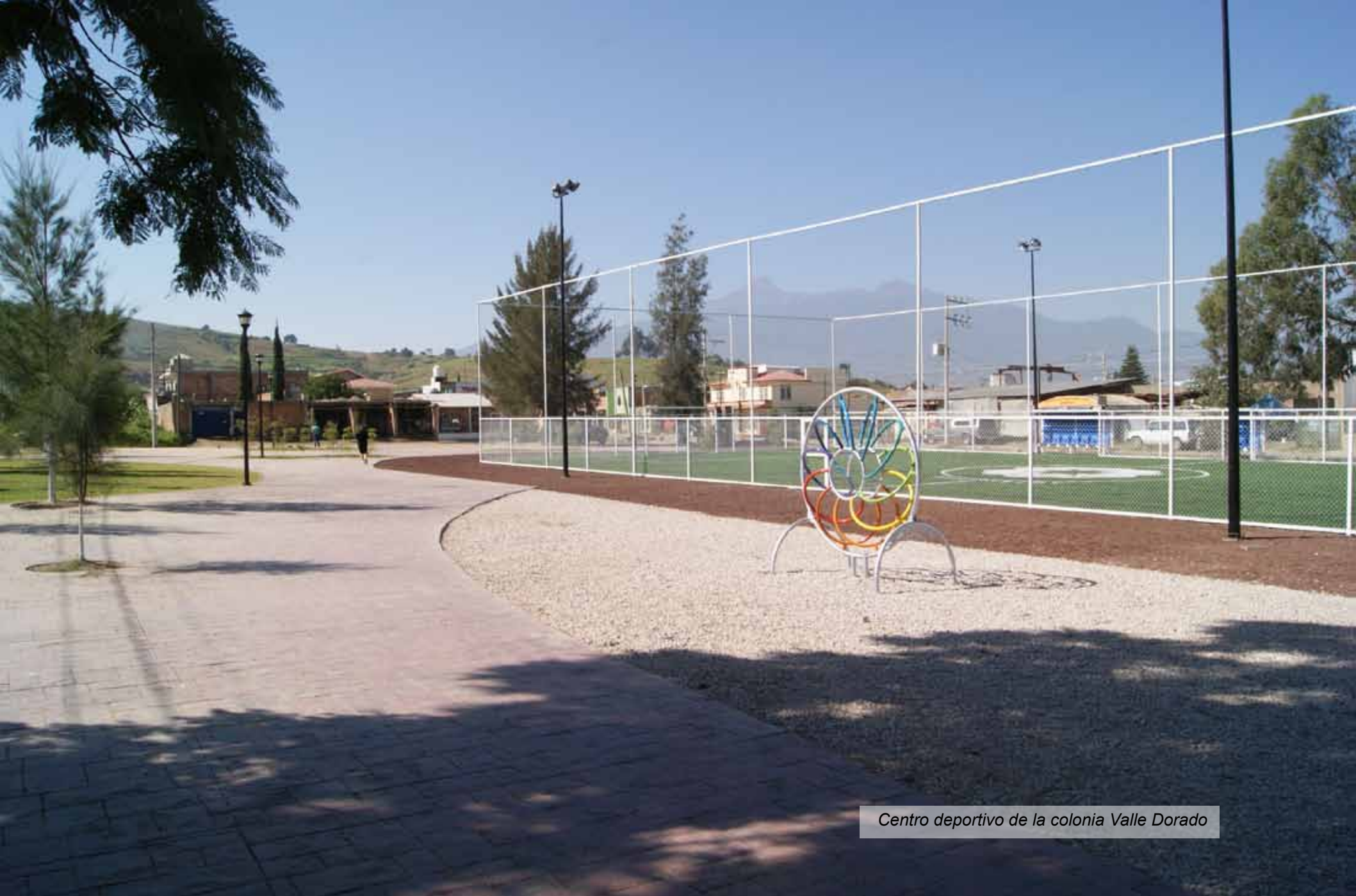
Centro deportivo de la colonia Valle Dorado