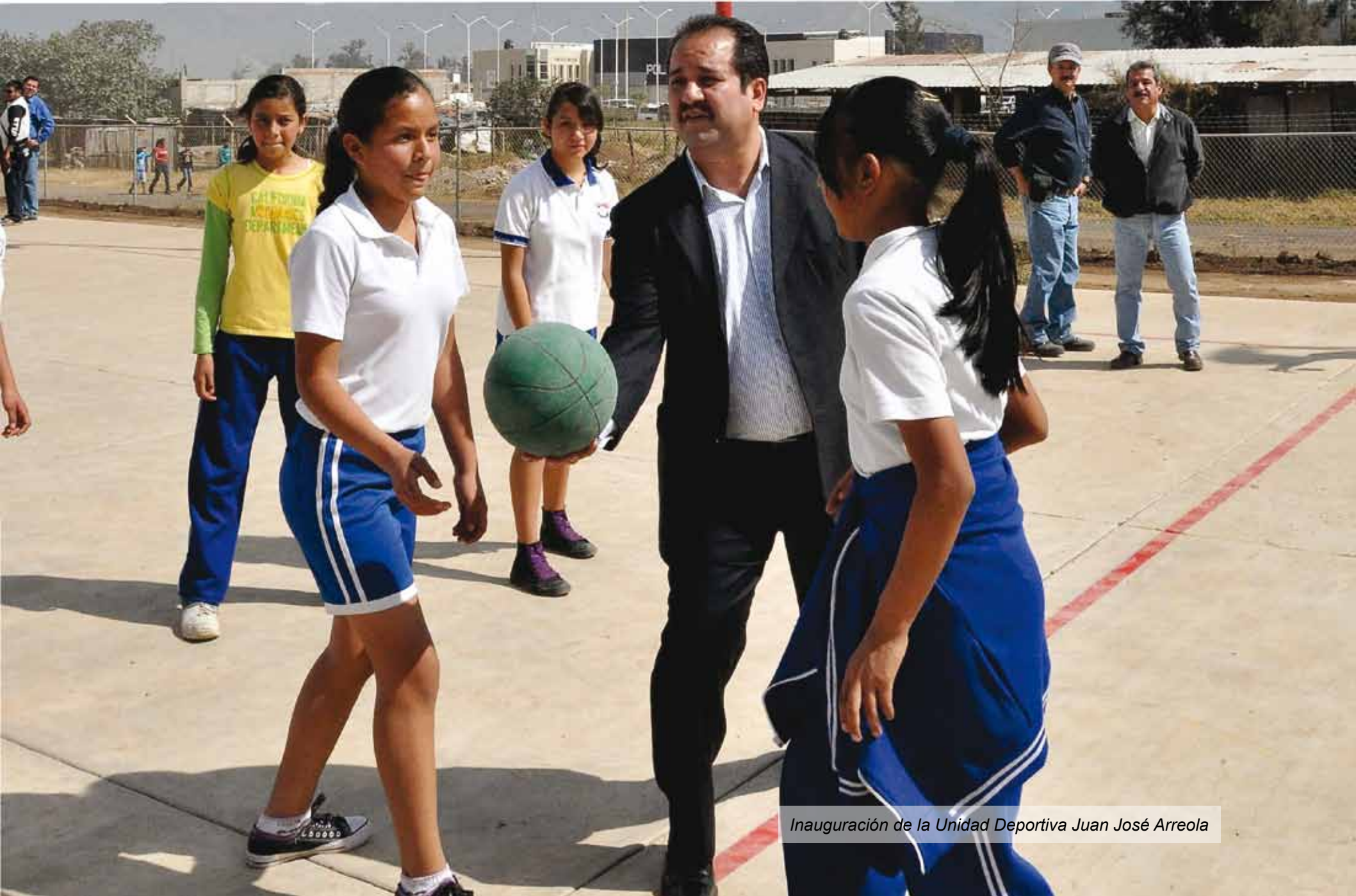
Inauguración de la Unidad Deportiva Juan José Arreola