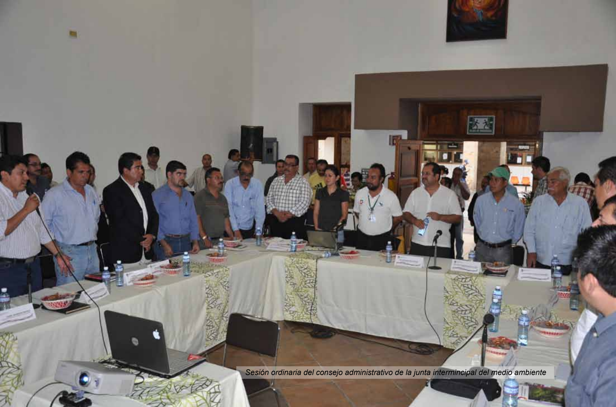
Sesión ordinaria del consejo administrativo de la junta intermunicipal del medio ambiente