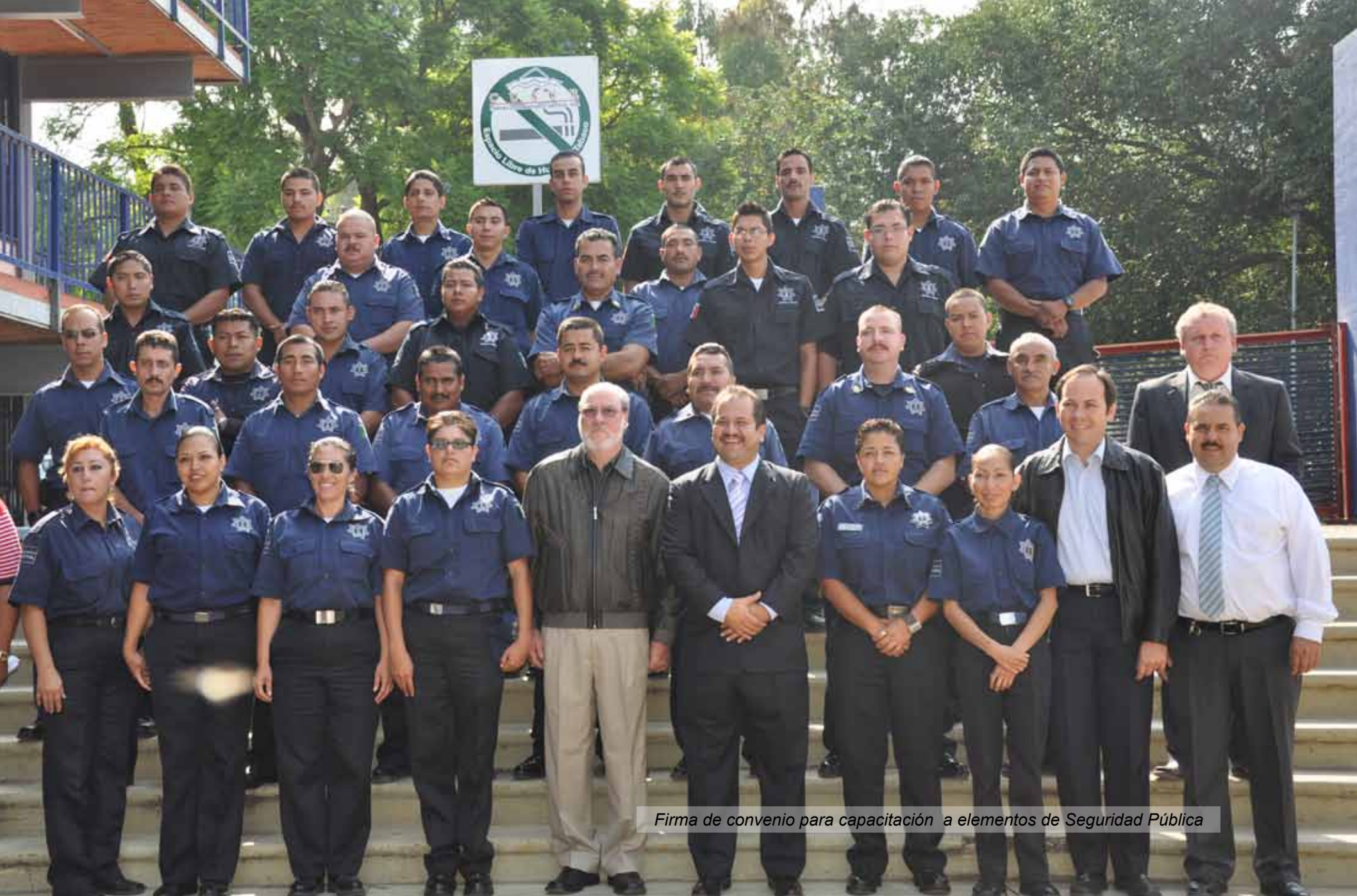
Firma de convenio para capacitación a elementos de Seguridad Pública