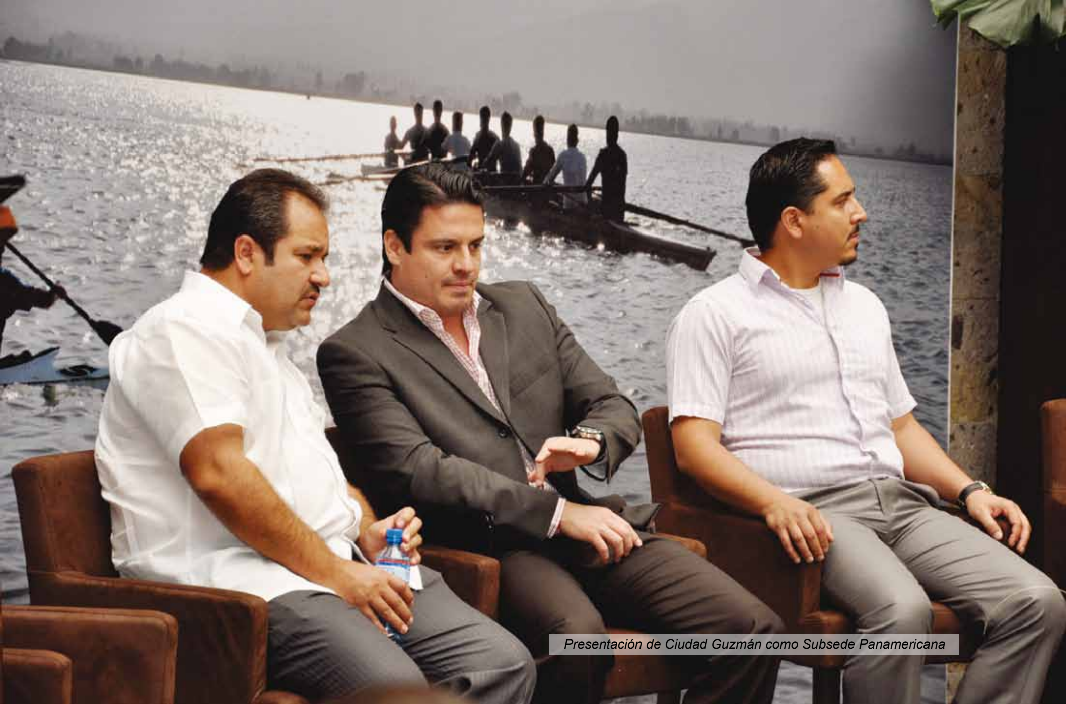
Presentación de Ciudad Guzmán como Subsede Panamericana