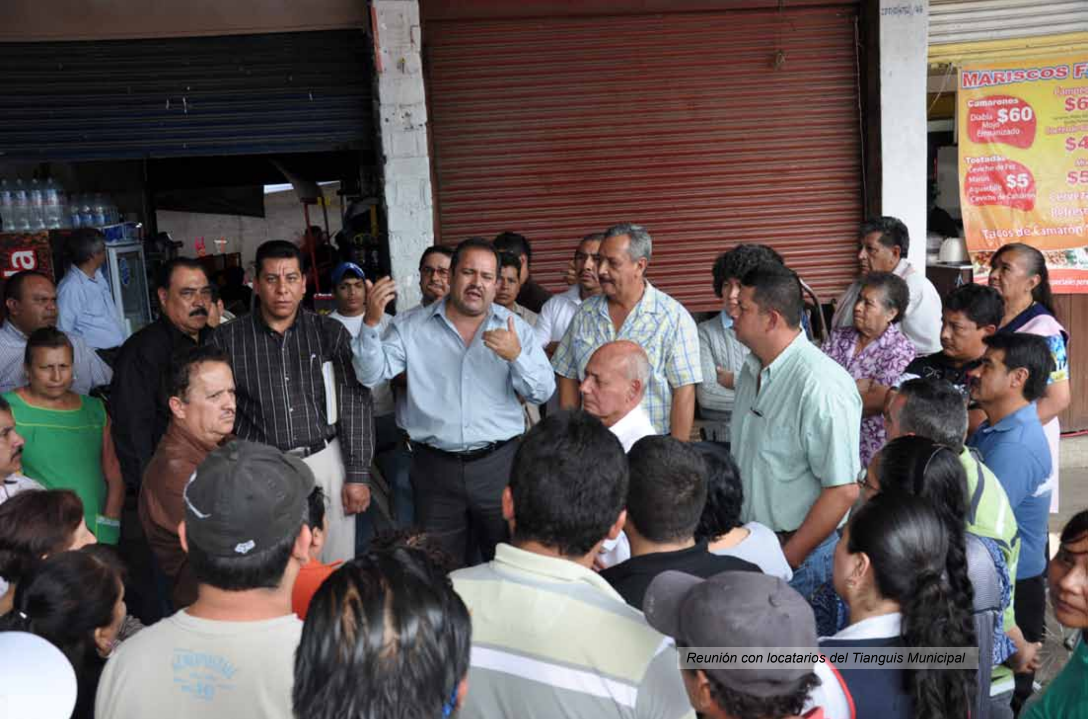
Reunión con locatarios del Tianguis Municipal