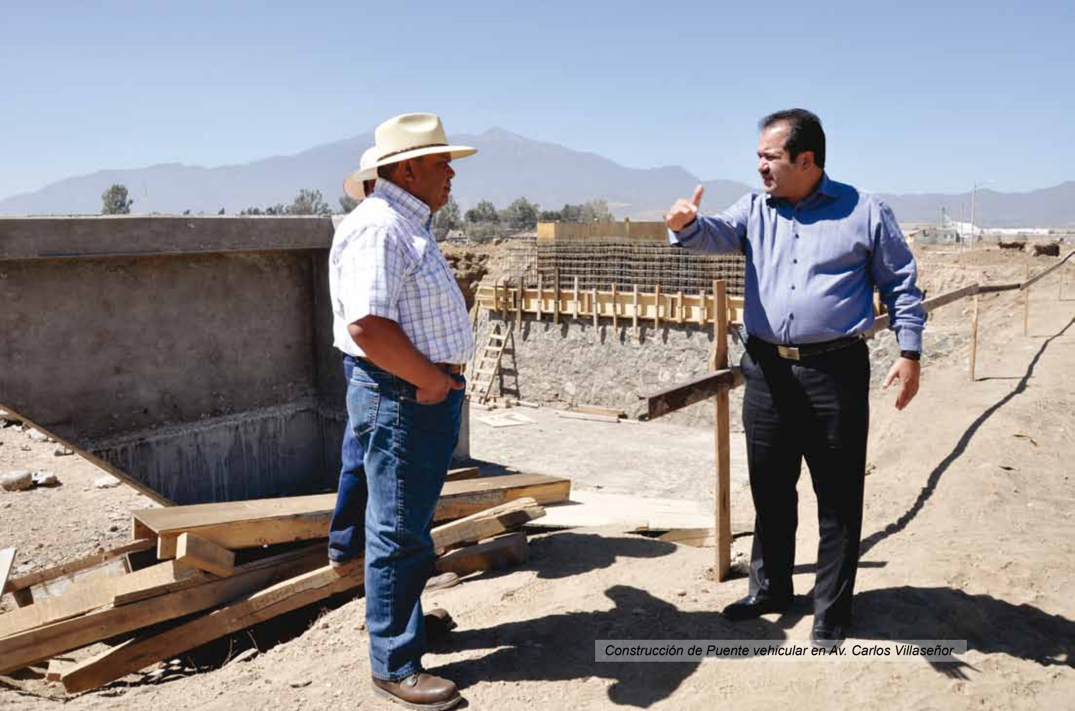
Construcción de Puente vehicular en Av. Carlos Villaseñor