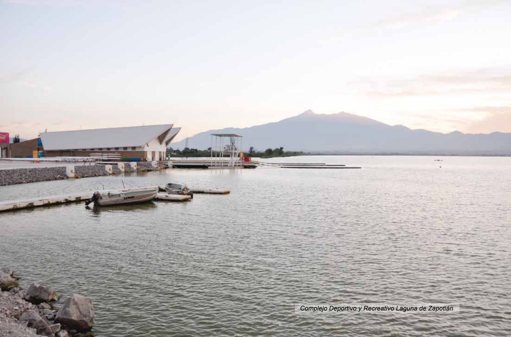
Complejo Deportivo y Recreativo Laguna de Zapotlán