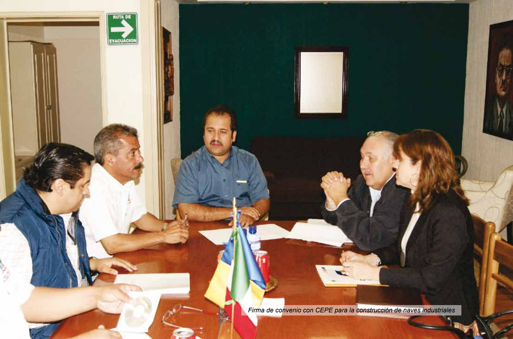
Firma de convenio con CEPE para la construcción de naves industriales