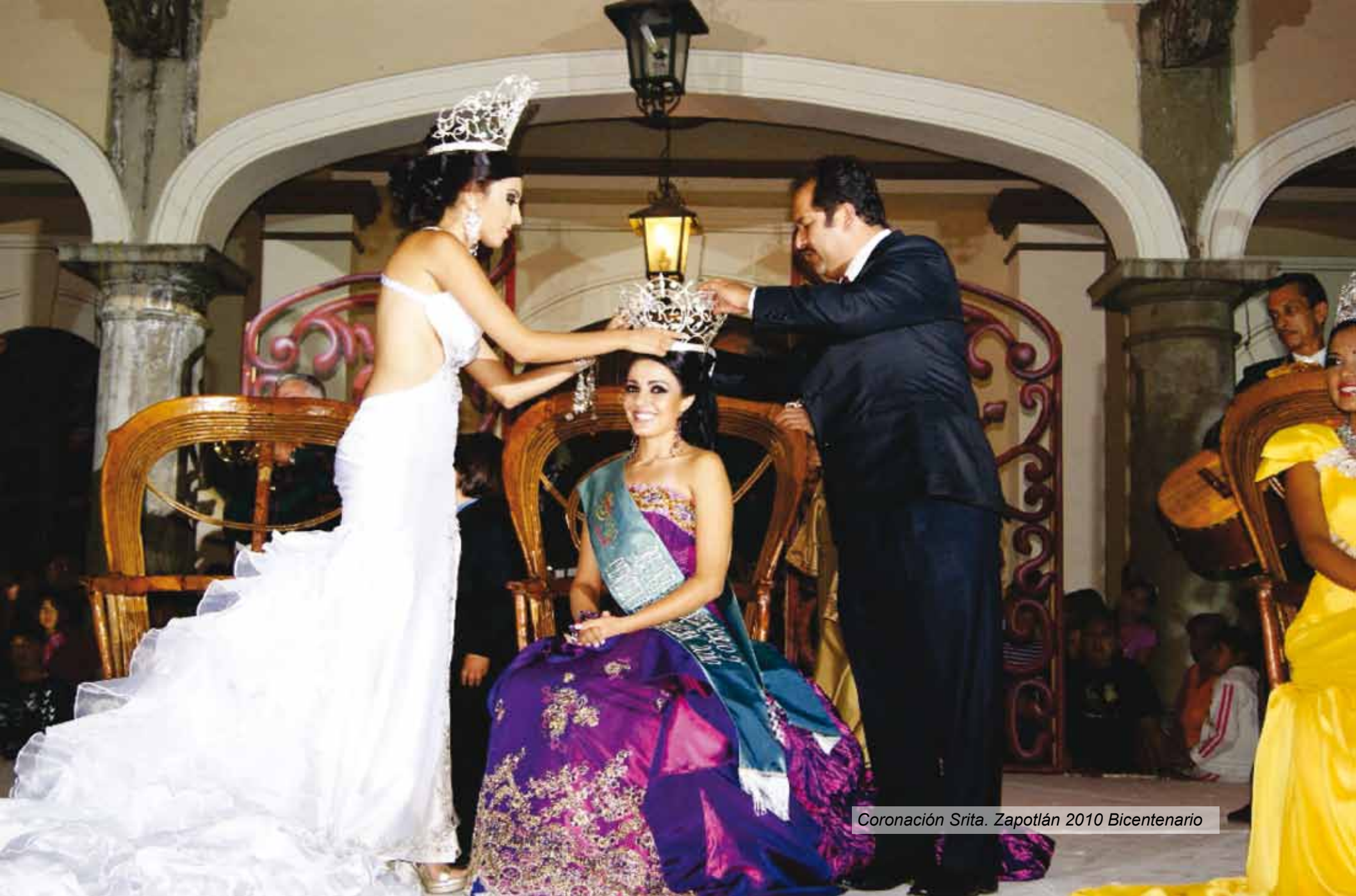
Coronación Srta. Zapotlán 2010 Bicentenario