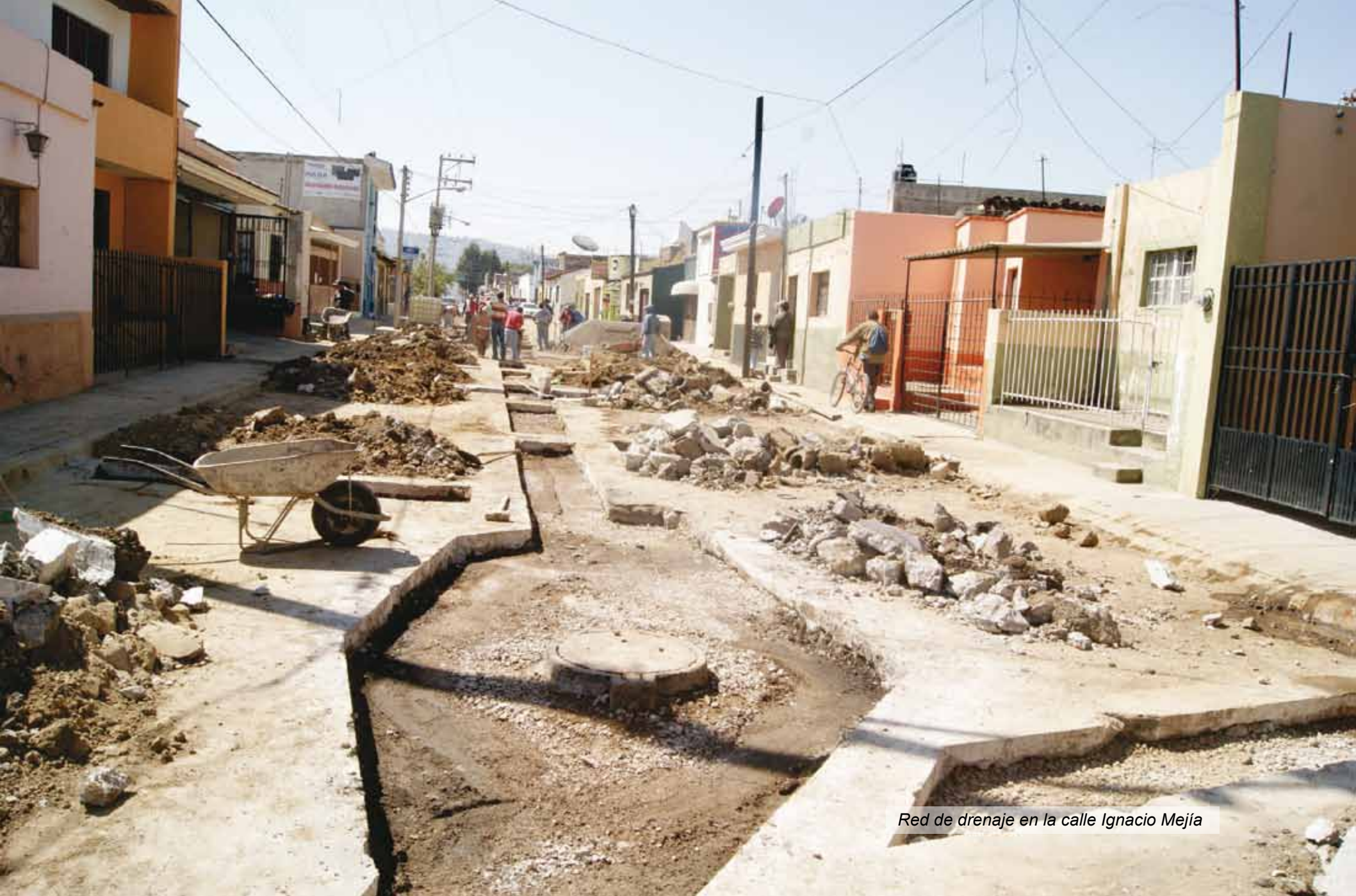
Red de drenaje en la calle Ignacio Mejía