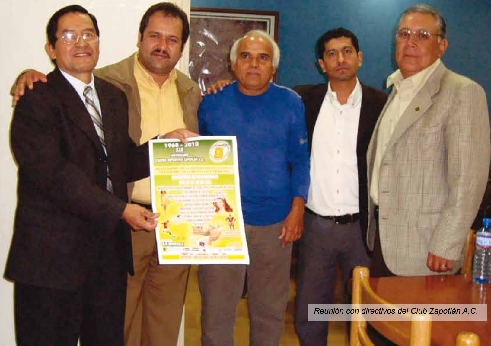
Reunión con directivos del Club Zapotlán A.C.