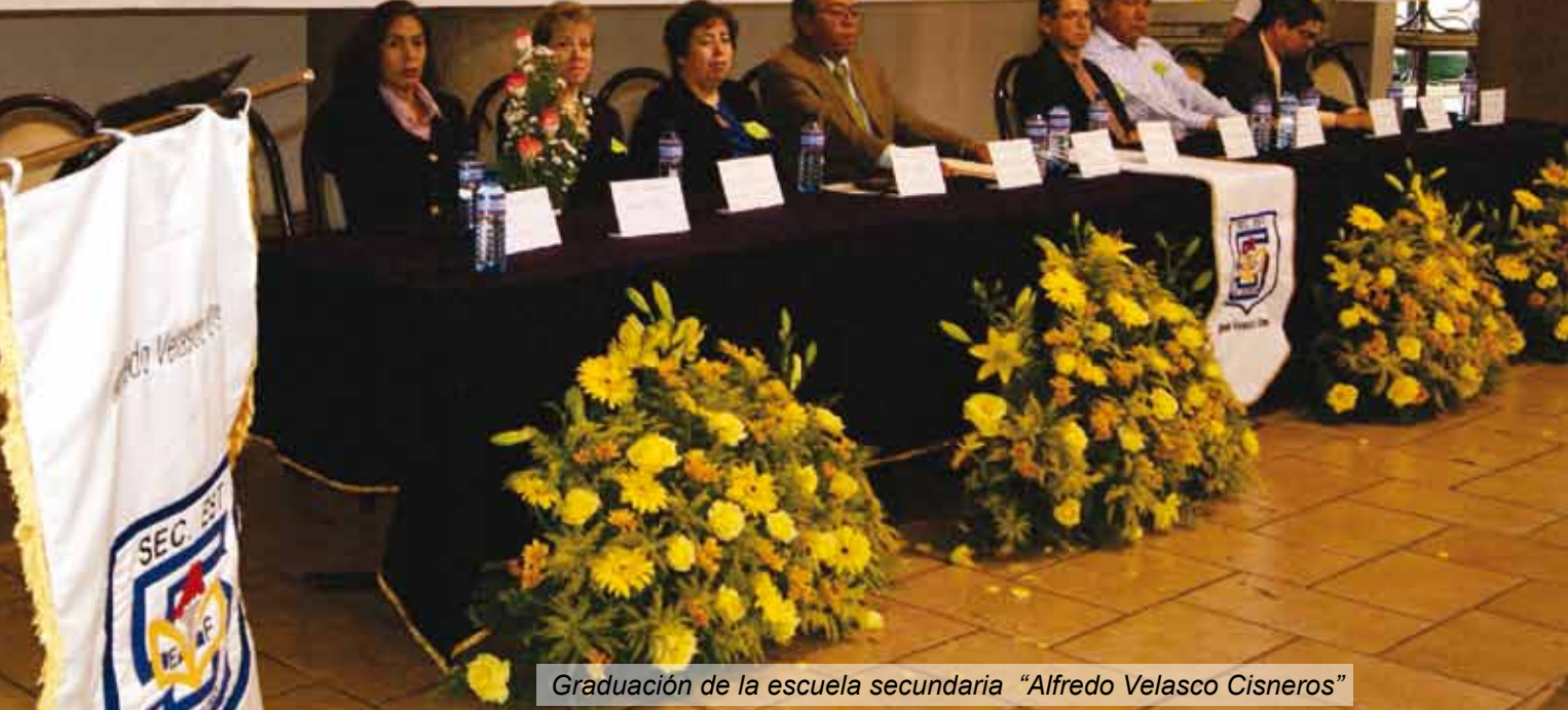
Graduación de la escuela secundaria "Alfredo Velasco Cisneros"