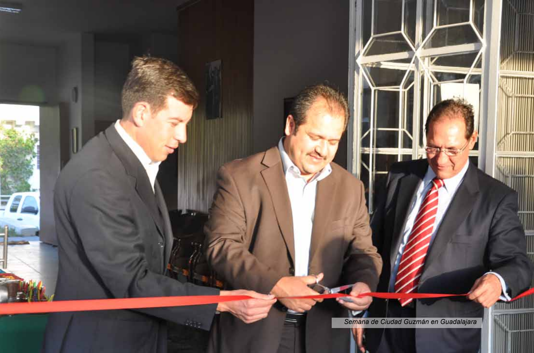
Semana de Ciudad Guzmán en Guadalajara