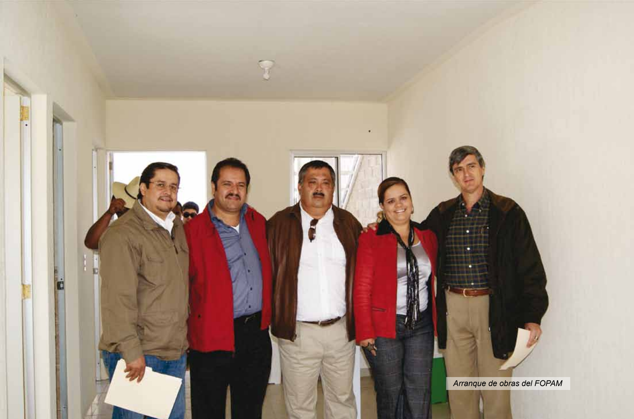
Arranque de obras del FOPAM