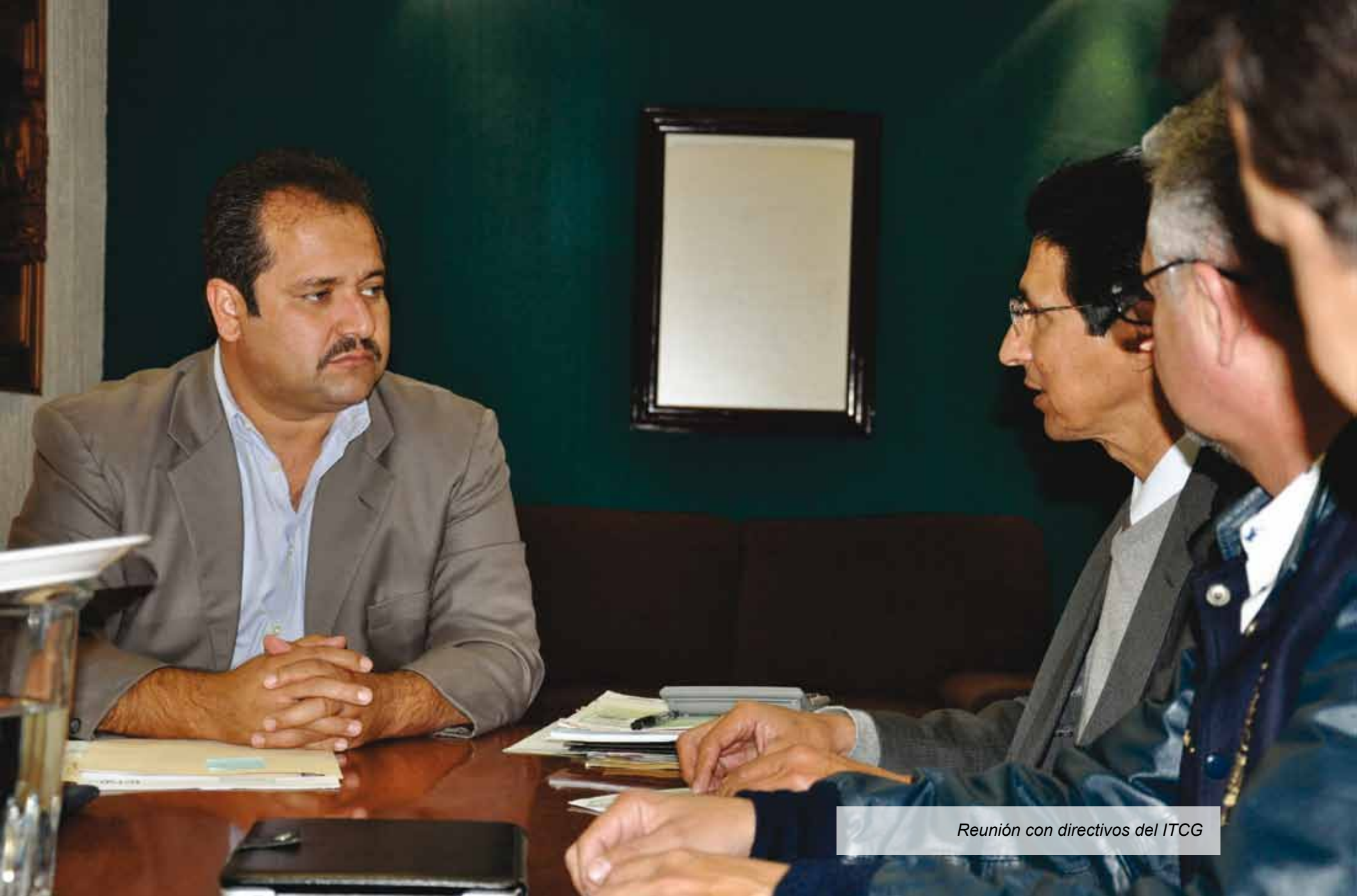
Reunión con directivos del ITCG