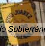
Trabajos de cableado Subterráneo