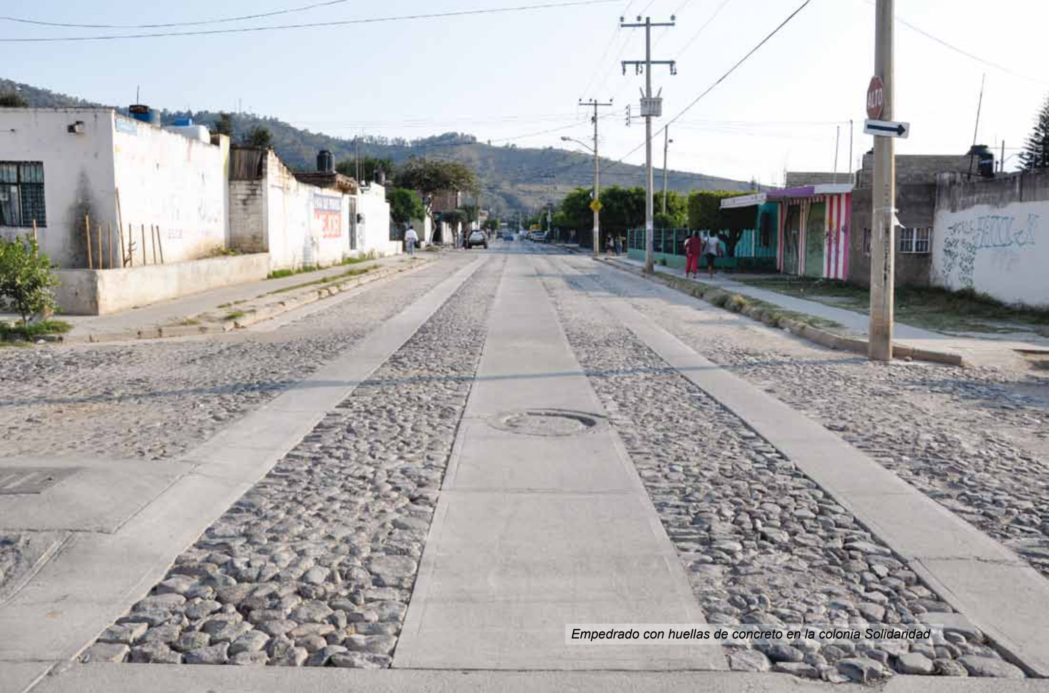
Empedrado con huellas de concreto en la colonia Solidaridad