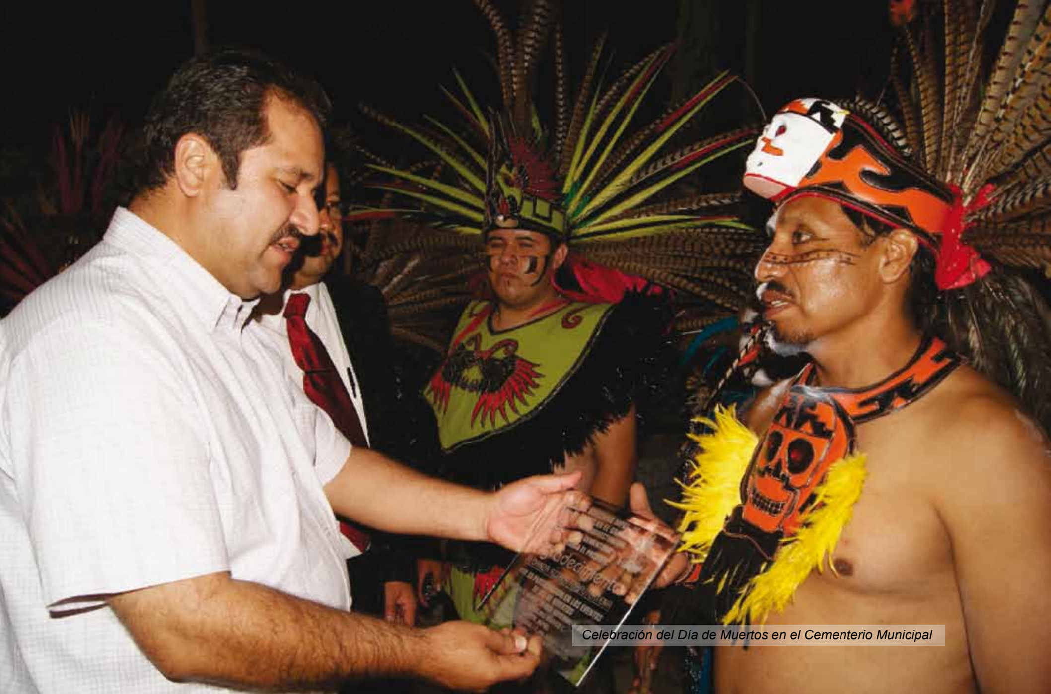
Celebración del Día de Muertos en el Cementerio Municipal