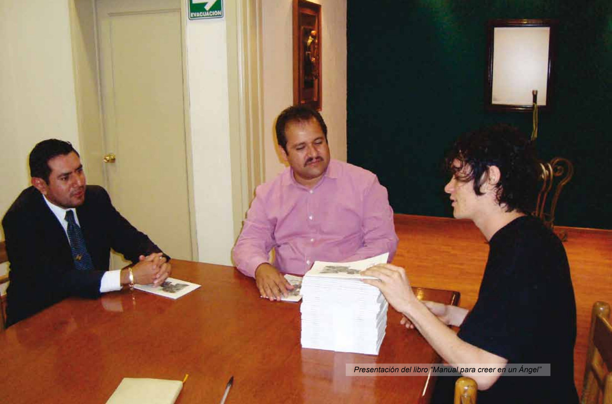
Presentación del libro "Manual para creer en un Ángel"