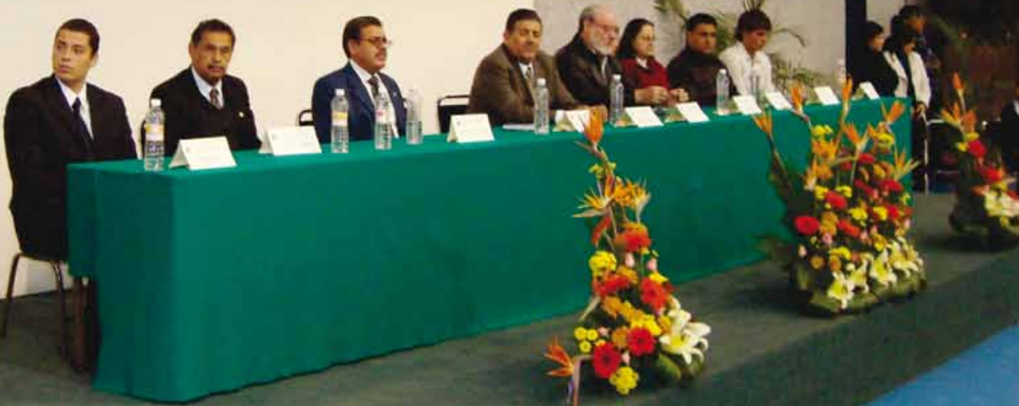
Graduación de la Escuela Preparatoria Regional de Ciudad Guzmán