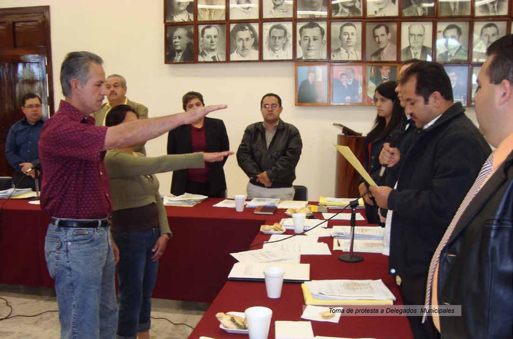
Toma de protesta a Delegados Municipales