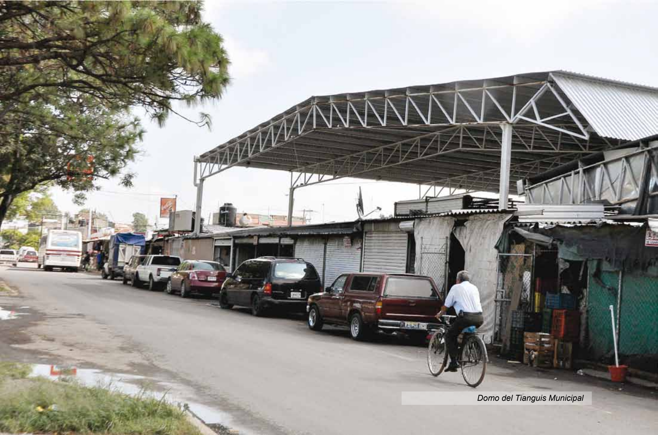
Domo del Tianguis Municipal