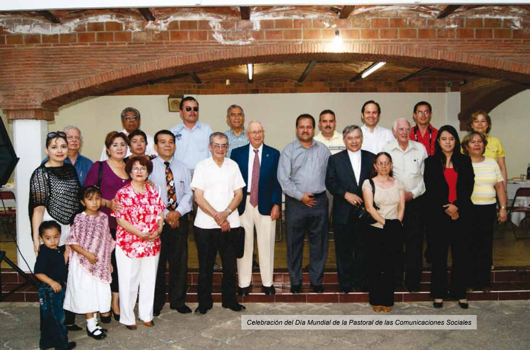
Celebración del Día Mundial de la Pastoral de las Comunicaciones Sociales