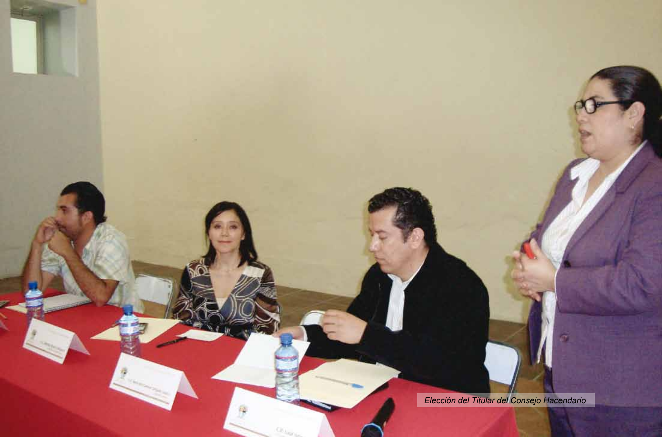
Elección del Titular del Consejo Hacendario