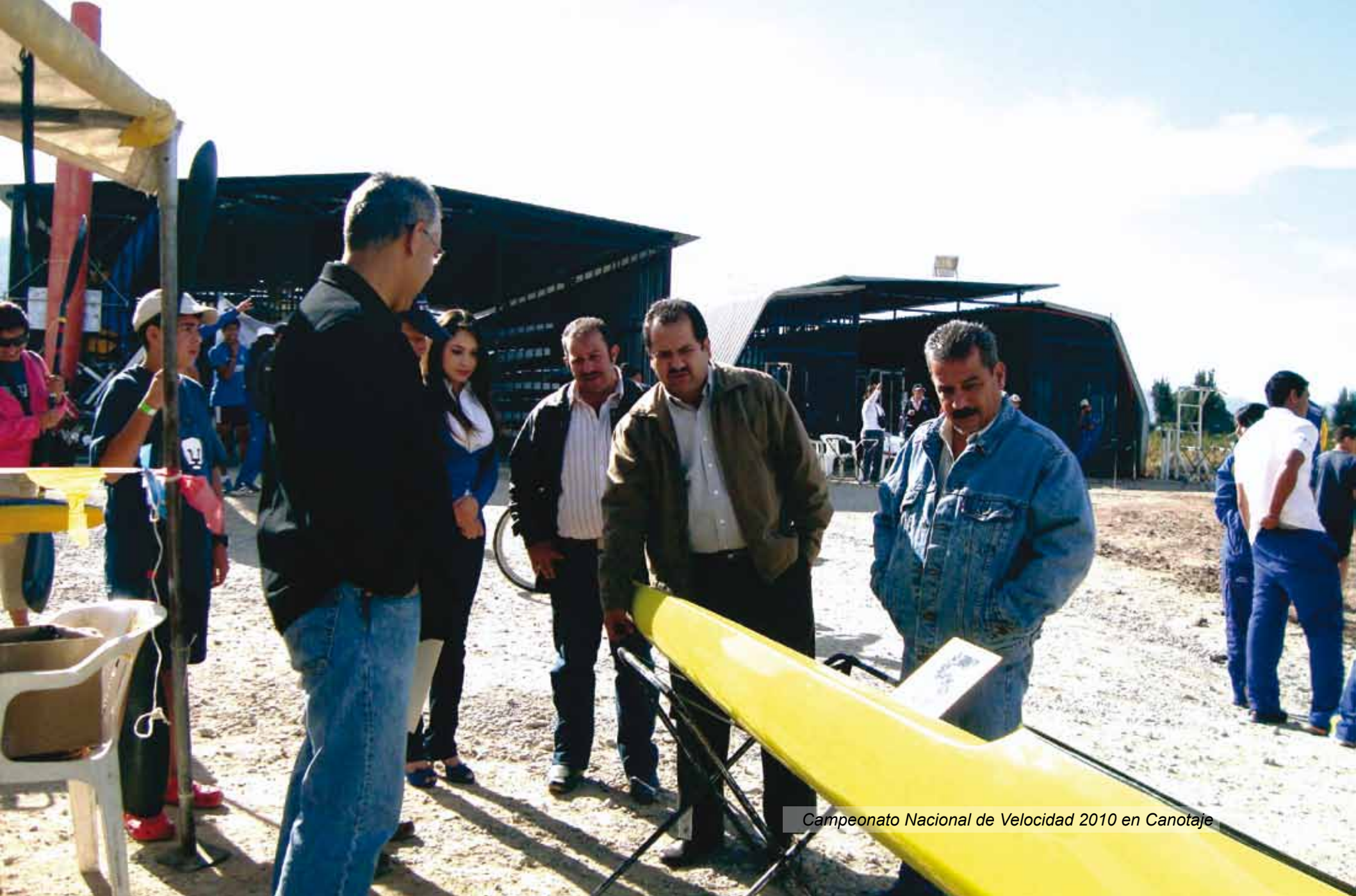
Campeonato Nacional de Velocidad 2010 en Canotaje