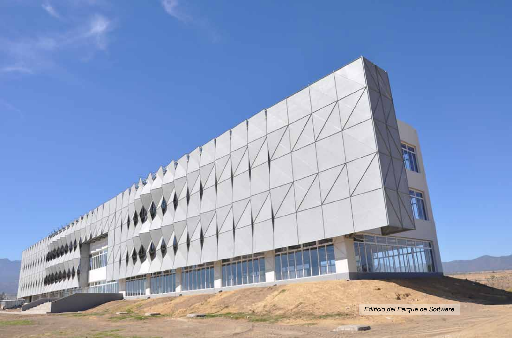
Edificio del Parque de Software