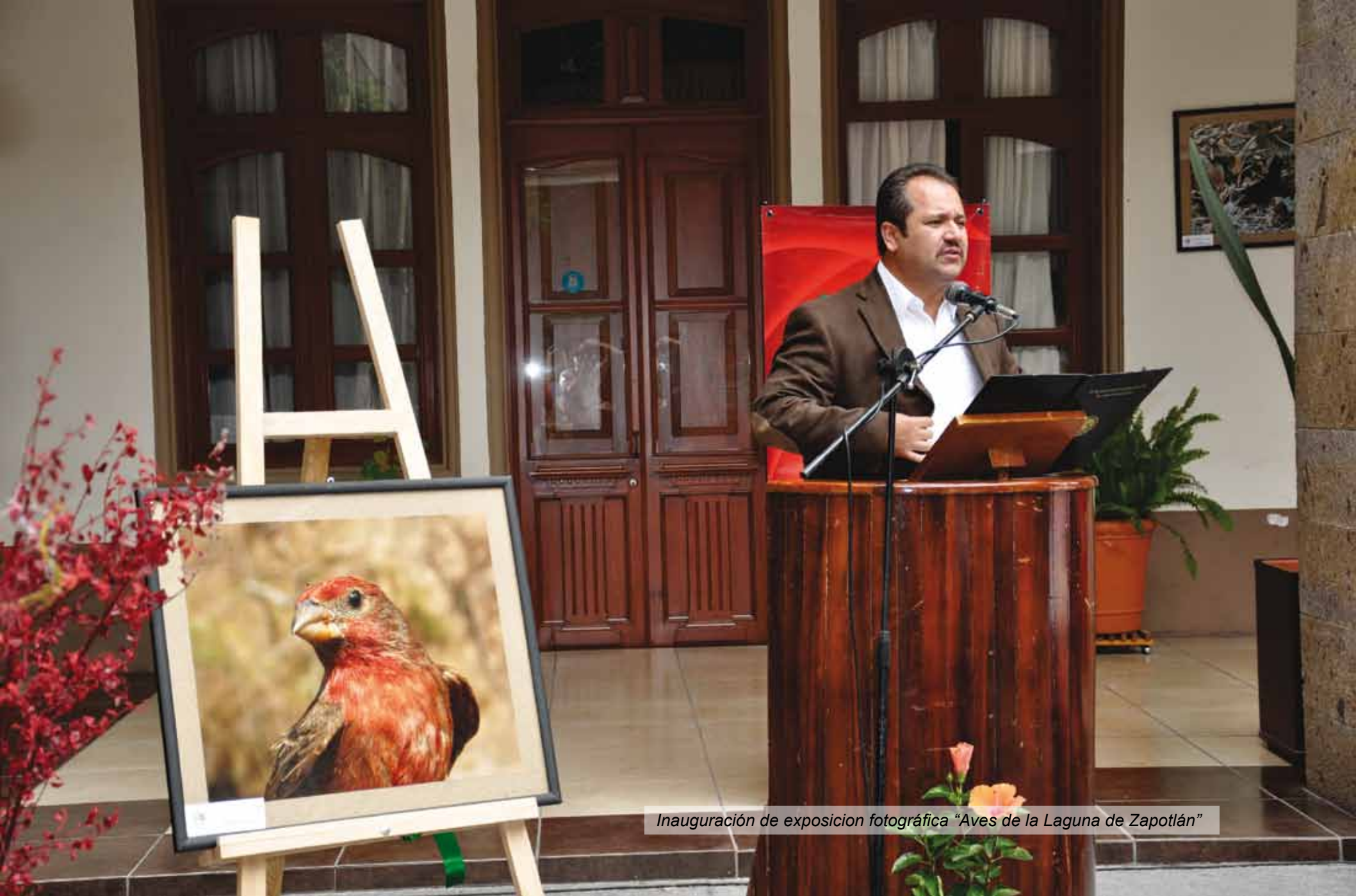
Inauguración de exposición fotográfica "Aves de la Laguna de Zapotlán"