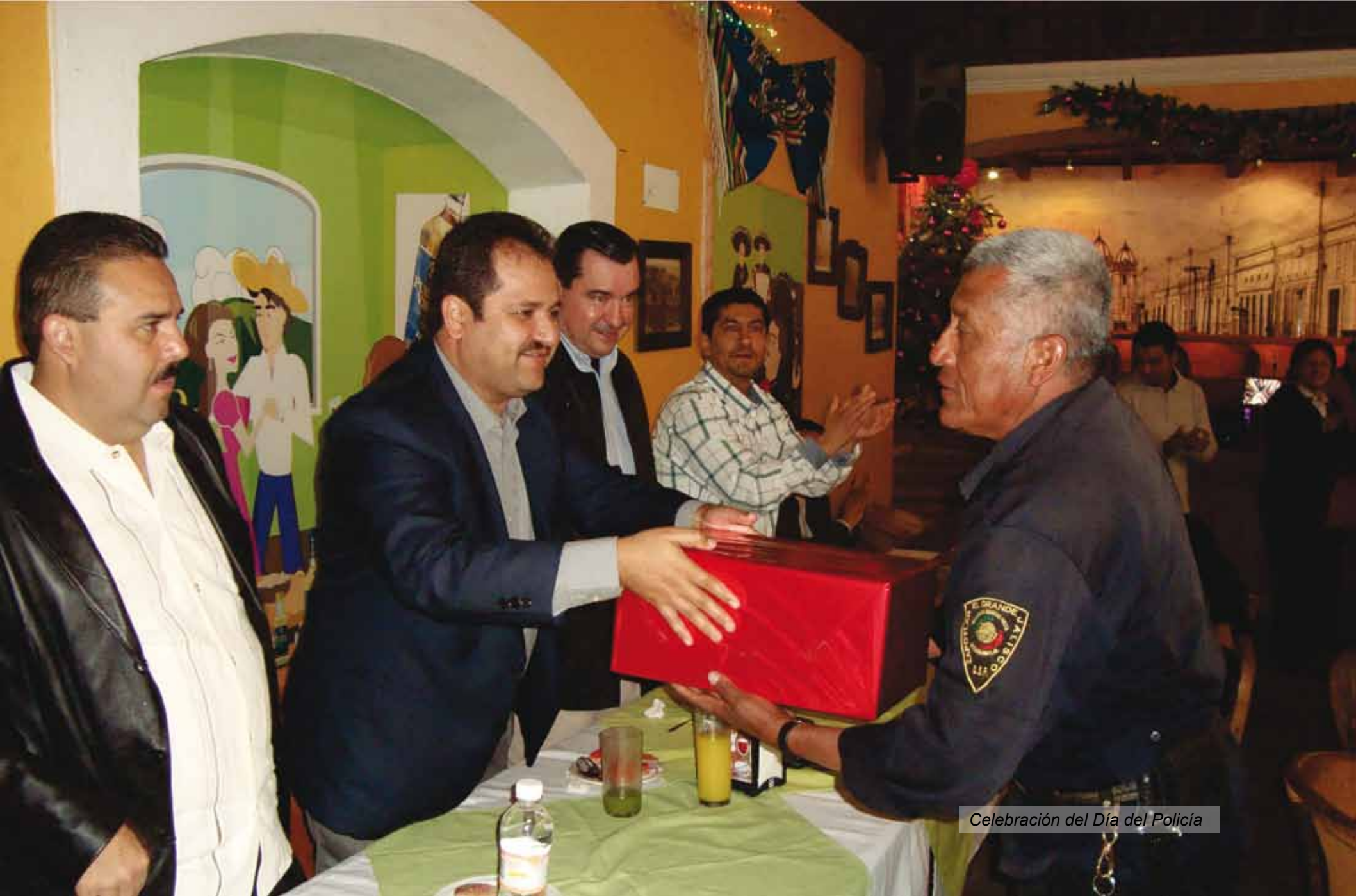
Celebración del Día del Policía