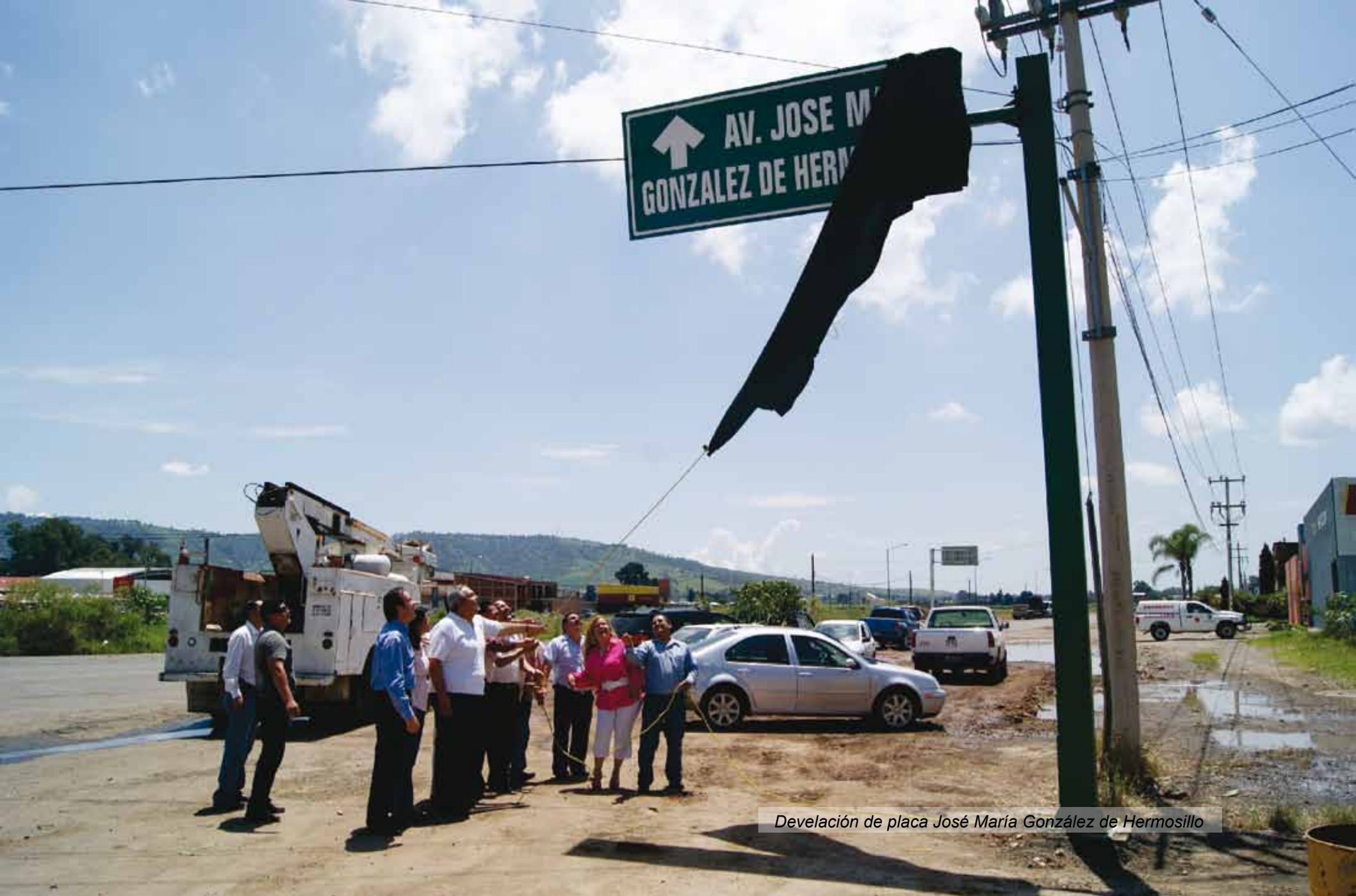
Develación de placa José María González de Hermosillo