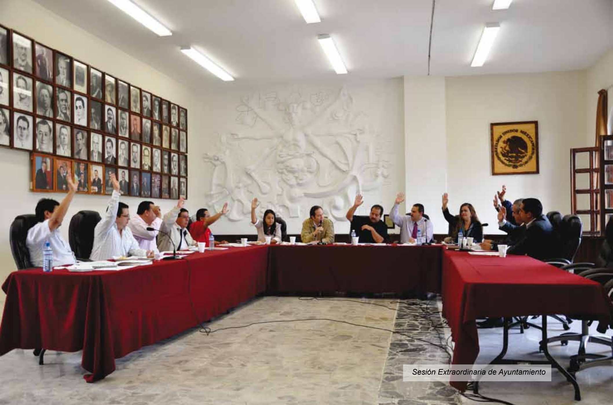
Sesión Extraordinaria de Ayuntamiento