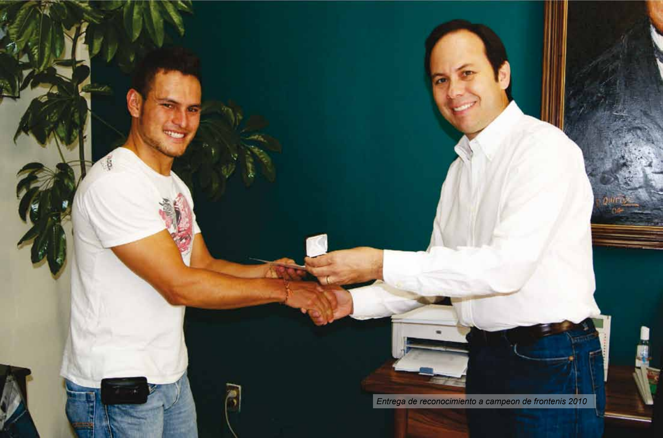
Entrega de reconocimiento a campeón de frontenis 2010