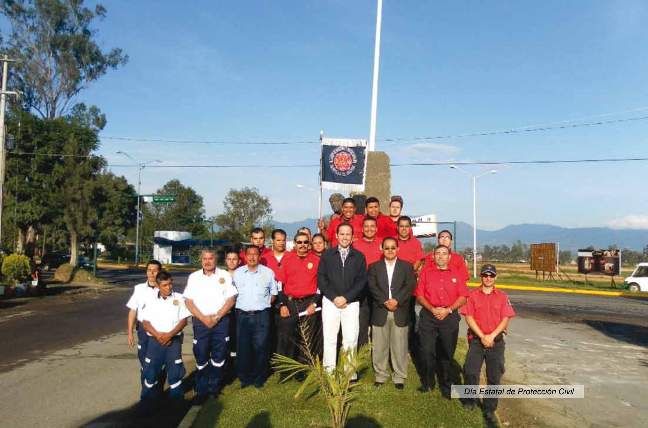
Día Estatal de Protección Civil