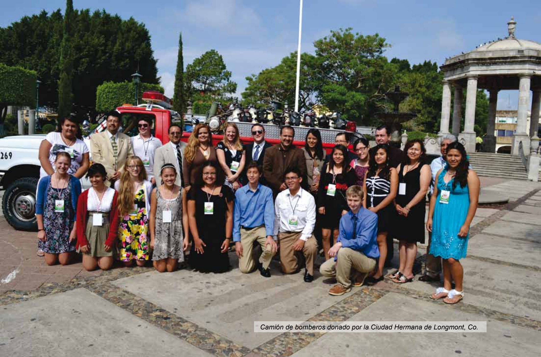
Camión de bomberos donado por la Ciudad Hermana de Longmont, Co.