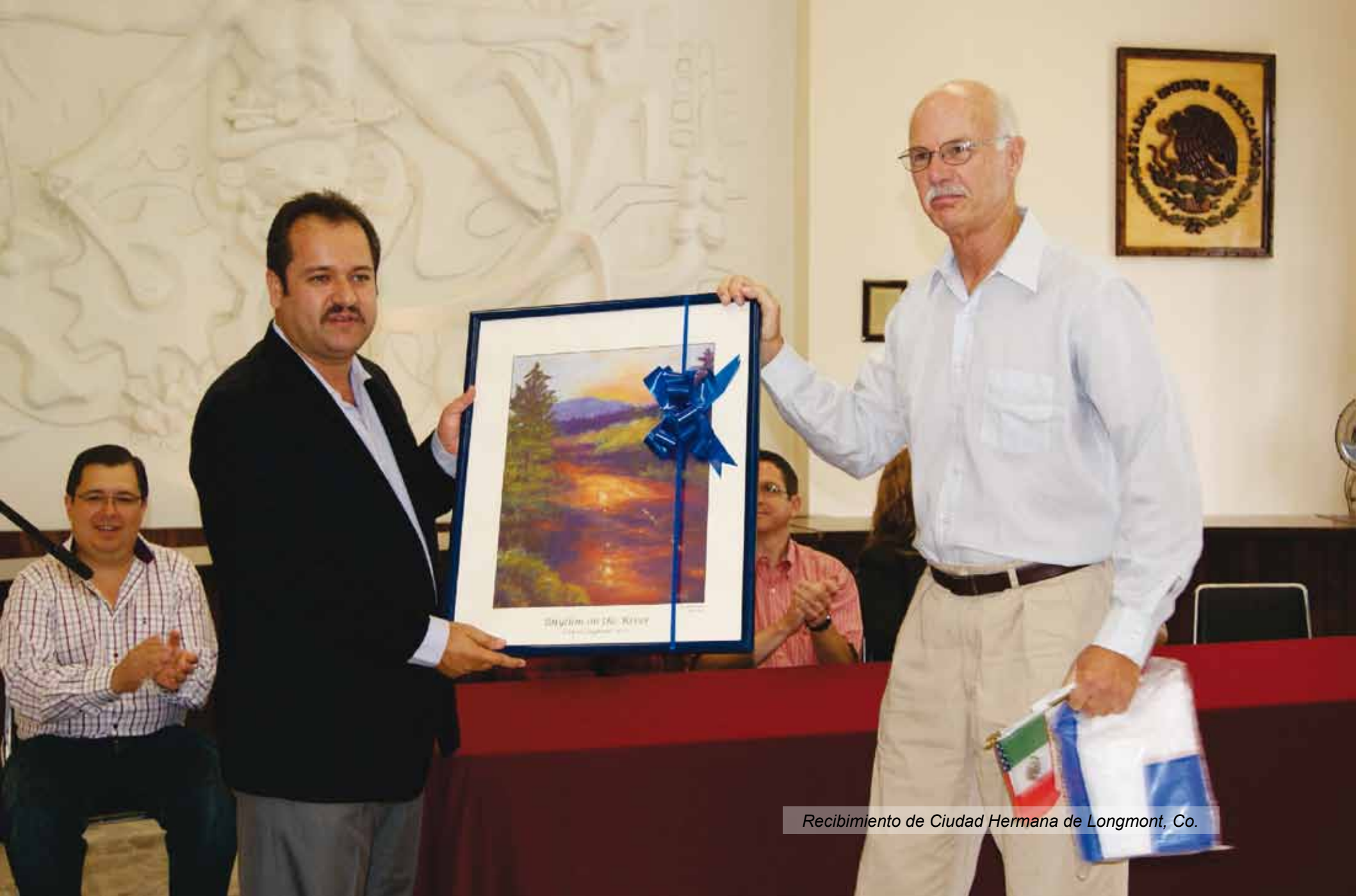
Recibimiento de Ciudad Hermana de Longmont, Co.