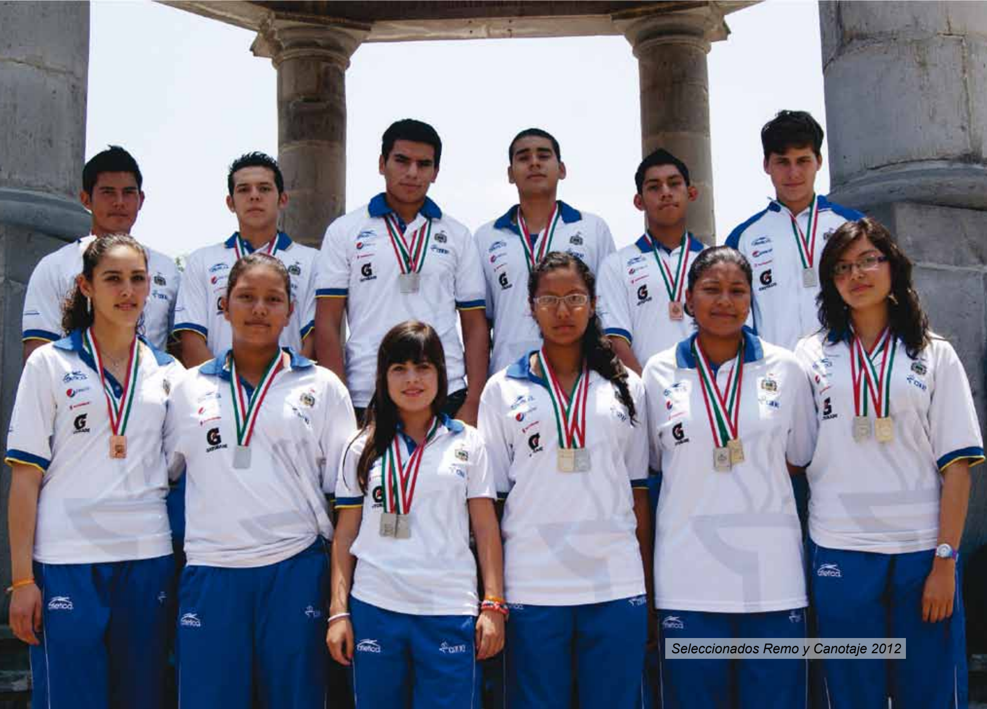
Seleccionados Remo y Canotaje 2012