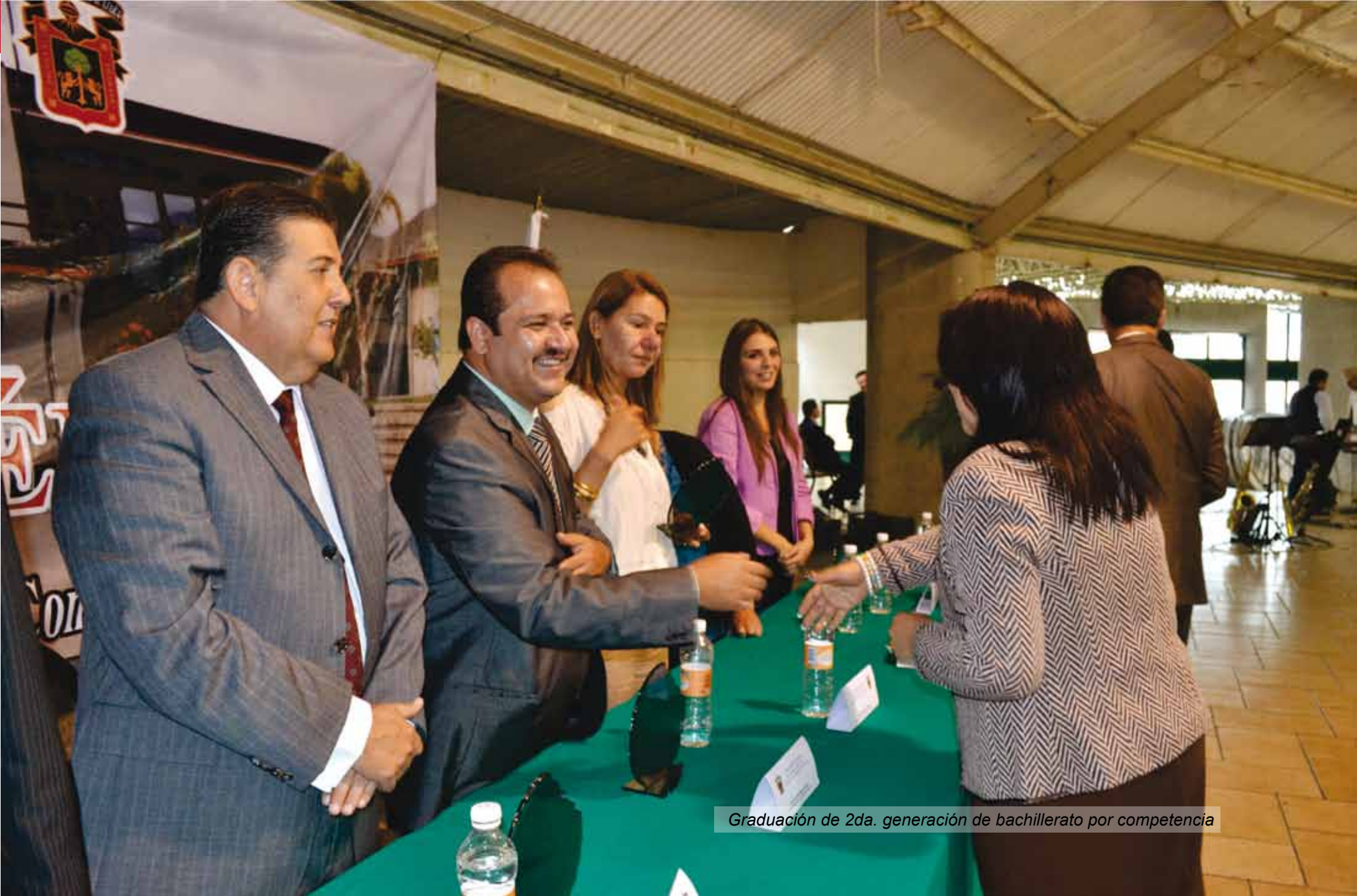
Graduación de 2da. generación de bachillerato por competencia