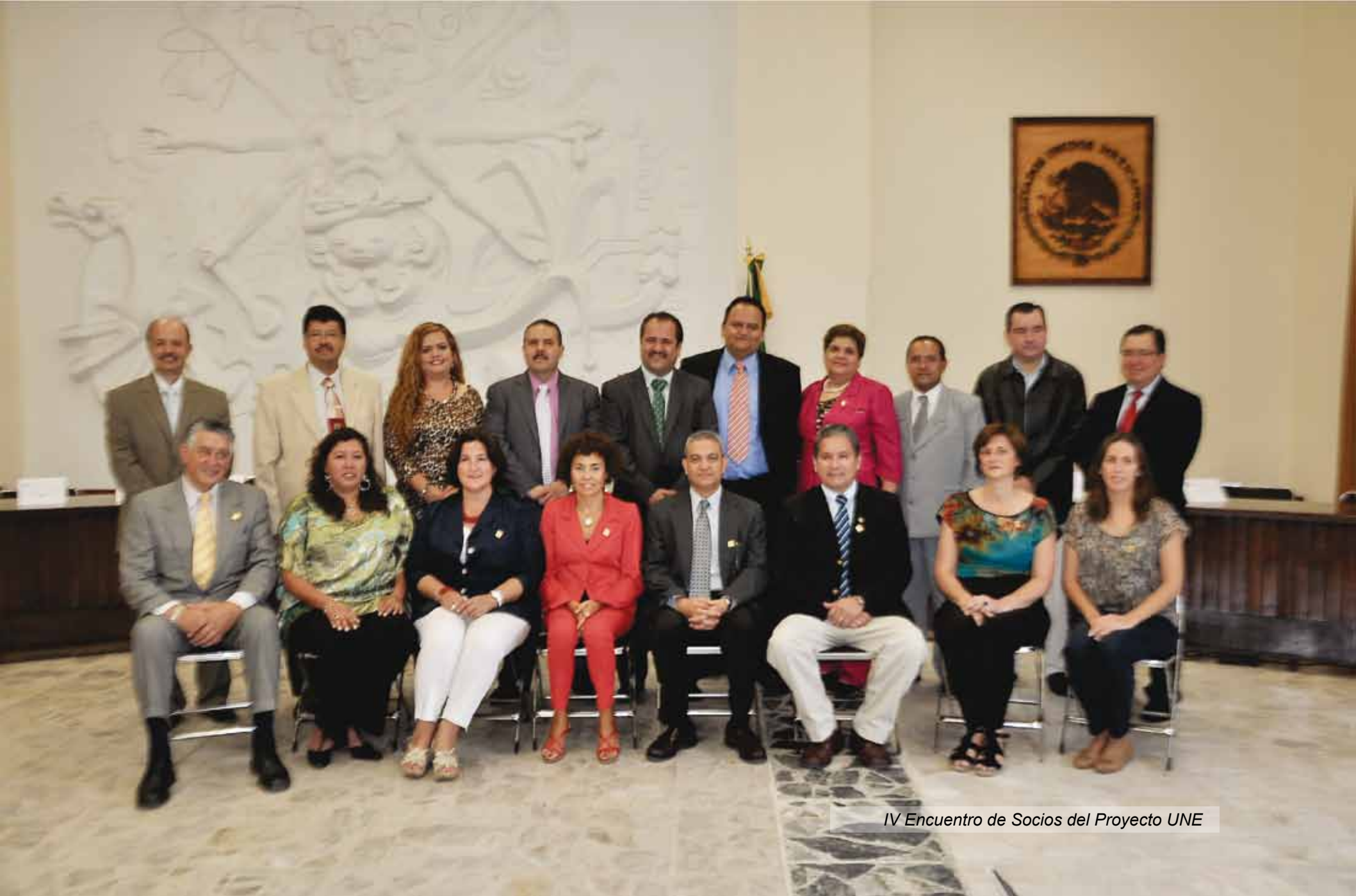
IV Encuentro de Socios del Proyecto UNE