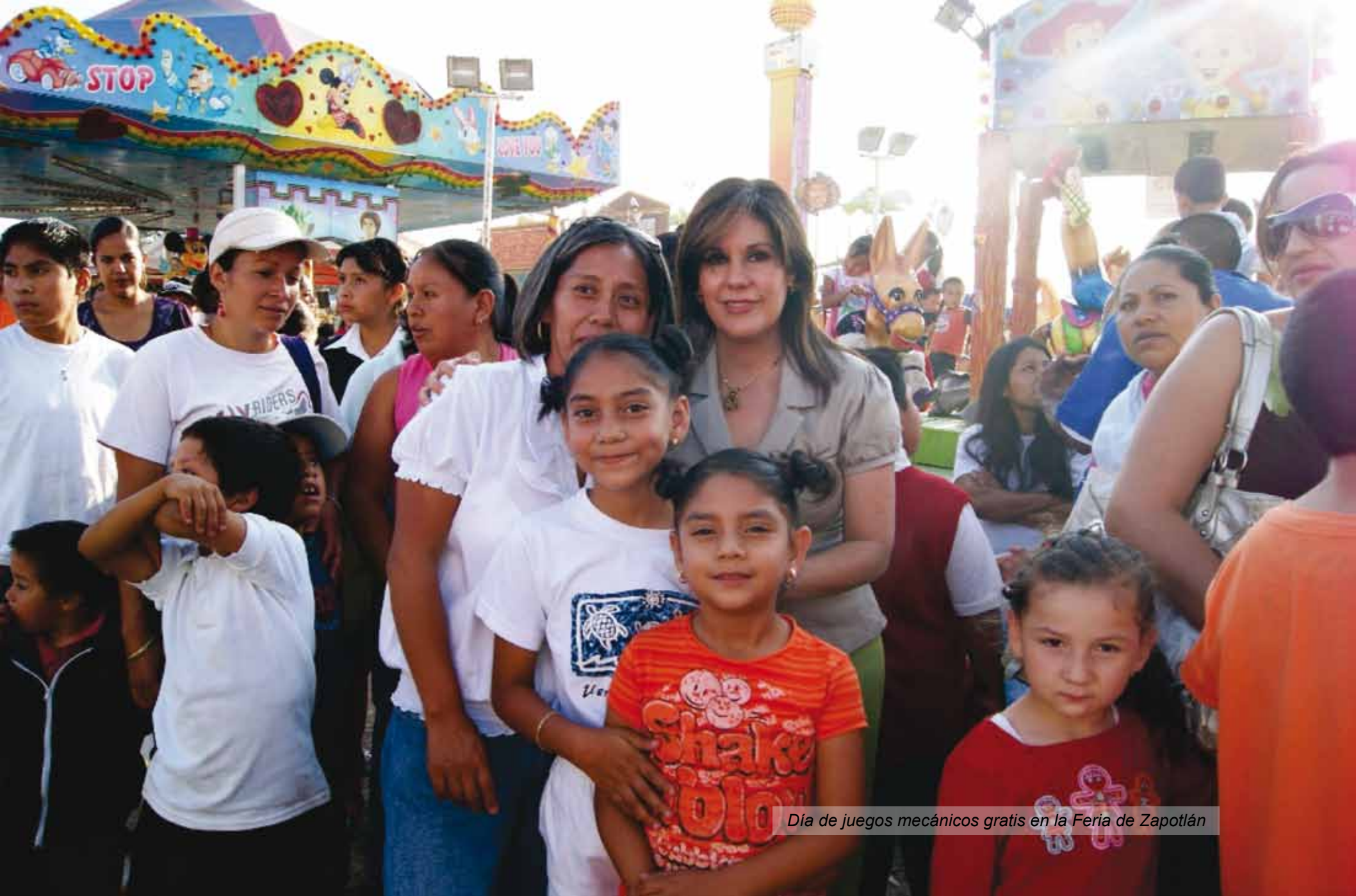
Día de juegos mecánicos gratis en la Feria de Zapotlán