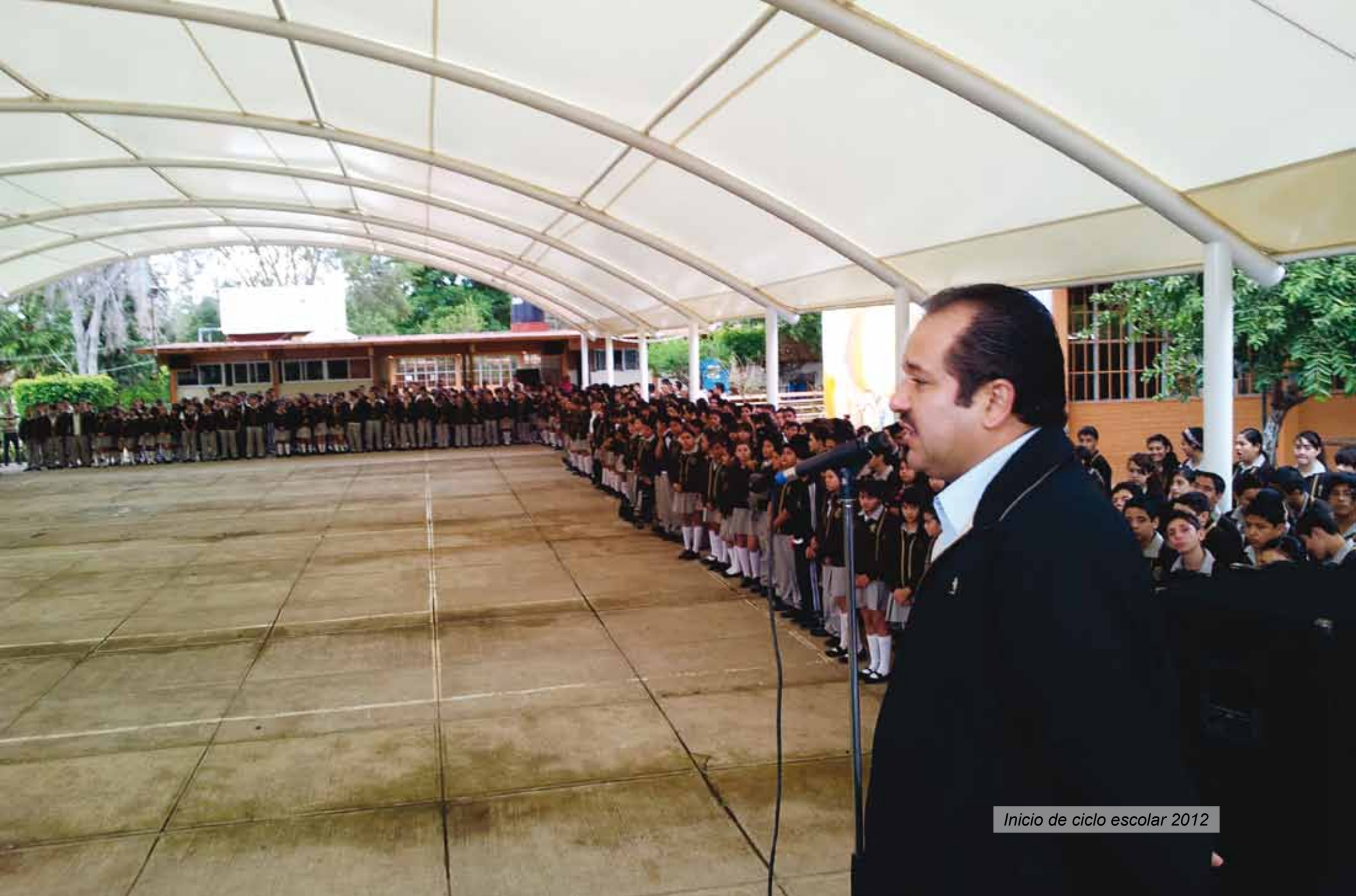
Inicio de ciclo escolar 2012