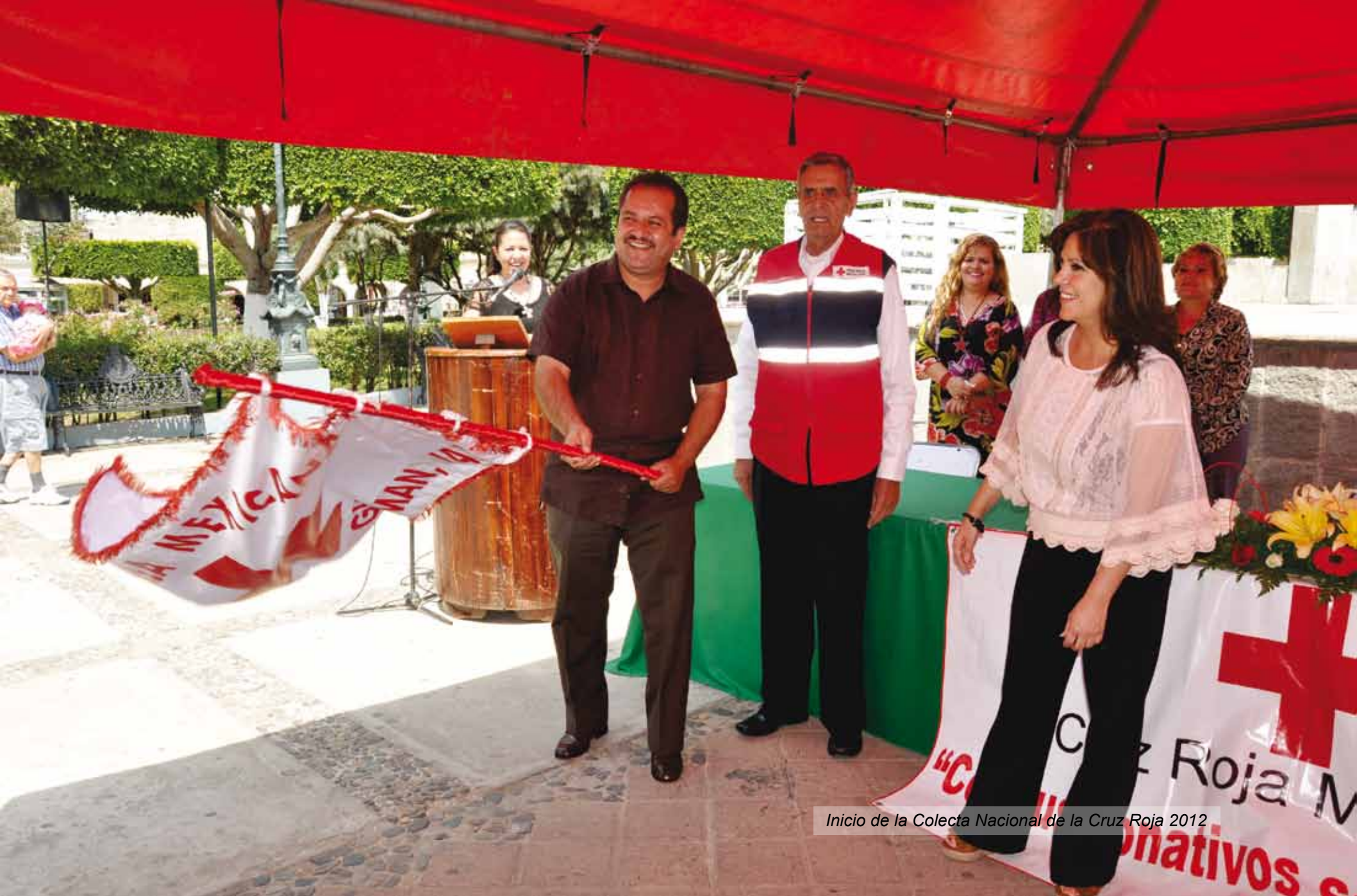
Inicio de la Colecta Nacional de la Cruz Roja 2012