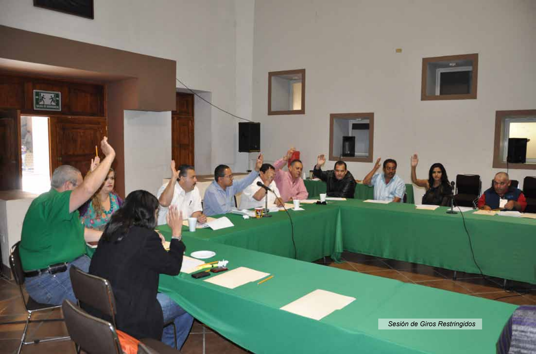
Sesión de Giros Restringidos