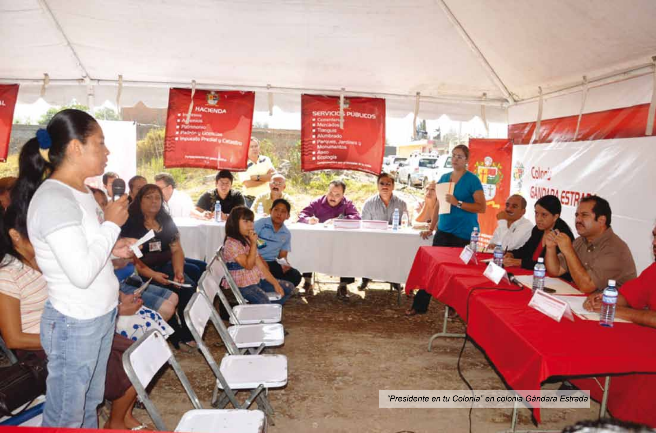
"Presidente en tu Colonia" en colonia Gándara Estrada