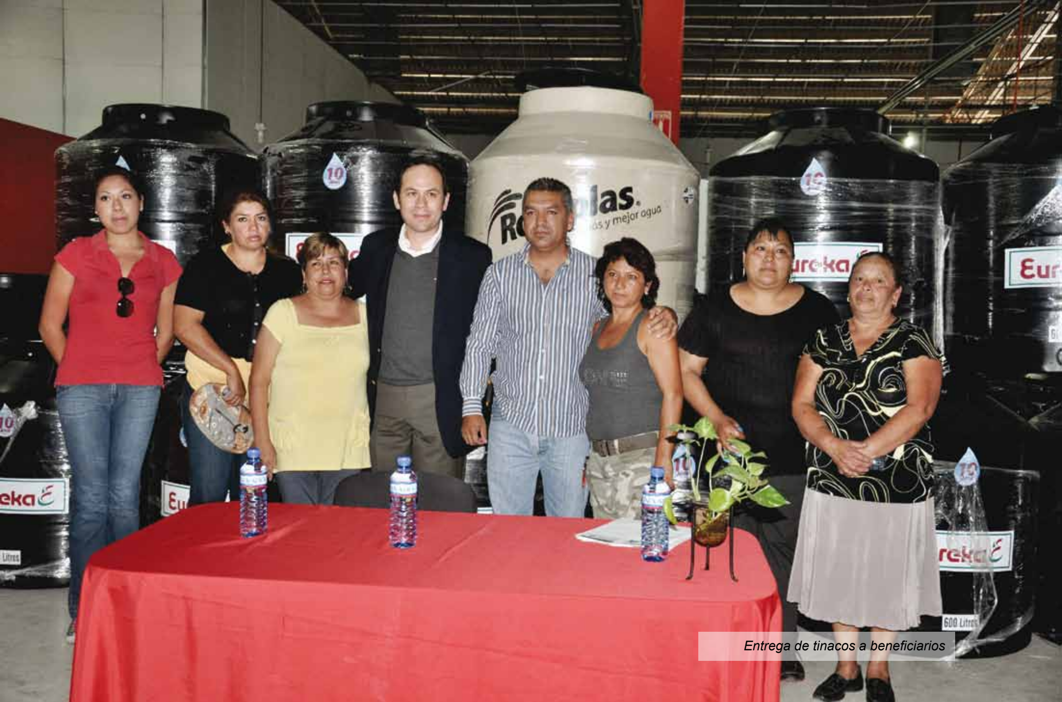
Entrega de tinacos a beneficiarios