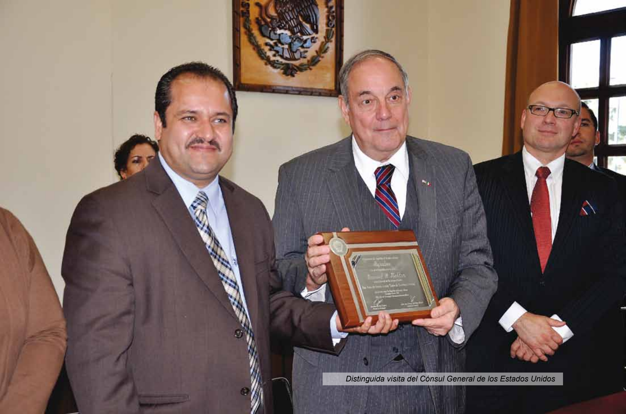
Distinguida visita del Cónsul General de los Estados Unidos