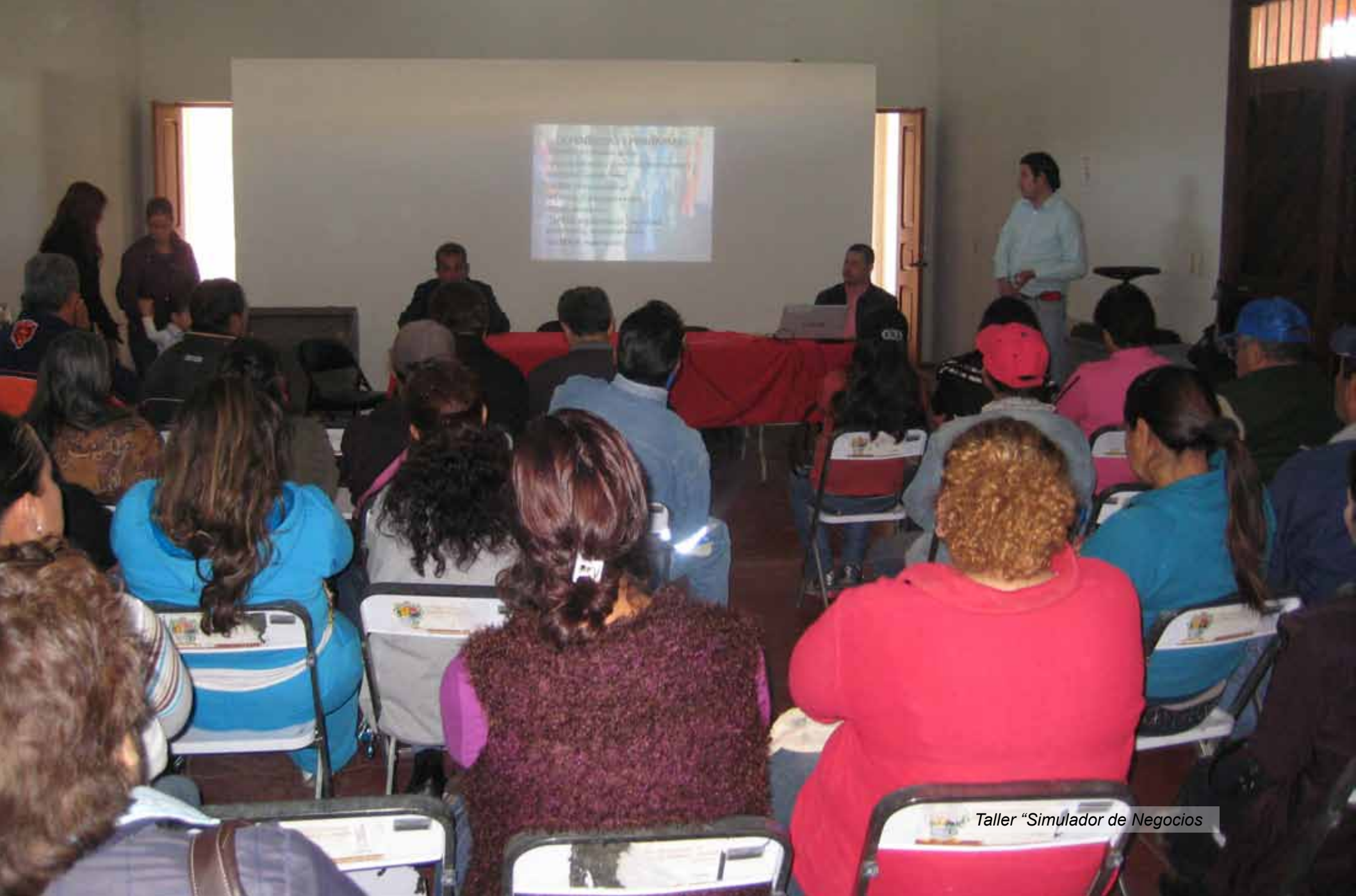
Taller "Simulador de Negocios"