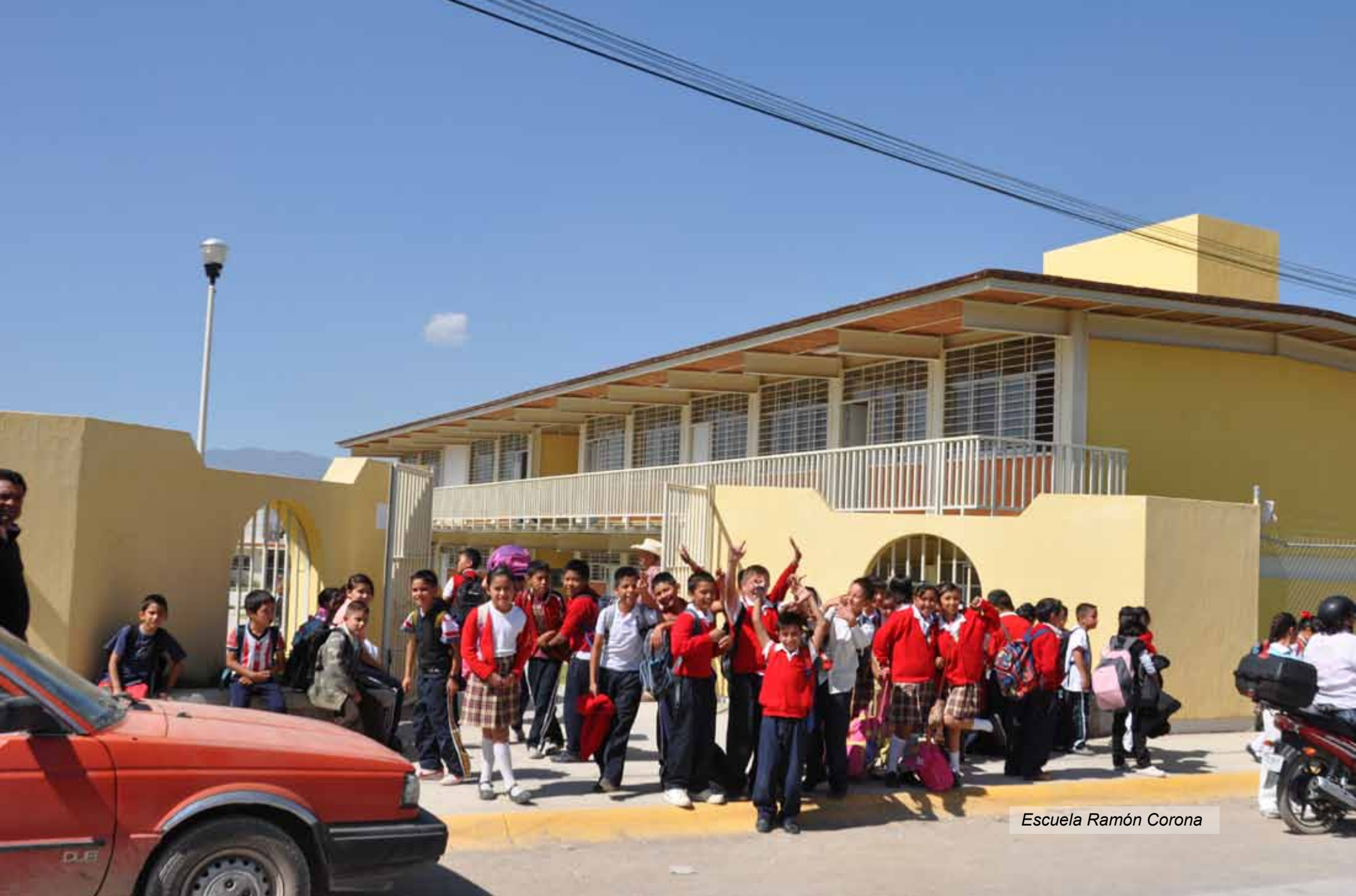
Escuela Ramón Corona