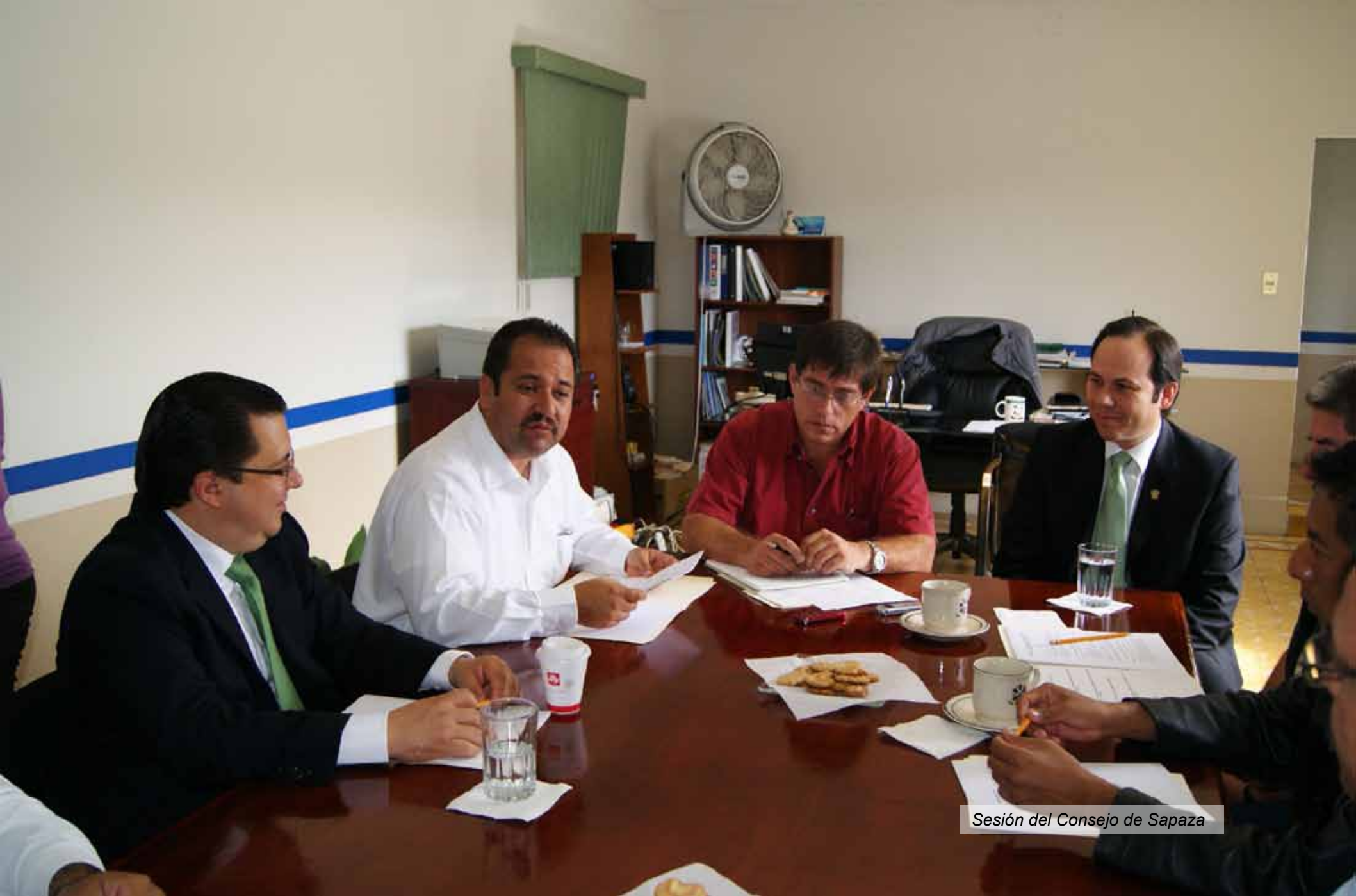
Sesión del Consejo de Sapaza