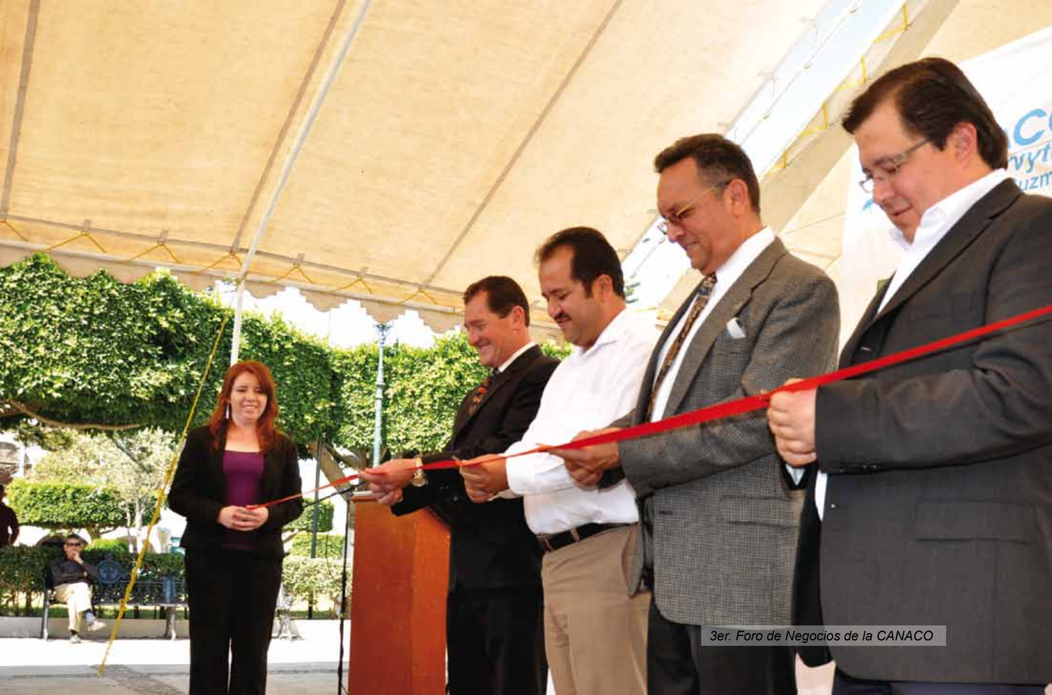
3er. Foro de Negocios de la CANACO