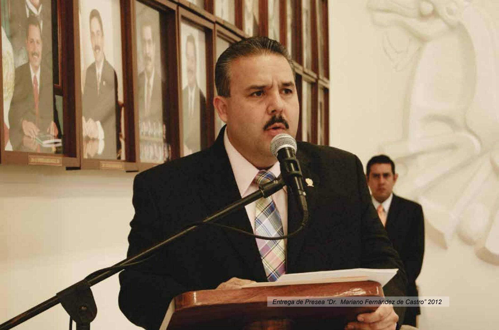
Entrega de Presea "Dr. Mariano Fernández de Castro" 2012