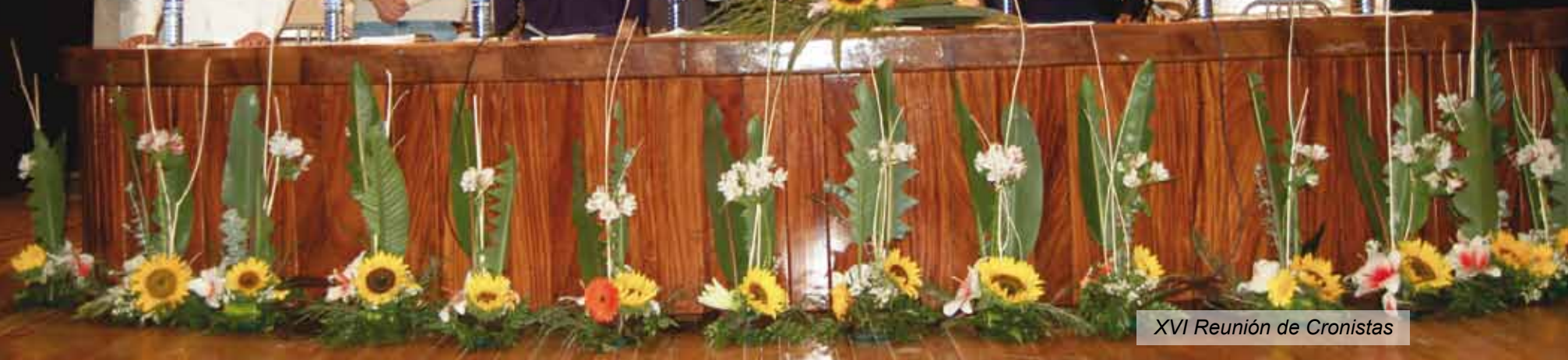
XVI Reunión de Cronistas