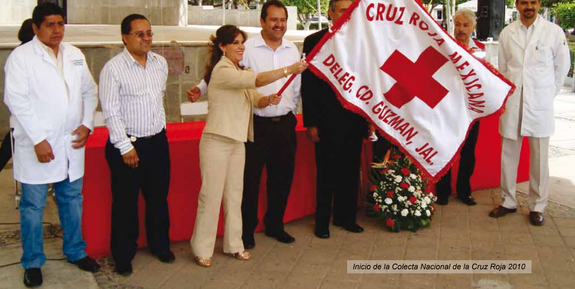
Inicio de la Colecta Nacional de la Cruz Roja 2010