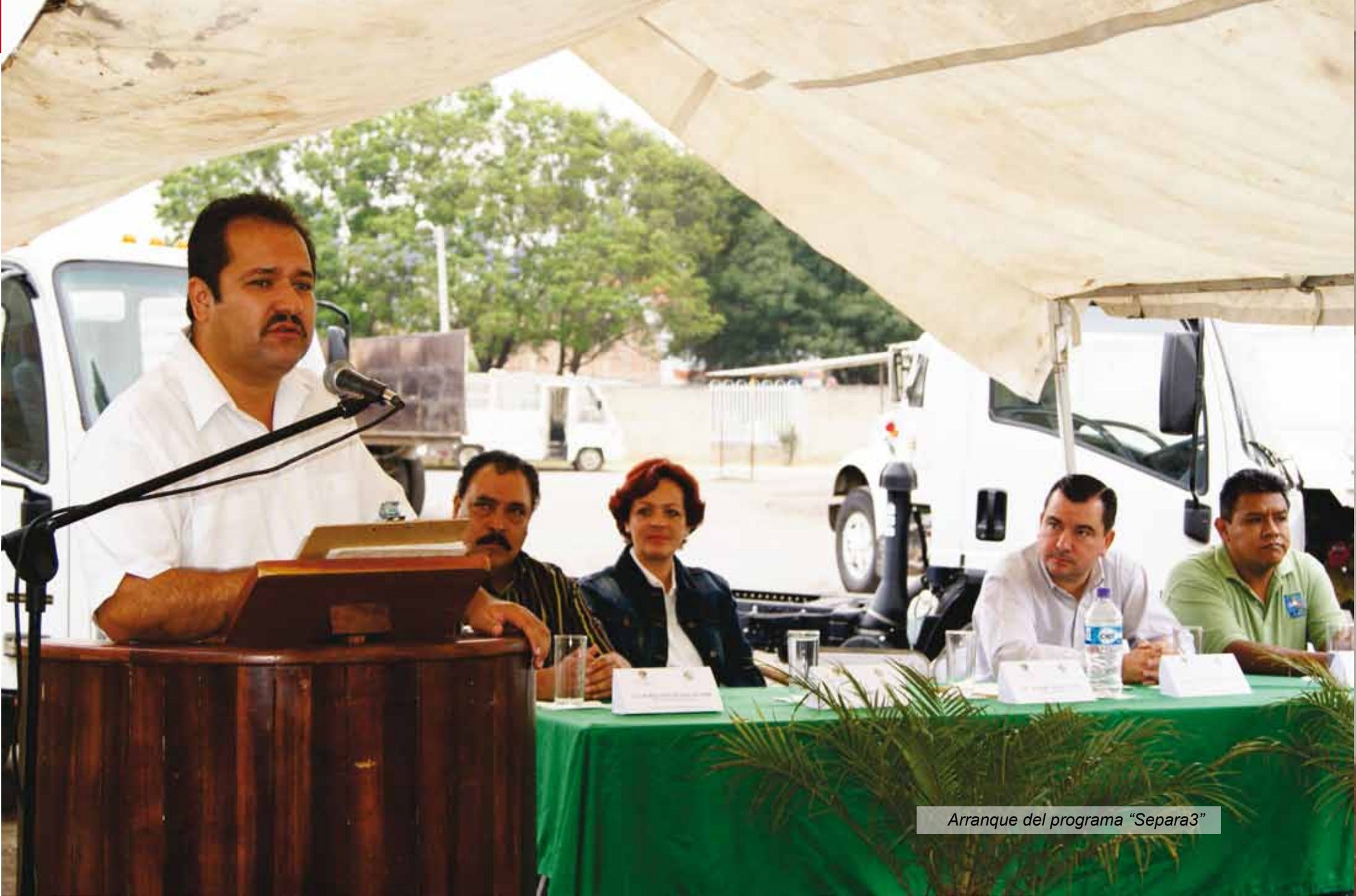
Arranque del programa "Separa3"