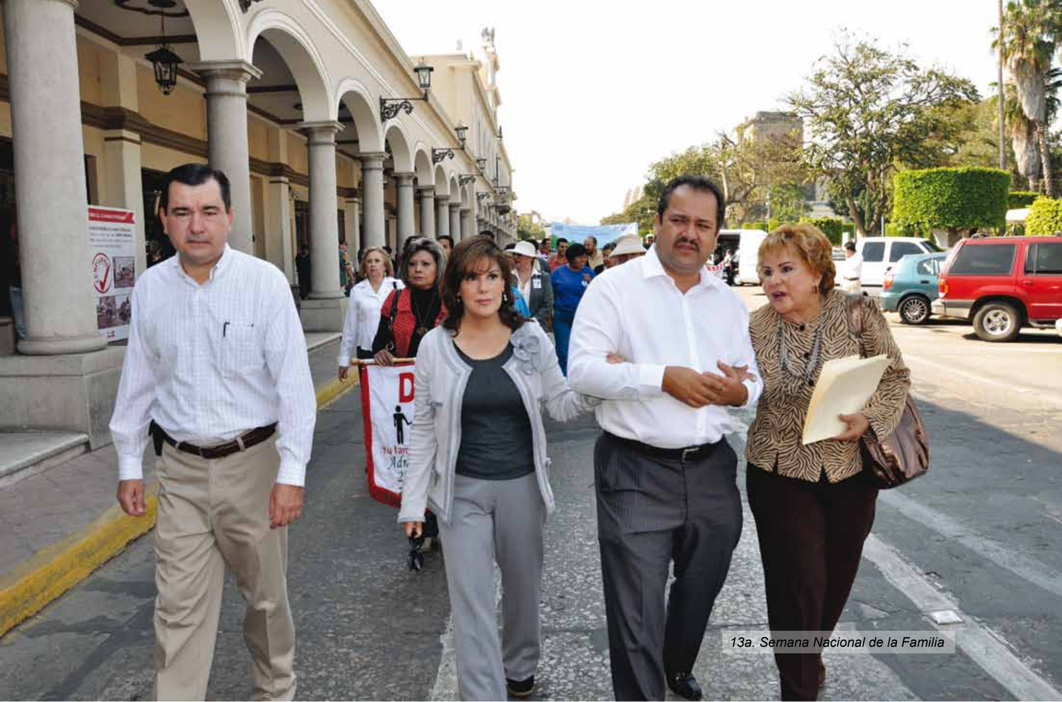
13a. Semana Nacional de la Familia