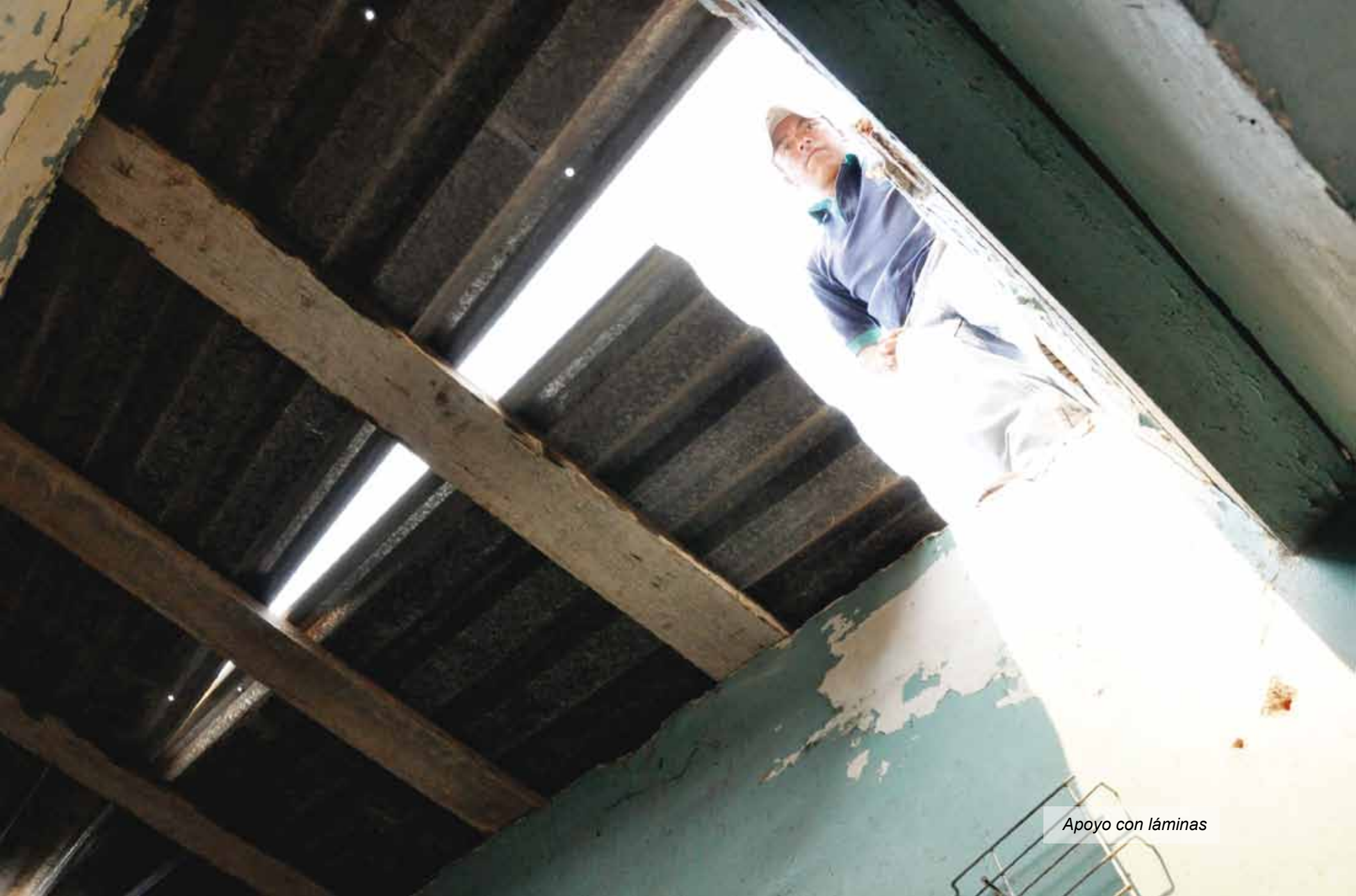
Apoyo con láminas