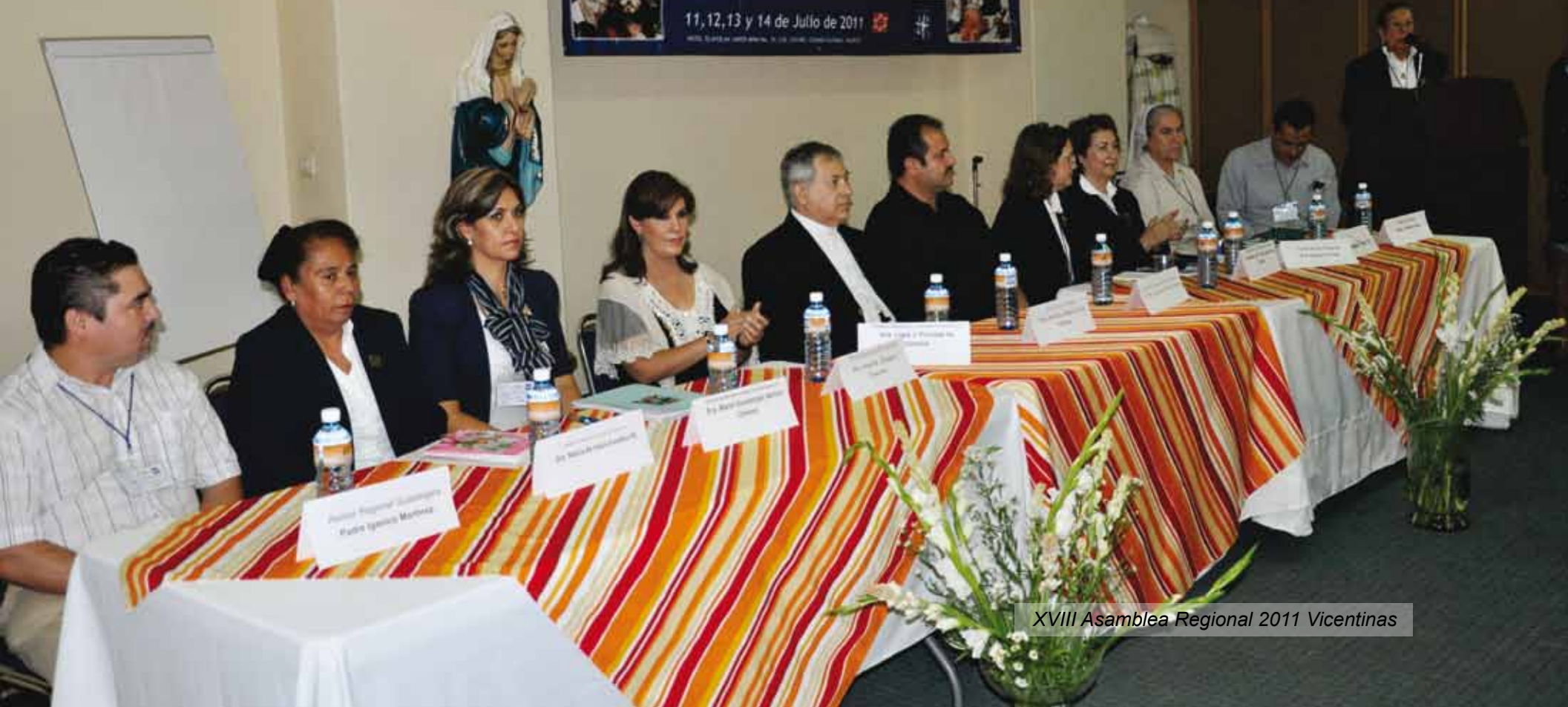
XVIII Asamblea Regional 2011 Vicentinas