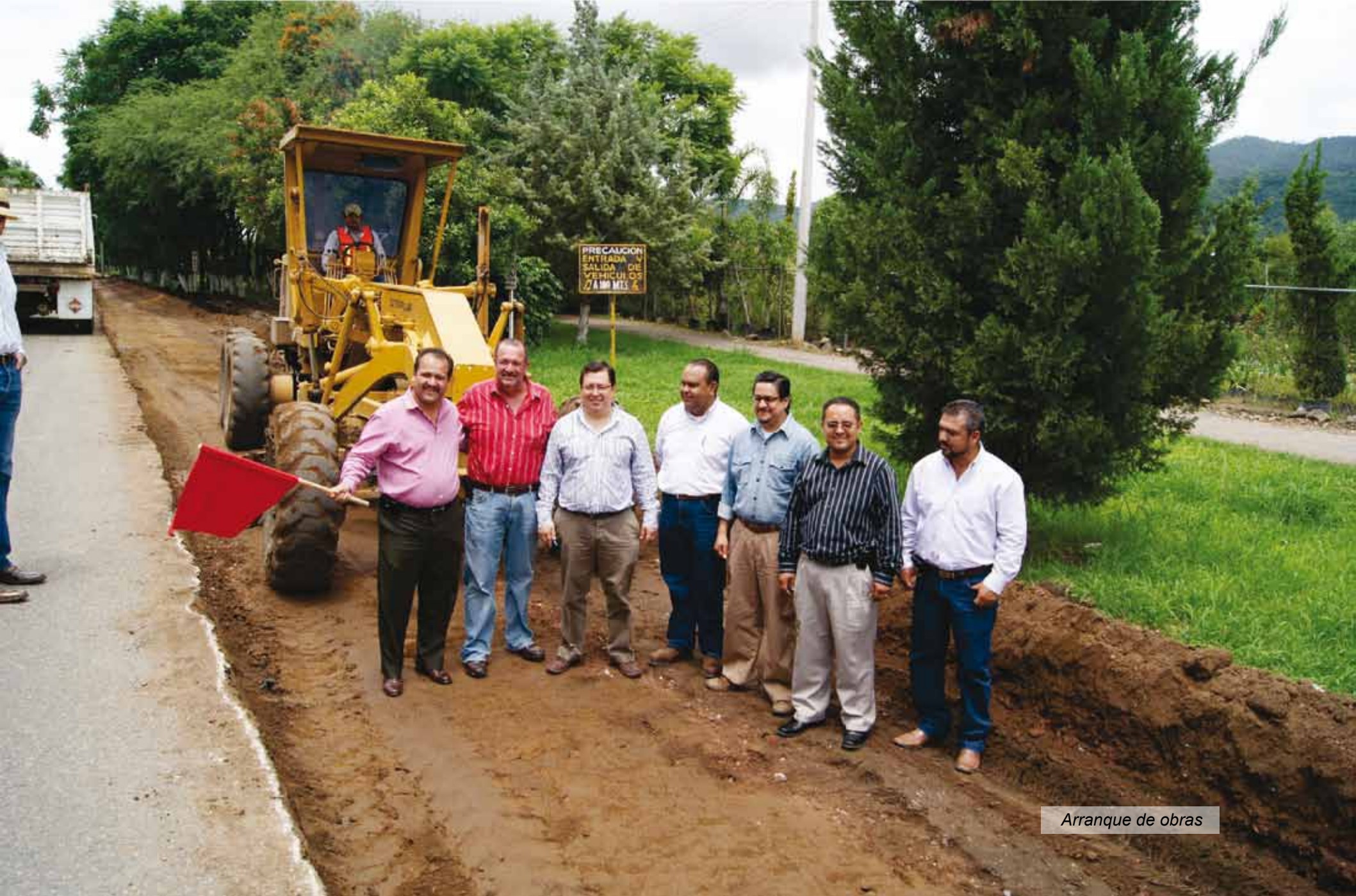
Arranque de obras