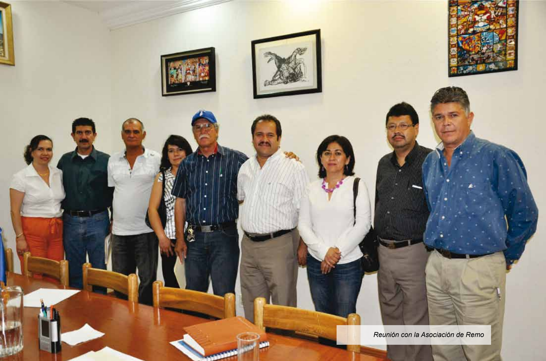
Reunión con la Asociación de Remo