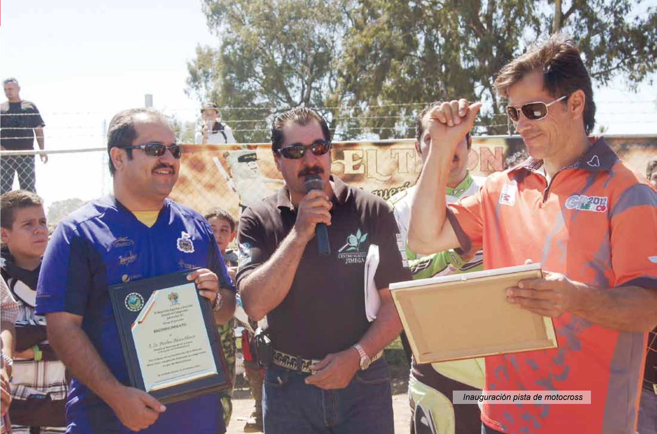
Inauguración pista de motocross