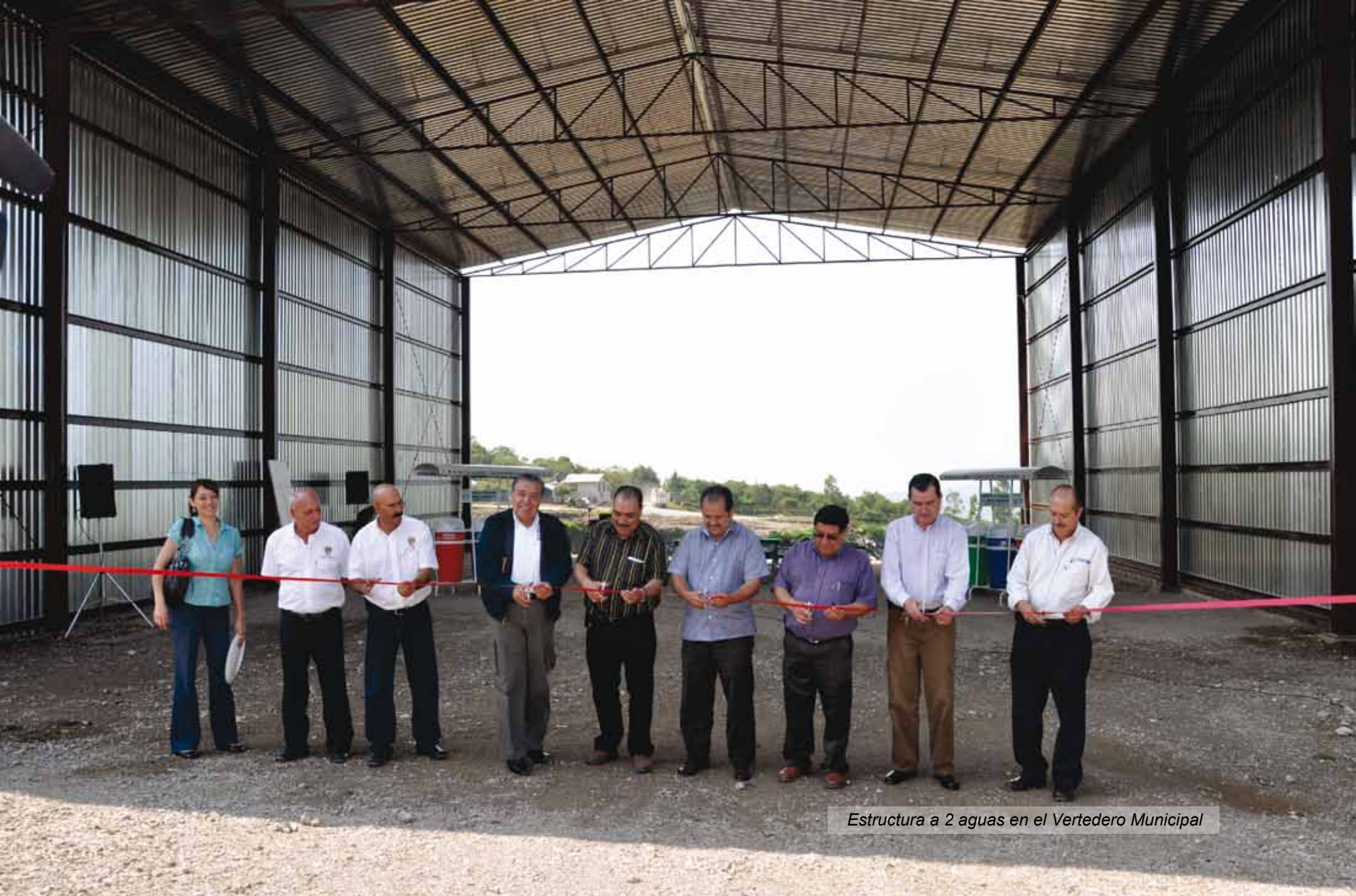
Estructura a 2 aguas en el Vertedero Municipal