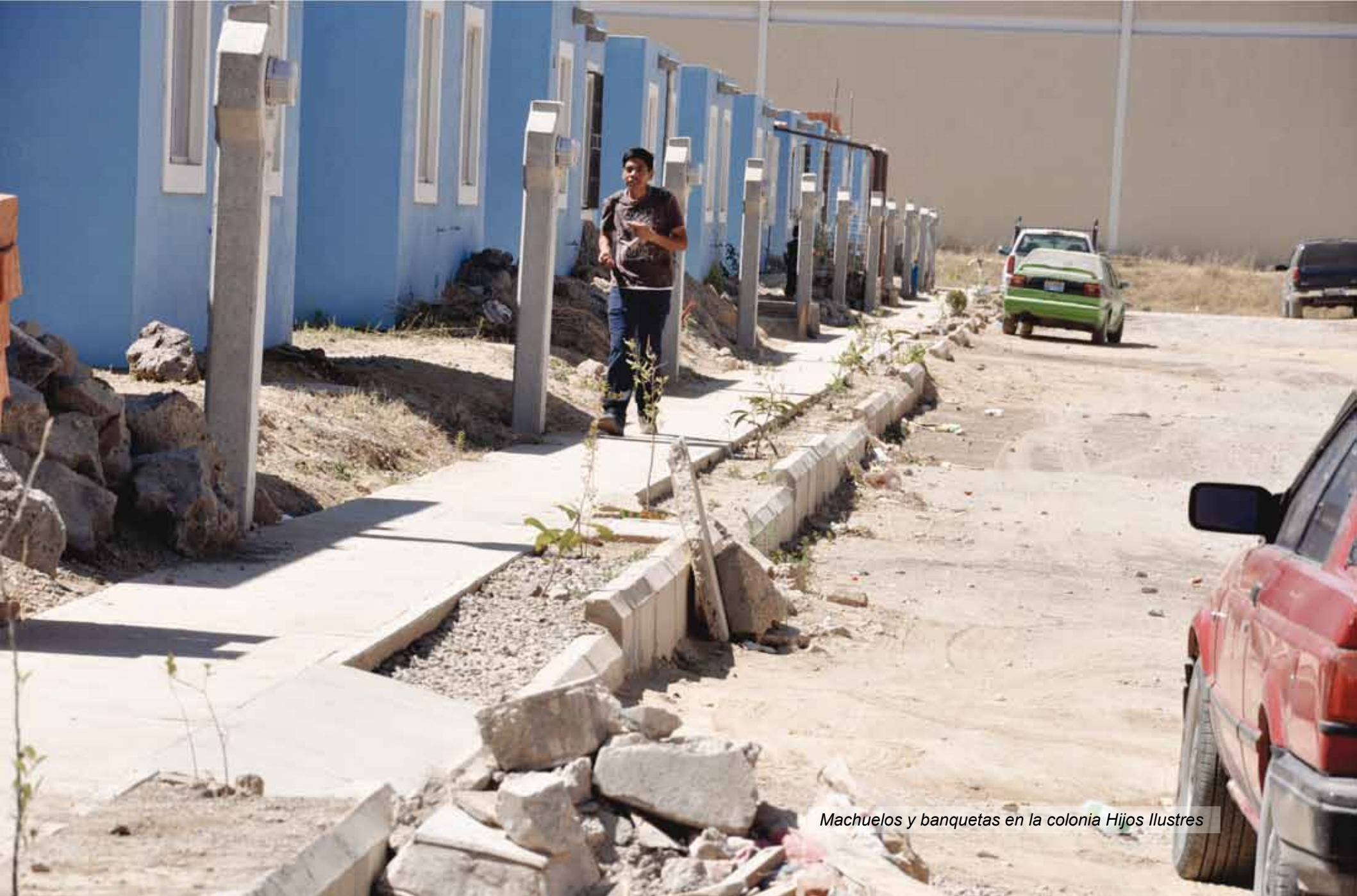
Machuelos y banquetas en la colonia Hijos Ilustres