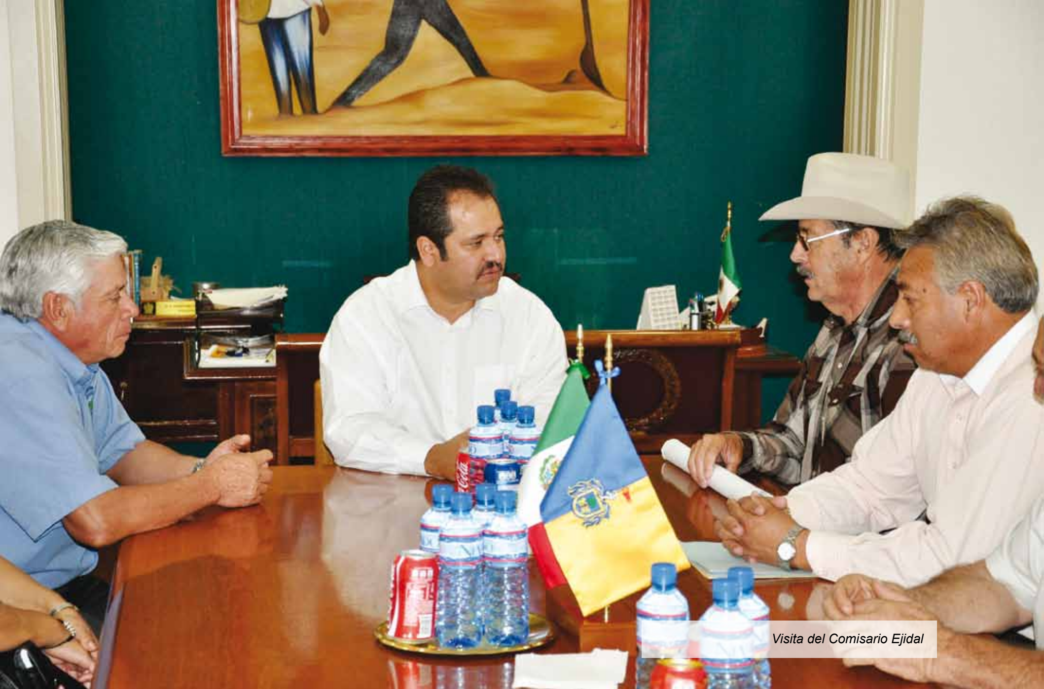
Visita del Comisario Ejidal