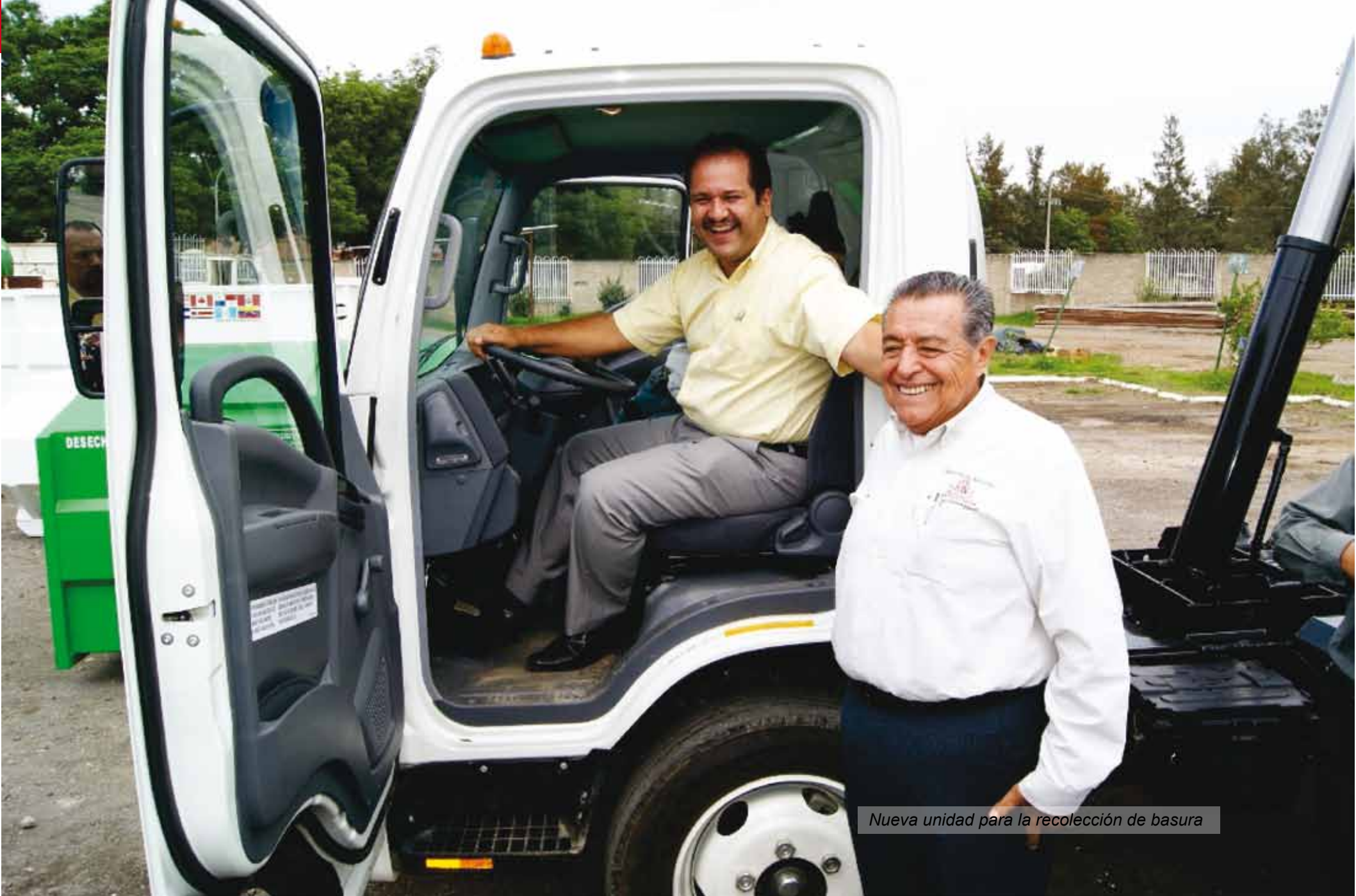
Nueva unidad para la recolección de basura