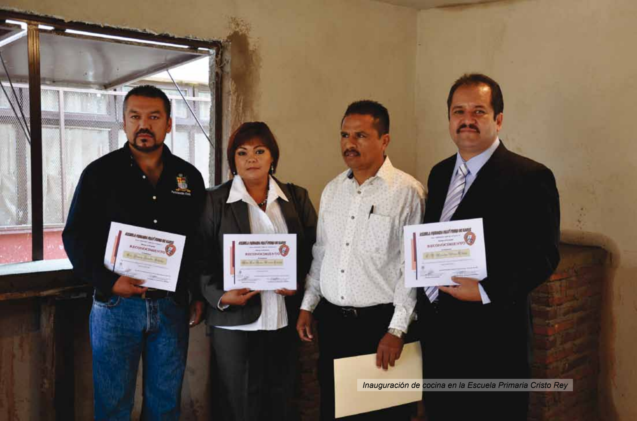
Inauguración de cocina en la Escuela Primaria Cristo Rey