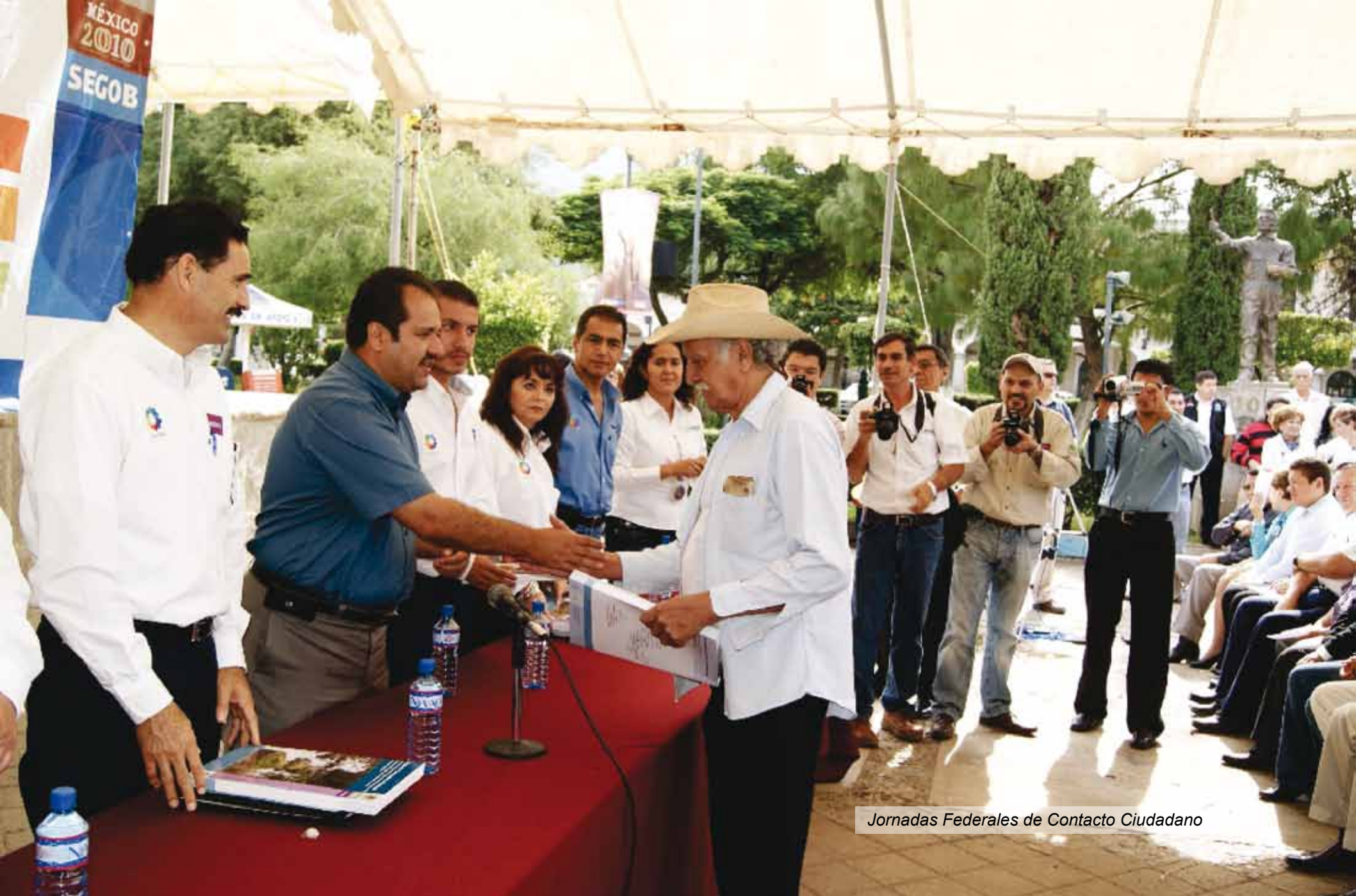
Jornadas Federales de Contacto Ciudadano