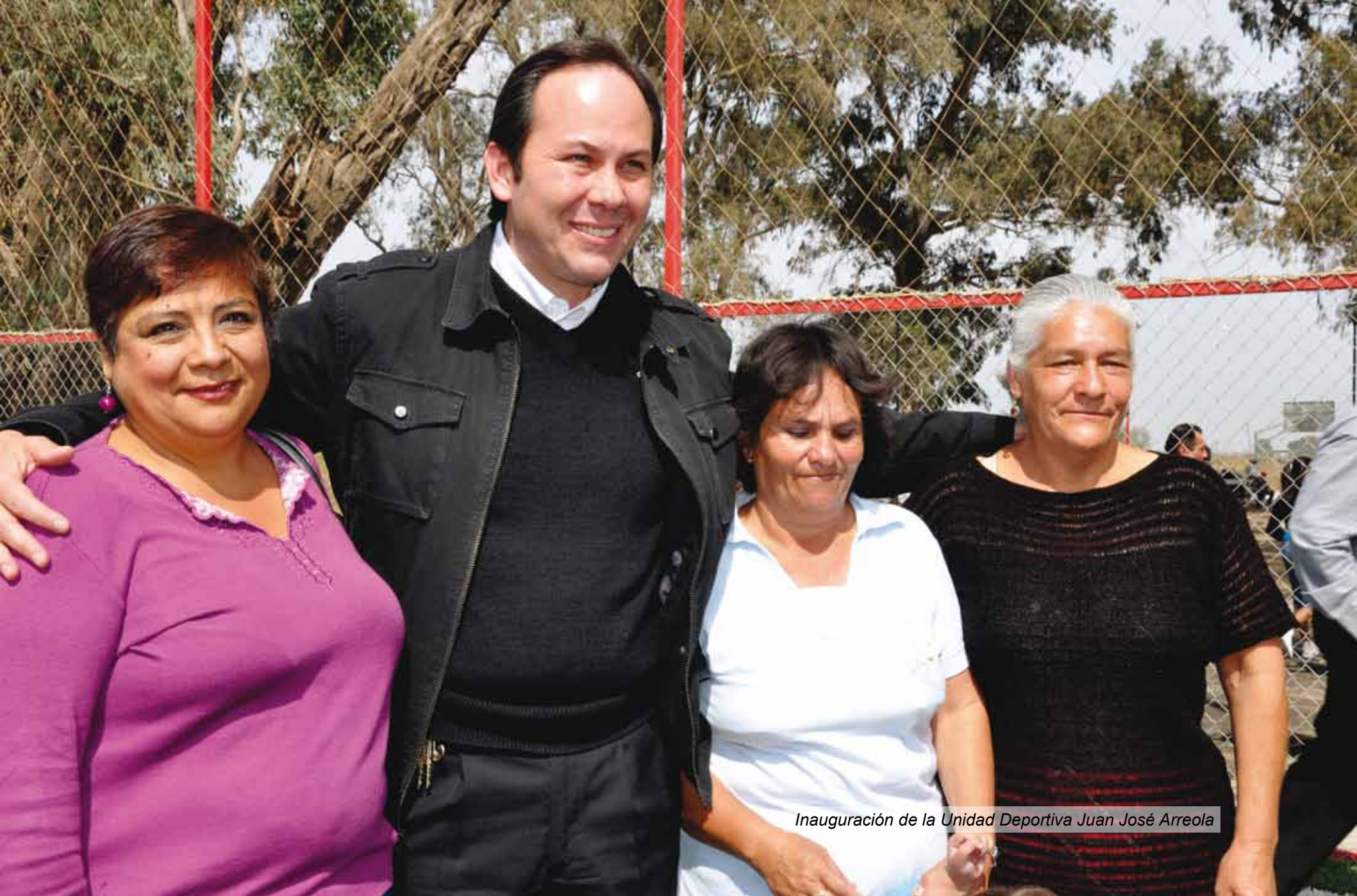
Inauguración de la Unidad Deportiva Juan José Arreola