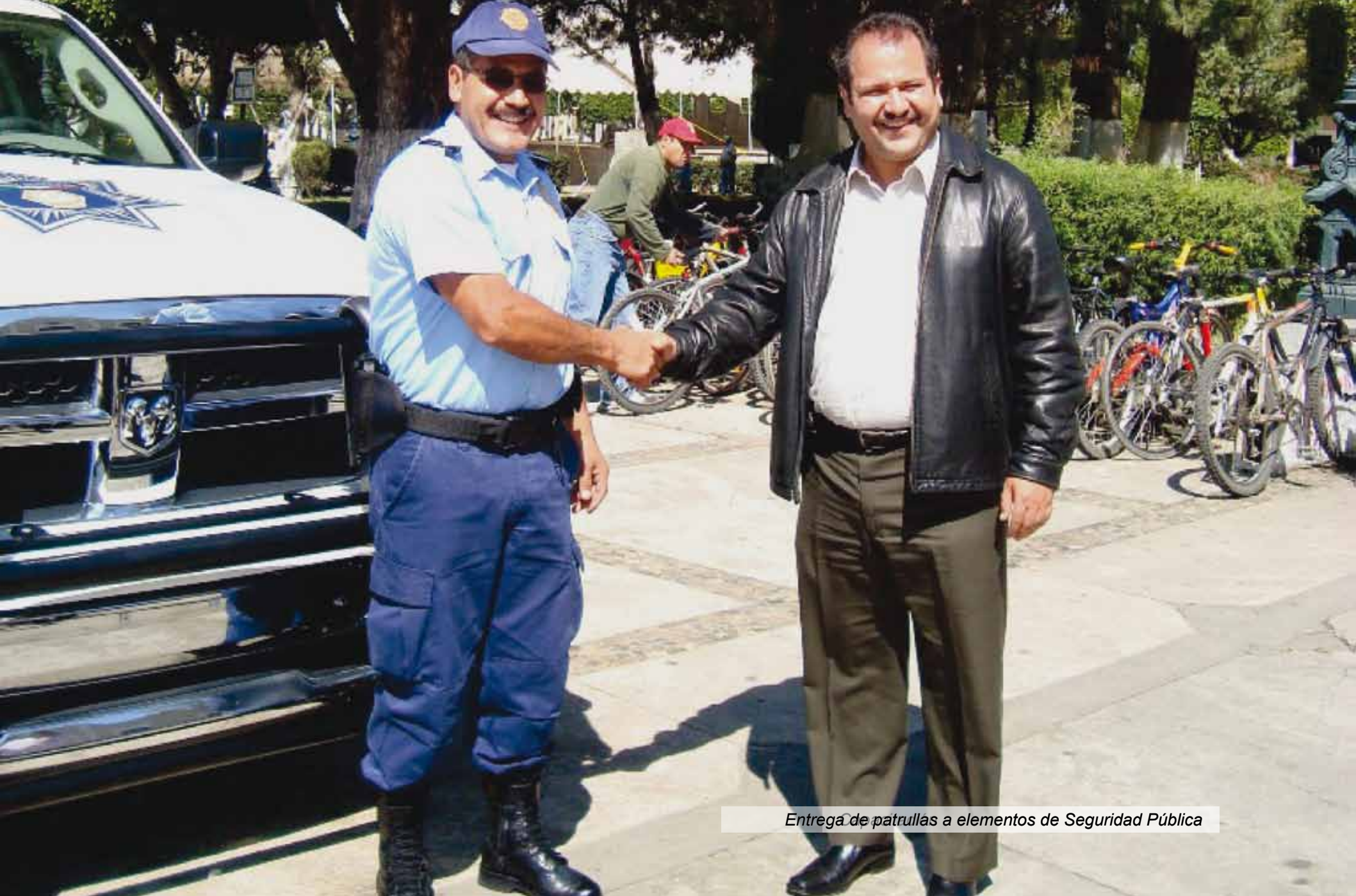
Entrega de patrullas a elementos de Seguridad Pública