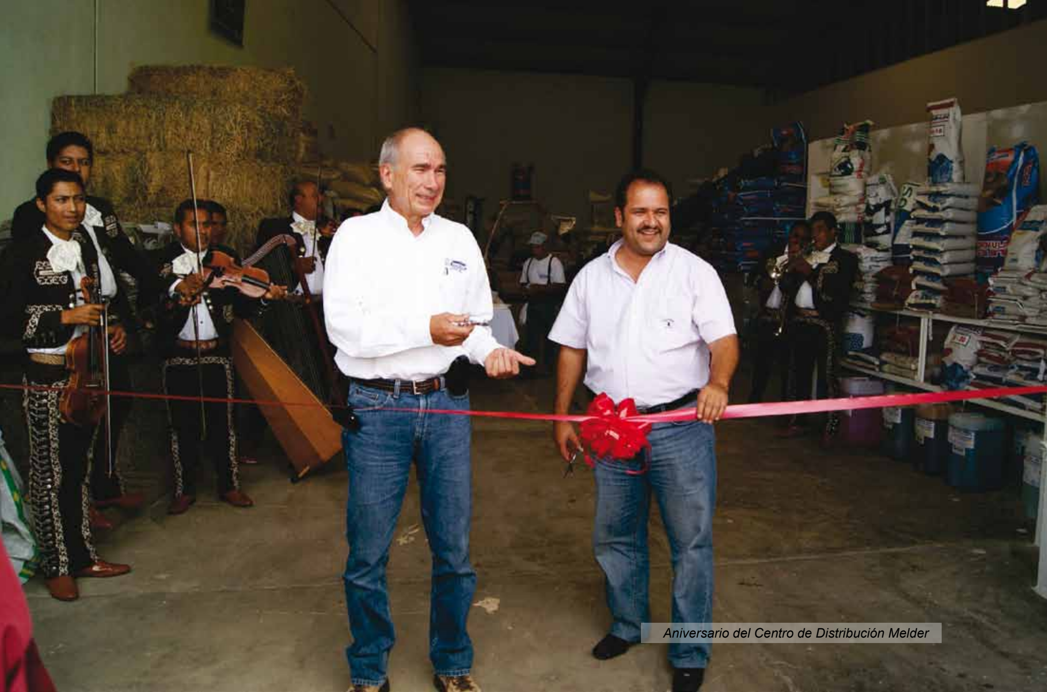
Aniversario del Centro de Distribución Melder