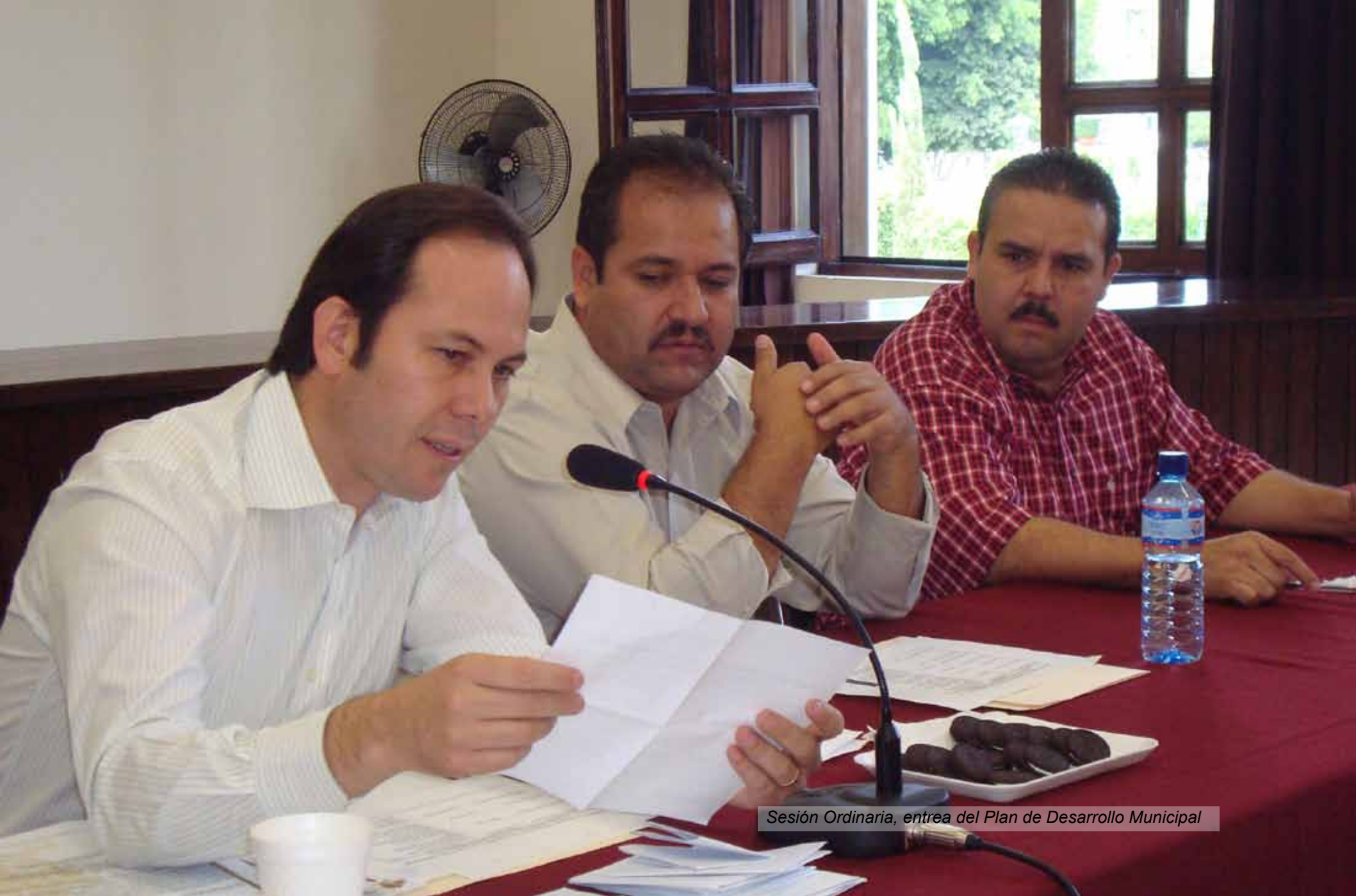
Sesión Ordinaria, entrea del Plan de Desarrollo Municipal