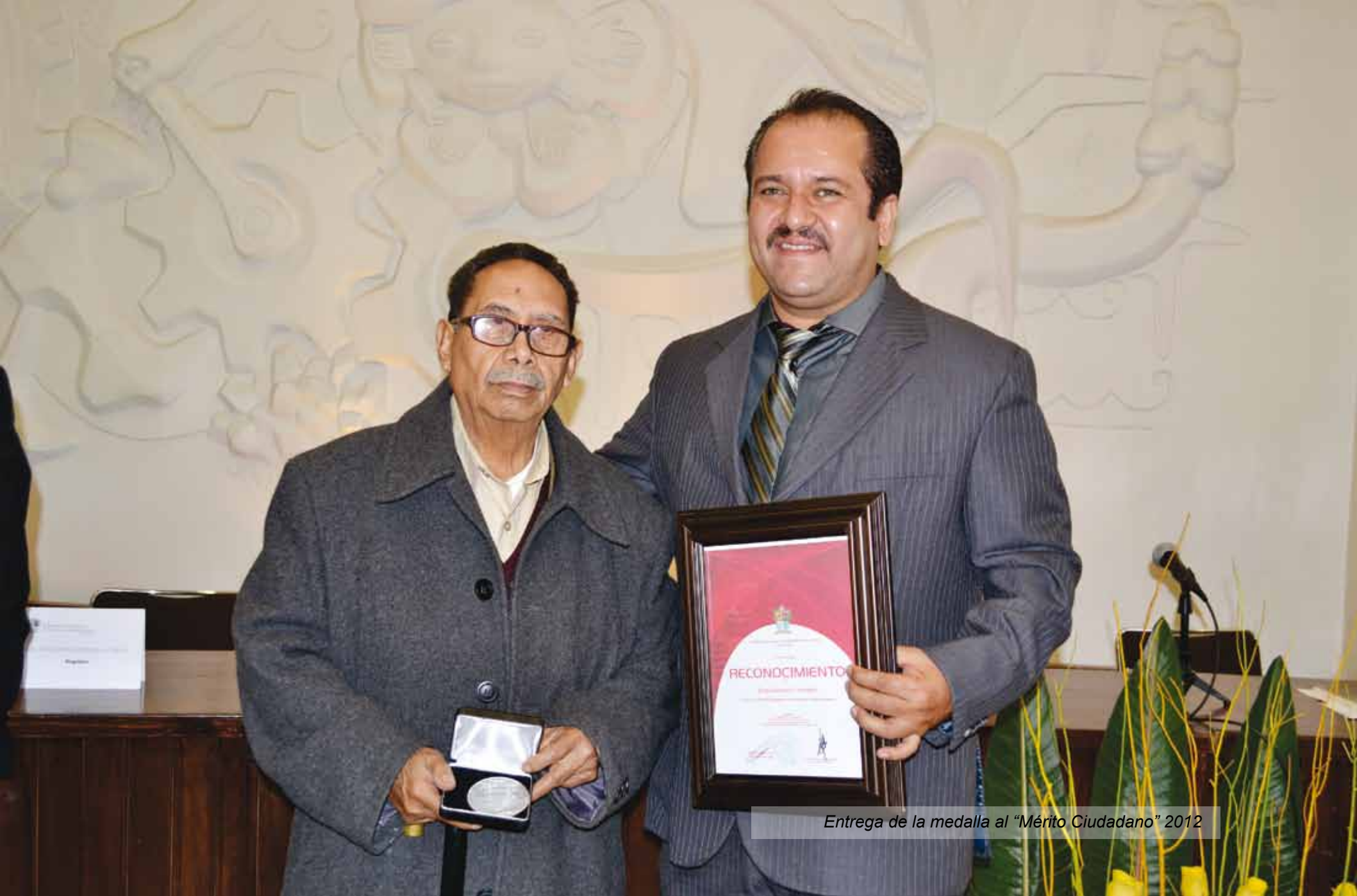
Entrega de la medalla al "Mérito Ciudadano" 2012