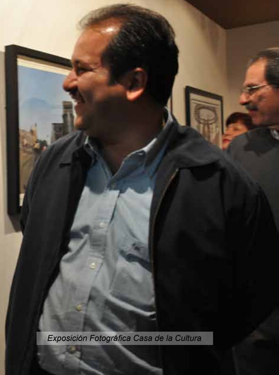
Exposición Fotográfica Casa de la Cultura