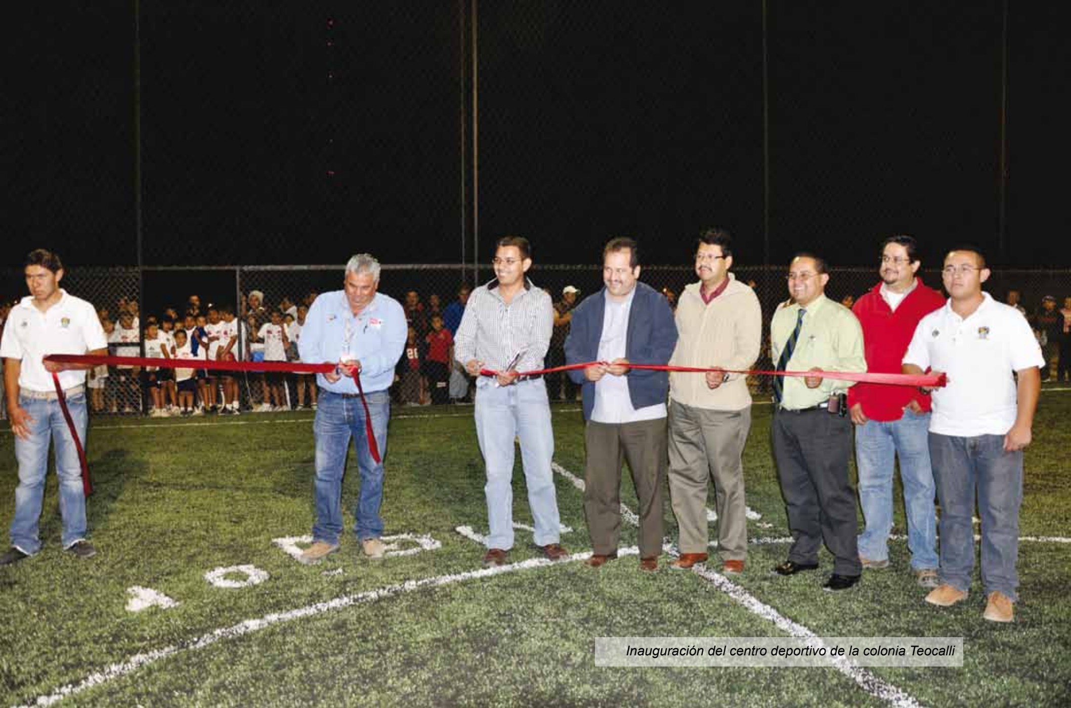
Inauguración del centro deportivo de la colonia Teocalli