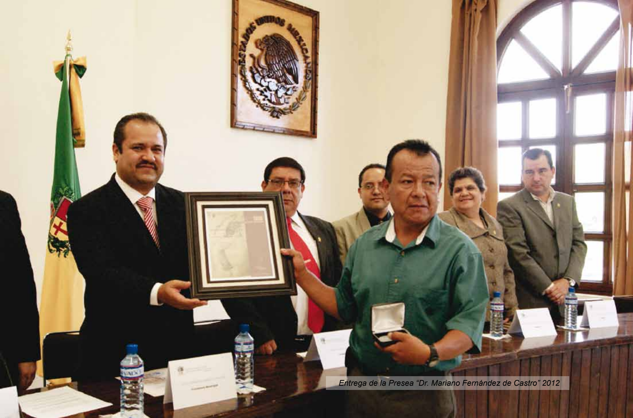
Entrega de la Presea "Dr. Mariano Fernández de Castro" 2012