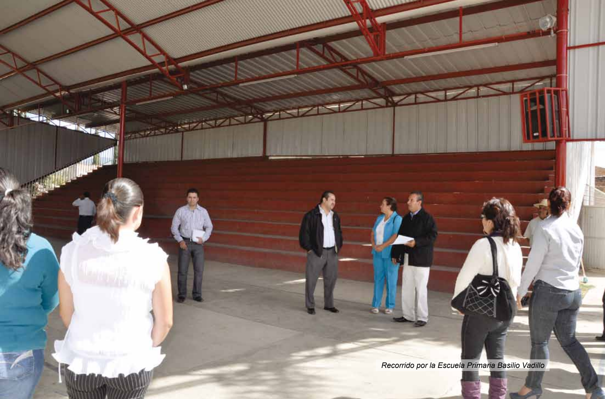
Recorrido por la Escuela Primaria Basilio Vadillo