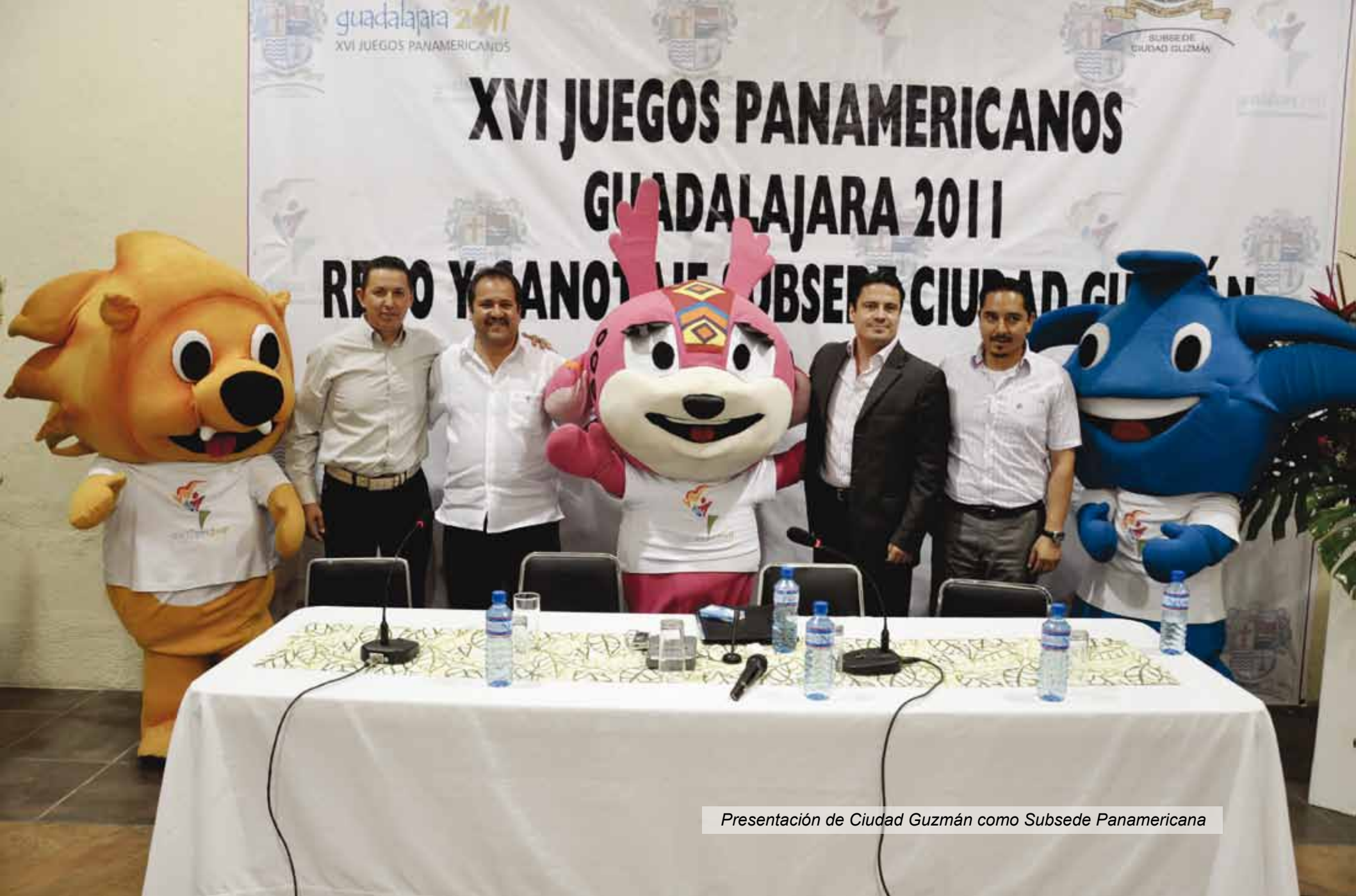
Presentación de Ciudad Guzmán como Subsede Panamericana