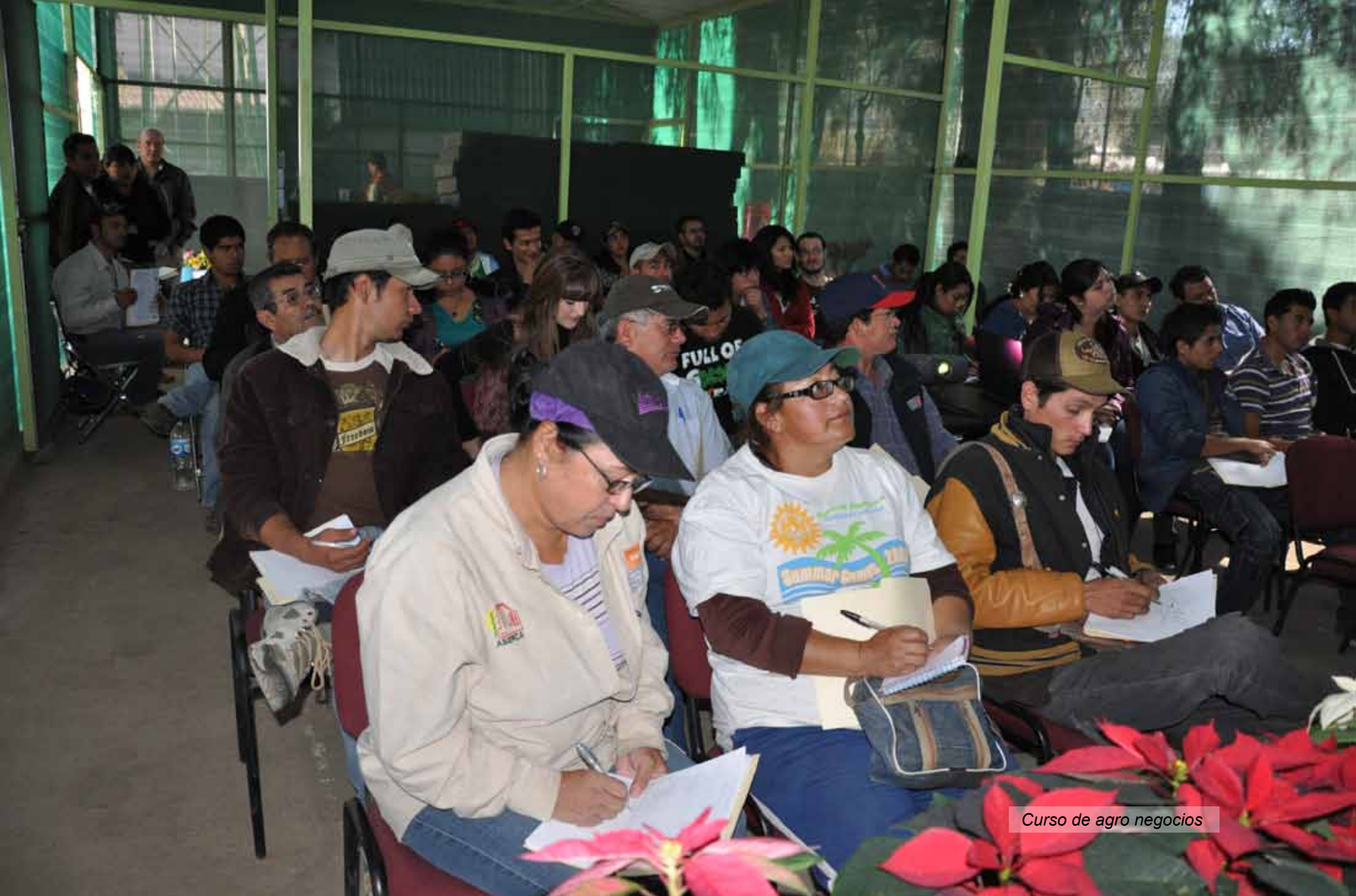
Curso de agro negocios