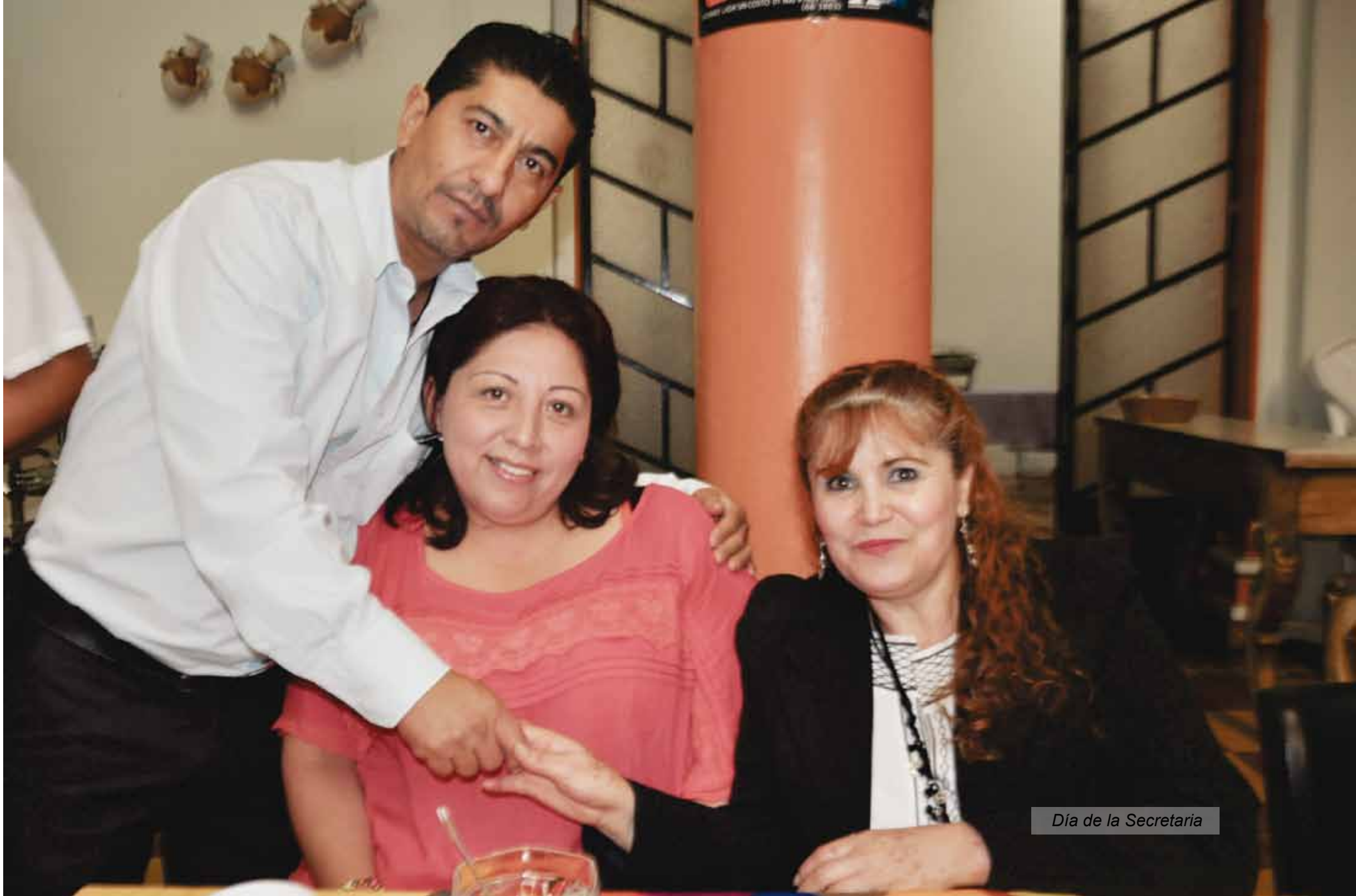
Día de la Secretaria