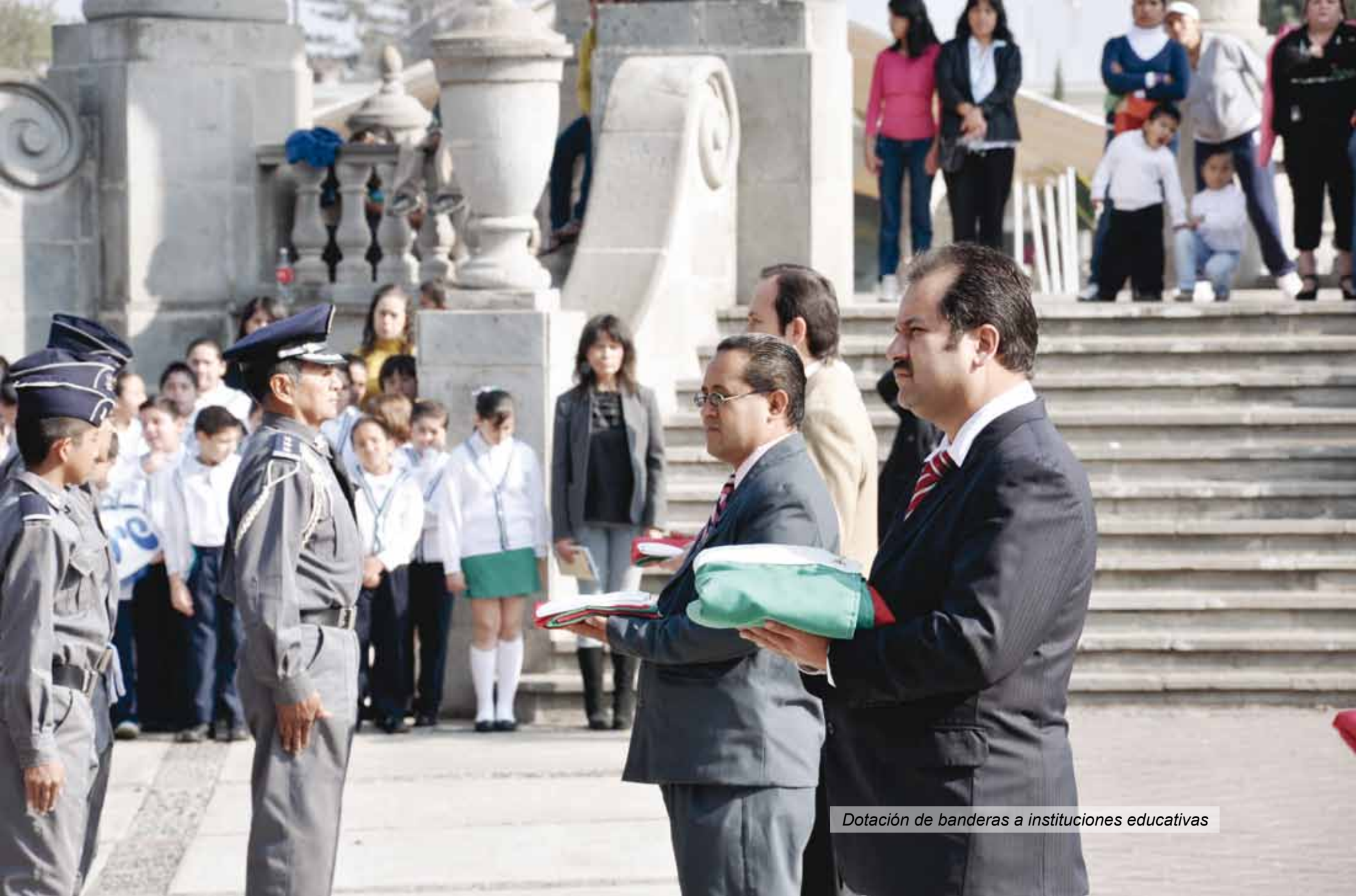
Dotación de banderas a instituciones educativas