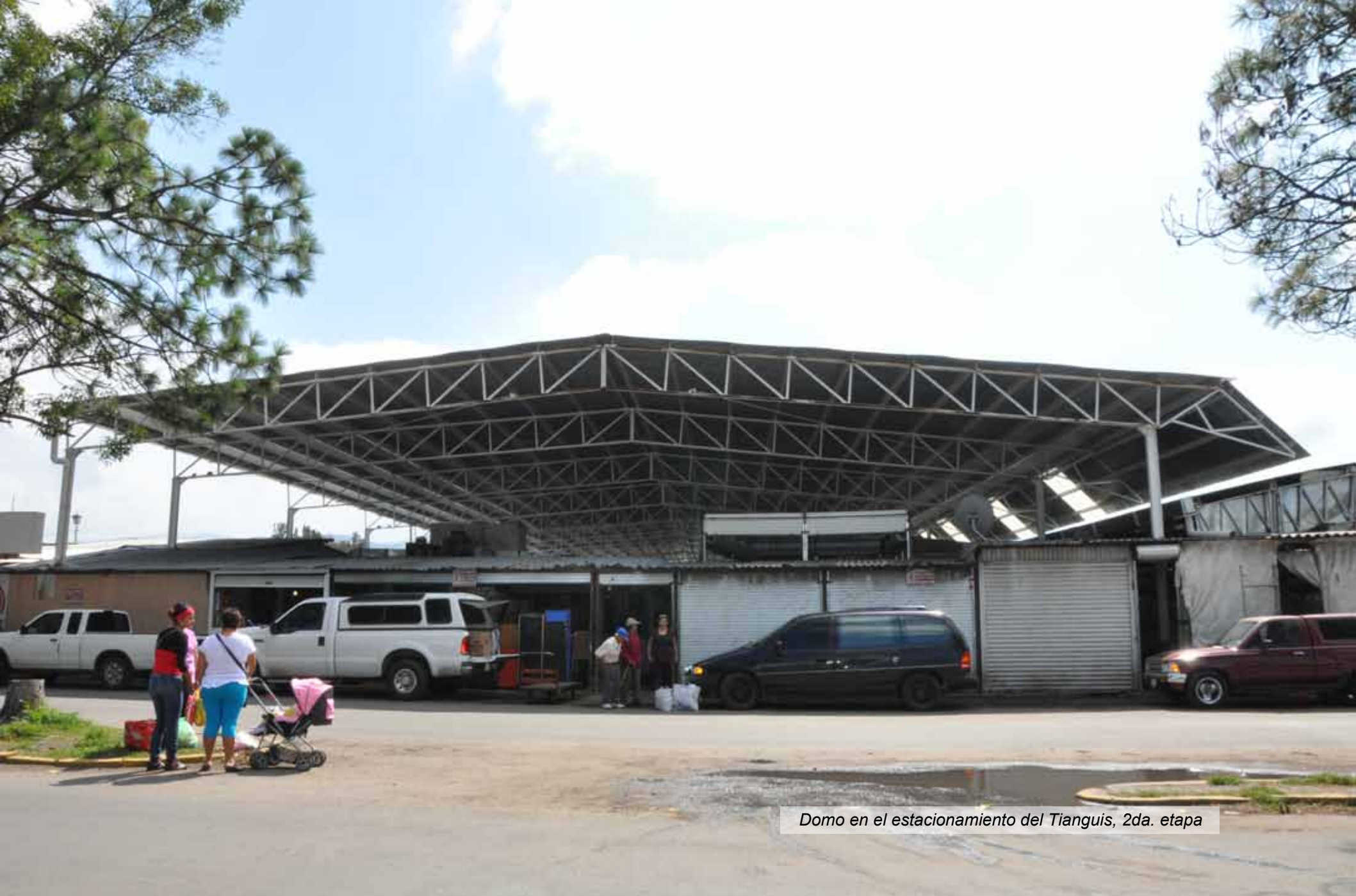
Domo en el estacionamiento del Tianguis, 2da. etapa