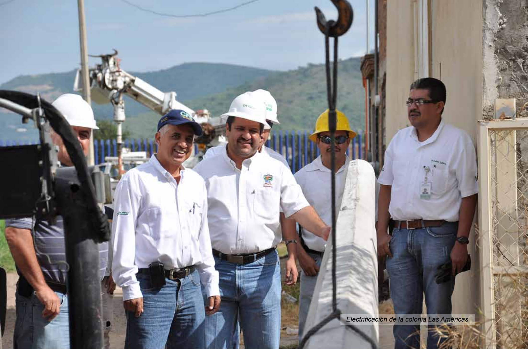
Electrificación de la colonia Las Américas