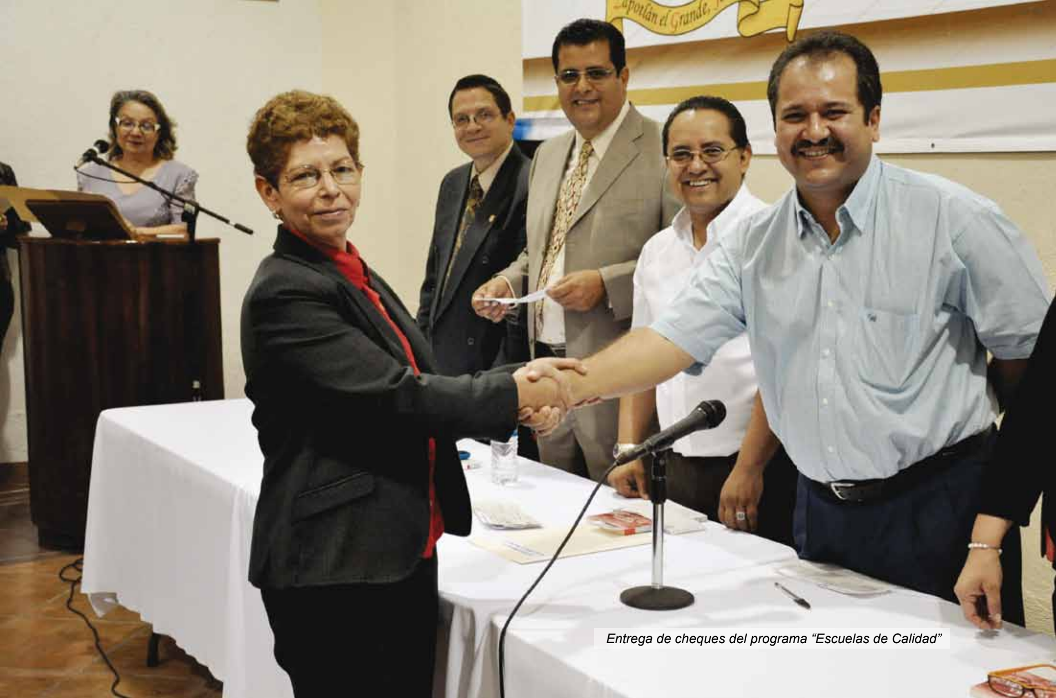
Entrega de cheques del programa "Escuelas de Calidad"