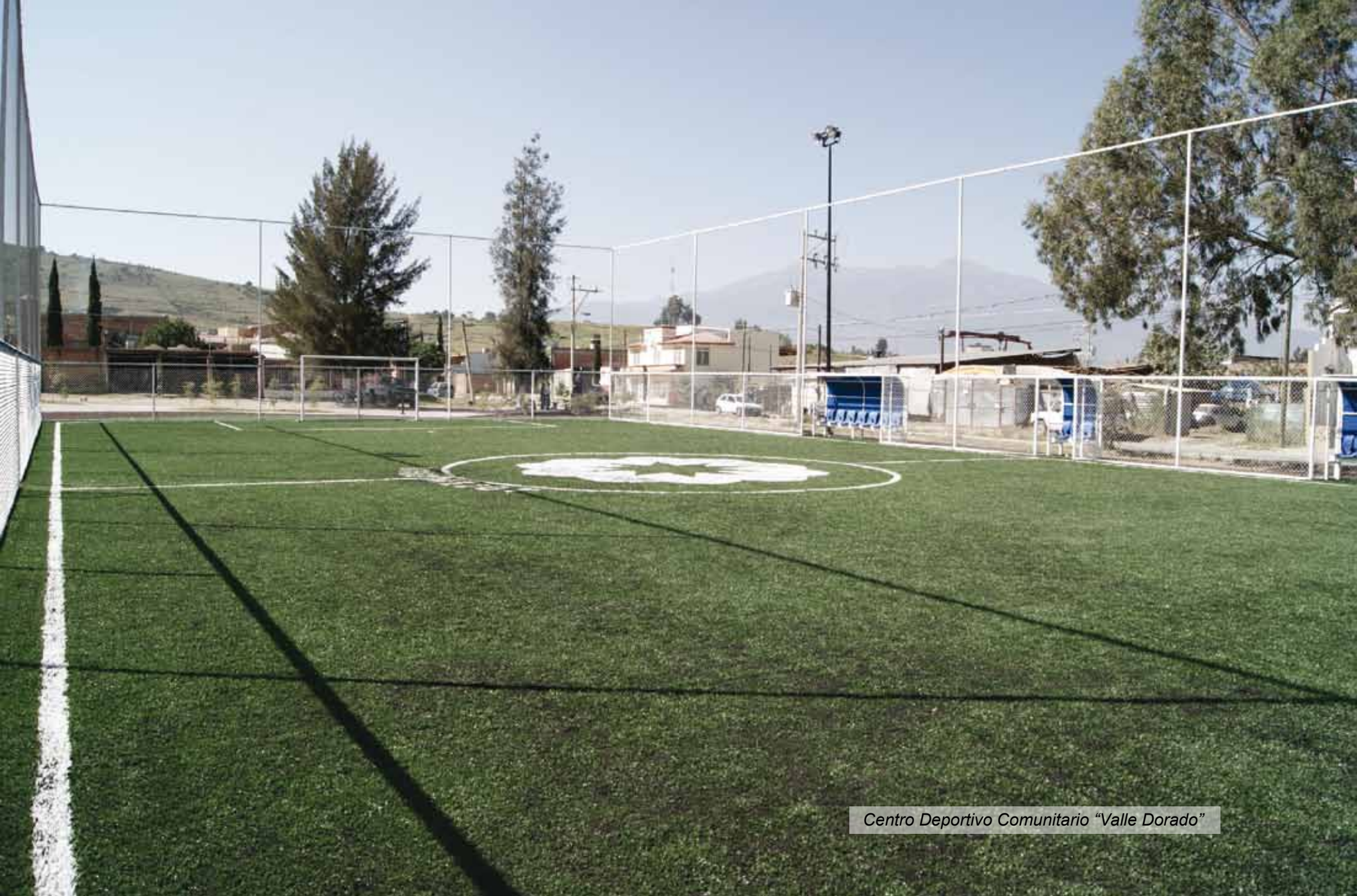
Centro Deportivo Comunitario "Valle Dorado"