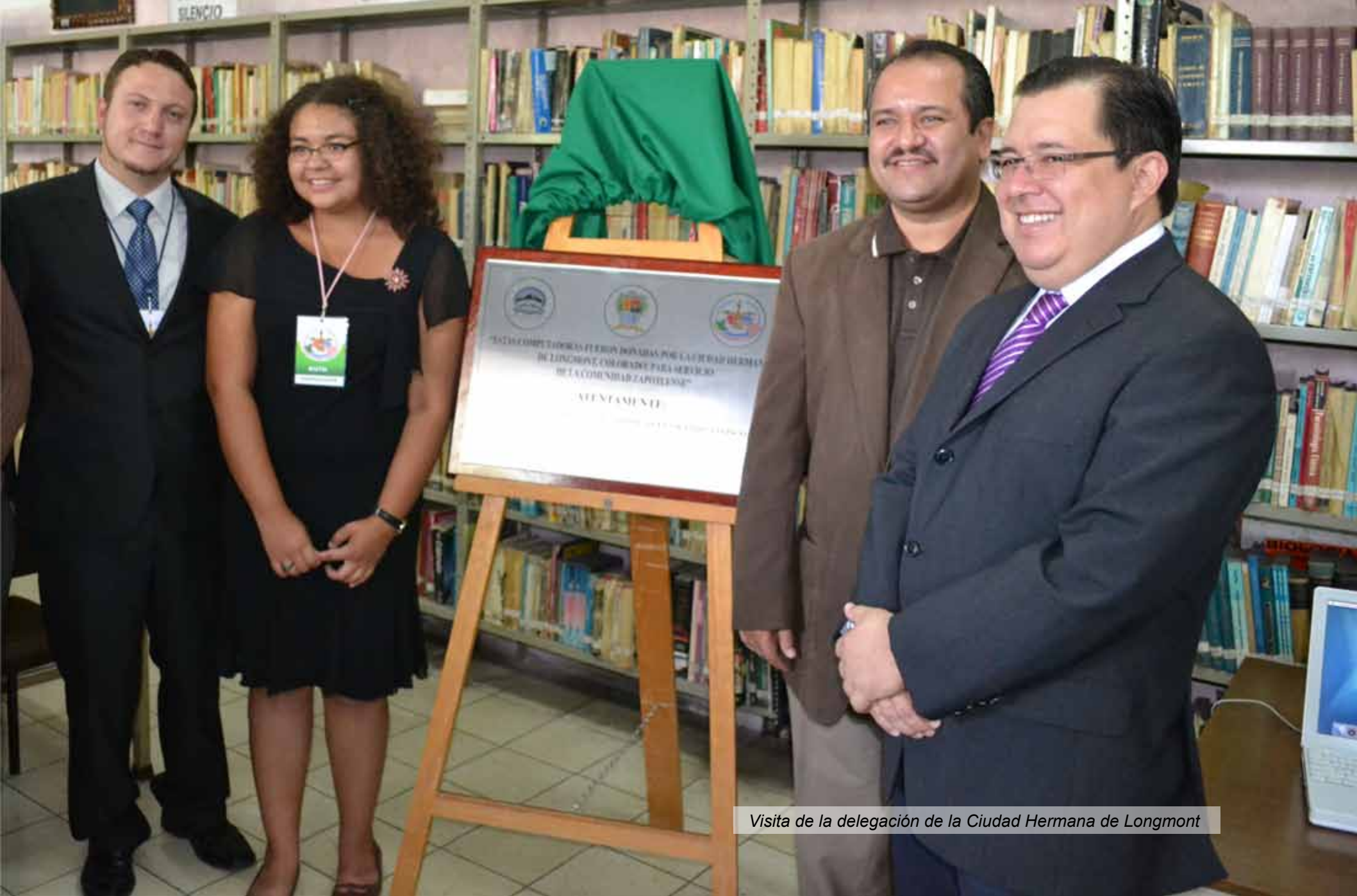
Visita de la delegación de la Ciudad Hermana de Longmont