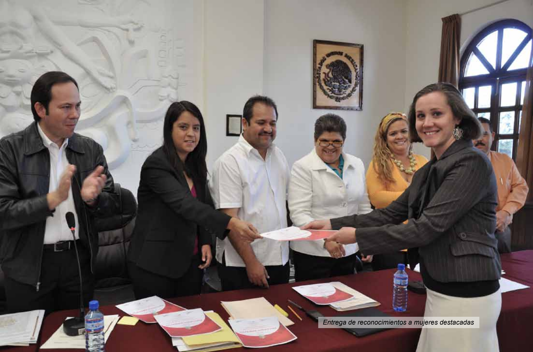
Entrega de reconocimientos a mujeres destacadas