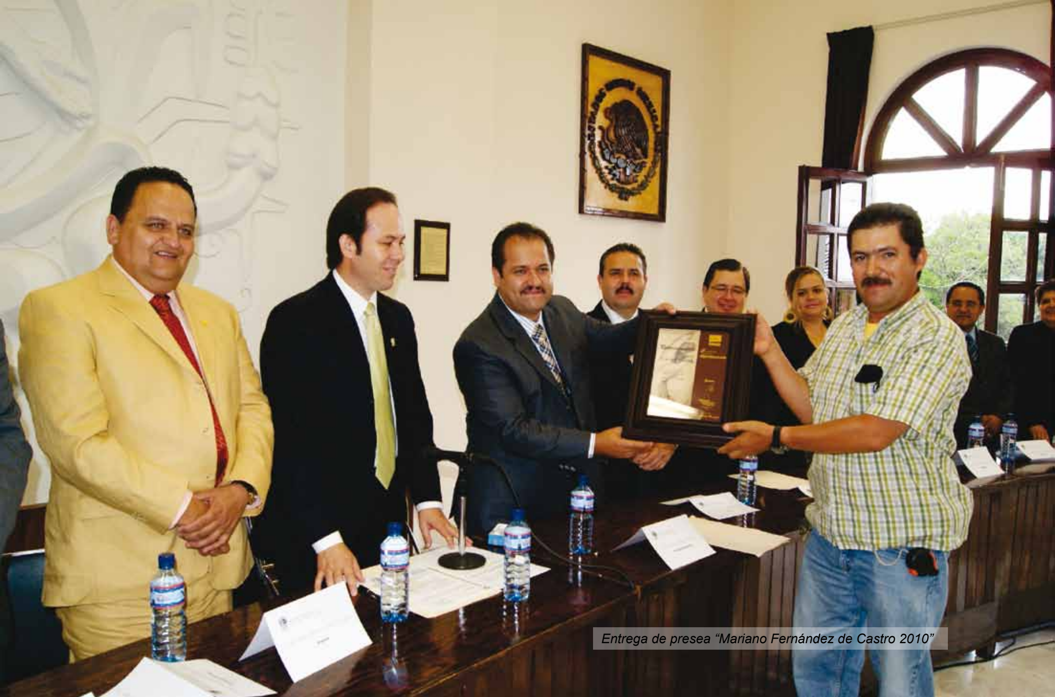
Entrega de presea "Mariano Fernández de Castro 2010"