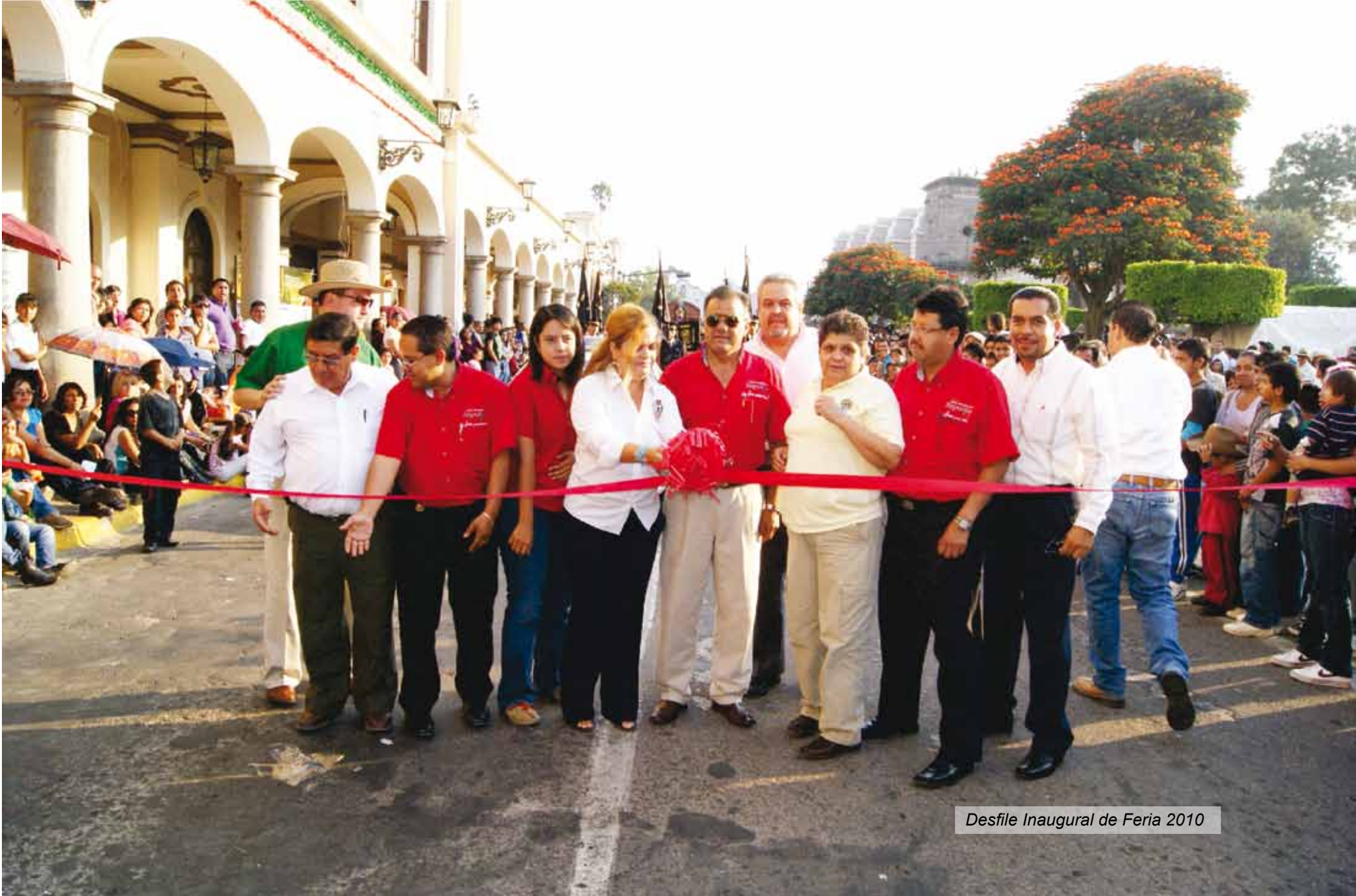
Desfile Inaugural de Feria 2010