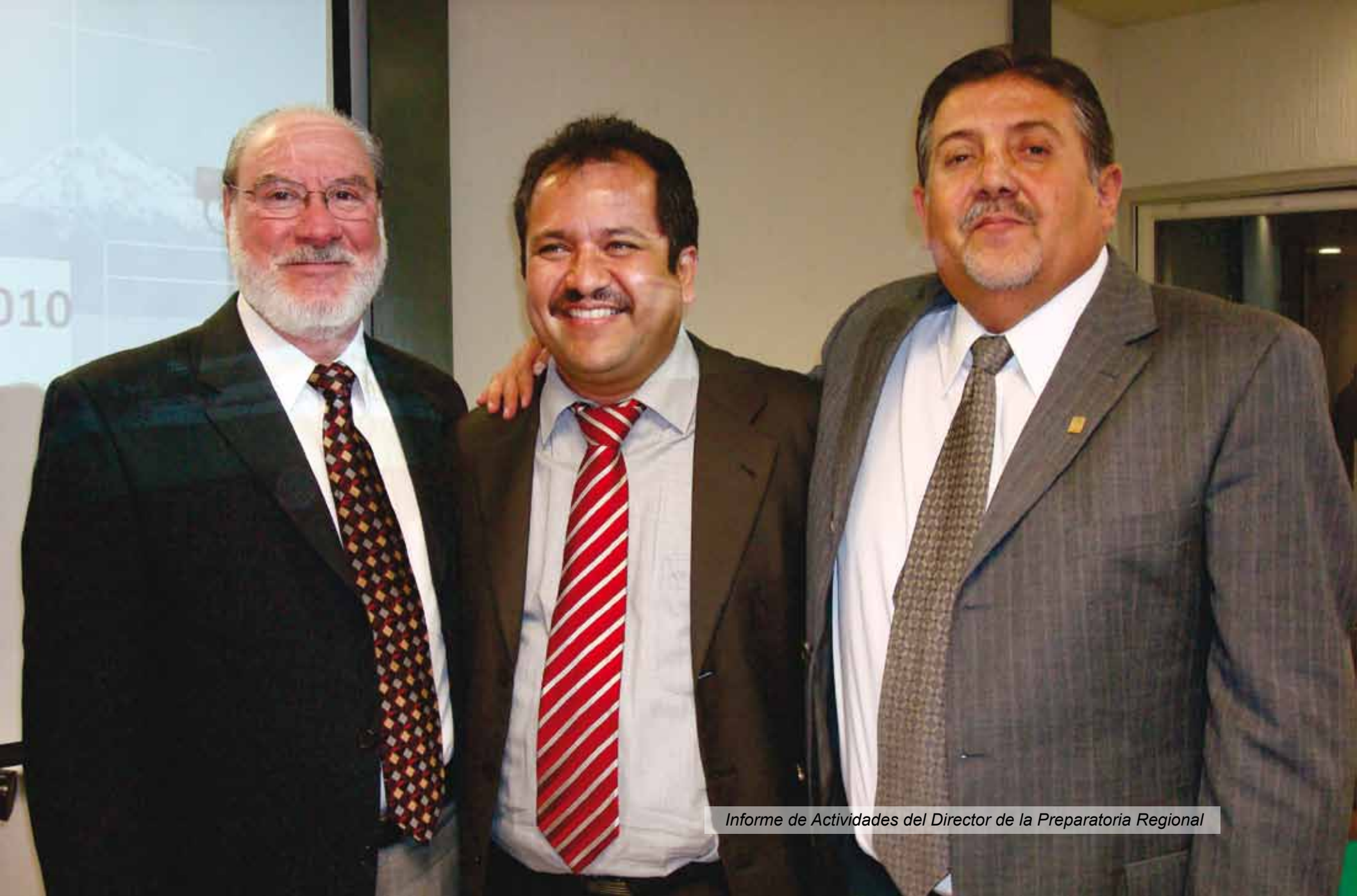
Informe de Actividades del Director de la Preparatoria Regional