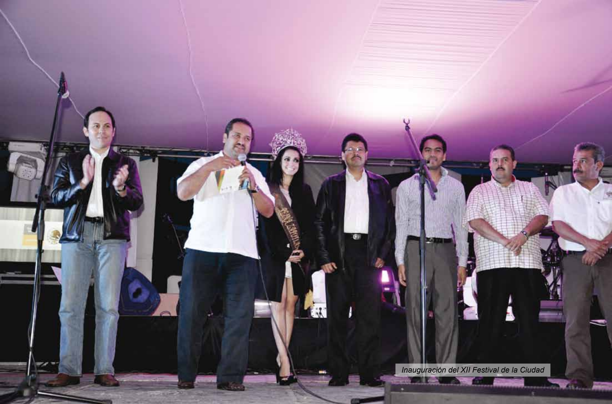
Inauguración del XII Festival de la Ciudad