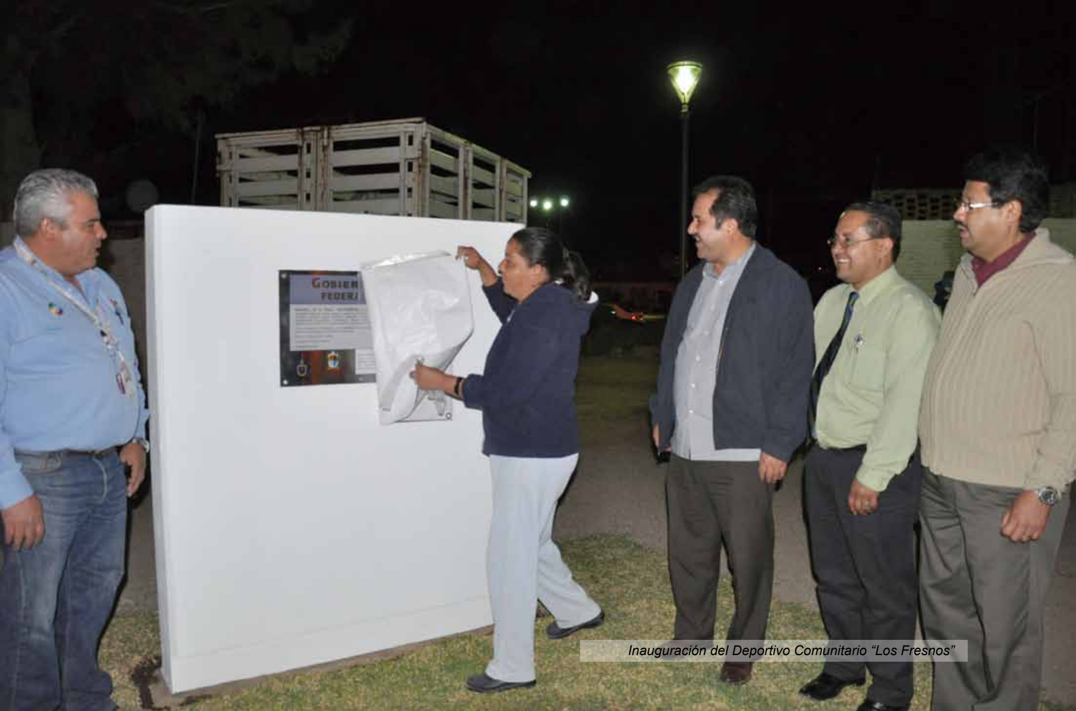
Inauguración del Deportivo Comunitario "Los Fresnos"