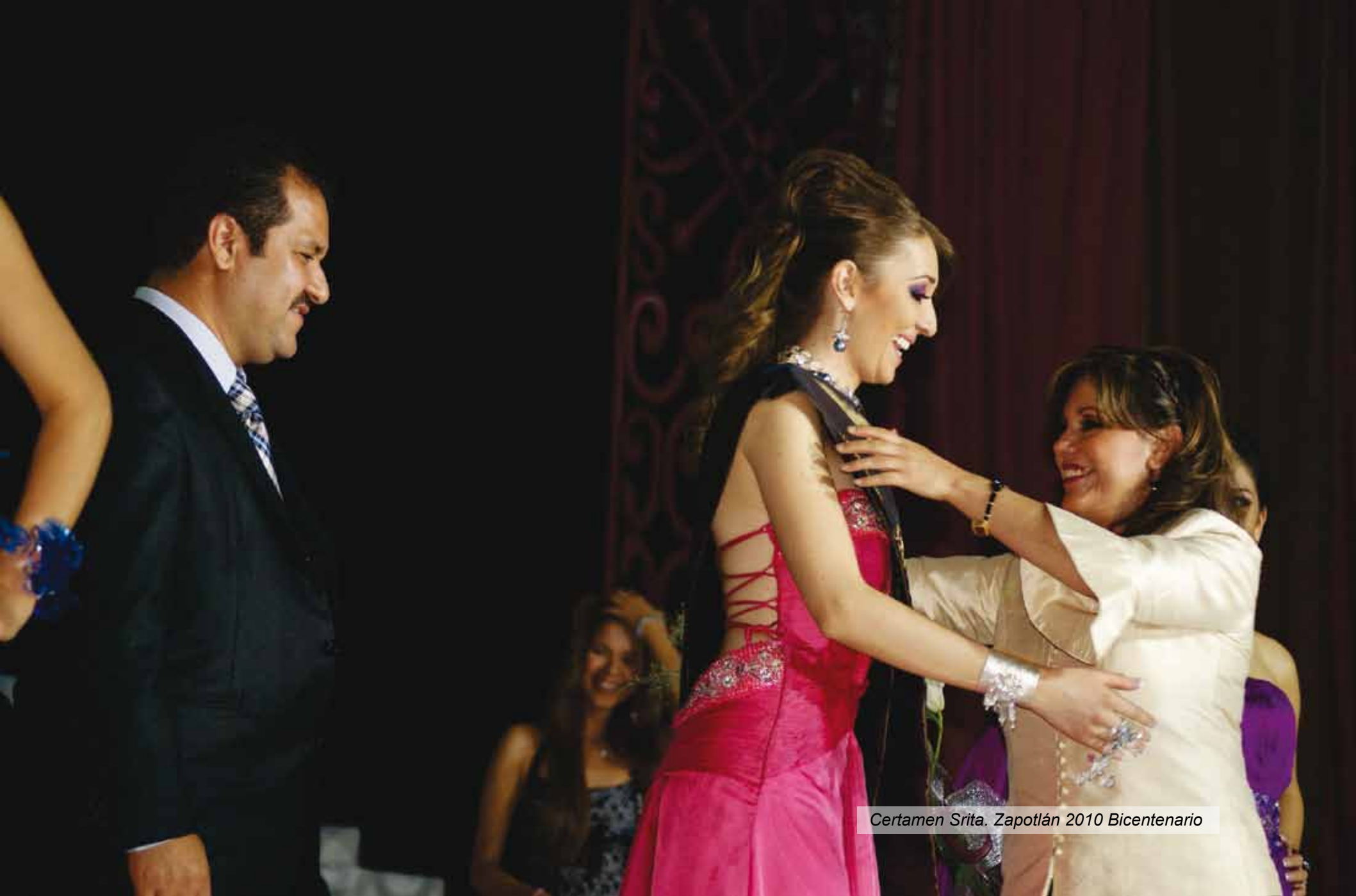
Certamen Srta. Zapotlán 2010 Bicentenario