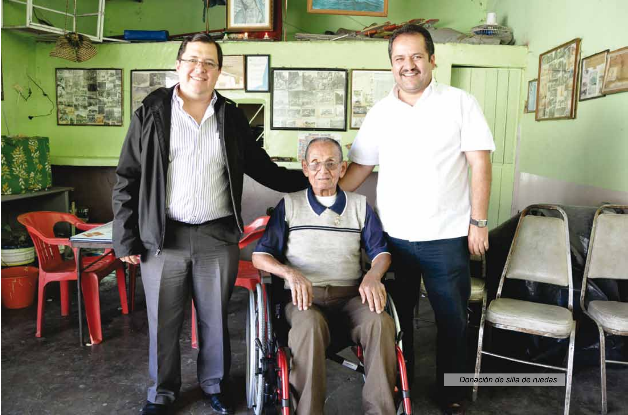
Donación de silla de ruedas