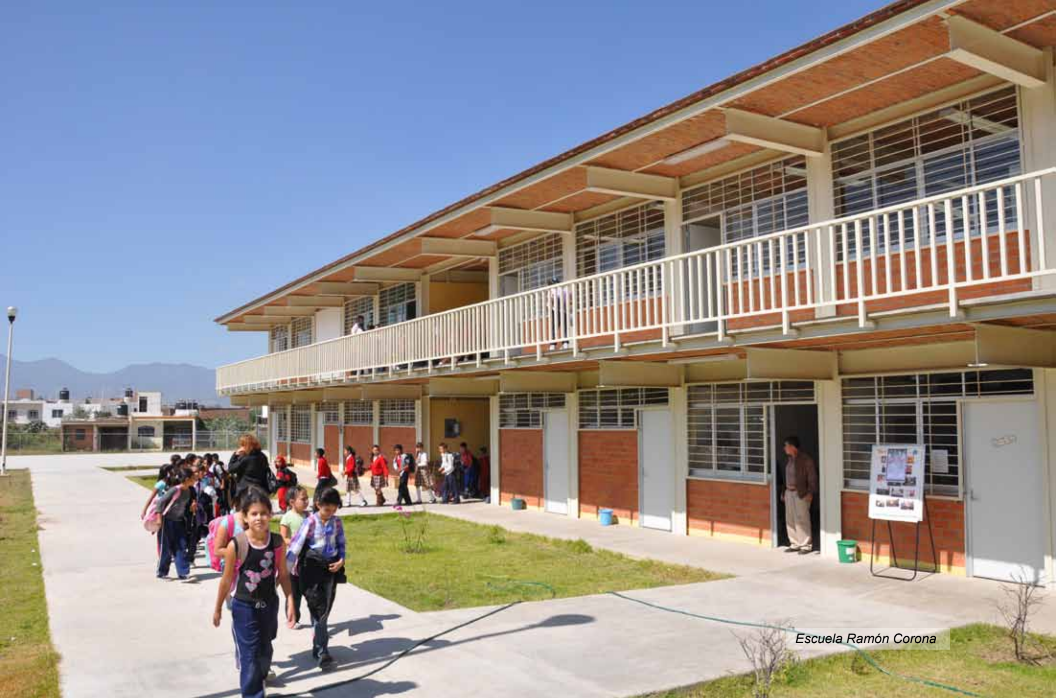
Escuela Ramón Corona