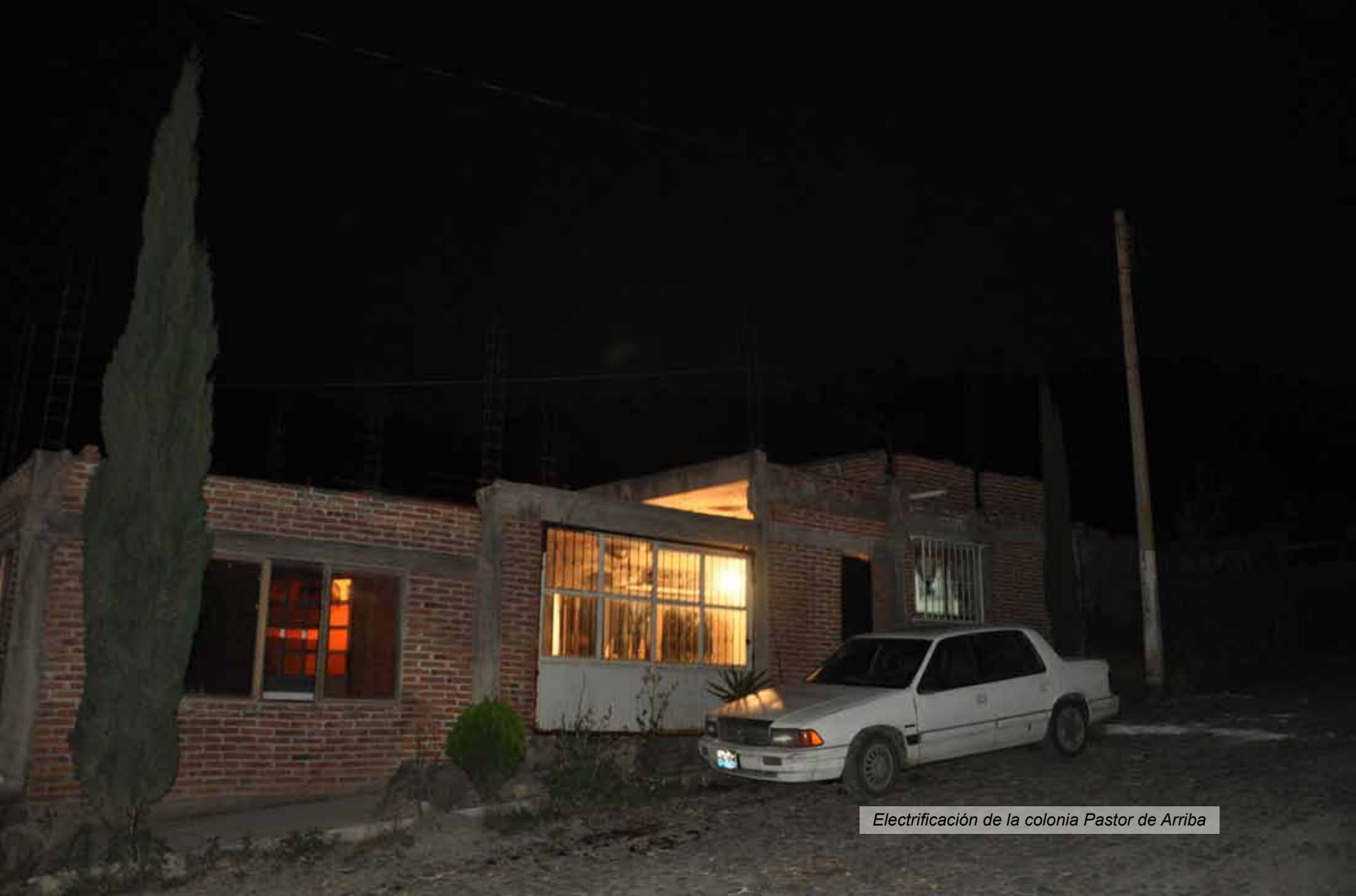
Electrificación de la colonia Pastor de Arriba