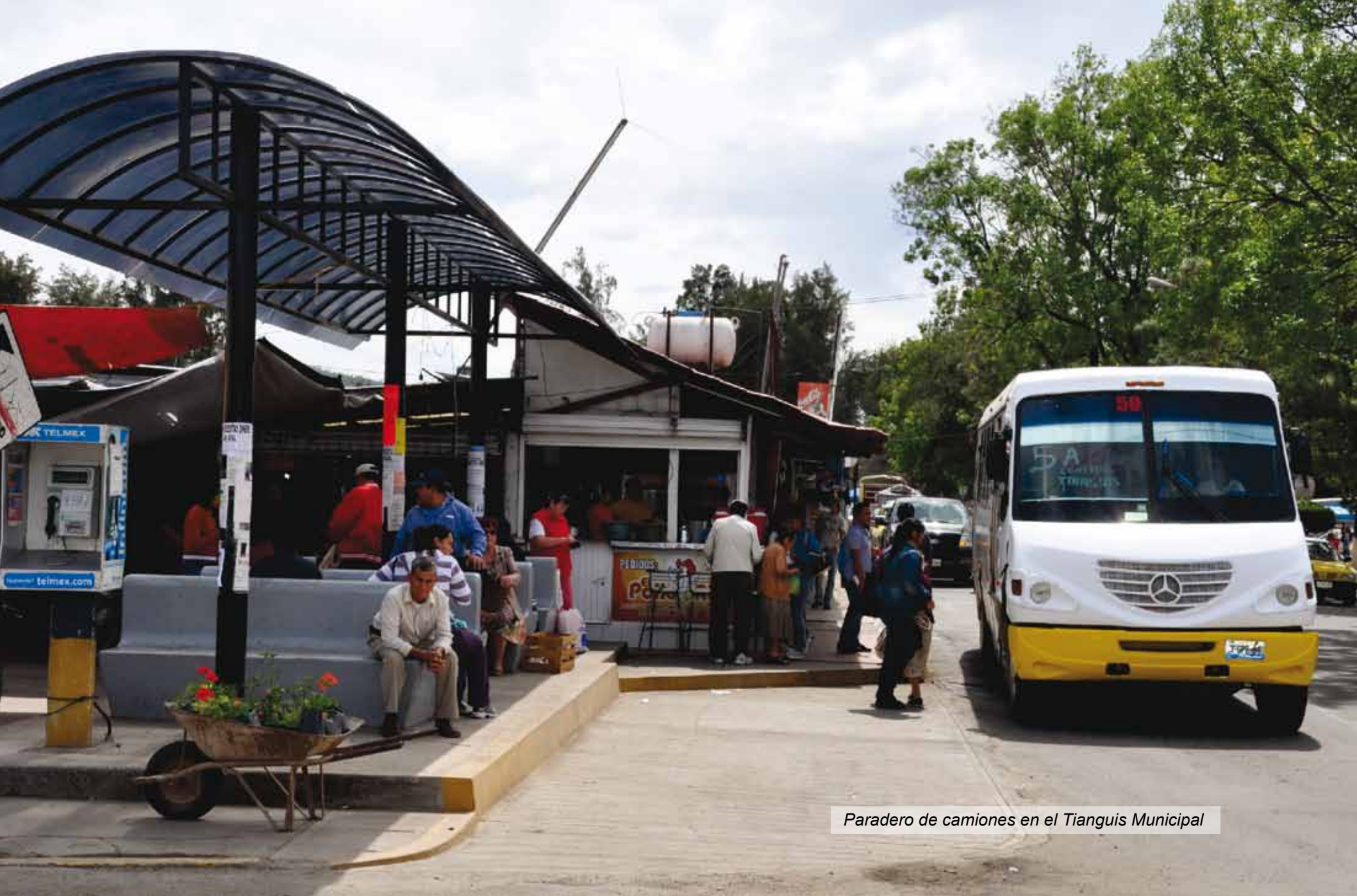
Paradero de camiones en el Tianguis Municipal