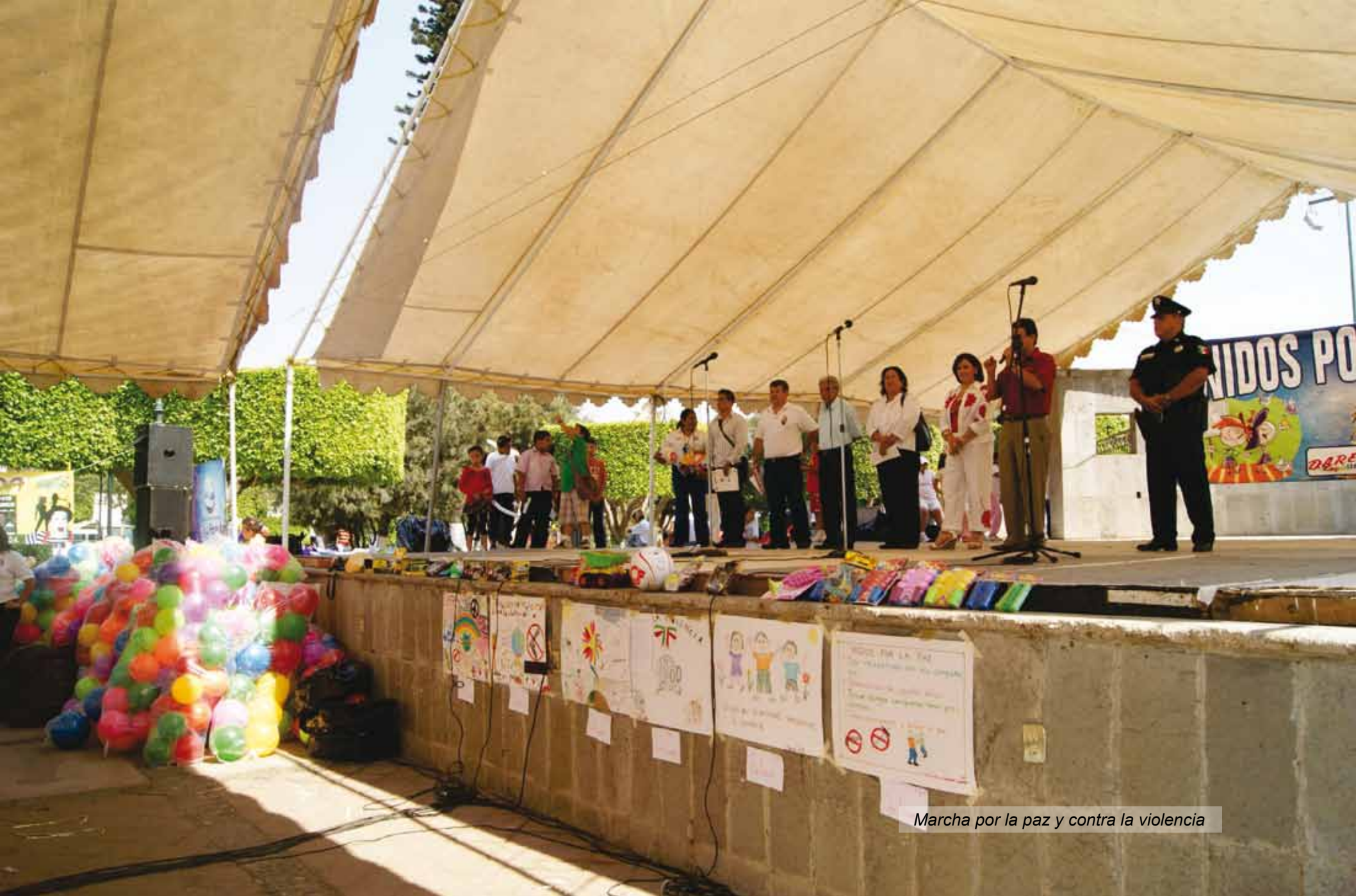
Marcha por la paz y contra la violencia