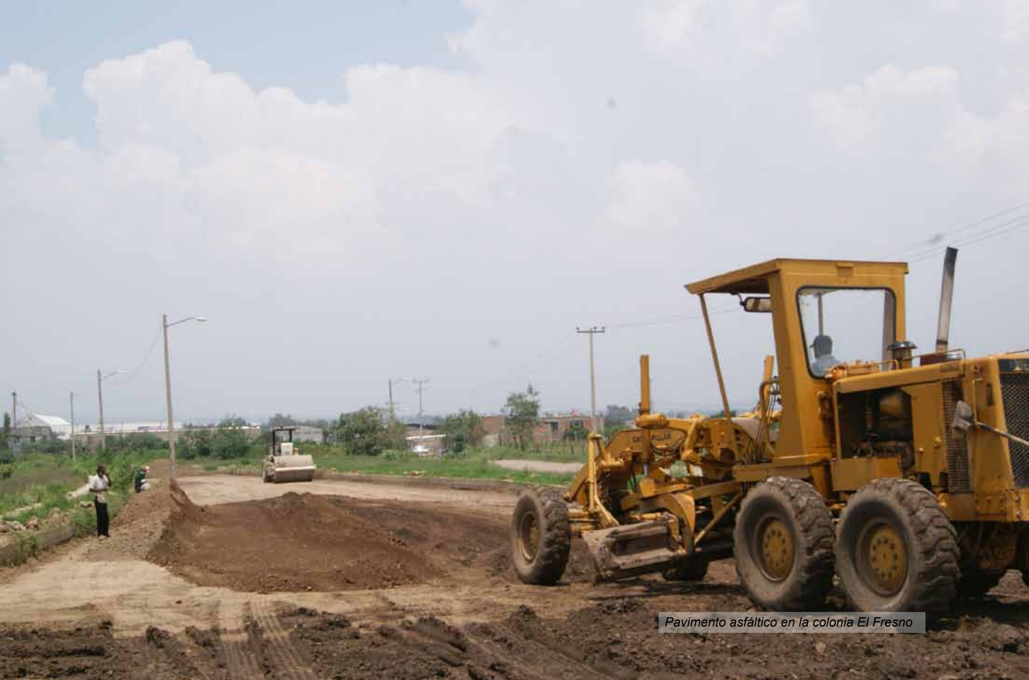
Pavimento asfáltico en la colonia El Fresno