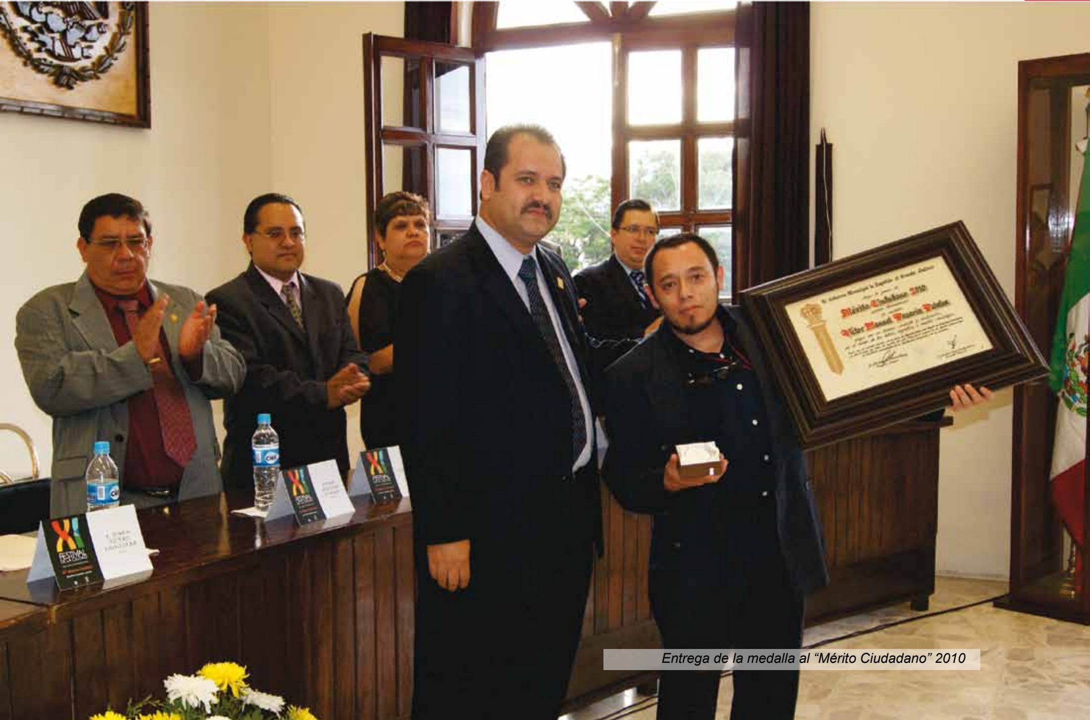
Entrega de la medalla al "Mérito Ciudadano" 2010