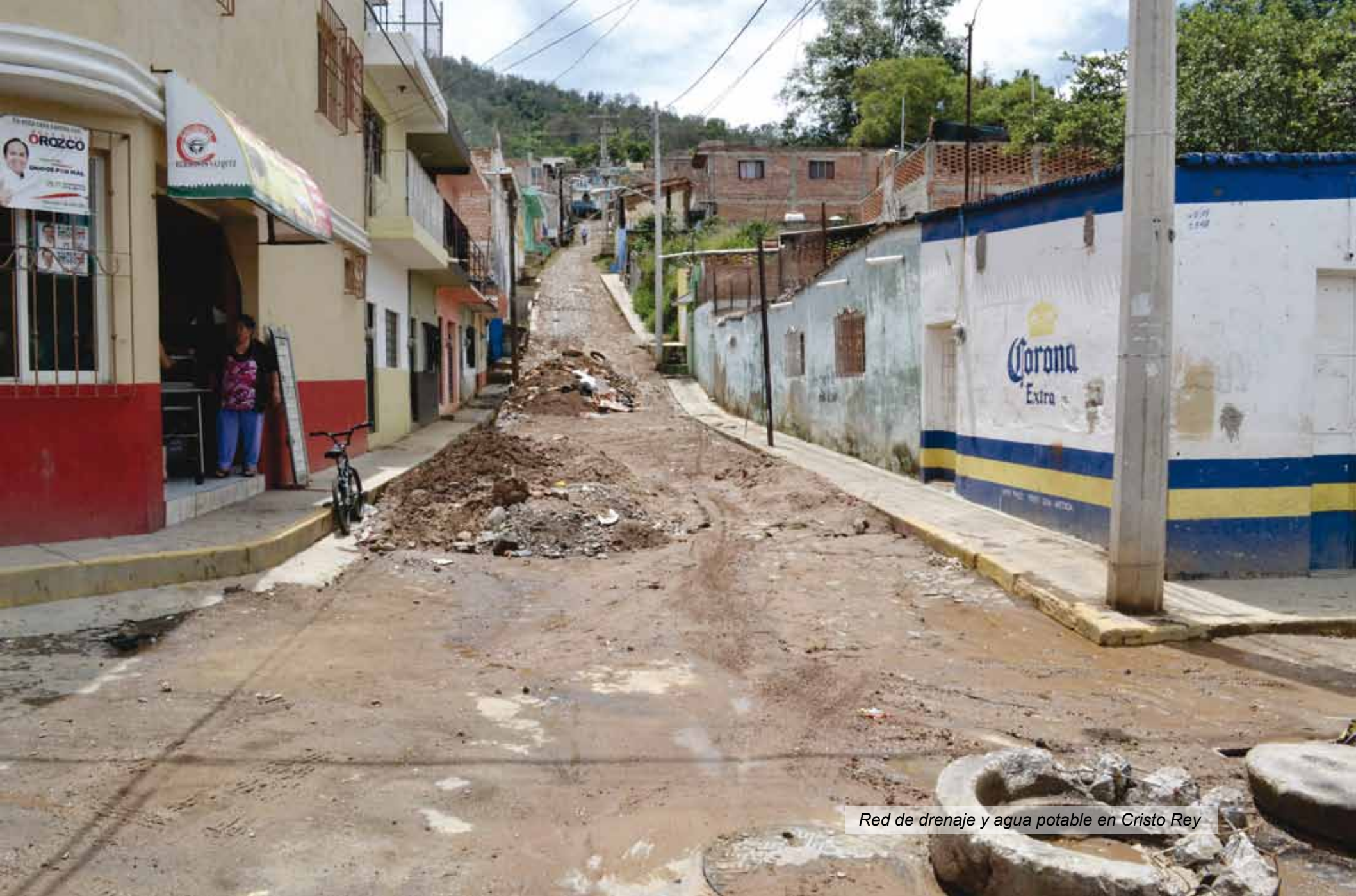
Red de drenaje y agua potable en Cristo Rey