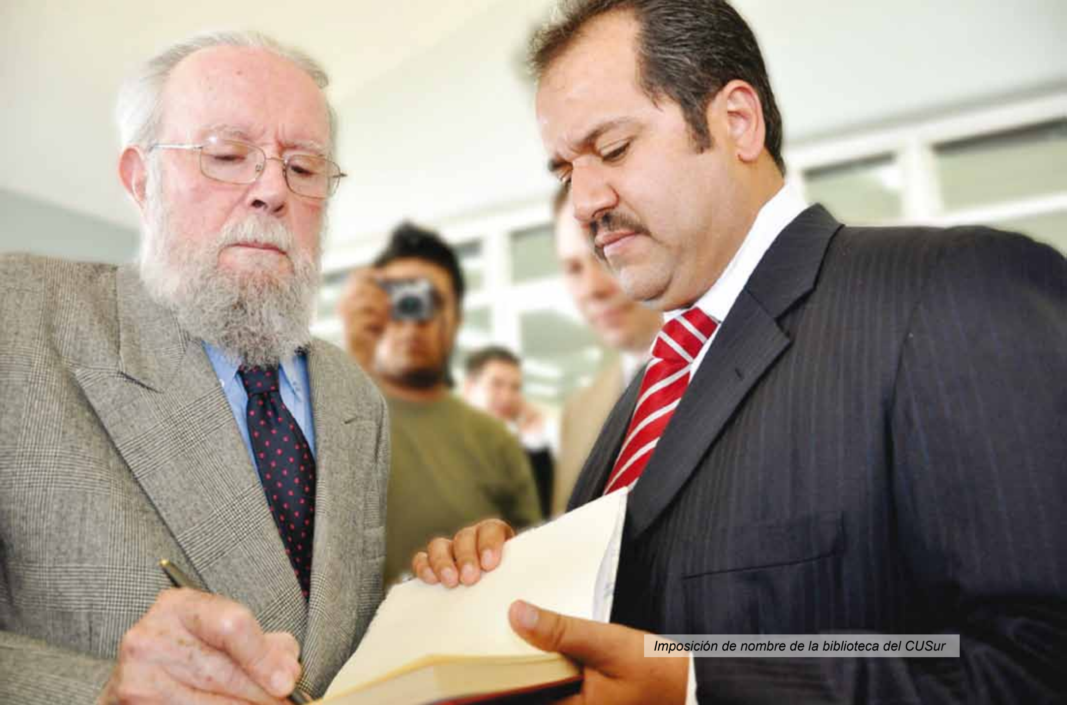
Imposición de nombre de la biblioteca del CUSur