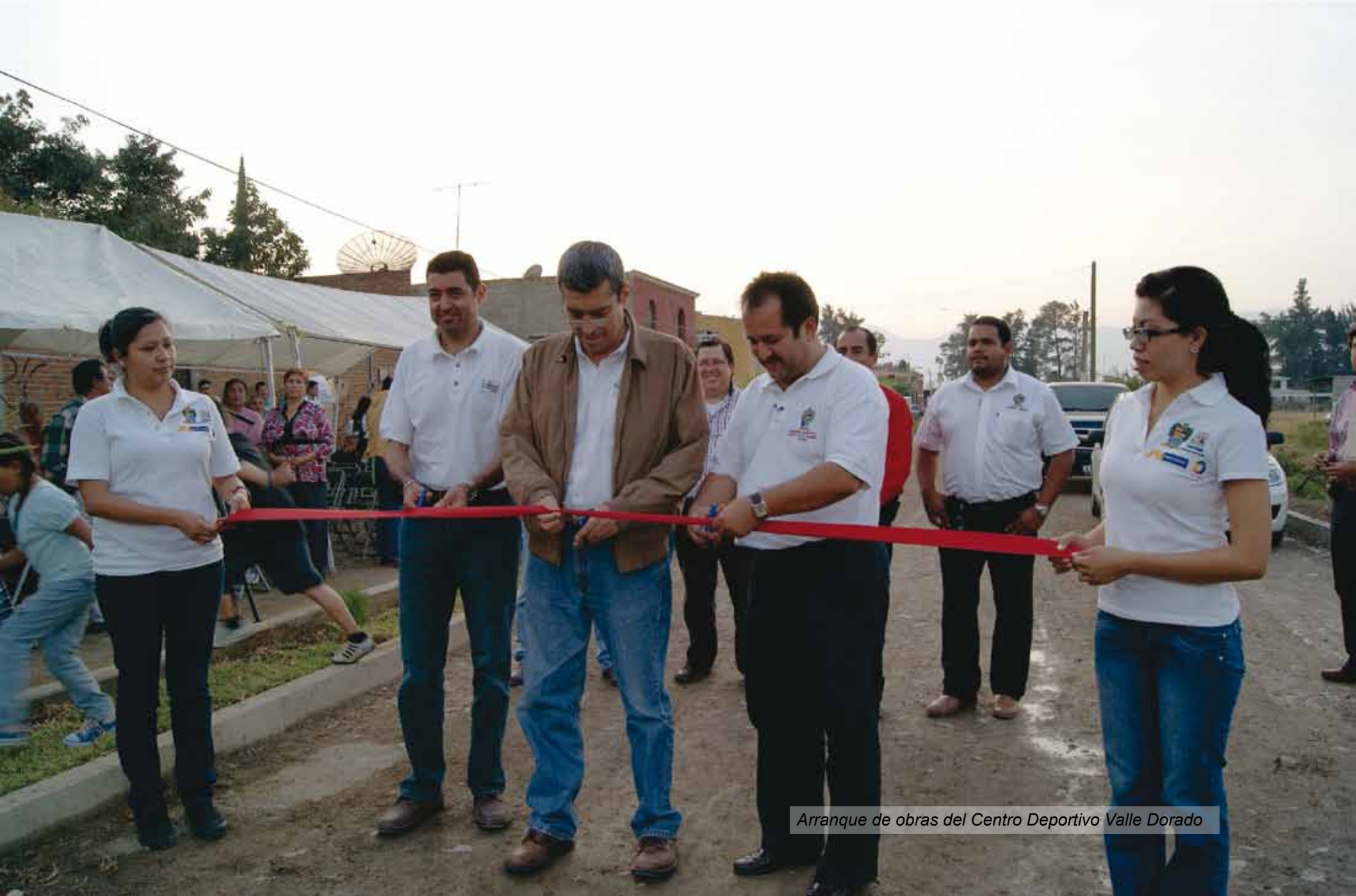
Arranque de obras del Centro Deportivo Valle Dorado