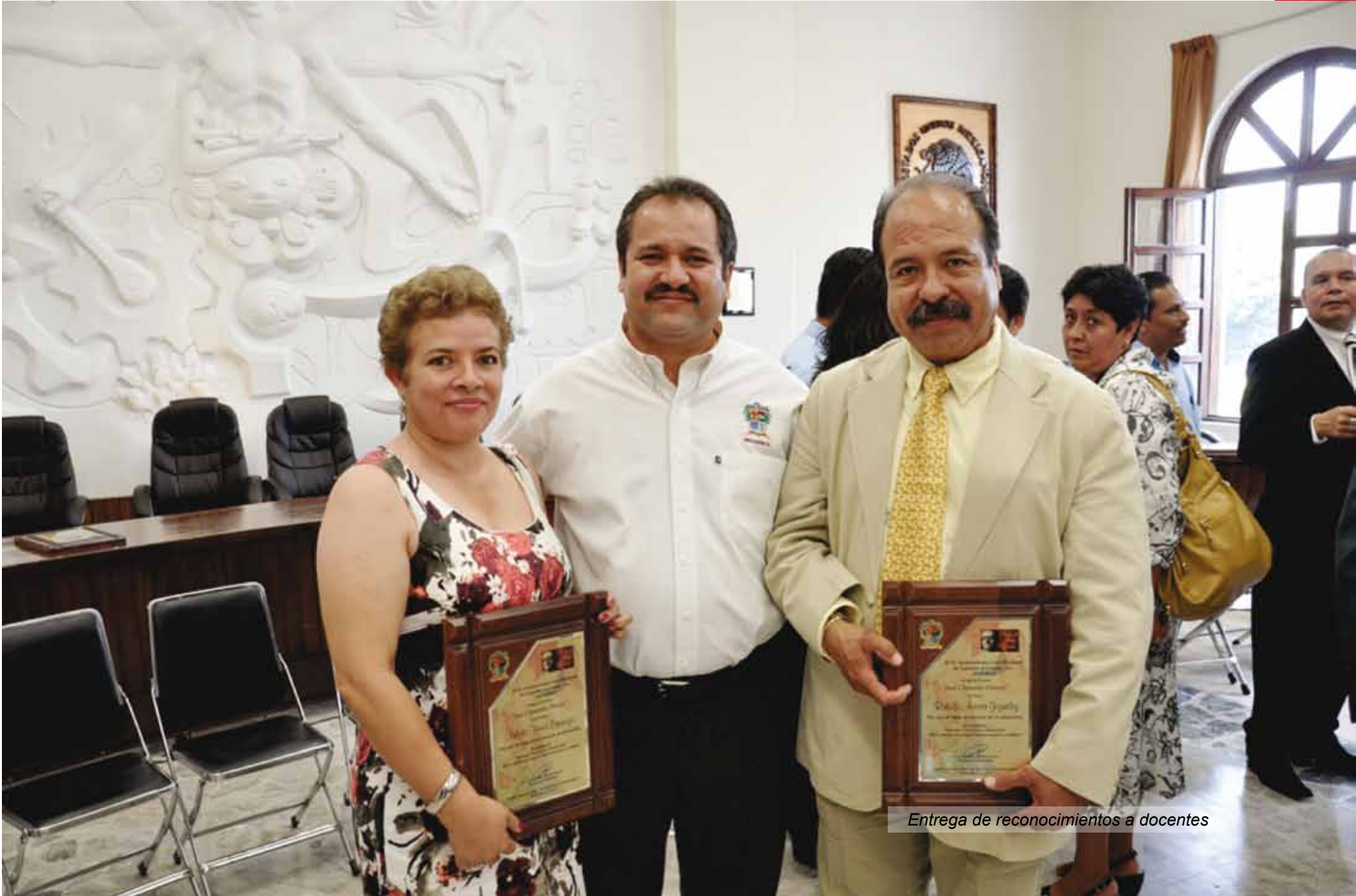
Entrega de reconocimientos a docentes