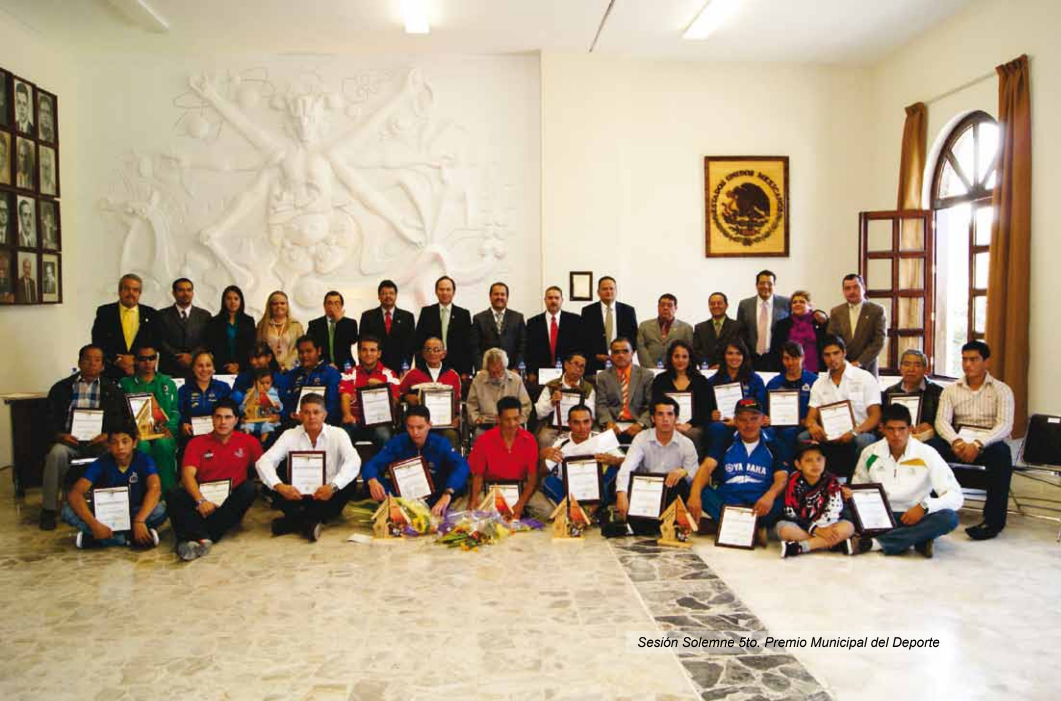
Sesión Solemne 5to. Premio Municipal del Deporte