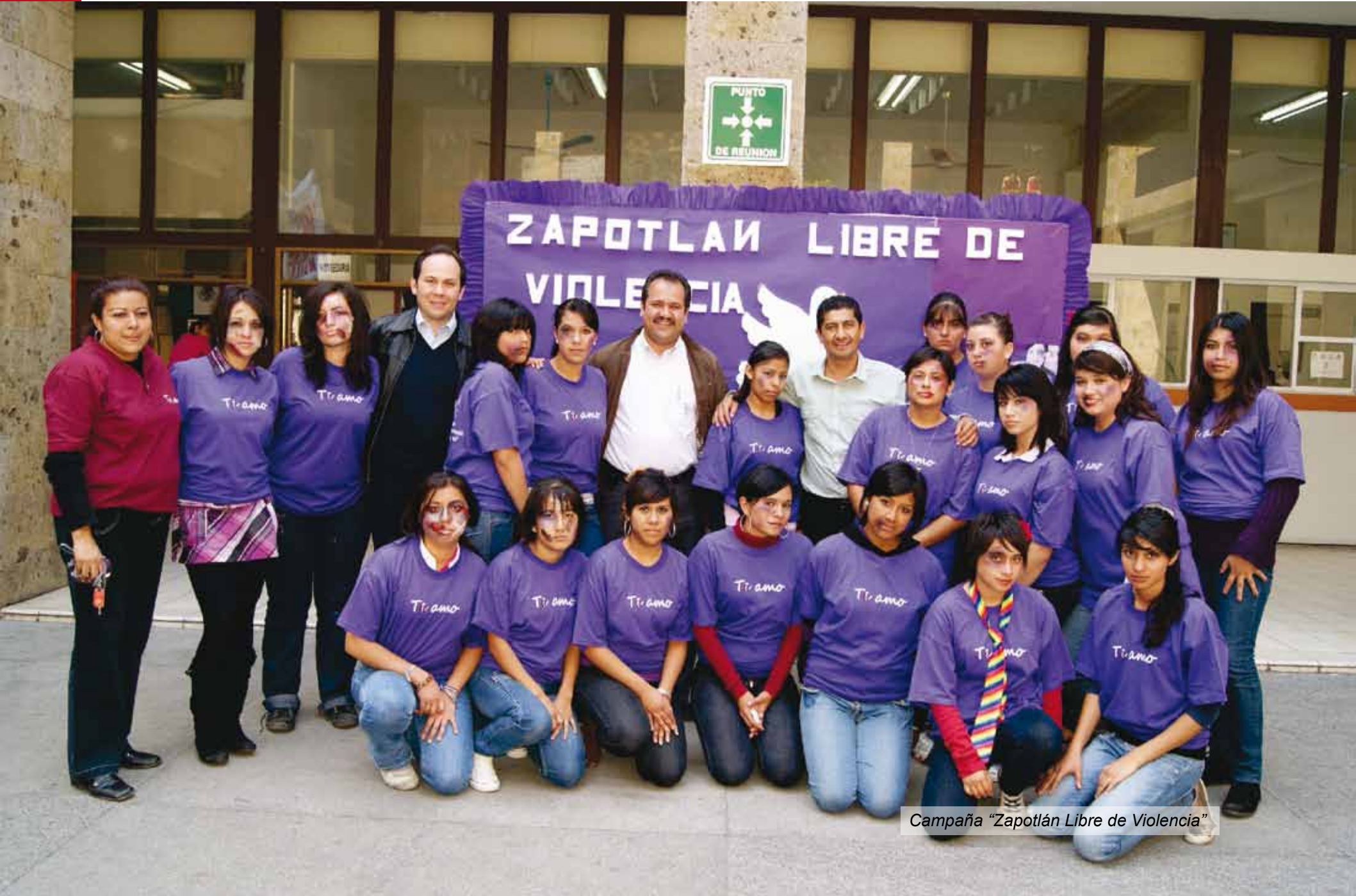
Campaña "Zapotlán Libre de Violencia"