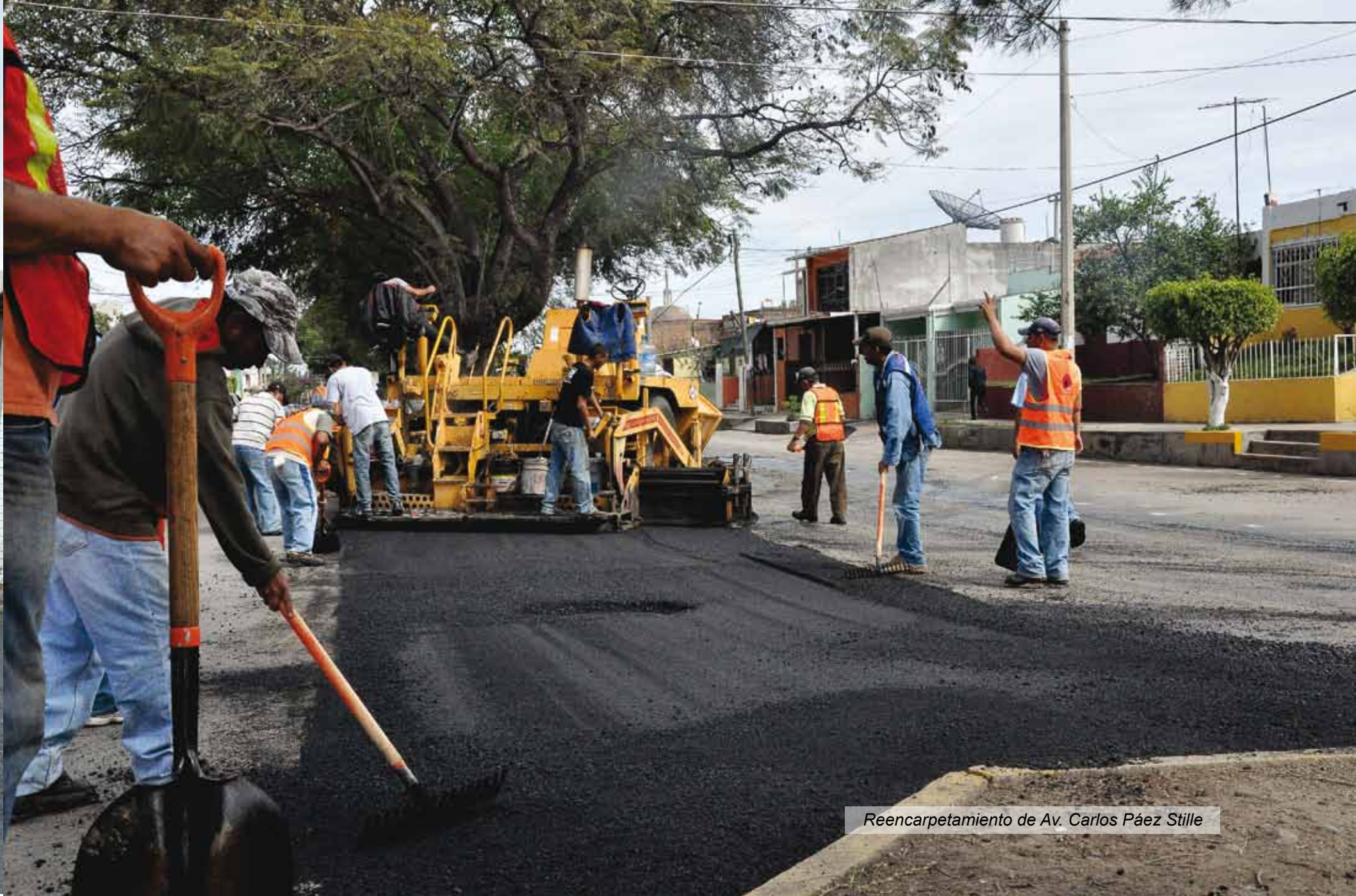
Reencarpétamiento de Av. Carlos Páez Stille