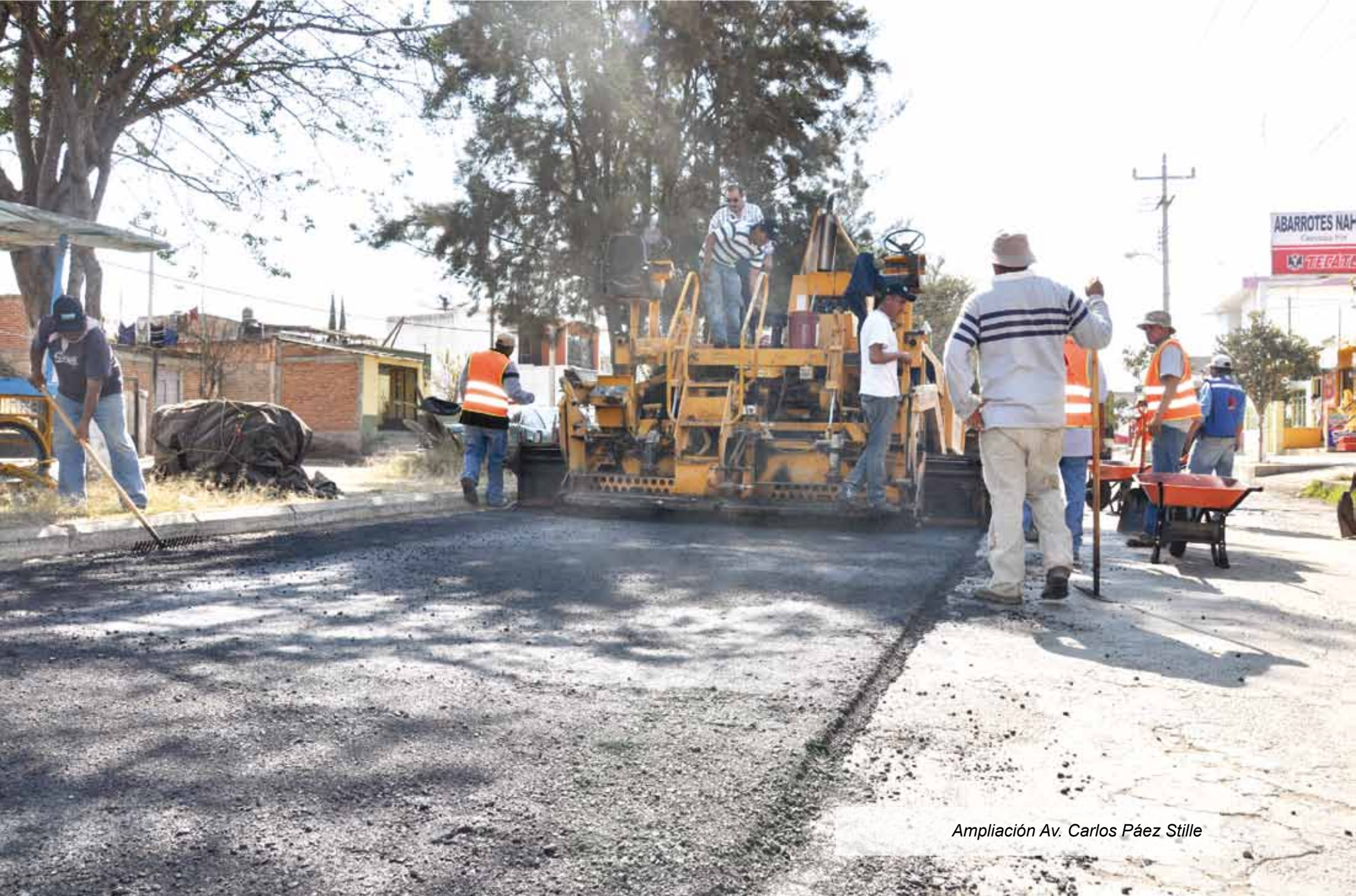
Ampliación Av. Carlos Páez Stille