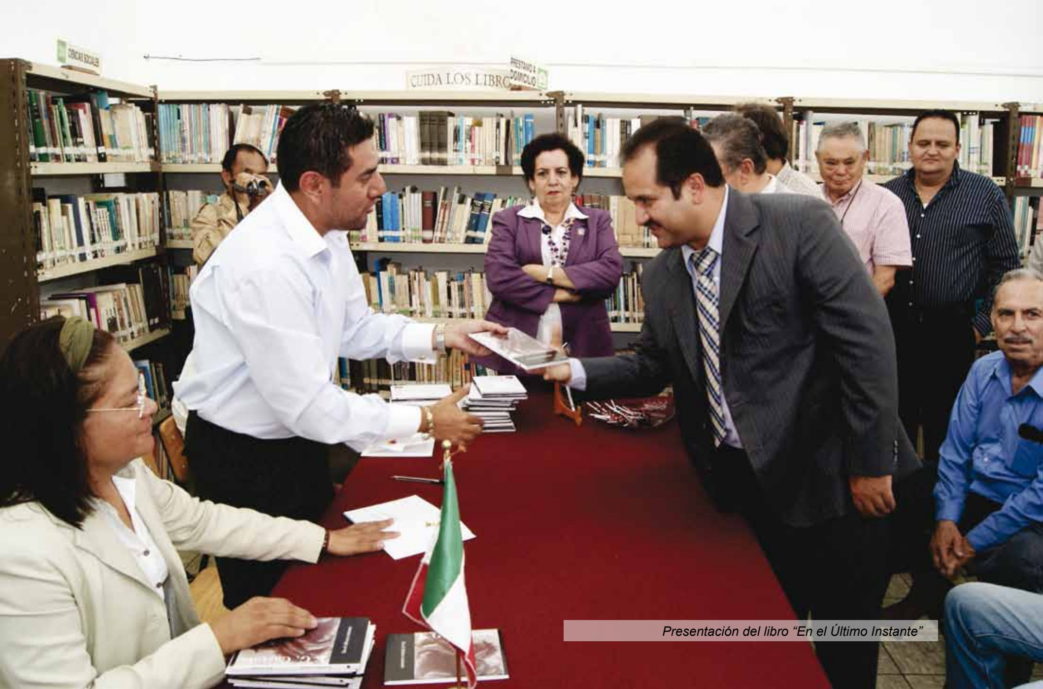
Presentación del libro "En el Último Instante"