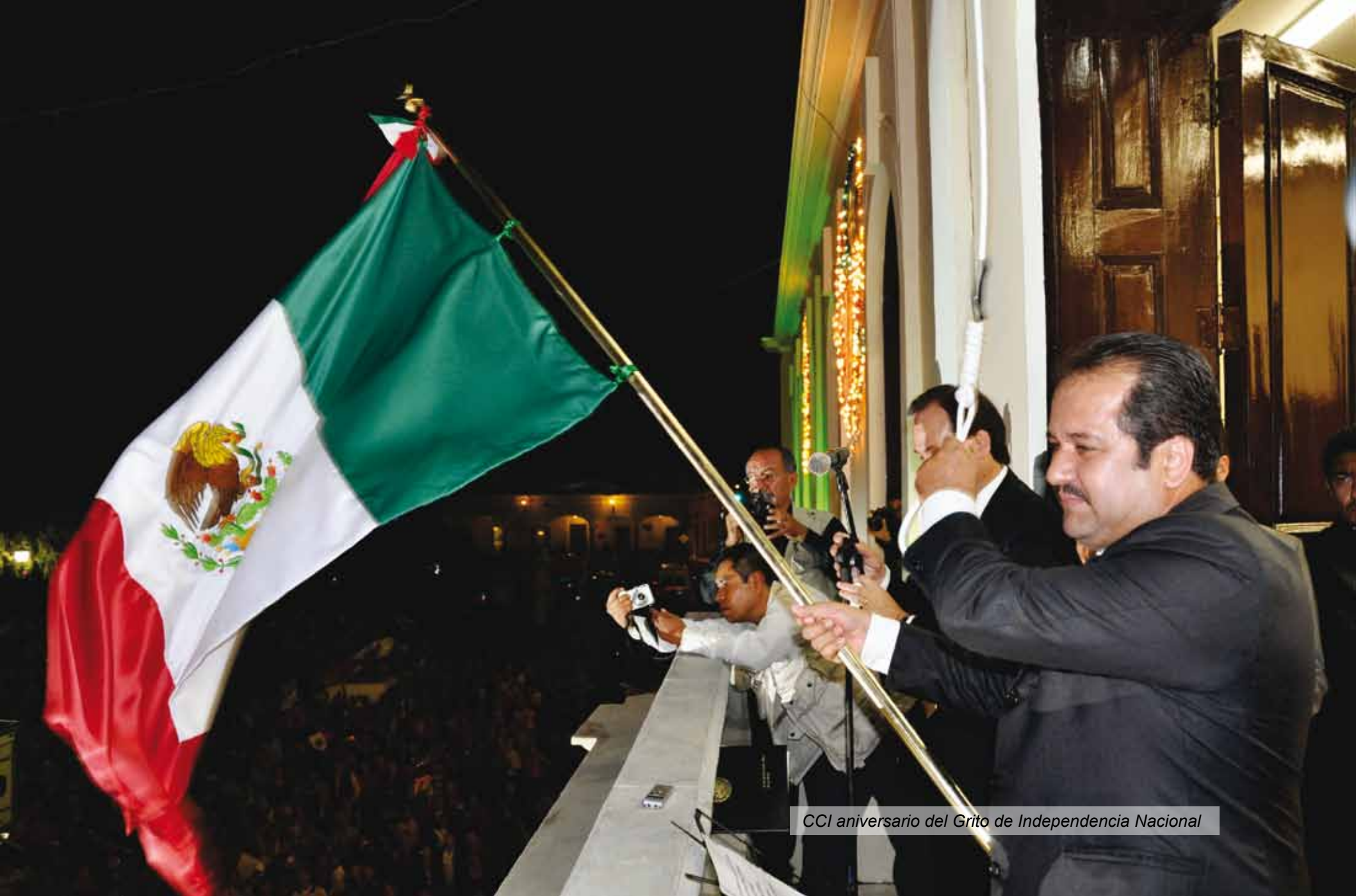
CCI aniversario del Grito de Independencia Nacional