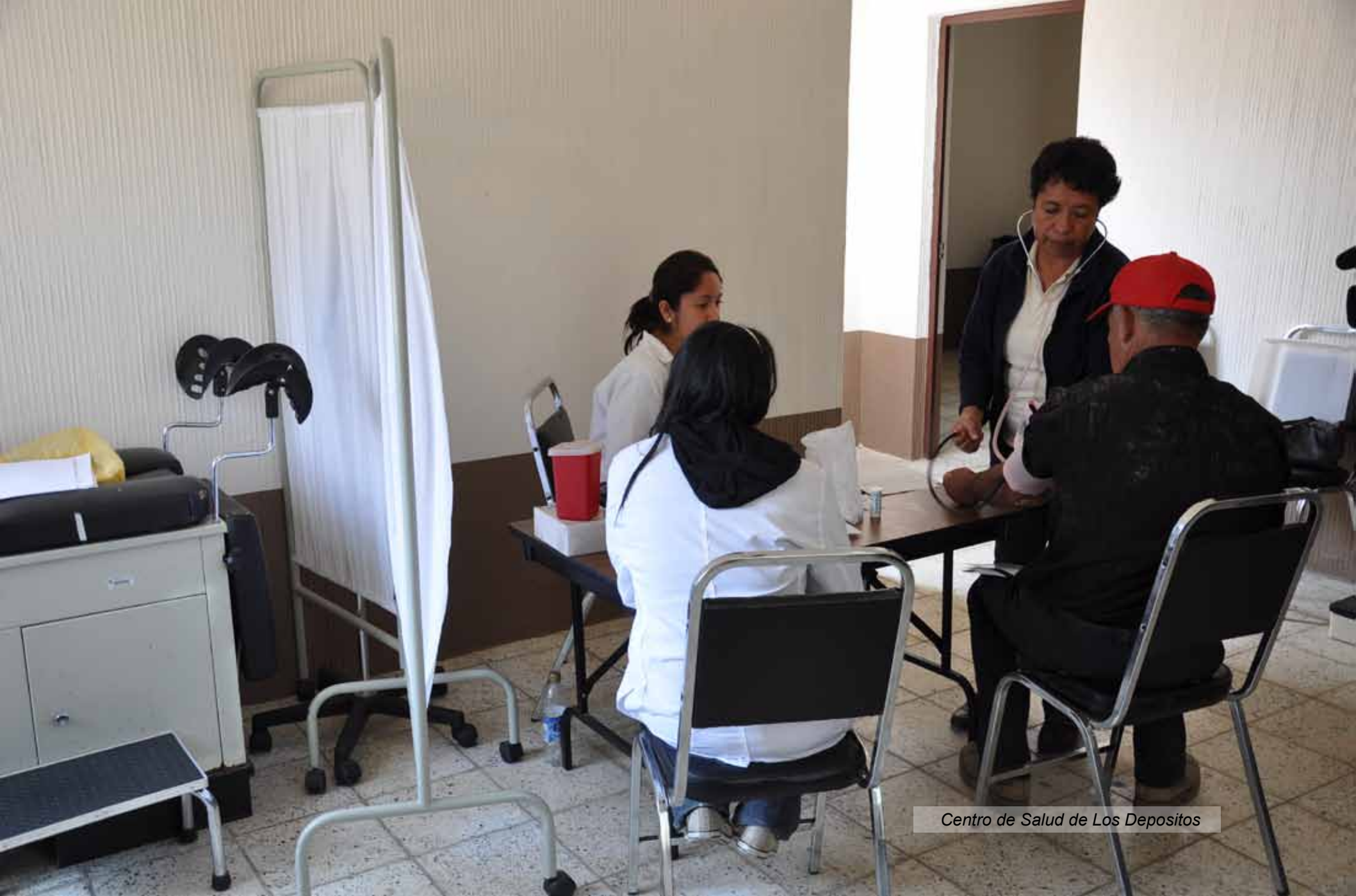
Centro de Salud de Los Depositos