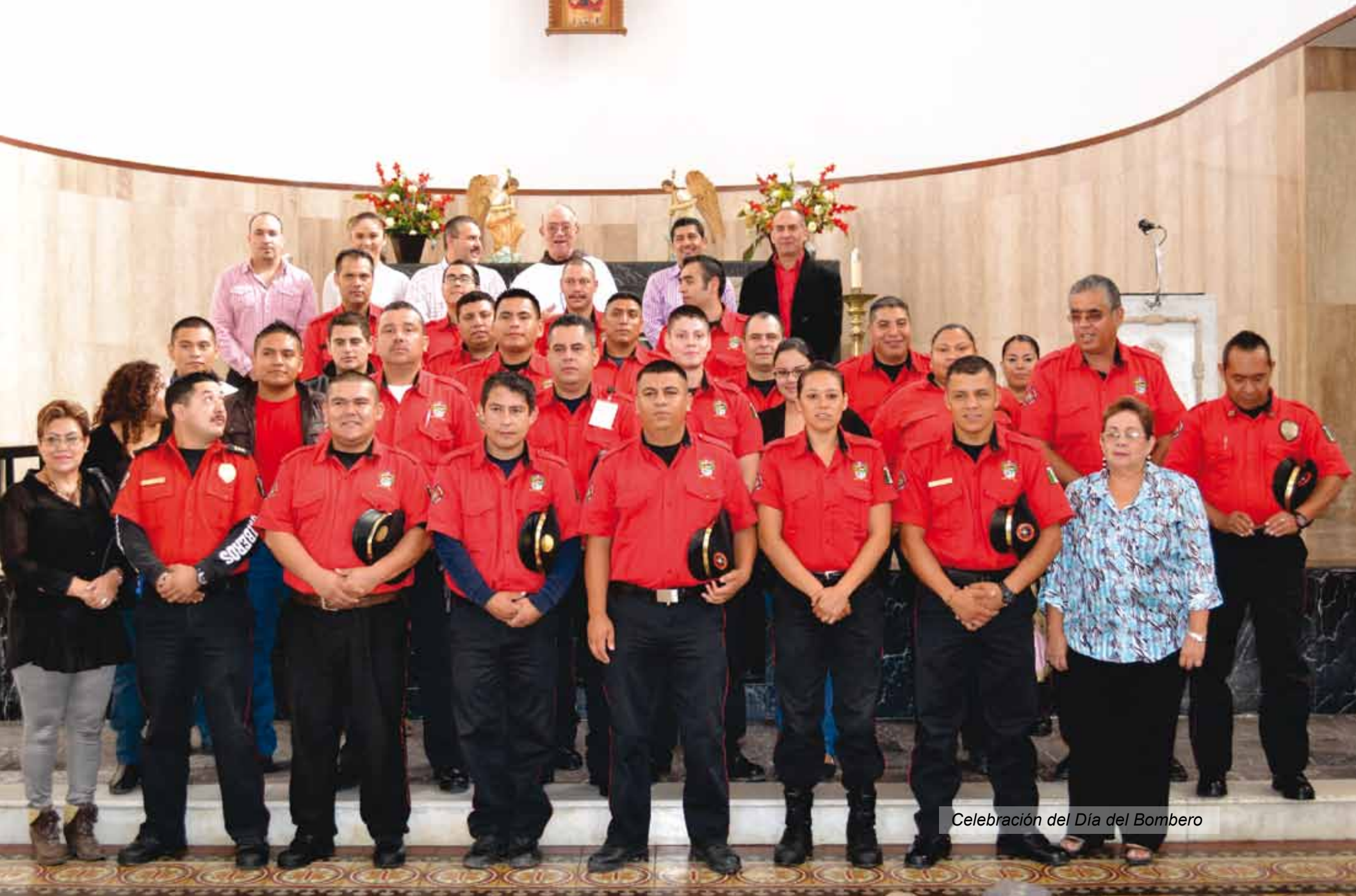
Celebración del Día del Bombero