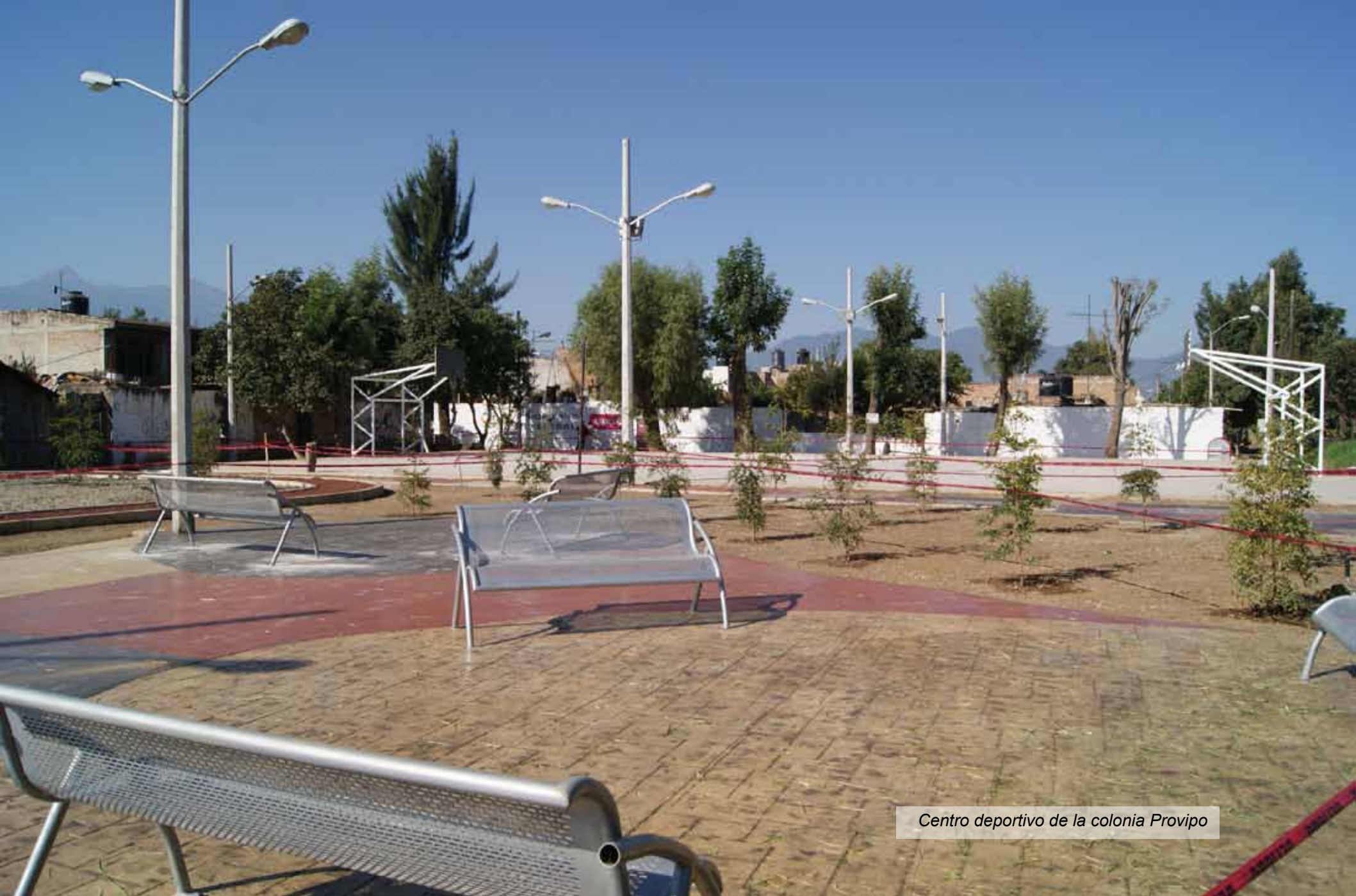
Centro deportivo de la colonia Provipo