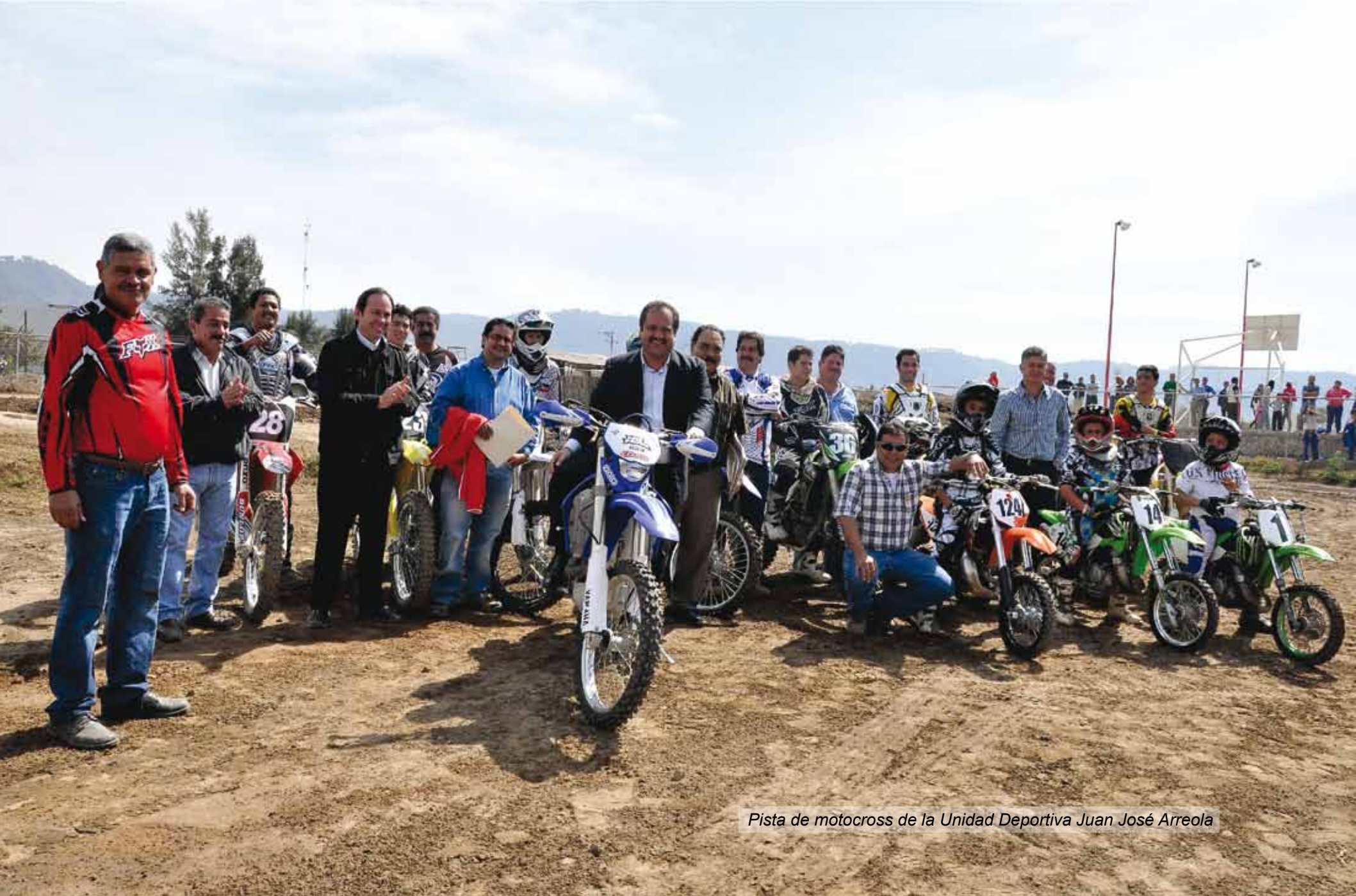
Pista de motocross de la Unidad Deportiva Juan José Arreola