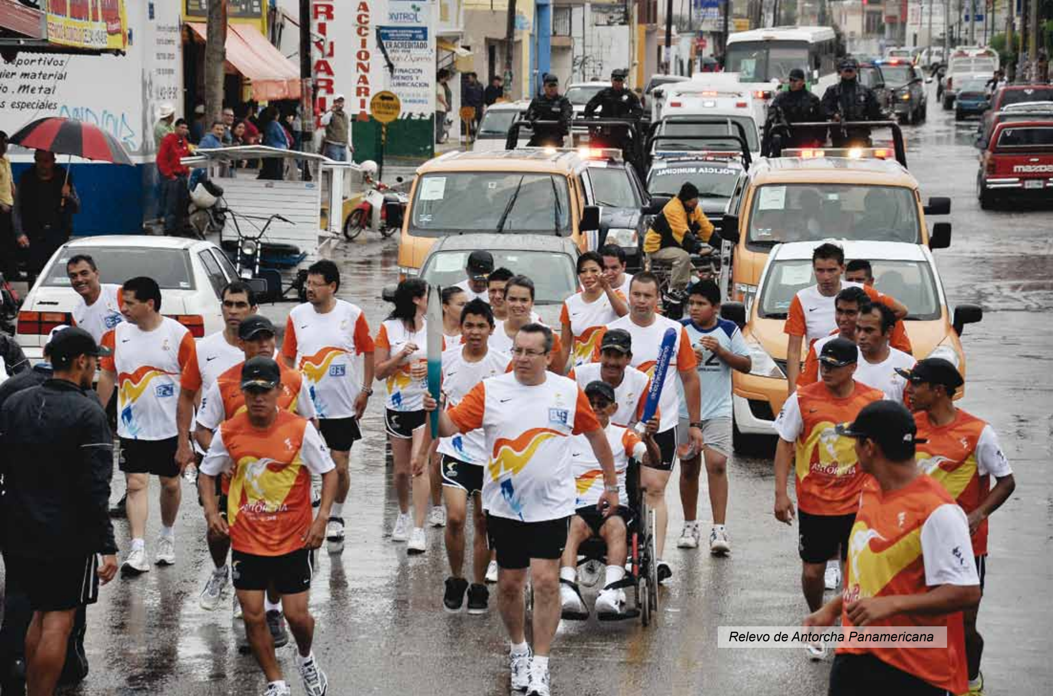
Relevo de Antorcha Panamericana