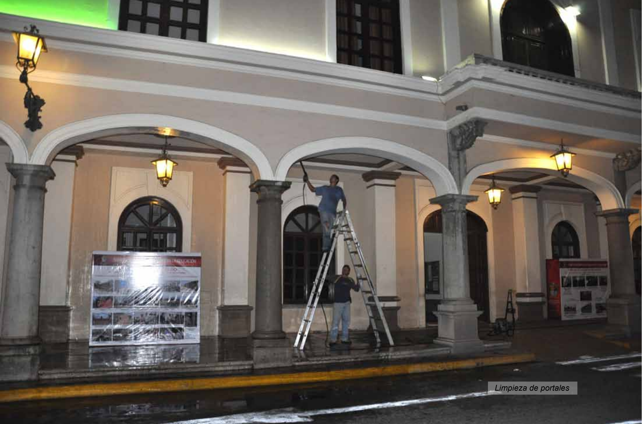
Limpieza de portales