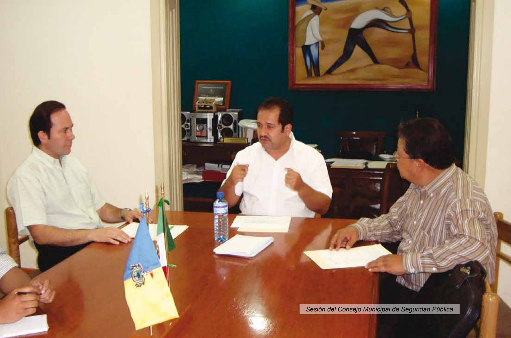
Sesión del Consejo Municipal de Seguridad Pública