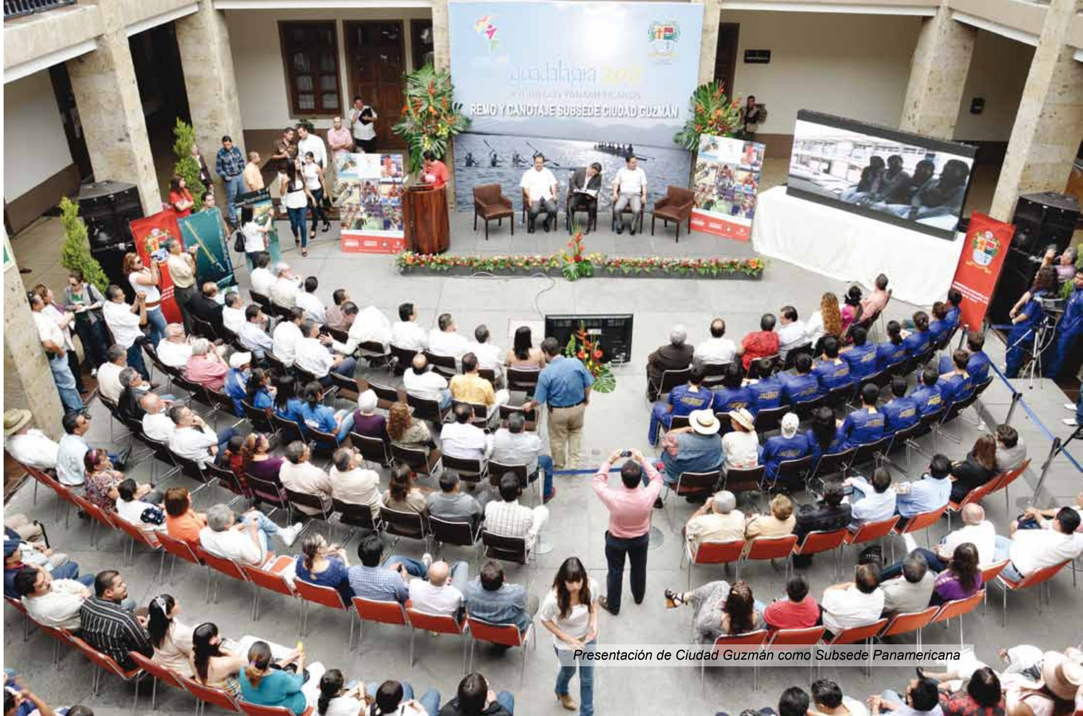
Presentación de Ciudad Guzmán como Subsede Panamericana