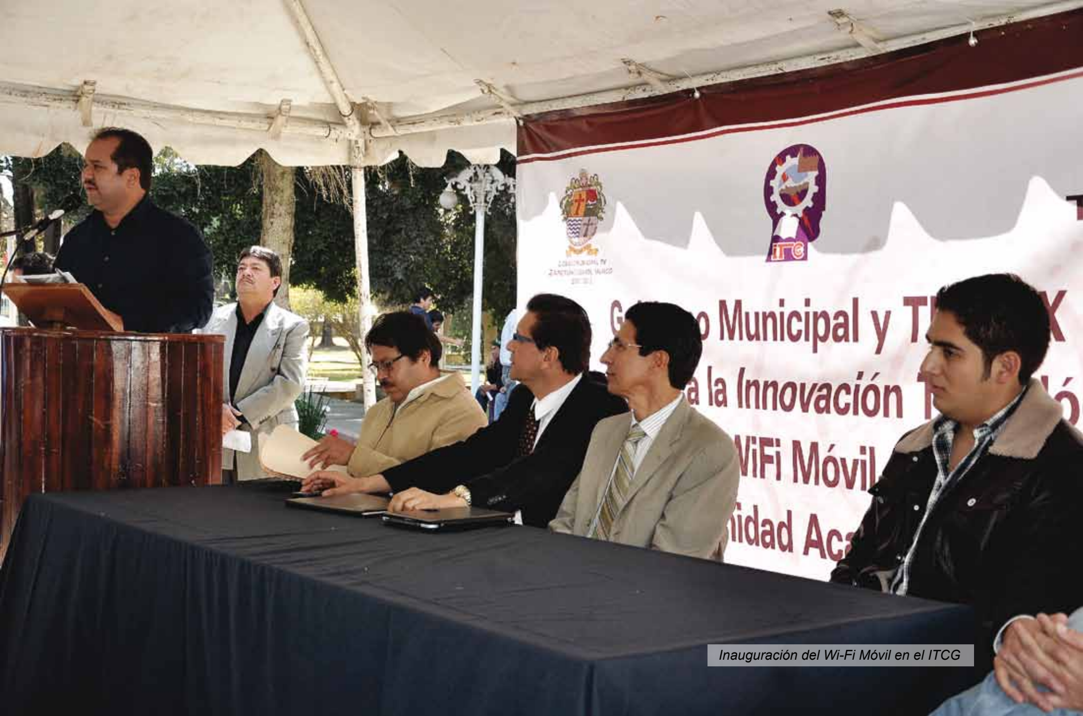
Inauguración del Wi-Fi Móvil en el ITCG