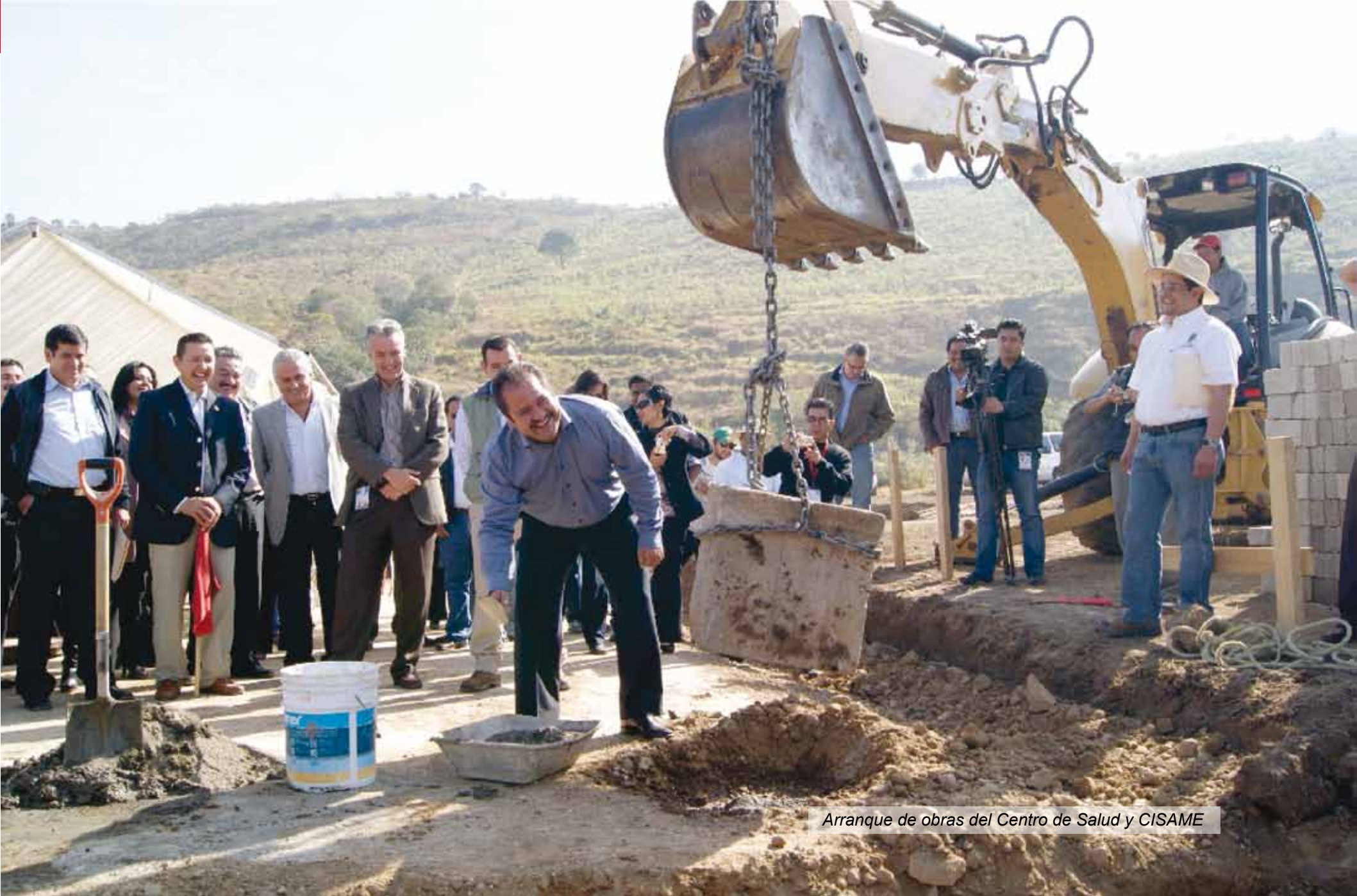
Arranque de obras del Centro de Salud y CISAME