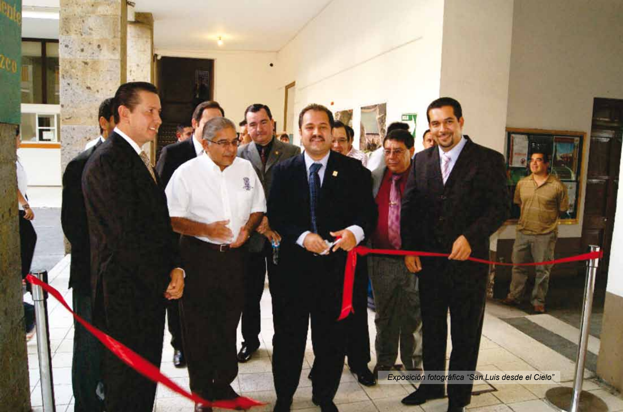
Exposición fotográfica "San Luis desde el Cielo"