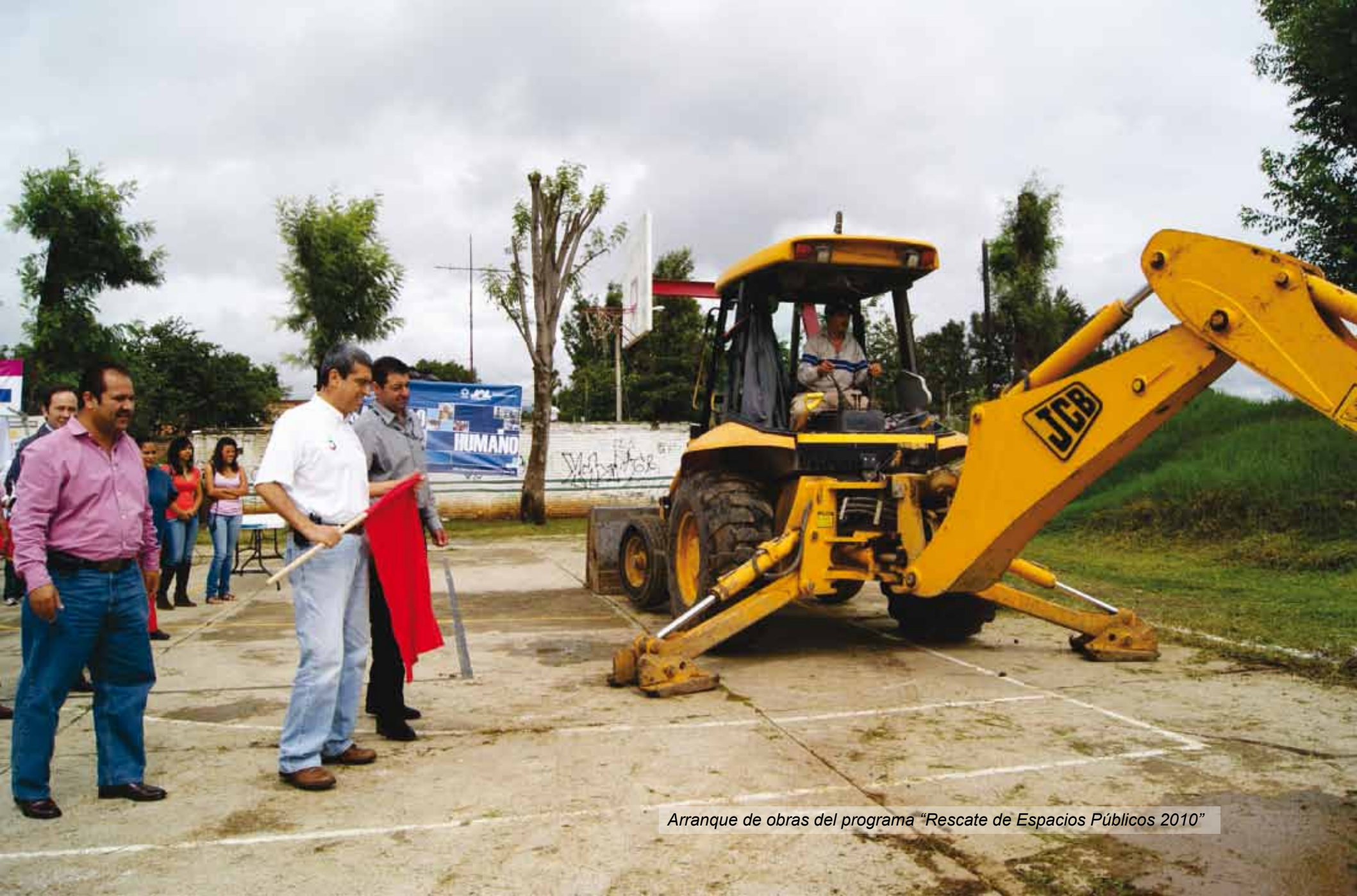
Arranque de obras del programa "Rescate de Espacios Públicos 2010"