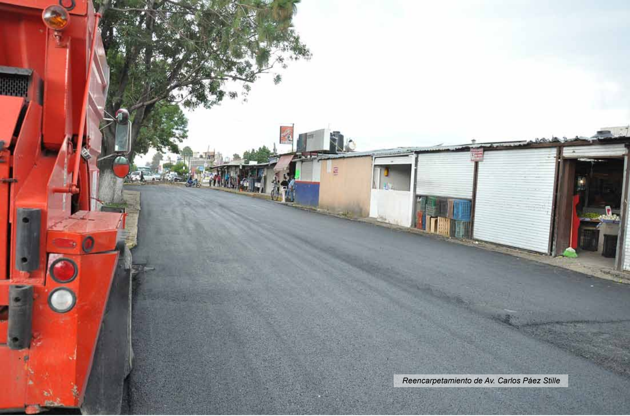
Reencarpetamiento de Av. Carlos Páez Stille