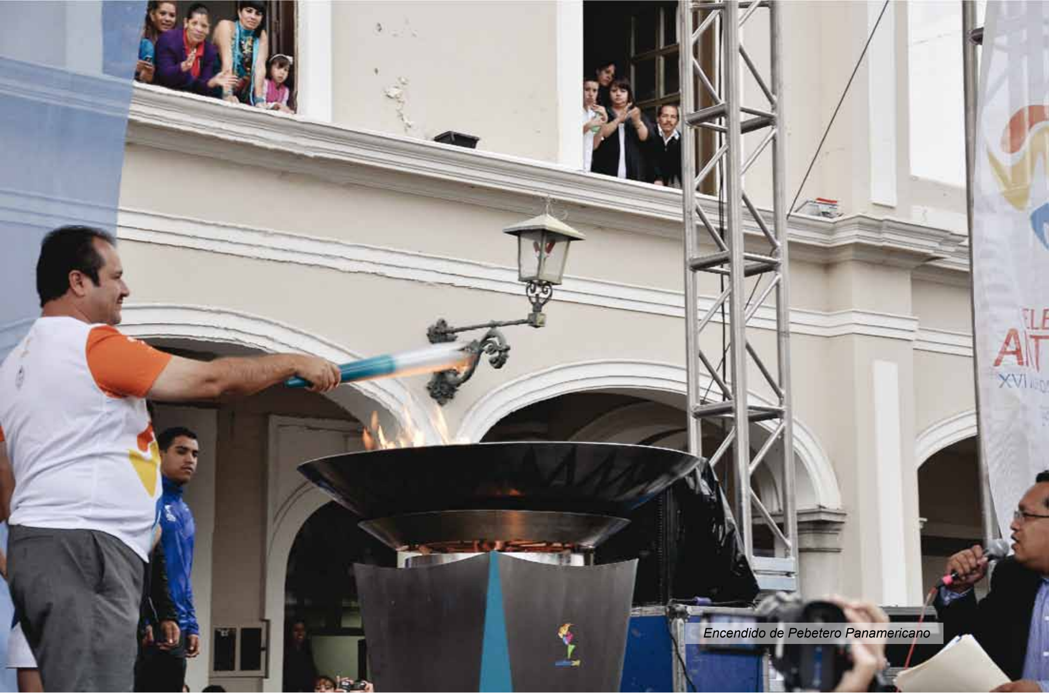
Encendido de Pebetero Panamericano