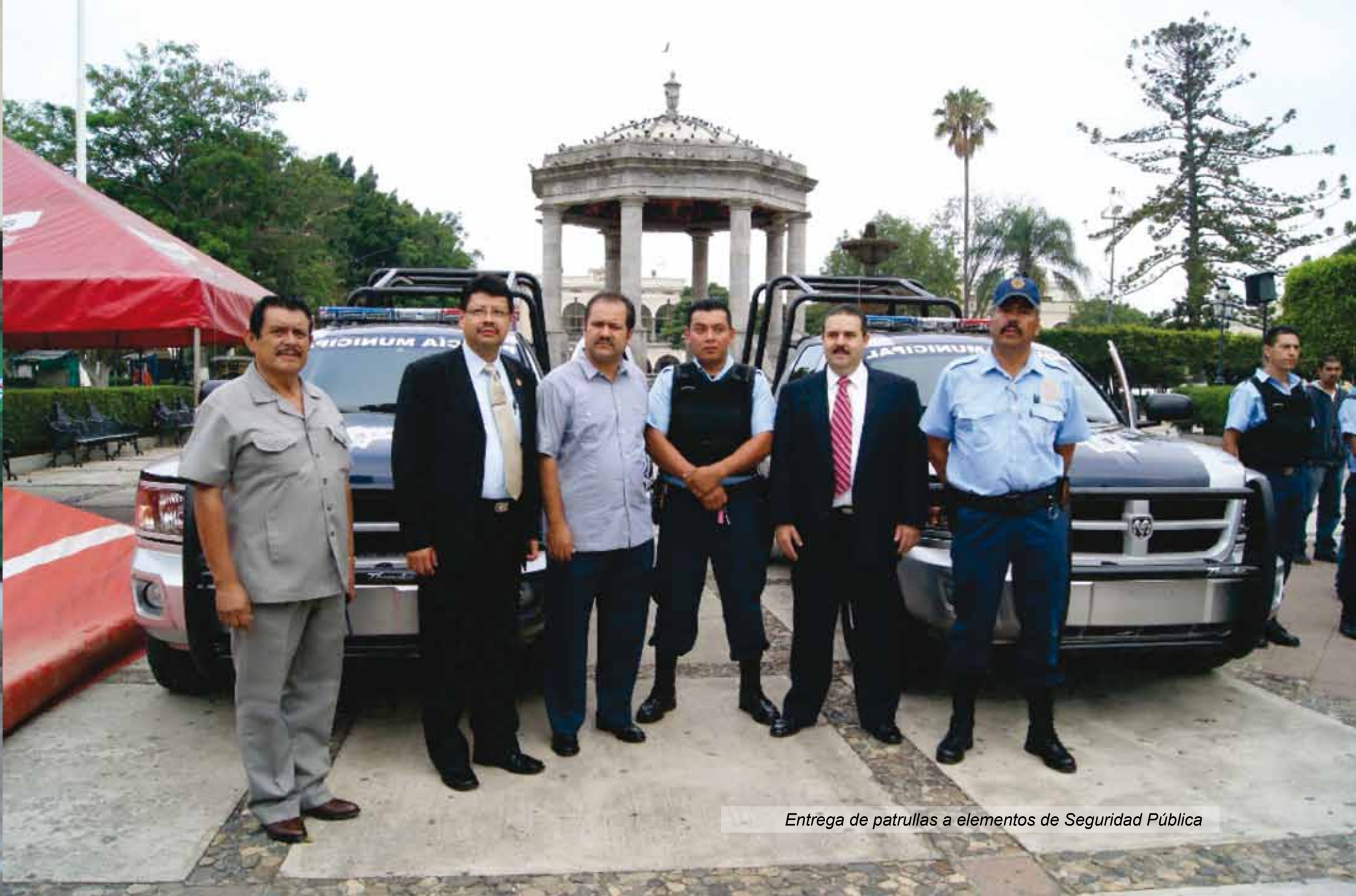
Entrega de patrullas a elementos de Seguridad Pública