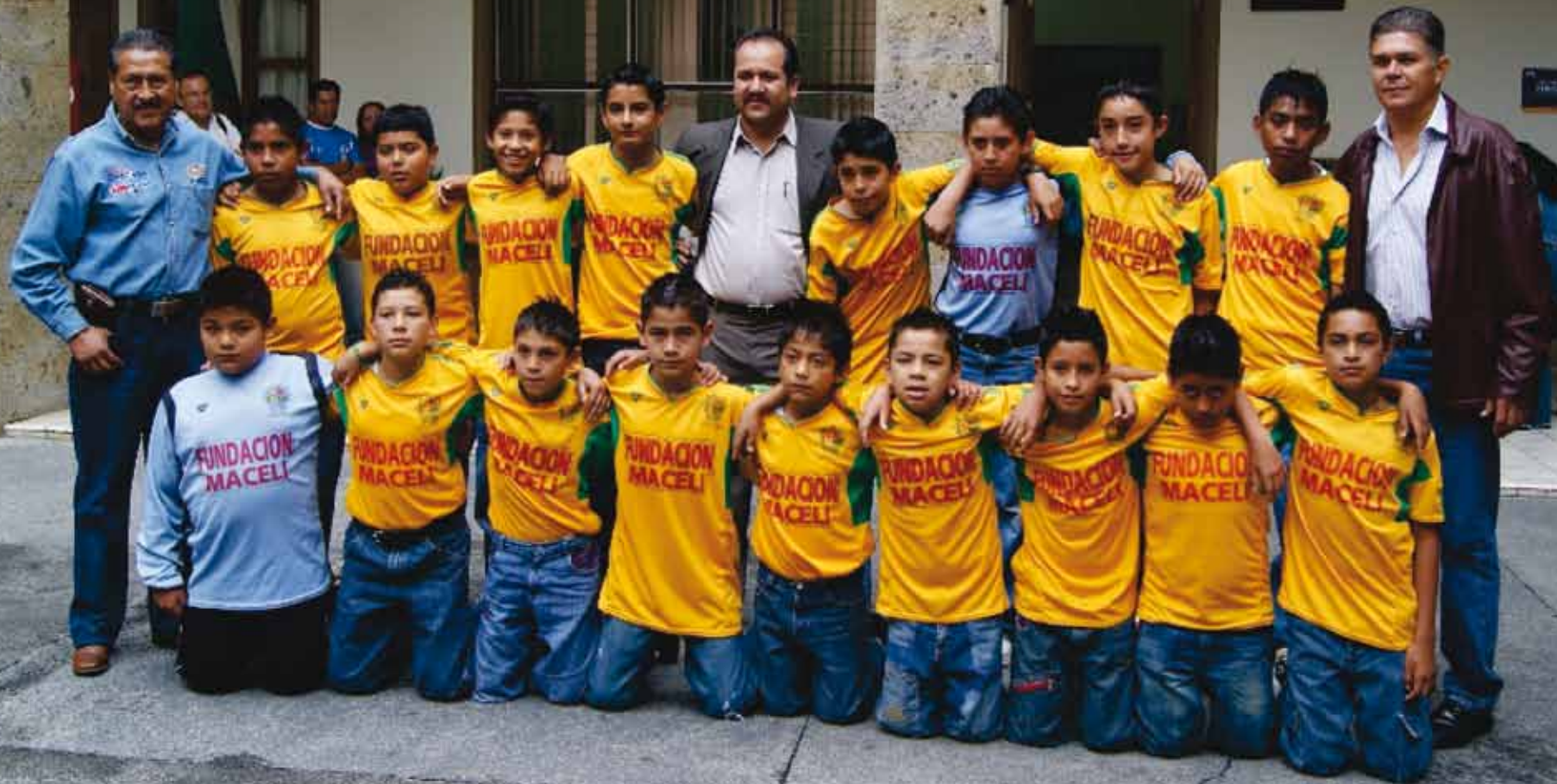
Liga Infantil de Futbol 2010