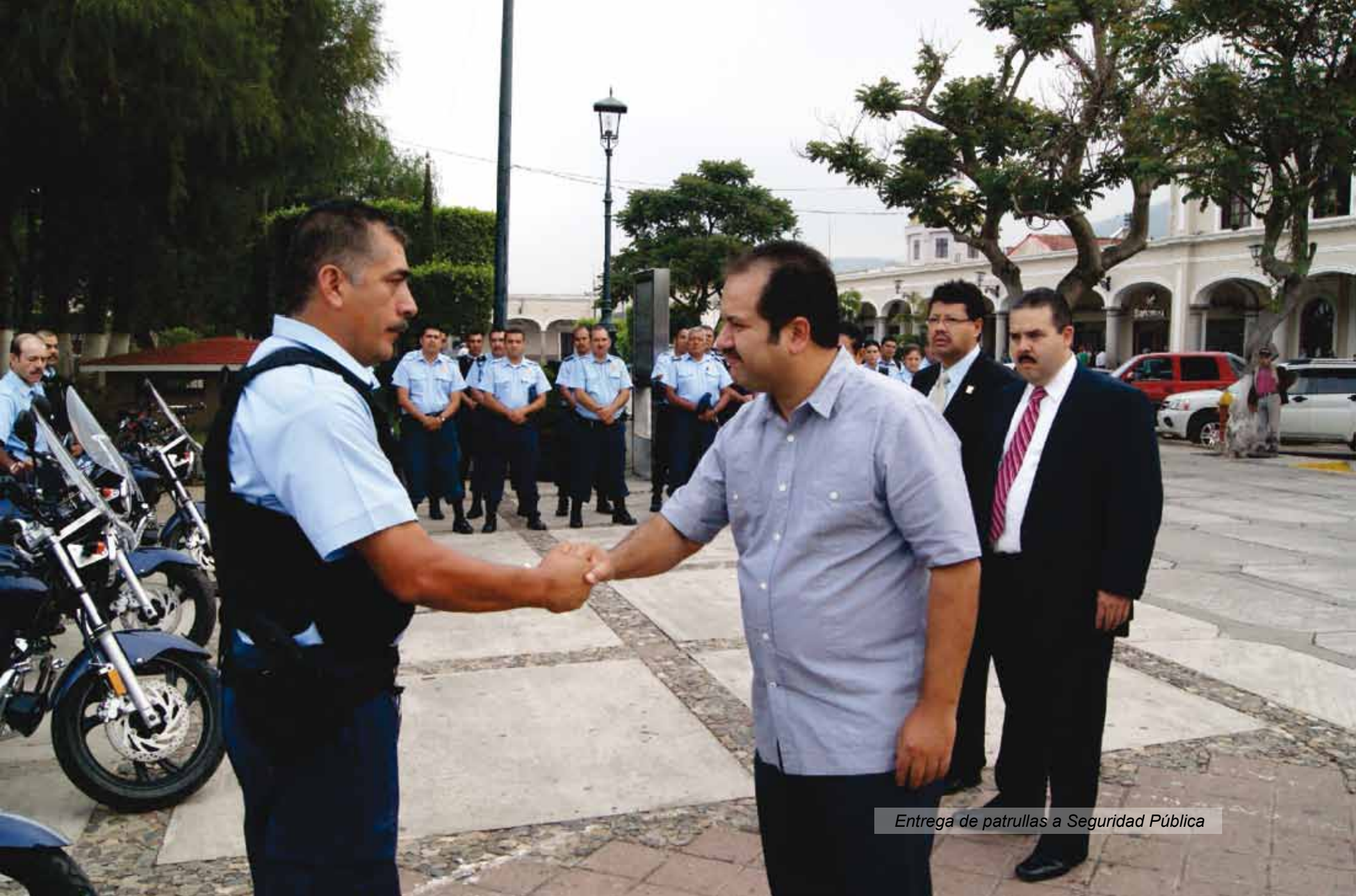
Entrega de patrullas a Seguridad Pública