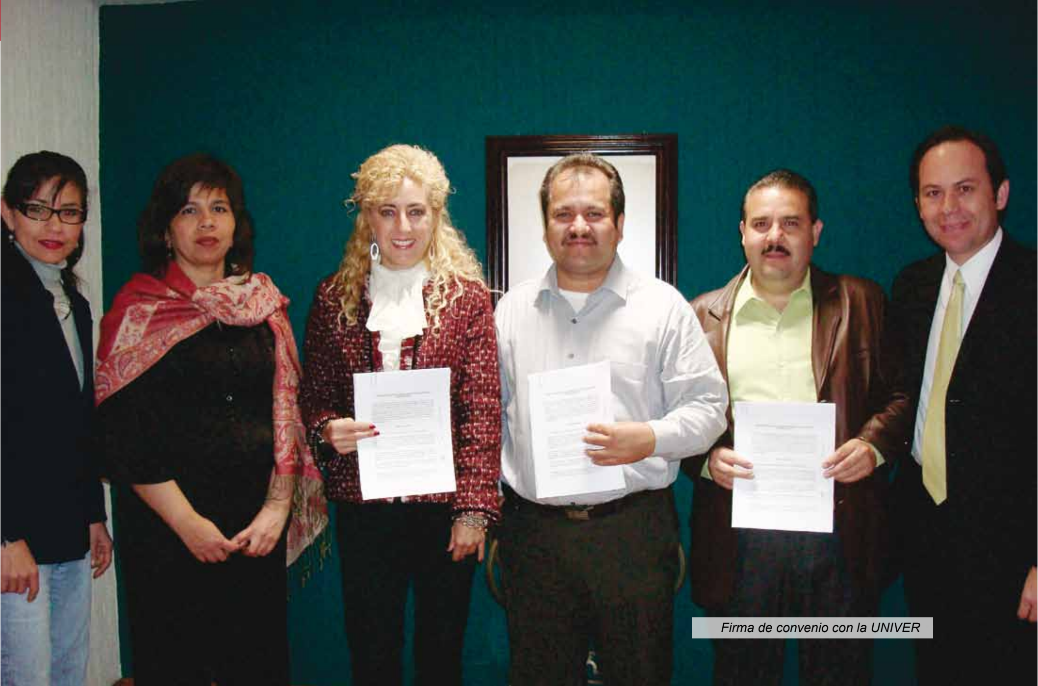
Firma de convenio con la UNIVER