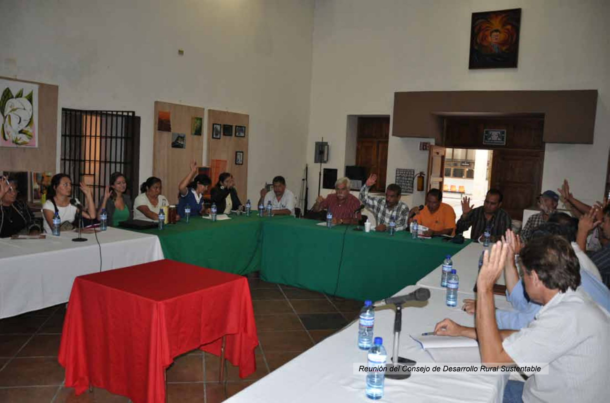
Reunión del Consejo de Desarrollo Rural Sustentable