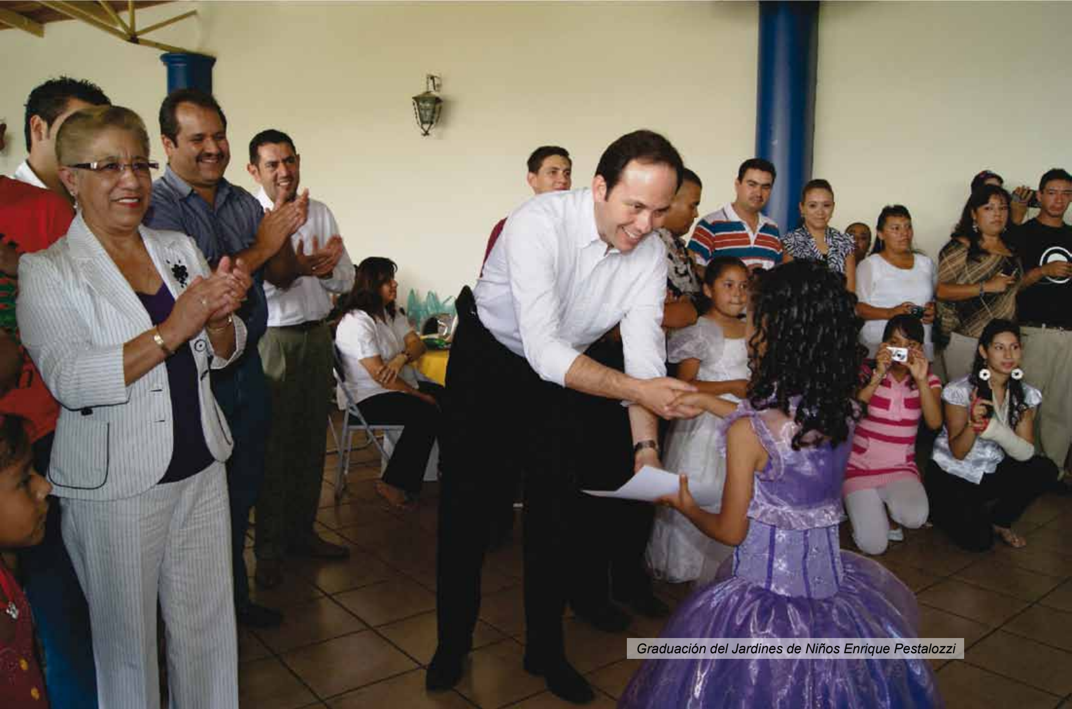
Graduación del Jardines de Niños Enrique Pestalozzi