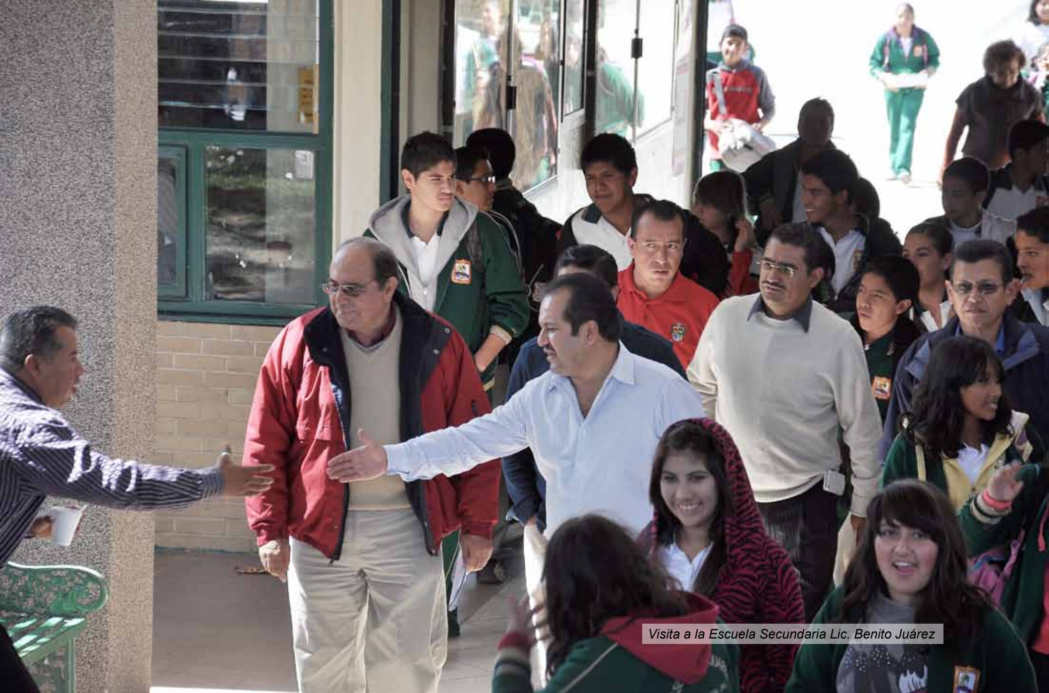
Visita a la Escuela Secundaria Lic. Benito Juárez