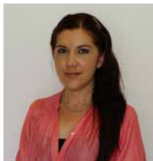
Alejandra Cárdenas Nava Contralora