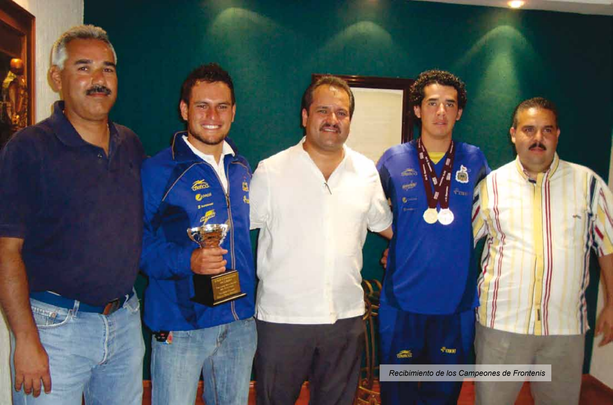
Recibimiento de los Campeones de Frontenis