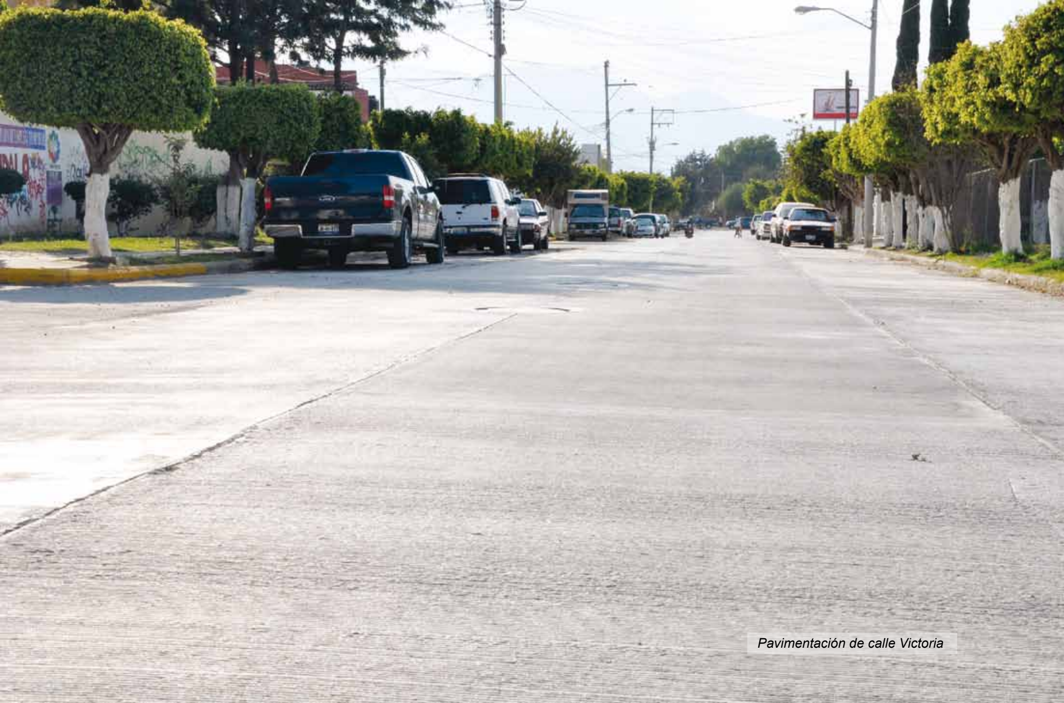
Pavimentación de calle Victoria