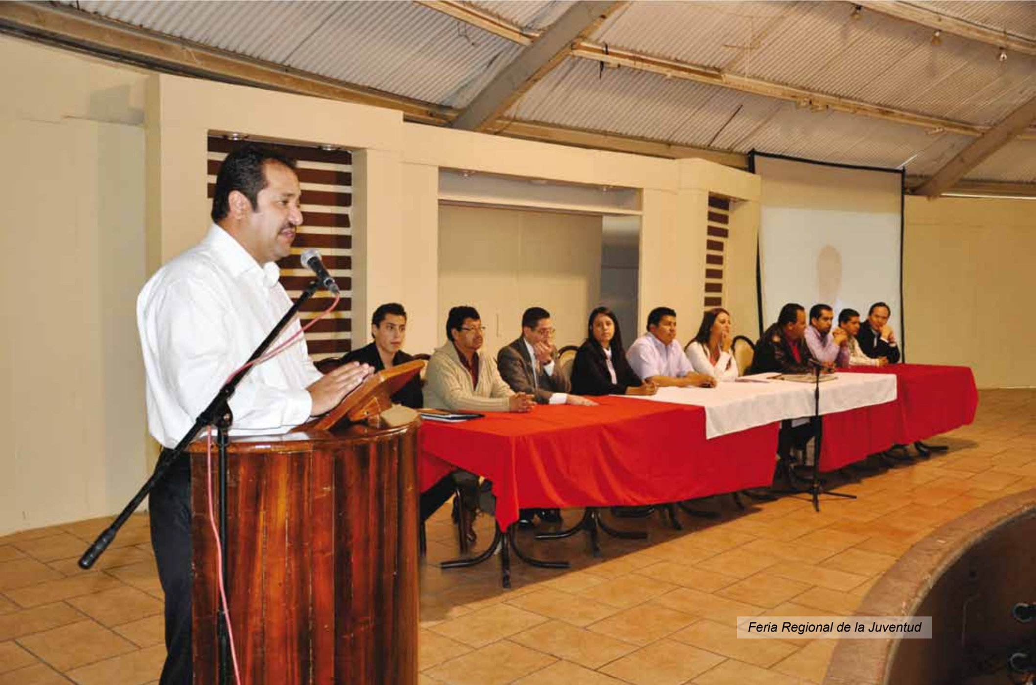
Feria Regional de la Juventud