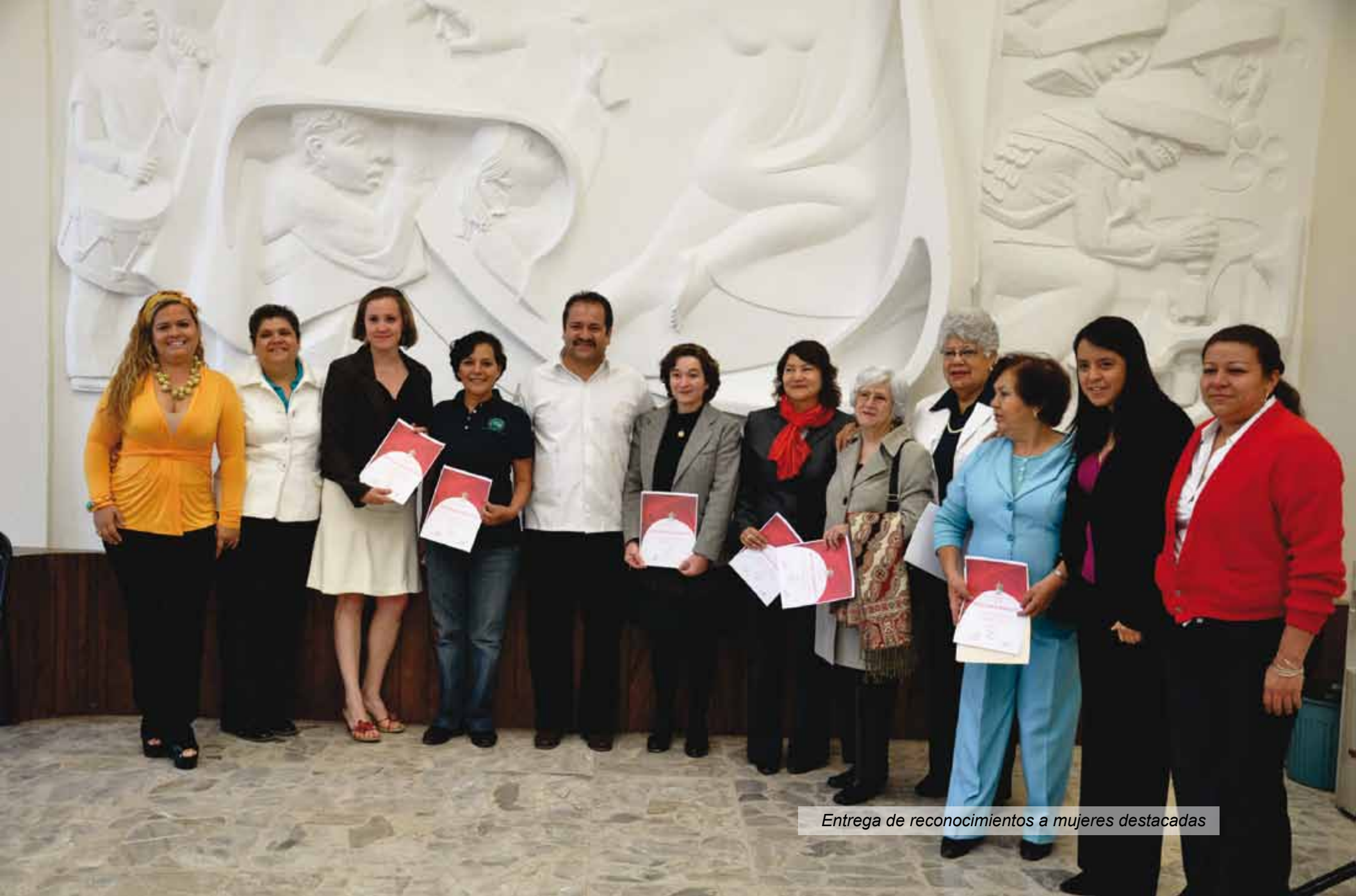
Entrega de reconocimientos a mujeres destacadas