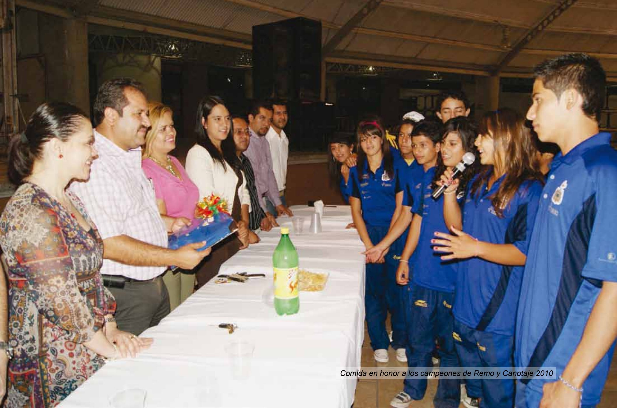
Comida en honor a los campeones de Remo y Canotaje 2010