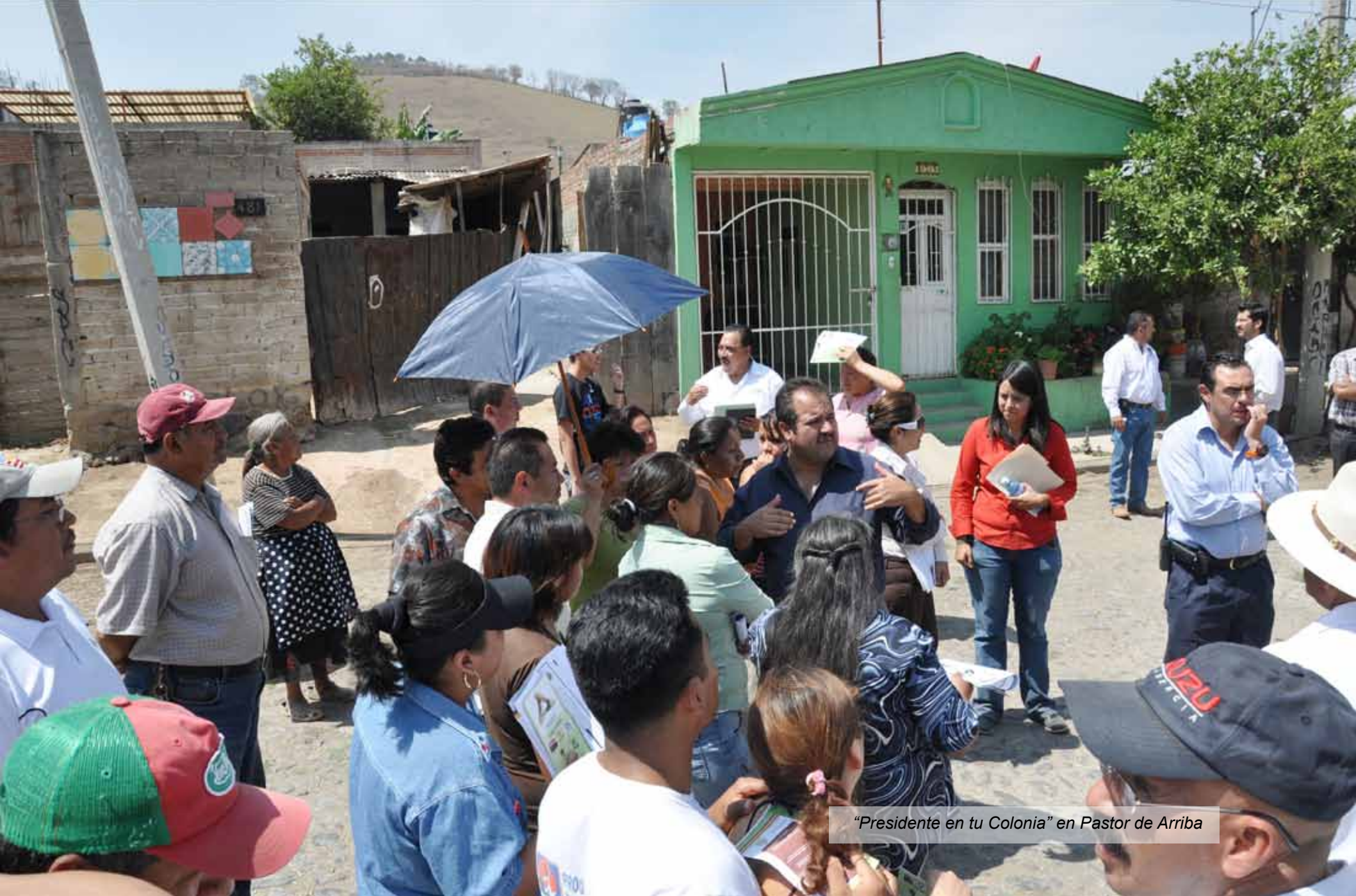
"Presidente en tu Colonia" en Pastor de Arriba