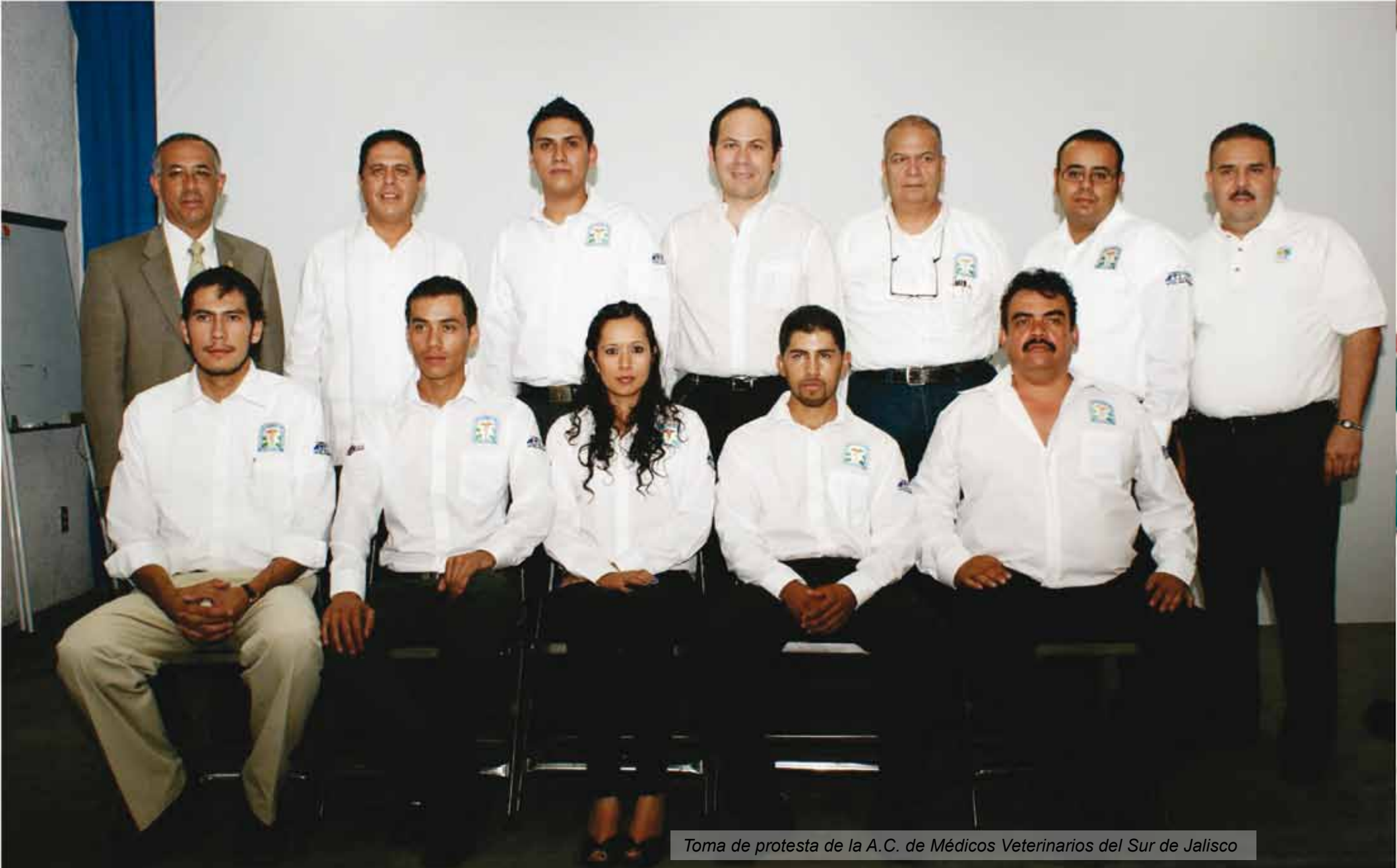
Toma de protesta de la A.C. de Médicos Veterinarios del Sur de Jalisco