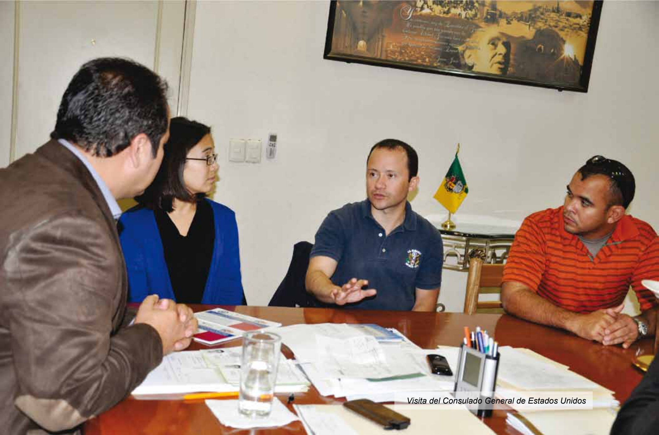
Visita del Consulado General de Estados Unidos