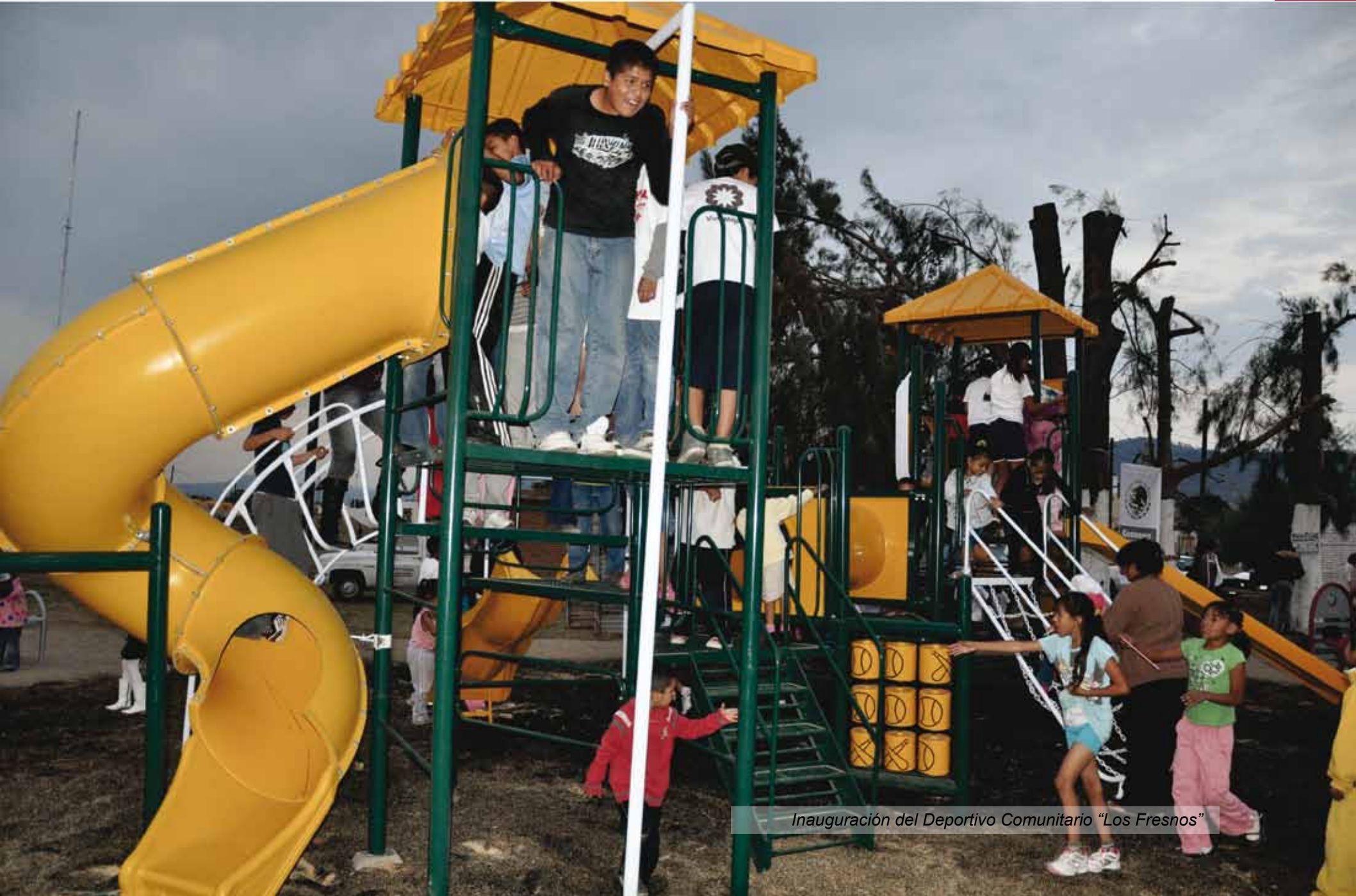
Inauguración del Deportivo Comunitario "Los Fresnos"