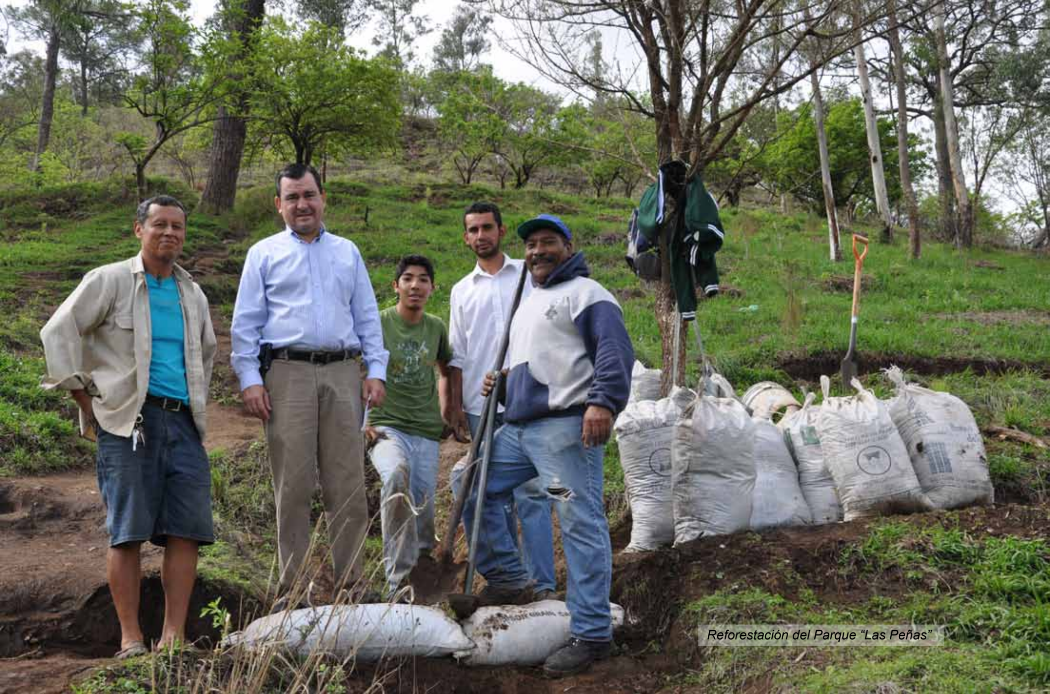
Reforestación del Parque "Las Peñas"