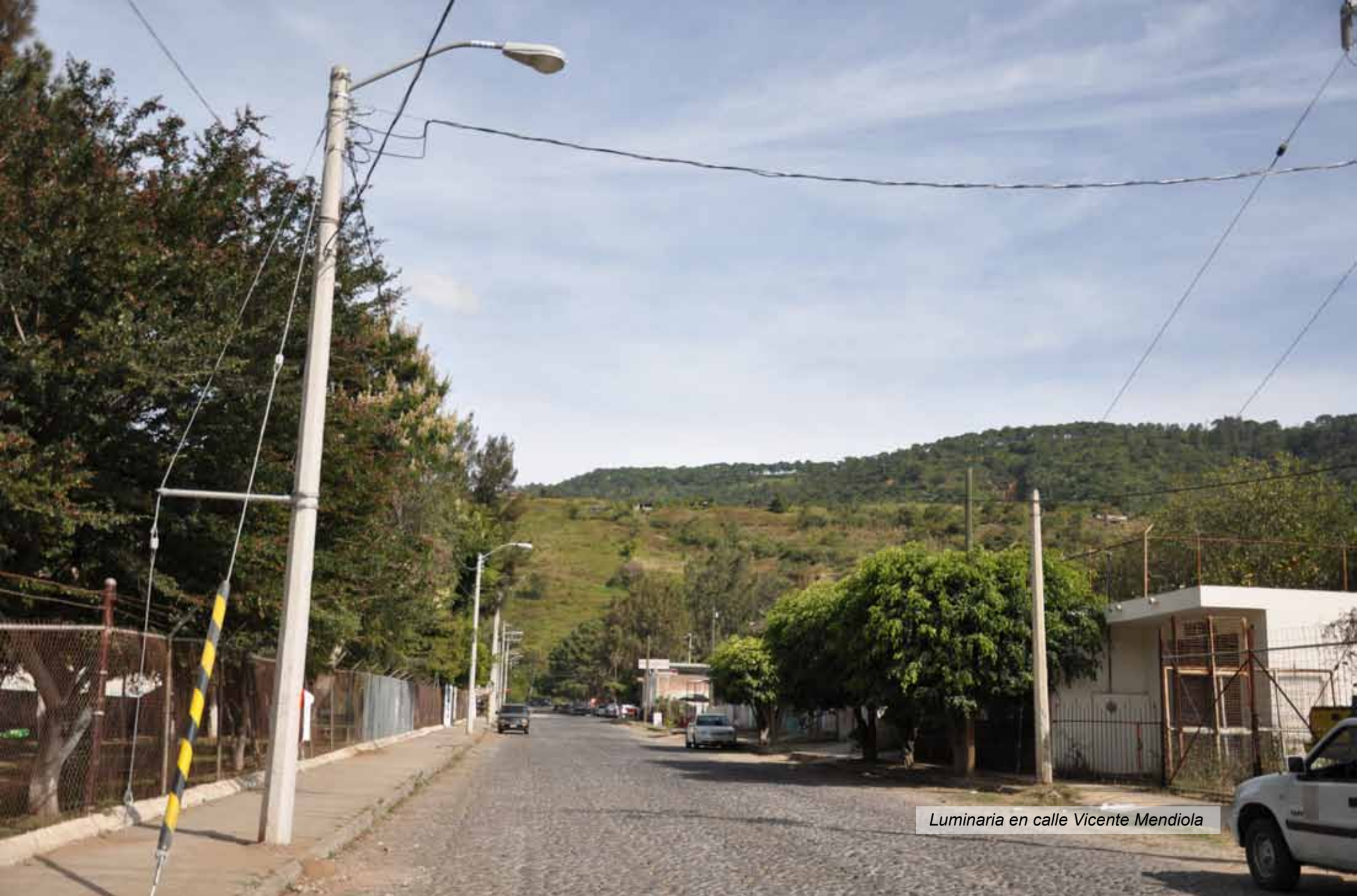
Luminaria en calle Vicente Mendiola