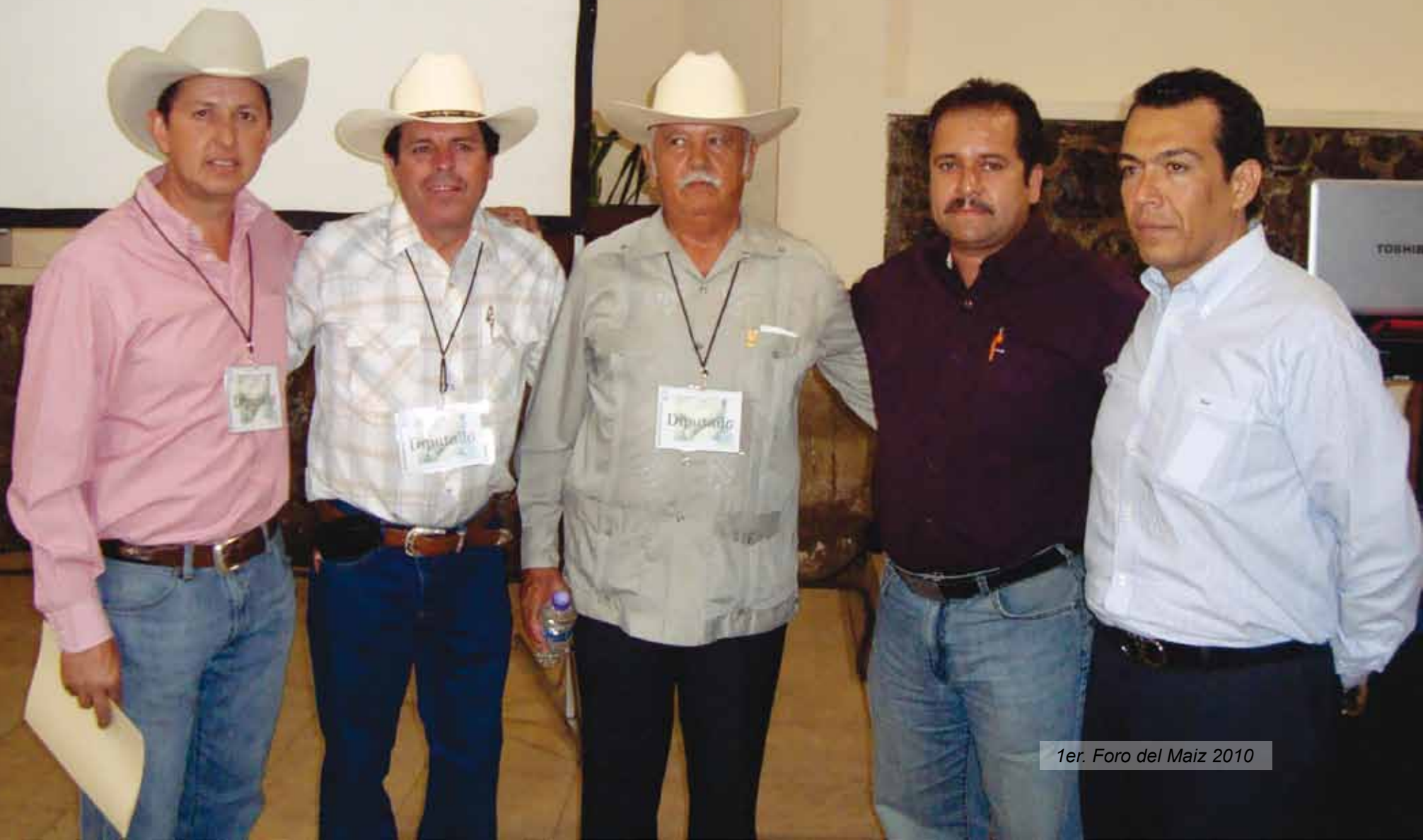
1er. Foro del Maiz 2010