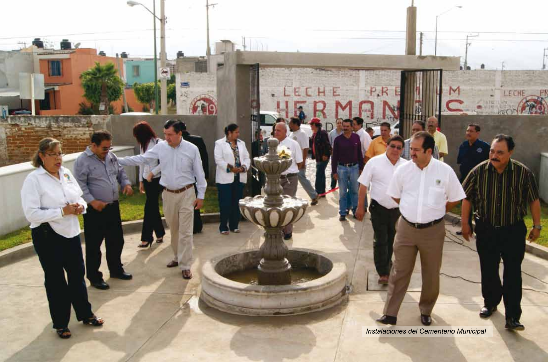
Instalaciones del Cementerio Municipal