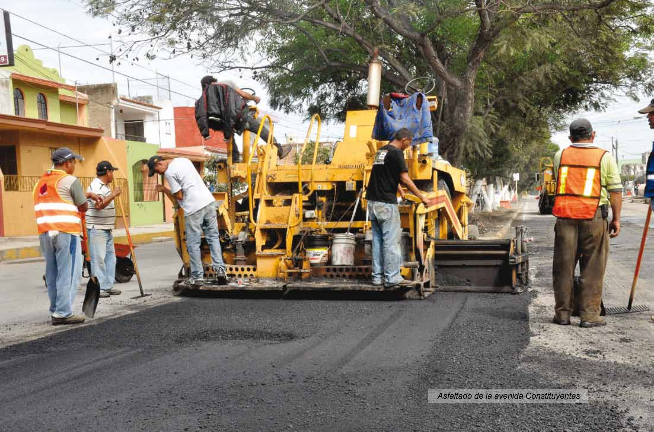
Asfaltado de la avenida Constituyentes