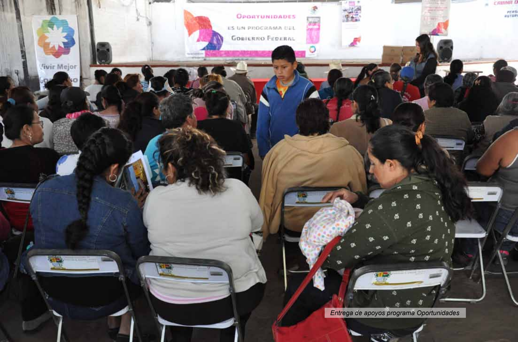
Entrega de apoyos programa Oportunidades