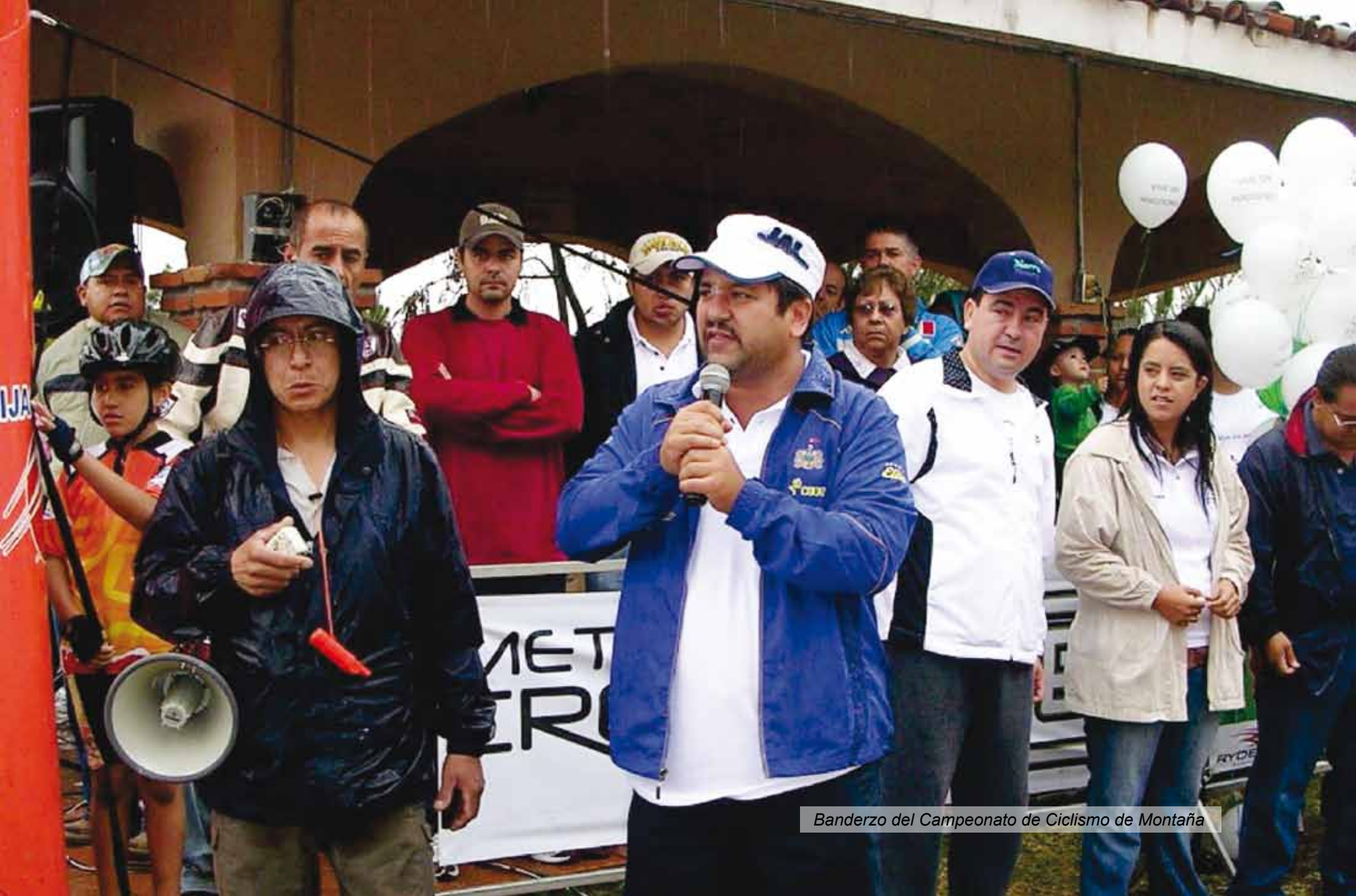
Banderzo del Campeonato de Ciclismo de Montaña