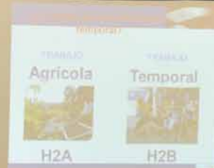
Sesión informativa del Consulado Americano de Guadalajara