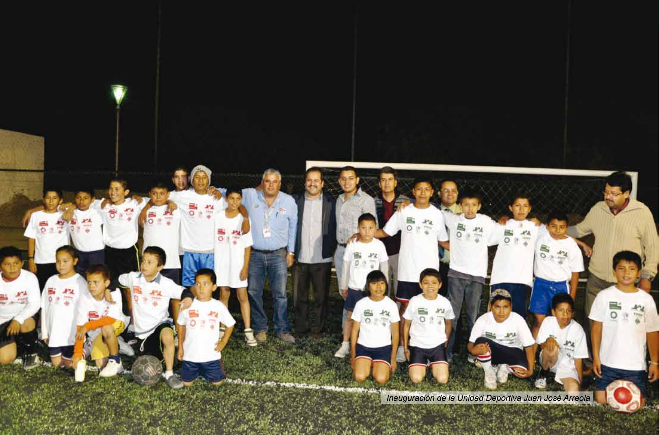
Inauguración de la Unidad Deportiva Juan José Arreola