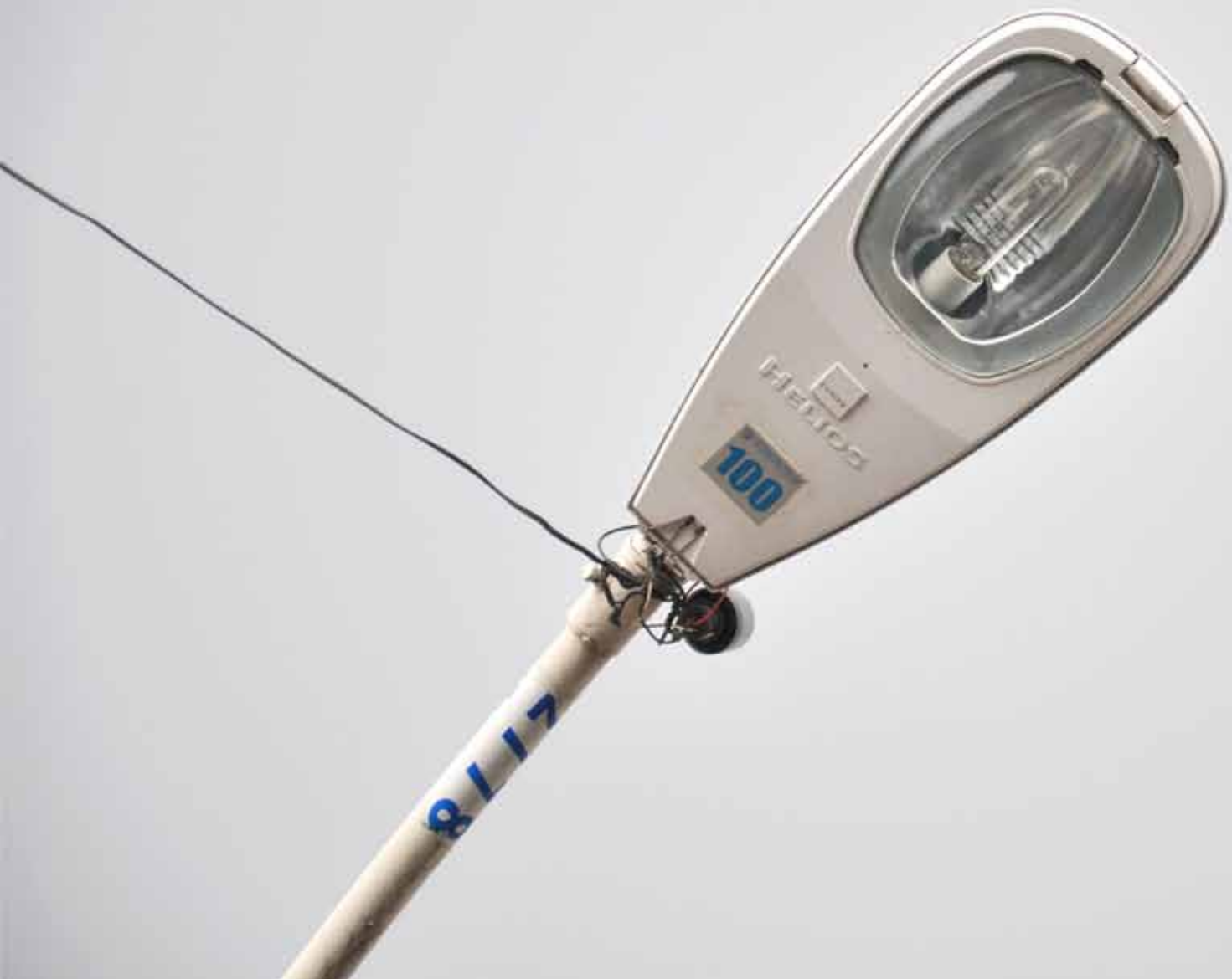
Reposición de luminaria