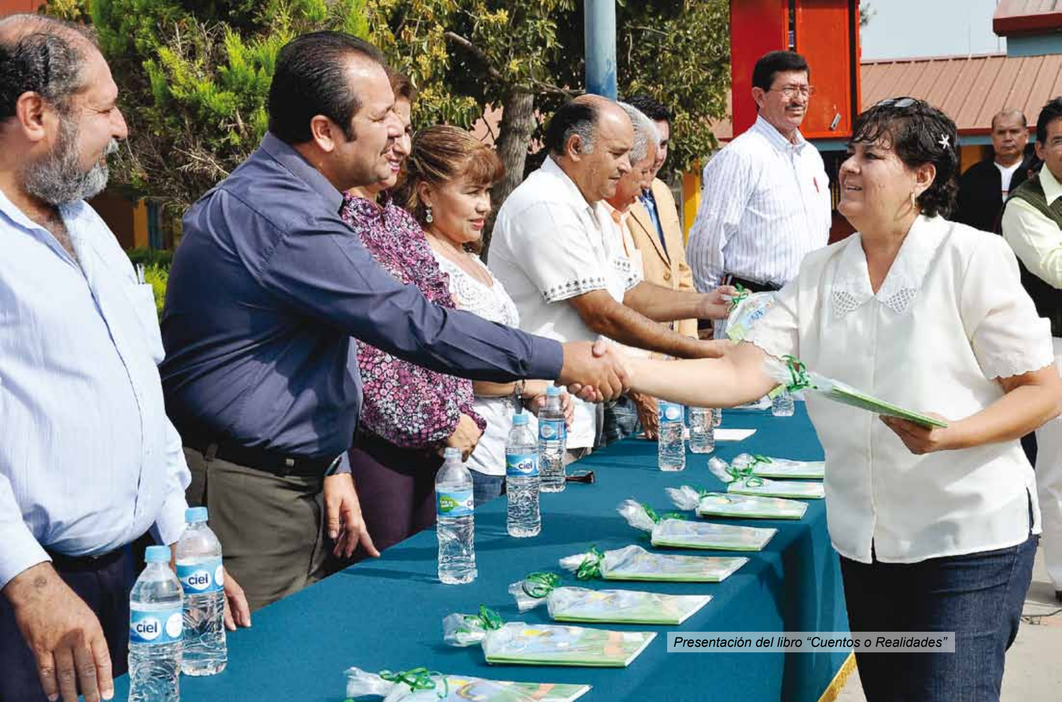
Presentación del libro "Cuentos o Realidades"