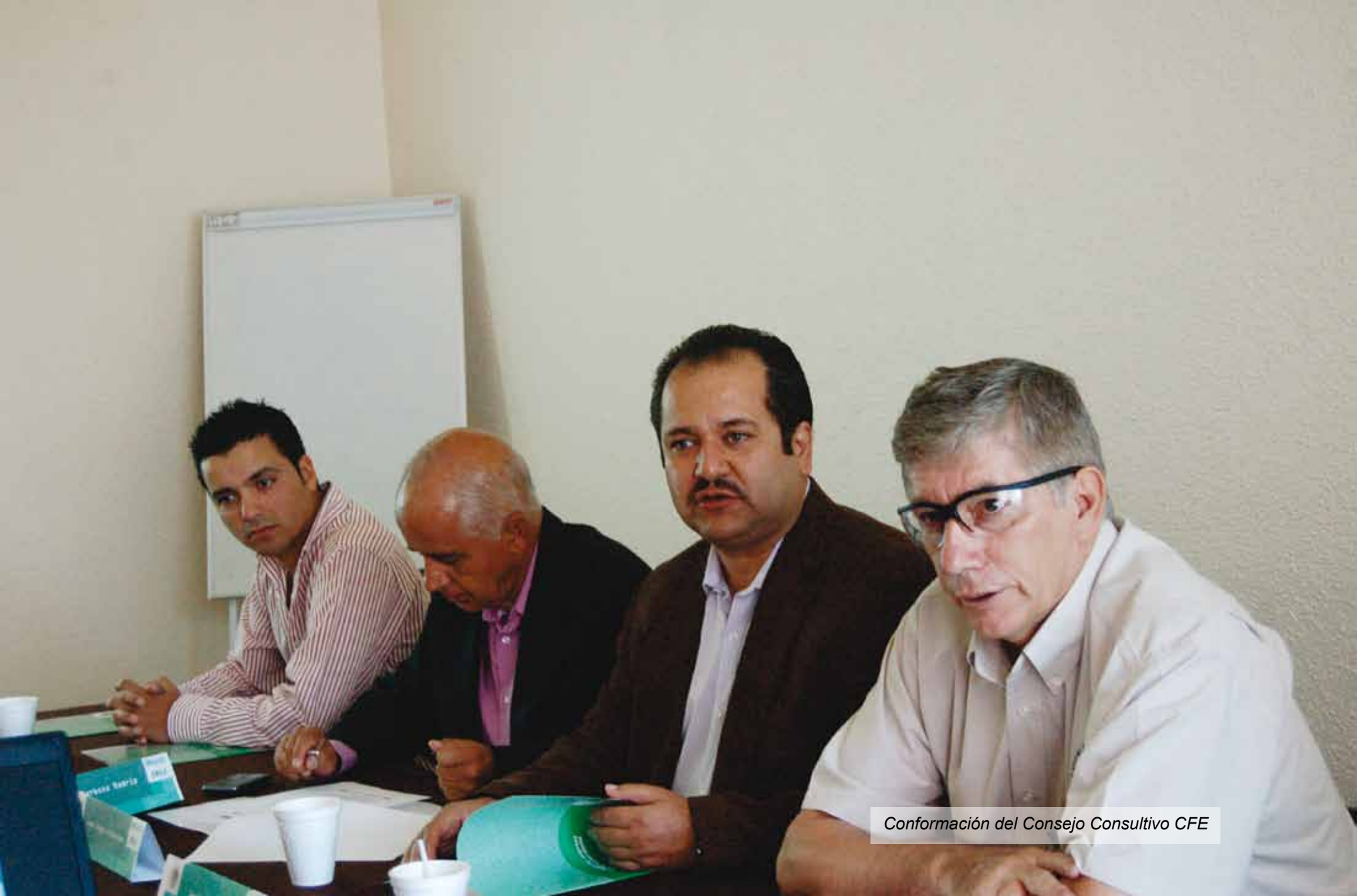
Conformación del Consejo Consultivo CFE