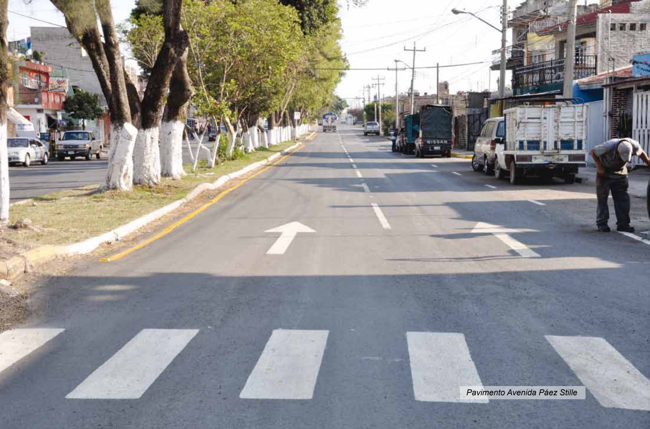
Pavimento Avenida Páez Stille