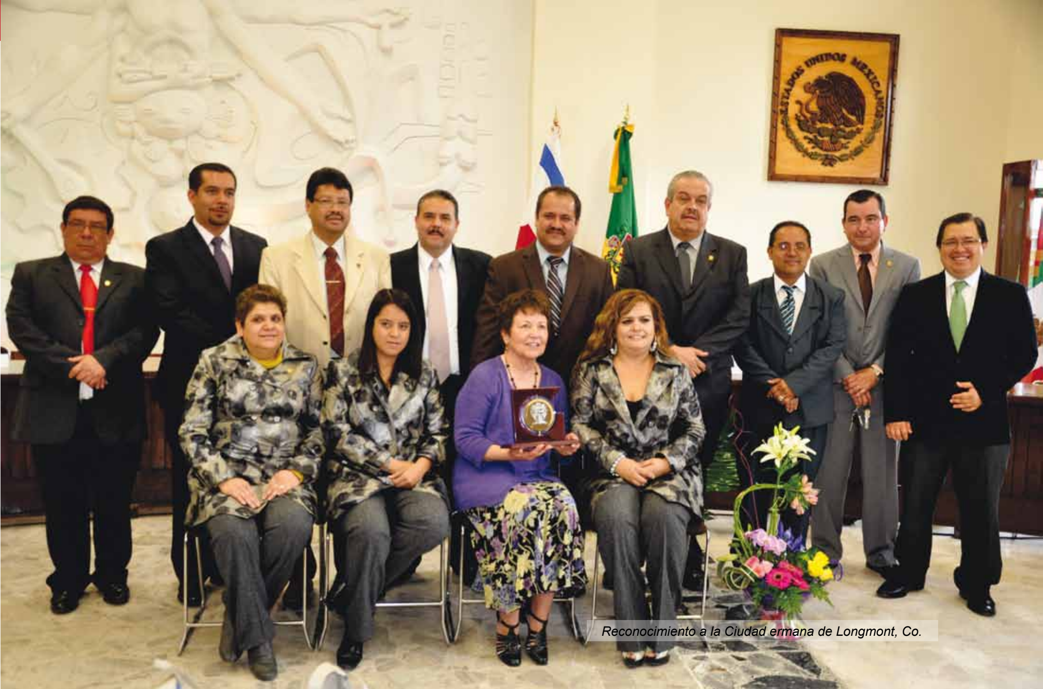
Reconocimiento a la Ciudad hermana de Longmont, Co.