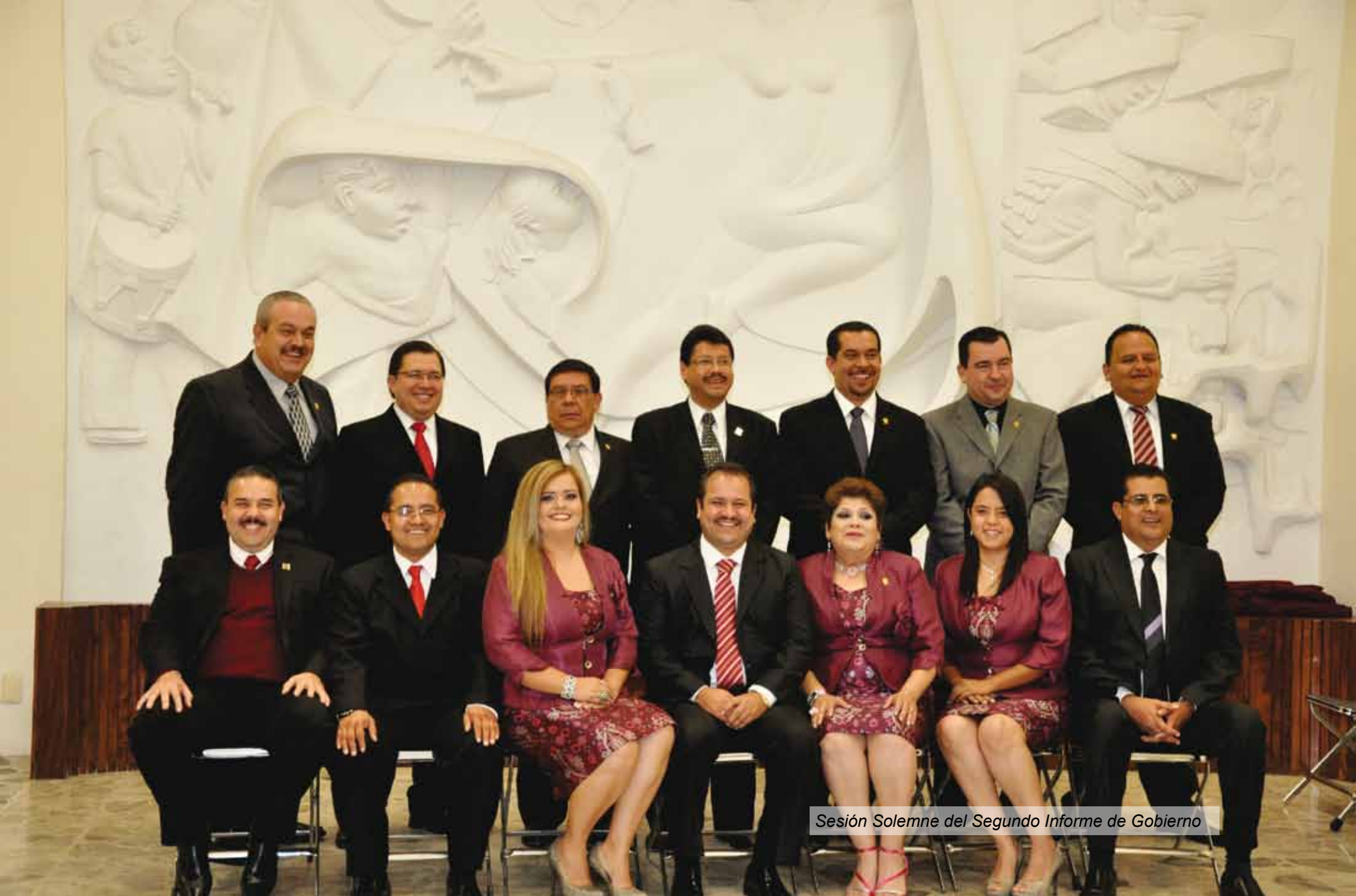
Sesión Solemne del Segundo Informe de Gobierno