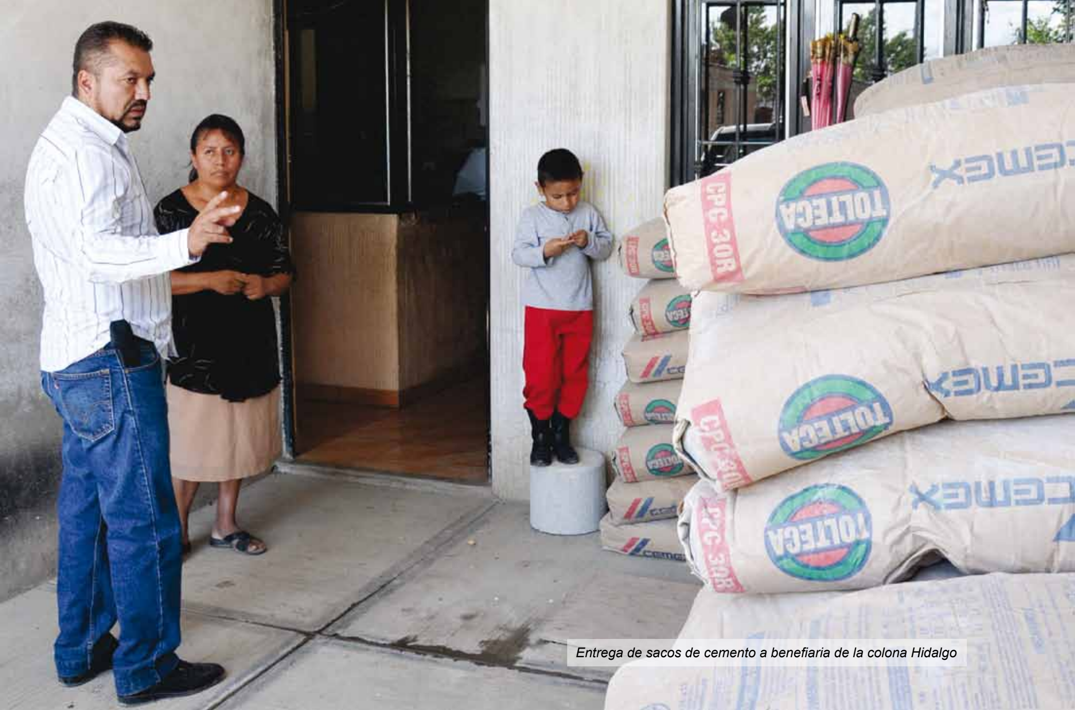
Entrega de sacos de cemento a beneficiaria de la colona Hidalgo