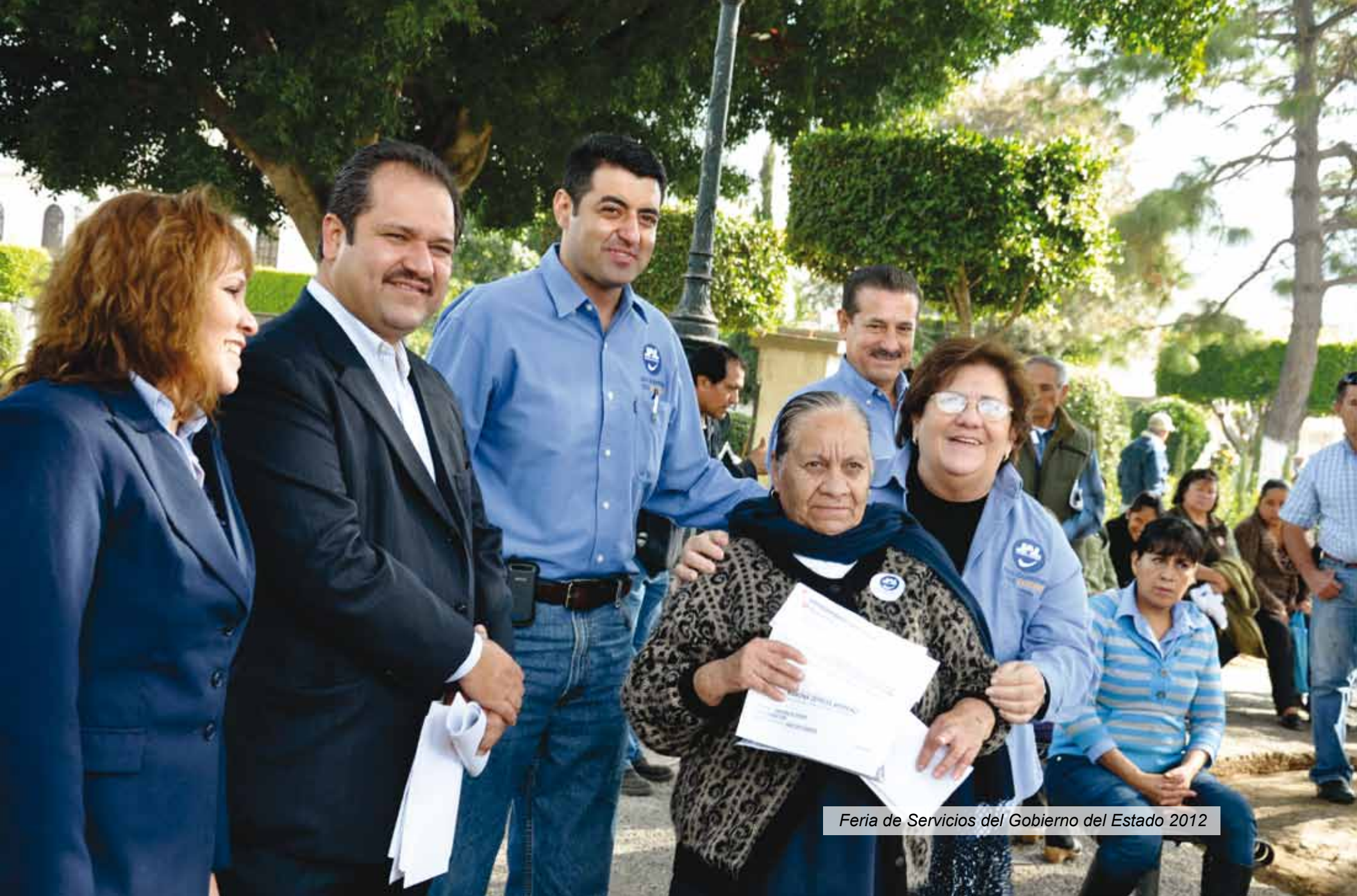
Feria de Servicios del Gobierno del Estado 2012