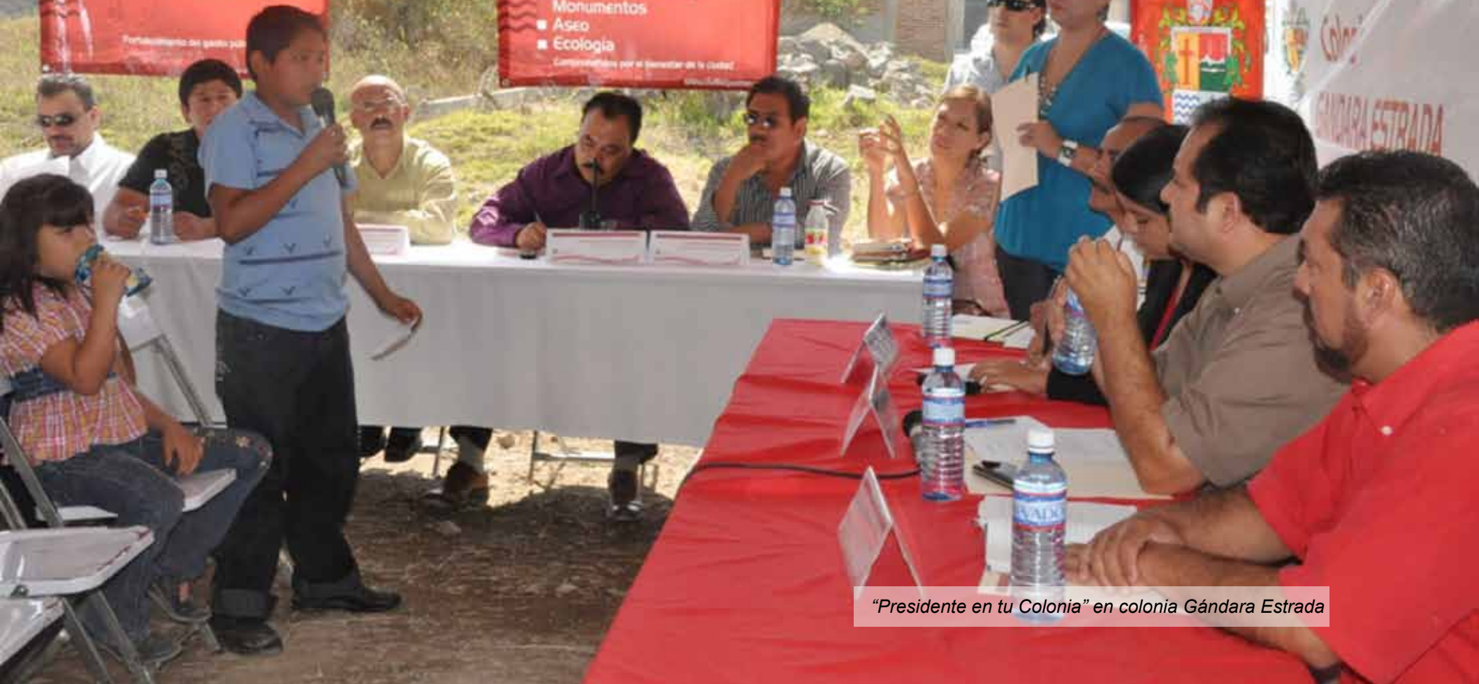
"Presidente en tu Colonia" en colonia Gándara Estrada