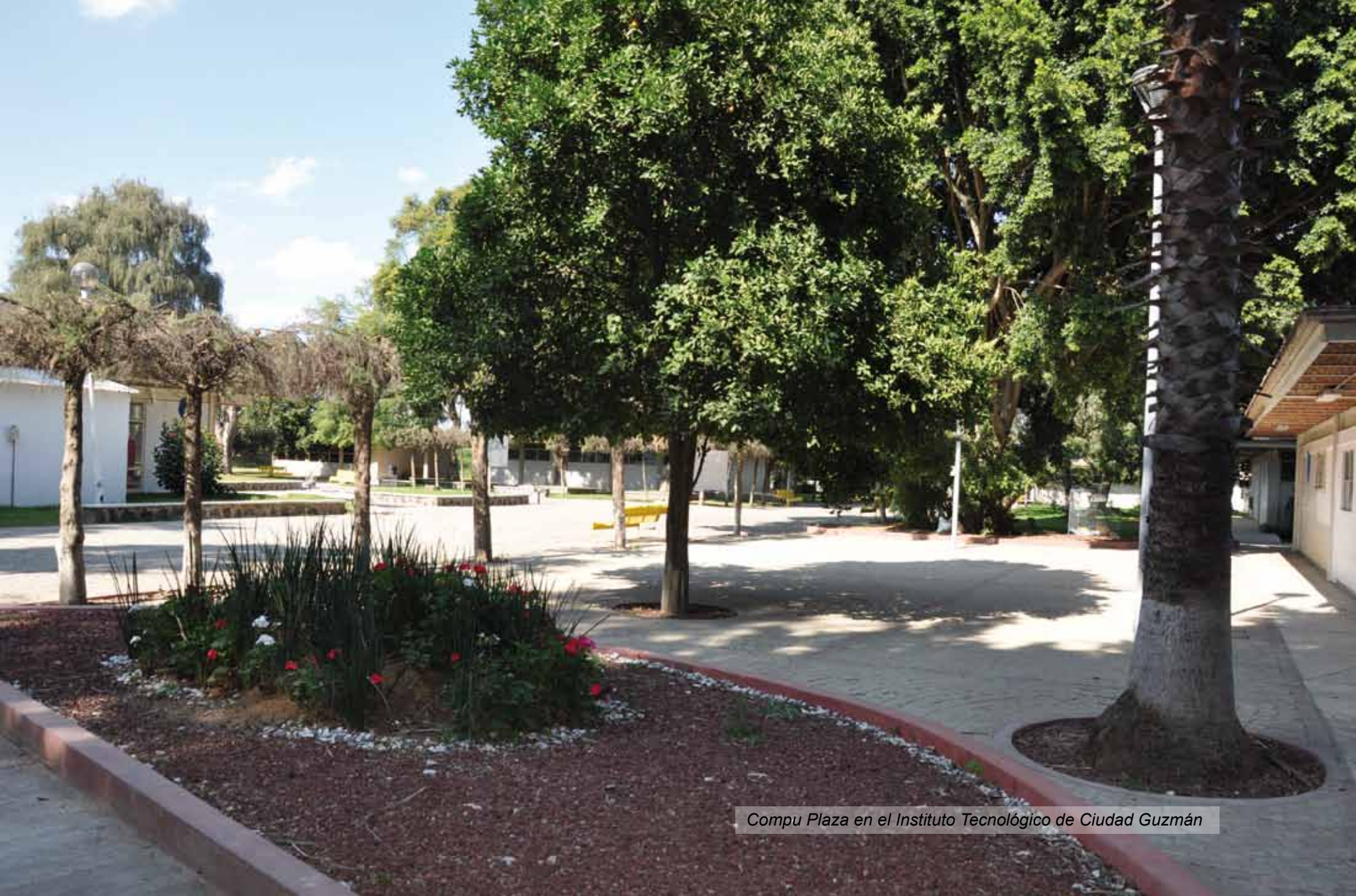
Compu Plaza en el Instituto Tecnológico de Ciudad Guzmán