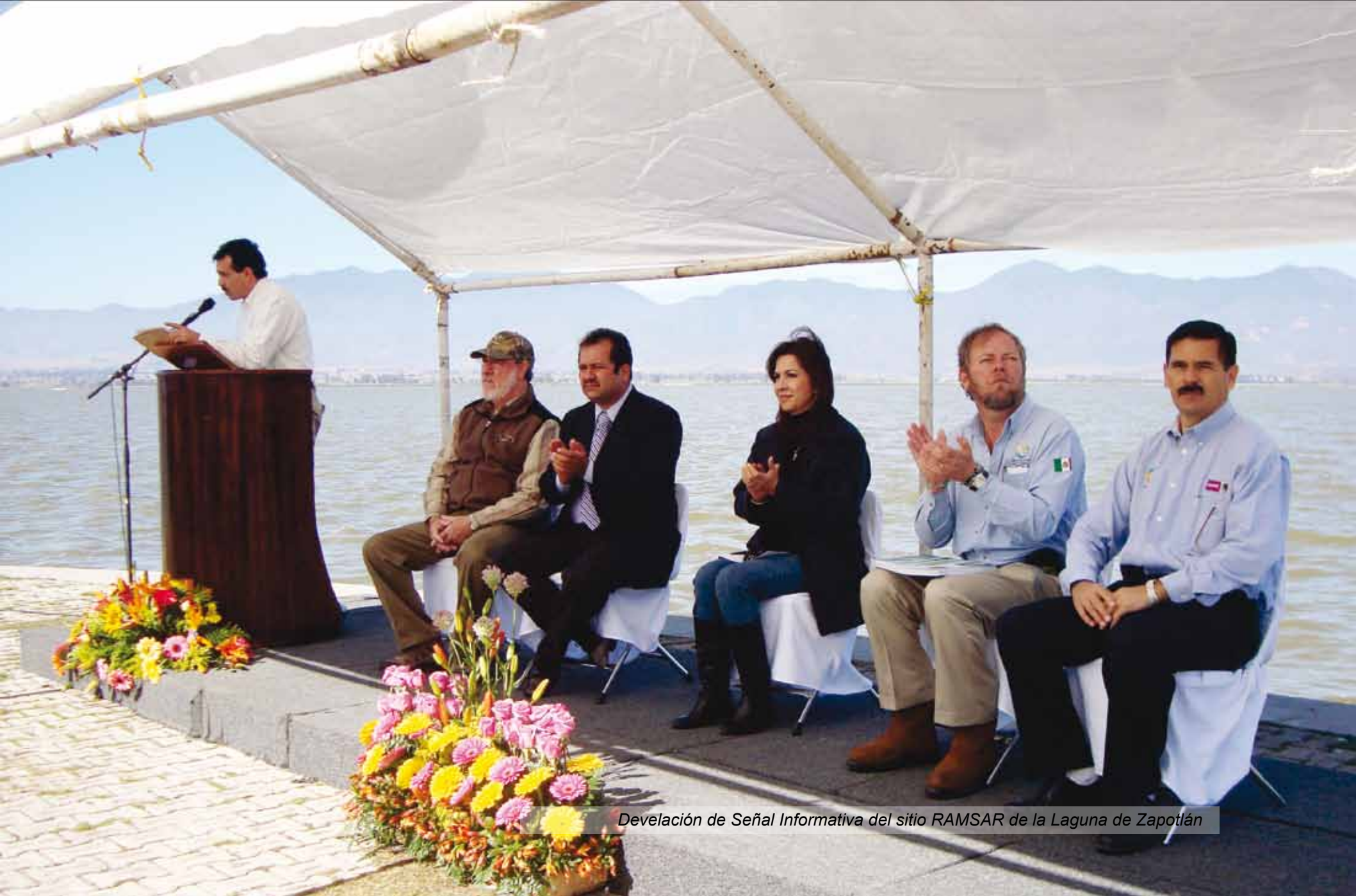
Develación de Señal Informativa del sitio RAMSAR de la Laguna de Zapotlán