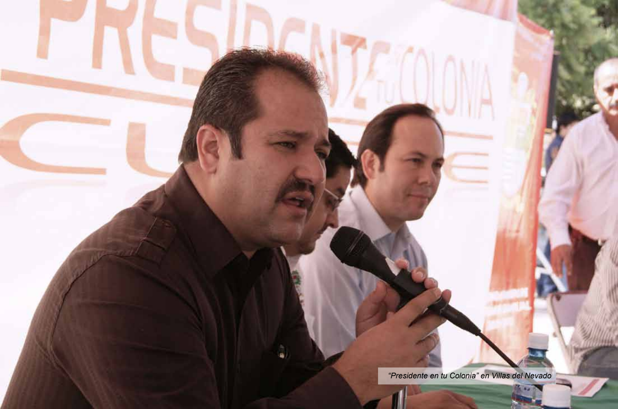
"Presidente en tu Colonia" en Villas del Nevado