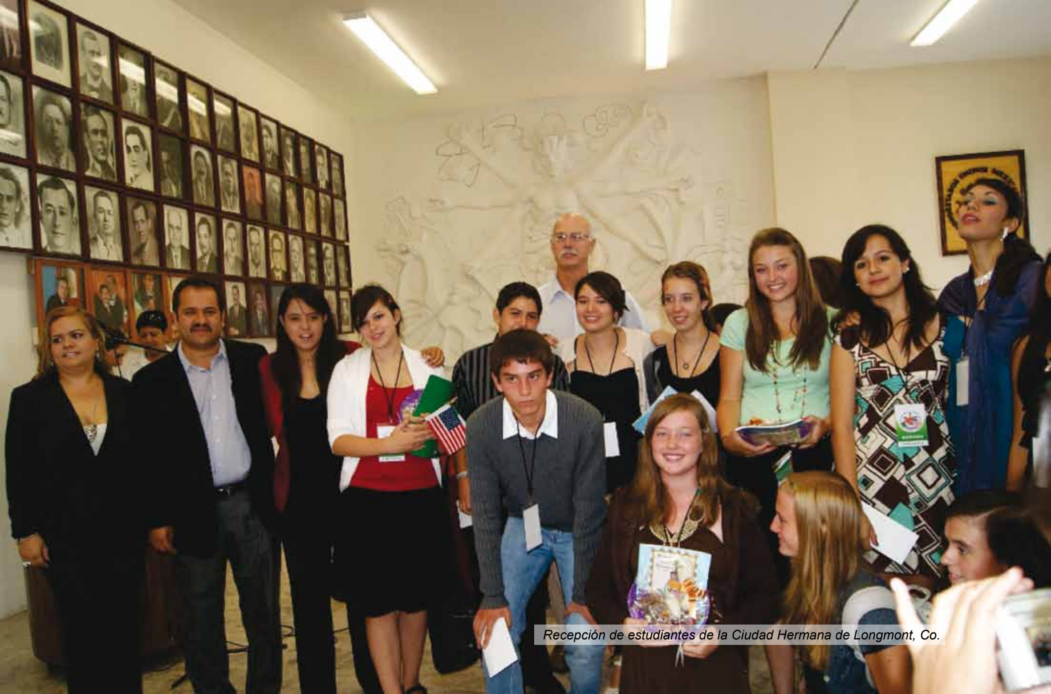
Recepción de estudiantes de la Ciudad Hermana de Longmont, Co.