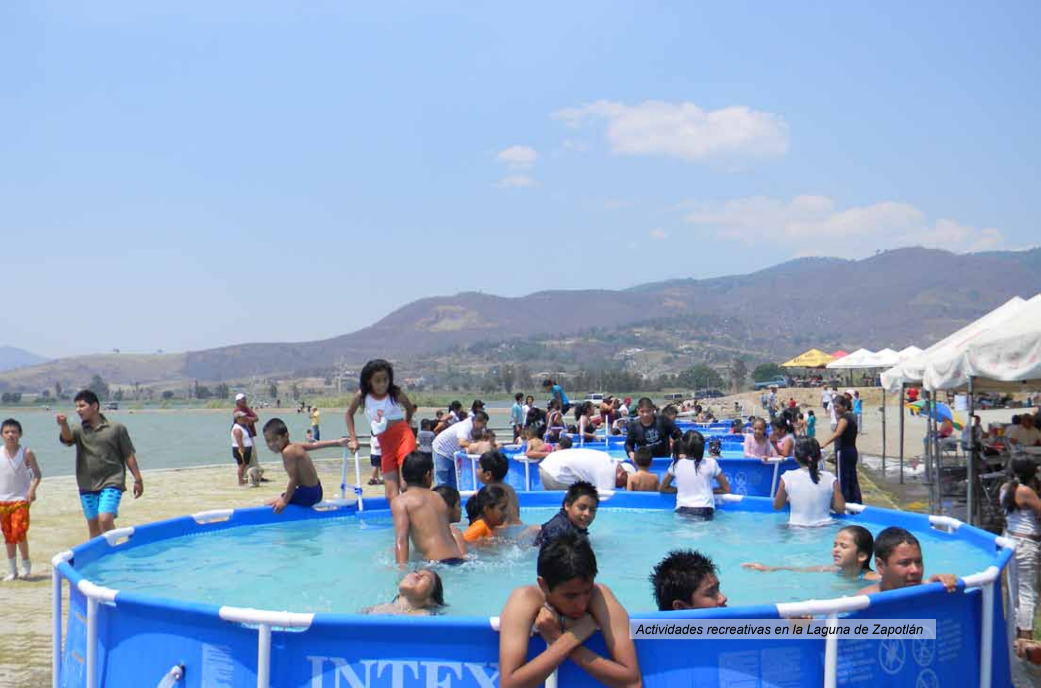
Actividades recreativas en la Laguna de Zapotlán