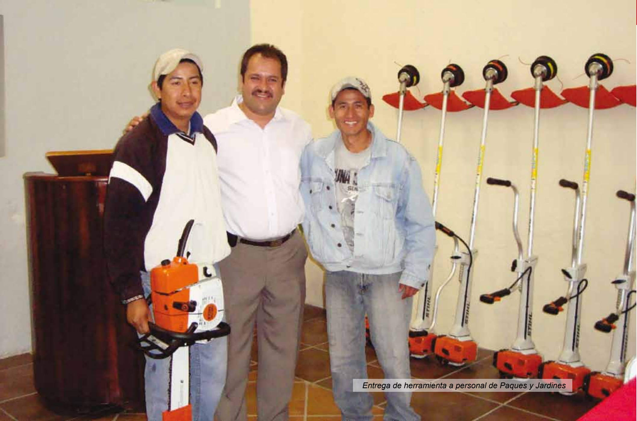
Entrega de herramienta a personal de Paques y Jardines