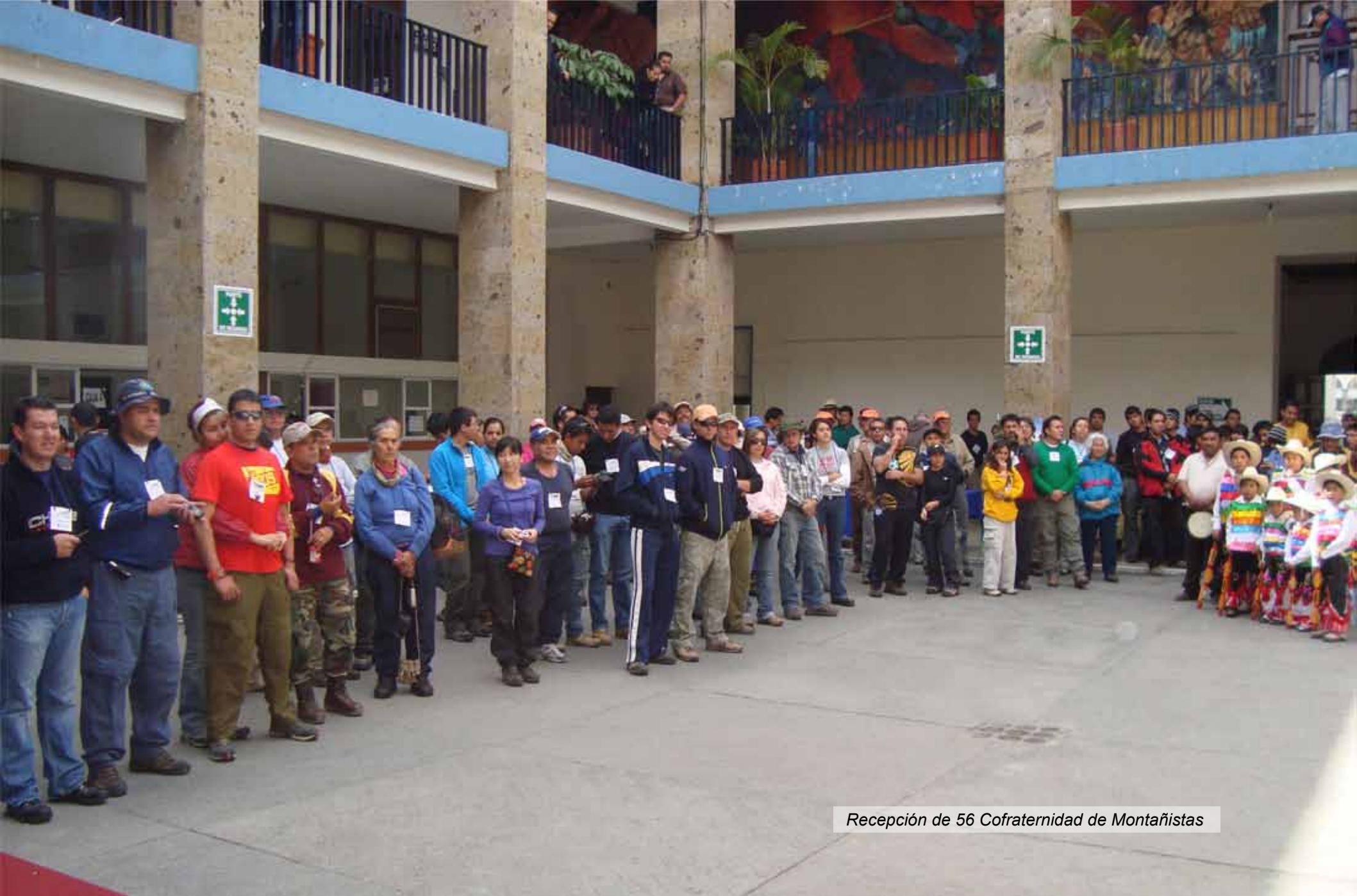
Recepción de 56 Cofraternidad de Montañistas