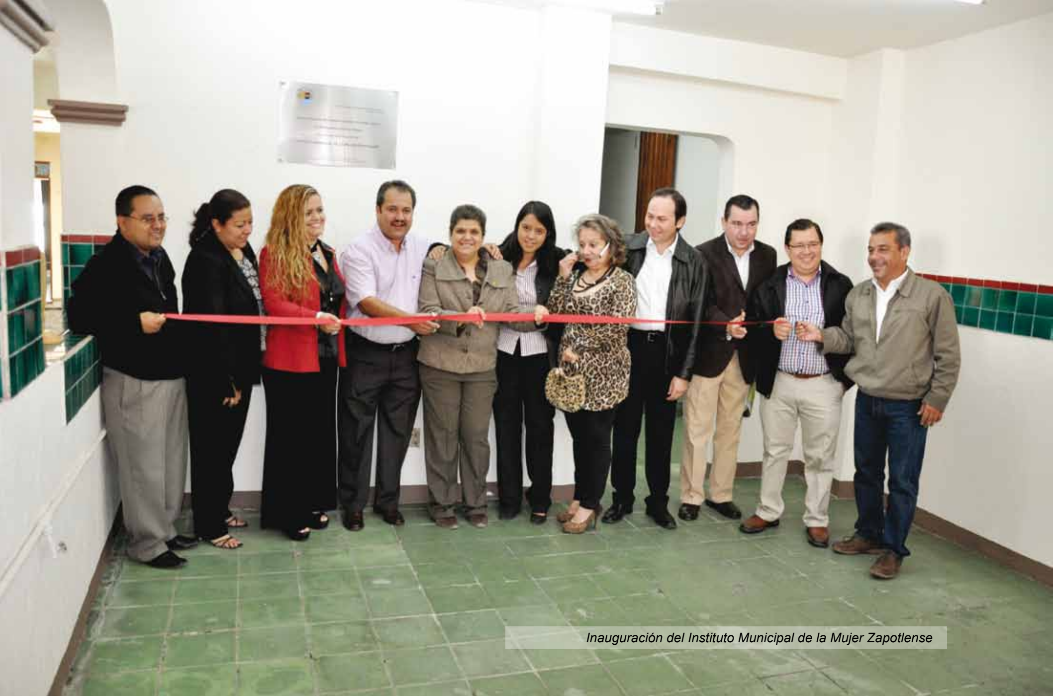
Inauguración del Instituto Municipal de la Mujer Zapotlense