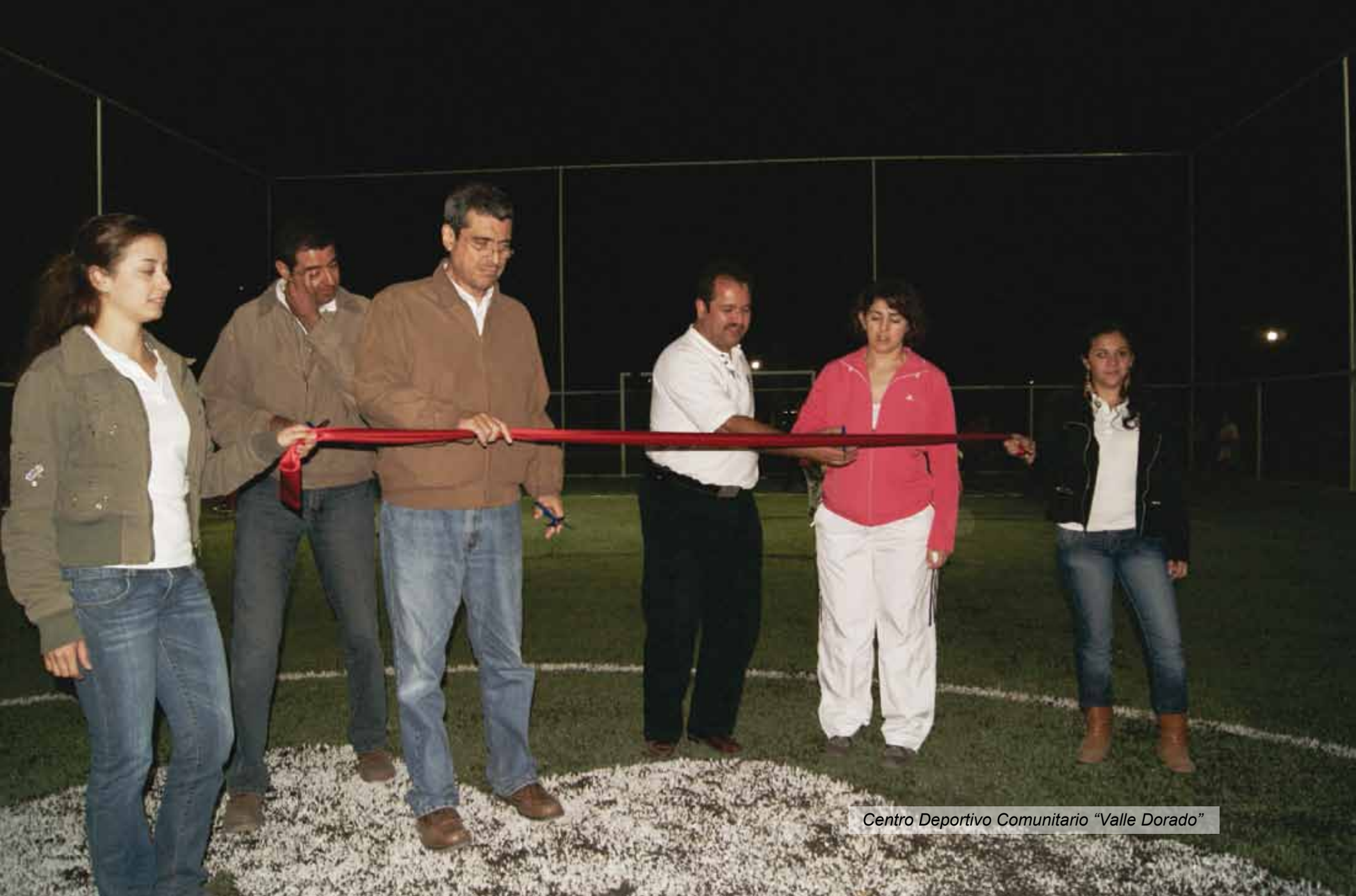
Centro Deportivo Comunitario "Valle Dorado"